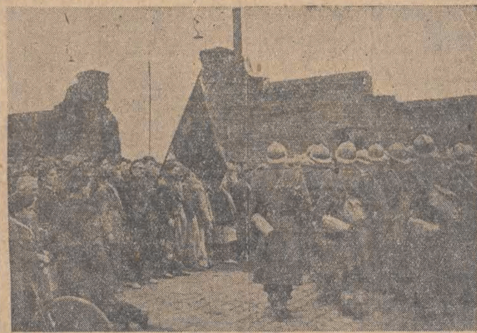
Strajkujący górnicy Zagłębia Nord we Francji — rozwinięty czerwony sztandar — w milczeniu i z powagą — zagradzają wejście do kopalni uzbrojonym żołdakom milicji Mocha. Zdjęcie dokonane zostało na chwilę przed stakiem Marokańczyków na kopalnię.