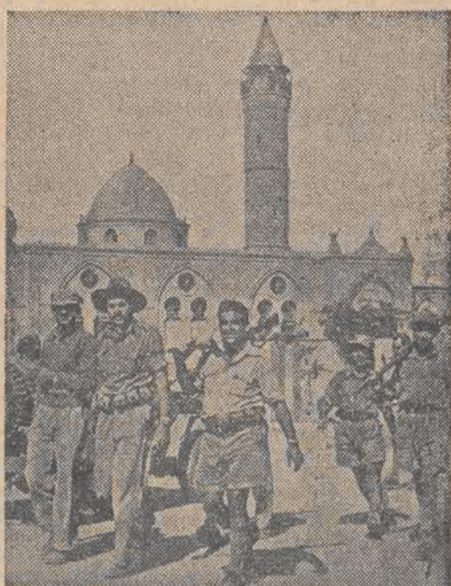
Oddziały żydowskie po zawieszeniu działań wojennych demonstrują na cześć pokoju na ulicach miasta Beersheba.