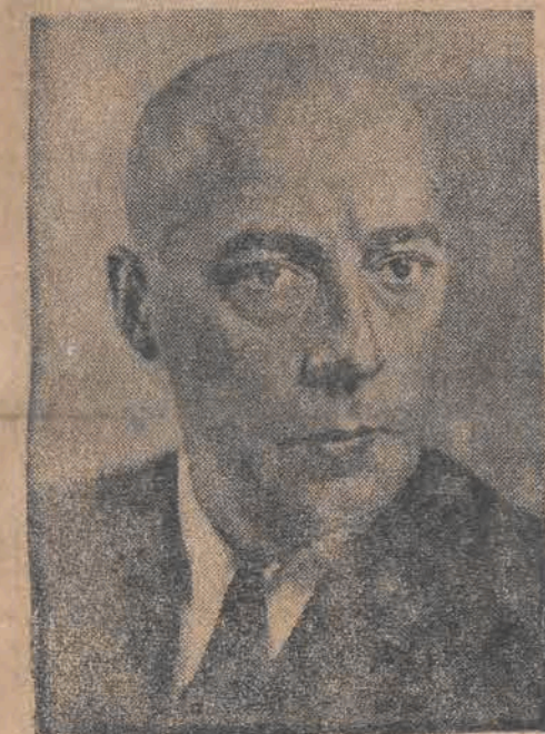
Obywateli Prezydencie! Mieli Goście!

Do zebranych wygłosił przemówienie Premier tow. J. Cyrankiewicz oraz Prezydent Ob. Bolesław Bierut.