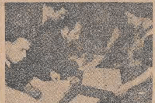
Komisja wyborcza urządza...

Największe kredyty w przemyśle włókienniczym otrzyma przemysł bawelniany. Przewiduje się więc wydatkowanie 45 mil. zł. na przebudowę przedziałni w PZPB Nr 1 (Kiszę Młyn), której koszt ogólny wyniesie 90 mil. zł. 21.000 wrzecion najnowszego typu zamówiono już zagranicą dla tej przedziałni.