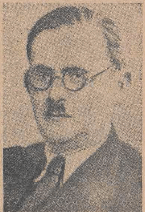
Min. Przemysłu i Handlu tow. Hilary Minc podpisał w Moskwie umowę gospodarczą z ZSRR.

Gomułkę i ministra przemysłu i handlu Hilarego Minca, którzy po powrocie z Moskwy złożyli mu sprawozdanie o wyniku pertraktacji i zawartych umowach gospodarczych między Polską a ZSRR.