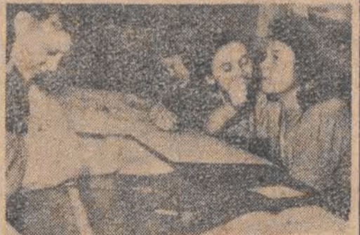
Chwila namysłu. — Trzeba wybrać najlepszych...