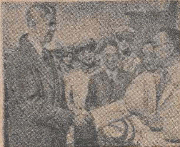
Amerykański „doradca“ Czang-Kai-Szeka, gen. Wedemeyer, uśmiecha się rozkosznie do równie zadowolonych przedstawicieli Kuomintangu. Obawiamy się, że nie na zdjęciu miny tego „grona“ nie są tak wesołe, mimo bowiem dostaw broni z USA watahy Czang-Kai-Szeka są metodycznie gromione przez chińską armię ludową, zagrożając obecnie już nawet Nankinowi.