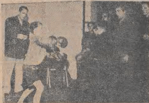
„Demokratyczni“ wykładowcy z akademii gen. Clay'a nie tylko kształcą i pouczają starego Schumachera, ale również usiłują „szkolić“ t. zw. młody narybek. W ramach tego „programu wychowawczego“ uczą przede wszystkim — bić. (Na razie — w rękawicach bokserskich).