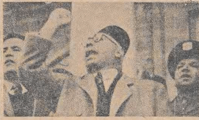
„Przyjaźń 70 milionów Arabów jest ważniejsza dla Stanów Zjednoczonych, niż los kilkuset tysięcy Żydów“, to też nie bez „szczerzej wiedzy“ amerykańskich kół wojskowo-politycznych „burzą się“ Arabowie przeciw podziałowi Palestyny...