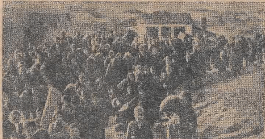
Na wieść o zbliżającym się froncie gen. Marcosa ludność grecka ze wschodniej Tracji, zachodniej Macedonii i innych terenów przyfrontowych przenosi się tłumnie na tereny wyzwolone przez oddziały armii demokratycznej.