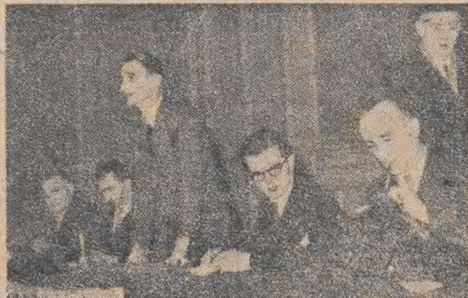
Na zdjęciu — biuro francuskiej „organizacji“ „Force Ouvrière“. Wprowadzie „Force Ouvrière“ tłumaczy się „Siła Robotnicza“, w tym wypadku jednak „force“ oznacza nie tyle „siłę“ ile „forse“, za którą kapitał amerykański kupuje rozłamowców we francuskim ruchu robotniczym.