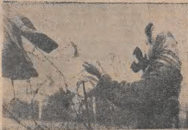
Anglosascy opiekunowie okupacyjni w Niemczech mają oryginalną metodę postępowania w stosunku do t. zw. D.P. (Displaced Persons): ani nie pozwalają im wrócić do ojczyzny, ani przebywać na swobodzie. Nieszczęsny „Dipisom“ pozostaje tedy jedynie wieść cierniowe życie za kolczastym drutem obozów...