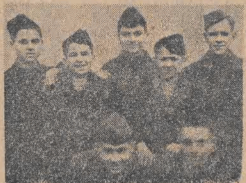
Chłopcy z Jugosławii

Powstaje pierwsza w kraju, zrobiona całko- wicie reklamą polskich robotników, maszyna do robienia igiel dziewiarskich. Dotychczas igły dziewiarskie sprowadzaliśmy z zagranicy i musieliśmy za to drogo płacić. Teraz będziemy je wyrabiać sami.