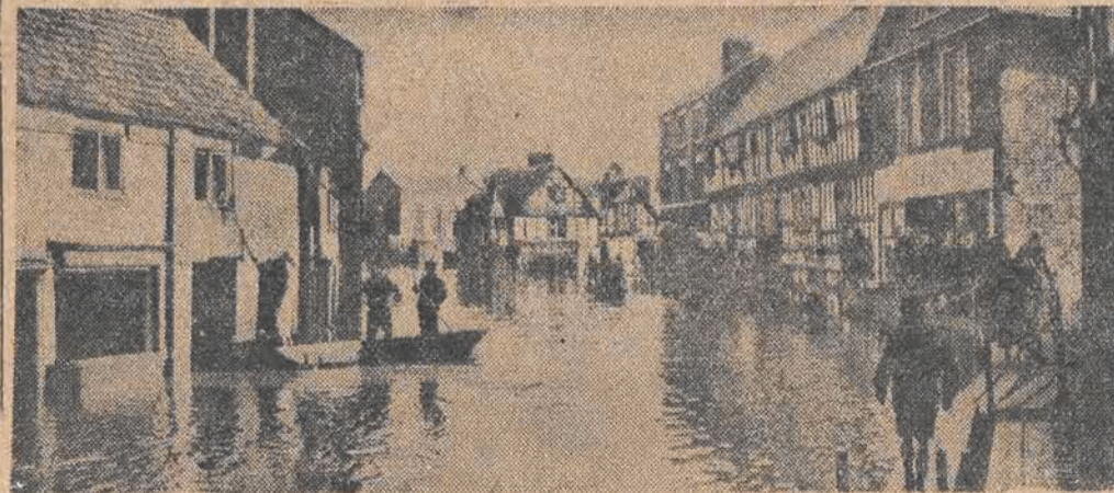
Na skutkach długotrwałych deszczów szereg rzek w Anglii wystąpiło z brzegów. Szczególnie silnie wylała rzeka Severn w hrabstwie Shrewsbury i Worcester. Na il. — miasto Shrewsbury pod wodą.