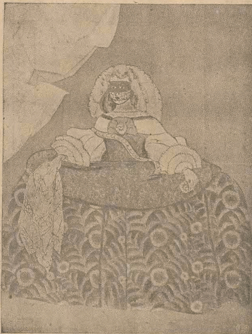
Strój Velasquez podług obrazu mistrza z materji Rodier: staniczek i baskina z brokату w drobny kwiatny deseń, krynolina z adamaszku, bluzeczka i chusteczka z crêpe Georgette, rozszywanej walansjenką. Peruczka z rdzawej wełny.

Niechaj cię więc żywiołowość maskarady nie przeraża — swoją wysportowaną, elastyczną sylwetkę odziej w jakiejś szatki z tysiąca i jednej nocy, główkę okryj peruczka lub kapelusikiem — i twarzyczkę chroniąc maską, korzystaj choć raz z przywileju maskaradowego intrygowania tego, który cię nęci, a nie tego, który sam do ciebie podchodzi.