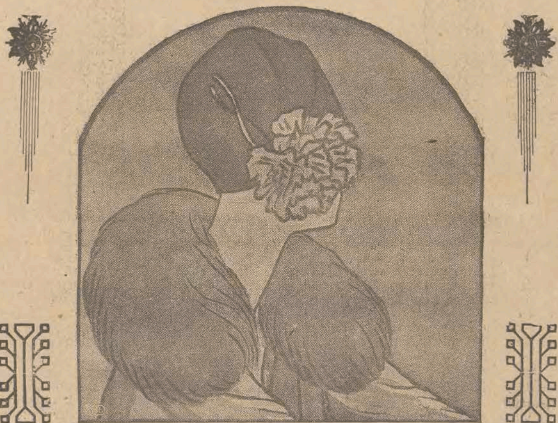
Wielki różowy goździk stanowi zakończenie czarnego beretu filcowego, udrapowanego na prawą stronę. (Model Georgette.)

Po kaskach i turbanach najulubieńszymi stają się berety. Są to właściwie be-