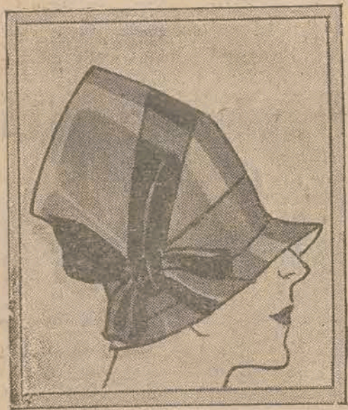
Reboux budkę z brązowej panne, przybraną brązową aksamitką, ożywia rondkiem o jasnym champagne podbiciu z crêpe Georgette.

Od dwóch z górą lat można było istotnie przypuścić, że zanikła pomysłowość, a odwieczna chęć kobiet wyróżniania się i przewyższenia urodą innych uległa przeobrażeniu pod wpływem męskich smokingów, półbucików bez obcasów, kohnieczyków pod szyję z krawatami i coraz bardziej chłopięcej fryzury. Na ulicy spotykamy szereg małych modeli filcowych o jednakowych rondkach i przeważnie jednej barwie, a kwiaty do kapeluszy, ptaki rajskie i piórodajne strusię zatraciły zda się cel bytu.