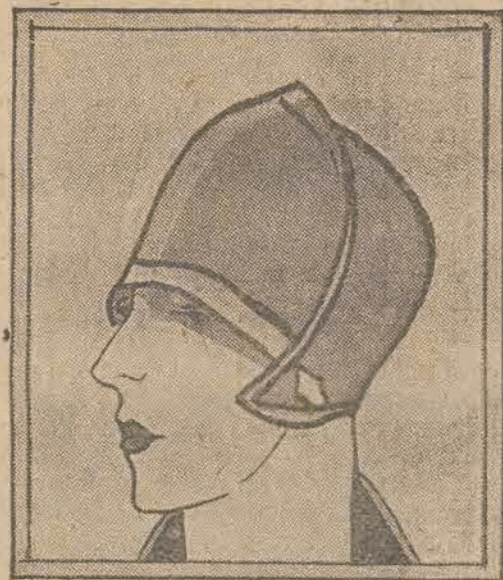
Kask ze stalowo-niebieskiej panne o nieszczelnie schodzących się połówkach jest obramowany bleu aksamitką. Na wydłużonych nausznikach klamerki koralikowe. (Model Lewis).