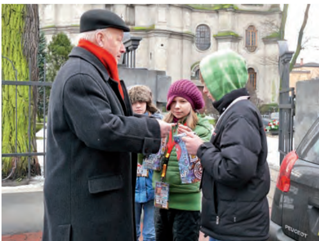
Kwestujący młodzi ludzie często odwiedzali okolice kościołów i dużych sklepów.