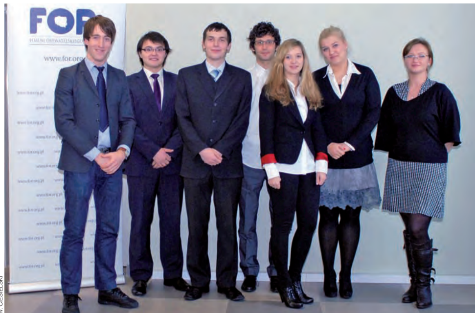
W Łowiczu powstał klub Fundacji FOR. W tej chwili tworzy go 7 osób.

– Nam chodzi o stopniowe działania. Nie chcemy zaistnieć na chwilę, zrobić dużo szumu i zaraz zniknąć. Chcemy działać systematycznie. Nasze akcje mają mieć charakter przede wszystkim informacyjny i być daleko od polityki. Będziemy chcieli pokazać ludziom, np. jak wygląda sytuacja z miejscami parkingowymi na terenie miasta. Będziemy docierali do informacji z zakresu ekonomii czy życia społecznego i je upublicznia-