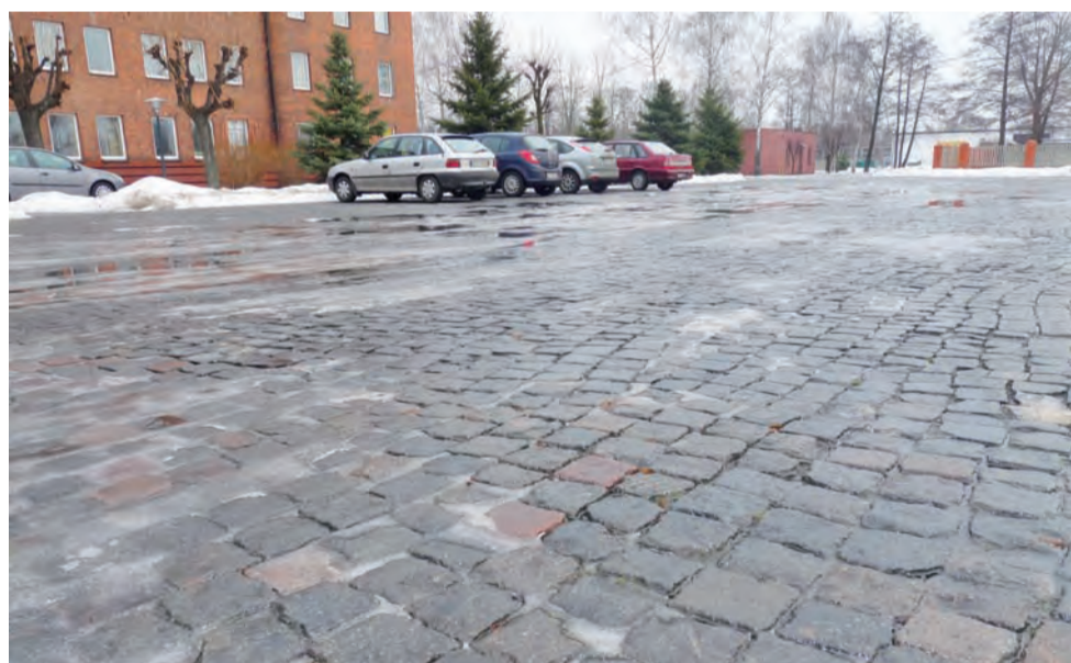
Brukowa kostka może być równa i gładka. Taka jaką niedawno położono przy seminarium. Bardziej by się przydała przy katedrze.

Otóż przepiękna równiuteńka kostka bazaltowa jest położona przed seminarium na ul. Seminarnej. Można sprawdzić. Skąd owa kosteczka? Otóż została ona zerwana podczas ubiegłorocznej przebudowy trasy nr 2 na odcinku Zdun. Wybudowana w 1939 r. – przez Niemców – nawierzchnia na tej trasie na odcinku od wysokości