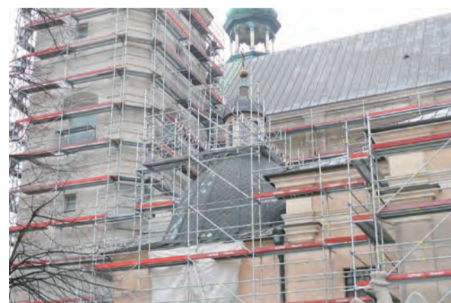
Rusztowania zewnętrzne otaczają niemal całą katedrę.

nie na jego powierzchni, jak to się dzieje w przypadku zwykłych zapraw, ale już wewnątrz tynku. Wtedy sole mineralne, które pozostają po odparowaniu wody, są gromadzone w warstwie tynku i nie są widoczne na zewnątrz. Natomiast gdy sole wypełnią już wszystkie wolne przestrzenie wewnątrz, zaczynają się pojawiać na powierzchni, a wówczas tynk traci swoje właściwości. Jakość i trwałość tynków renowacyjnych zależy od tego ile soli mineralnych są w stanie wchłonąć. Najlepsze z nich