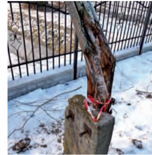
Nadłamanym słup w centrum Złakowa został wymieniony.

Około 2 miesiące czekali mieszkańcy Złakowa Kościelnego w gminie Zduny na wymianę nadłamanego słupa telefonicznego należącego do Telekomunikacji Polskiej, który znajdował się w centrum tej miejscowości, zaraz przy tutejszym kościele.