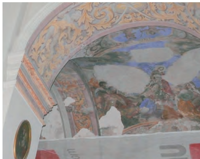
Tynk z namalowanym freskiem odpadł ze sklepienia nawy bocznej, przez co malowidło stało się praktycznie nieczytelne.

Łowicz | Kościół pijarski potrzebuje remontu