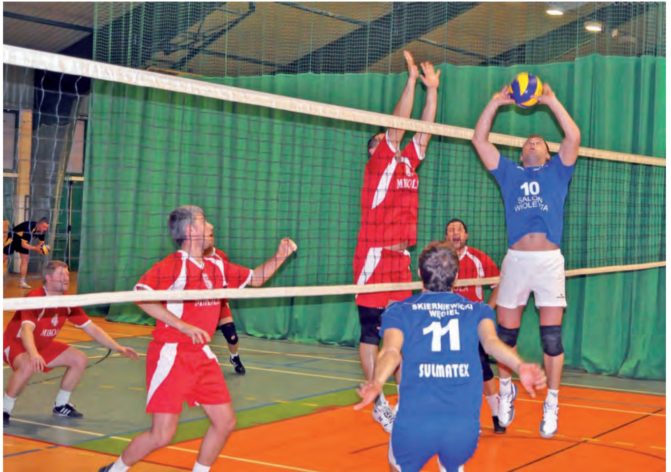
Mikola urwała liderowi rozgrywek dwa punkty, a co za tym idzie bardzo duży punkt, ale jednak zeszyła z parkietu pokonana...

Farbis Łowicz – Essato Team Łowicz 3:0 (25:16, 25:20, 25:17),