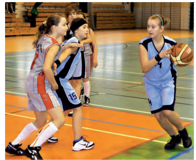
Młodziżki z Łowicza grały ambitnie, ale jednak przegrały...