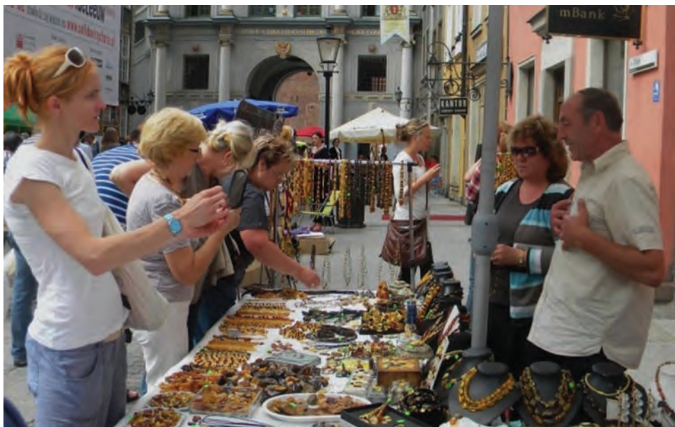
Jarmark Św. Dominika w Gdańsku ma 750-letnią tradycję i jest największą tego typu imprezą plenerową w Europie.