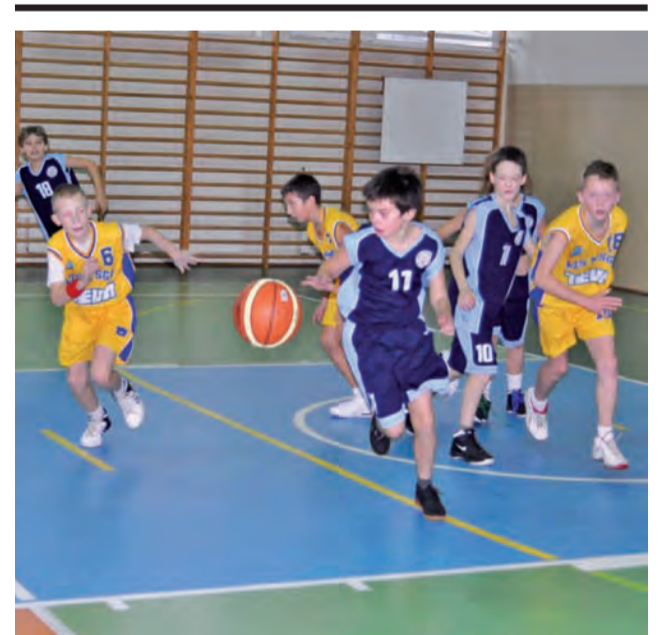
Drużyna żaków z Łowicza nadal zajmuje drugie miejsce w lidze U-12.