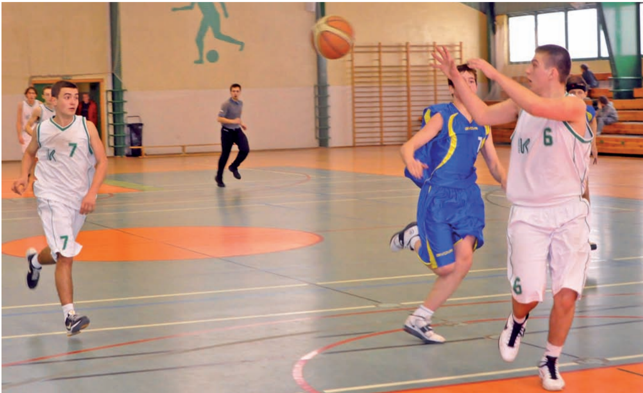
Juniorzy Księżaka zdecydowanie wygrali z Jordanem i umocnili się tym samym na trzecim miejscu w tabeli U-18.

Koszykówka | 10. kolejka wojewódzkiej ligi juniorów U-18