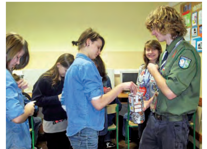
WOŚP w Gimnazjum nr 2. Uczniowie „Dwójki” chętnie zaangażowali się w akcję Owsiaaka.

kwestowali na szkolnych korytarzach podczas przerw międzylekcyjnych, a także odwiedzali uczniów w klasach. Wielki finał szkolnej akcji miał miejsce 7 stycznia i wtedy do puszek trafiło najwięcej pieniędzy, czerwone serduszka WOŚP widoczne były w całej szkole. td