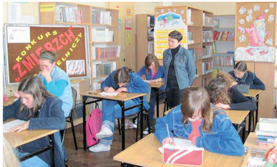
Uczennice „Dwójki” chętnie wzięły udział w konkursie. Odpowiadały na pytania związane z jedną ze swoich ulubionych książek.

Takich przykładów jest więcej. Rzecz w tym, byśmy do polskich (ale naprawdę dobrych) wyrobów nabierali coraz większego zaufania. Co na szczęście jest coraz częstsze. Piłka jest jednak zawsze po stronie producentów. A nam szczególnie powinno zależeć na tym, by w Polsce mówiono: „Dobre, bo łowickie!”