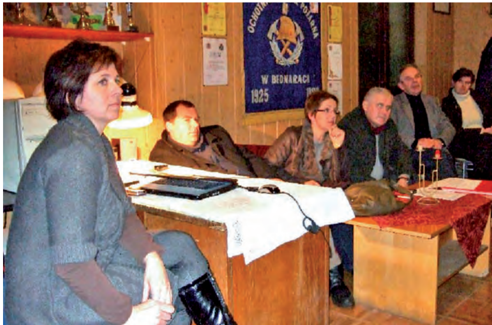
Spotkanie założycielskie stowarzyszenia odbyło się w jednostce OSP w Bednarach.

W dzisiejszym numerze, na str. 16-18, przedstawiamy program zajęć feryjnych w okolicznych placówkach oświatowych i kulturalnych. Mieszkańcy gminy Nieborów nie znajdą wśród tych propozycji programów z GOK w Nieborowie i jego filii w Bełchowie. Choć z pytaniem o te programy zaczęliśmy dzwonić już w minionym tygodniu, telefony obu instytucji pozostają od kilku dni głuche. tb