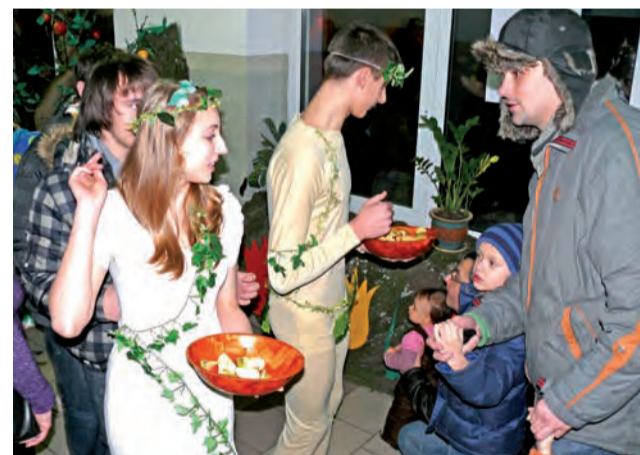
Już przy wejściu do szkolnej sali gimnastycznej można było oglądać pierwsze sceny jasełek