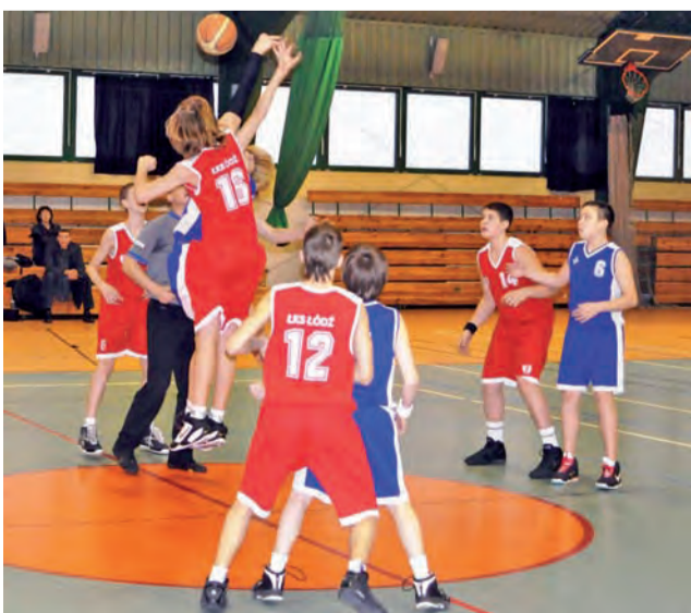
Pomimo znacznych osłabień młodzicy Księżaka rozegrali z liderem rozgrywek całkiem niezłe spotkanie...