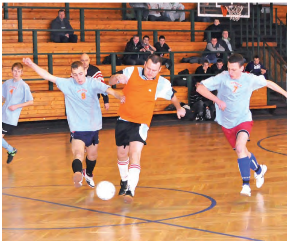
Ekipa PHU Gajek wygrała z drużyną Star-Oil, ale włączyć się do walki o awans będzie już naprawdę trudno...

■ Pioruny-Damagu Łowicz – Radio-Net Łowicz 1:2 (0:0);