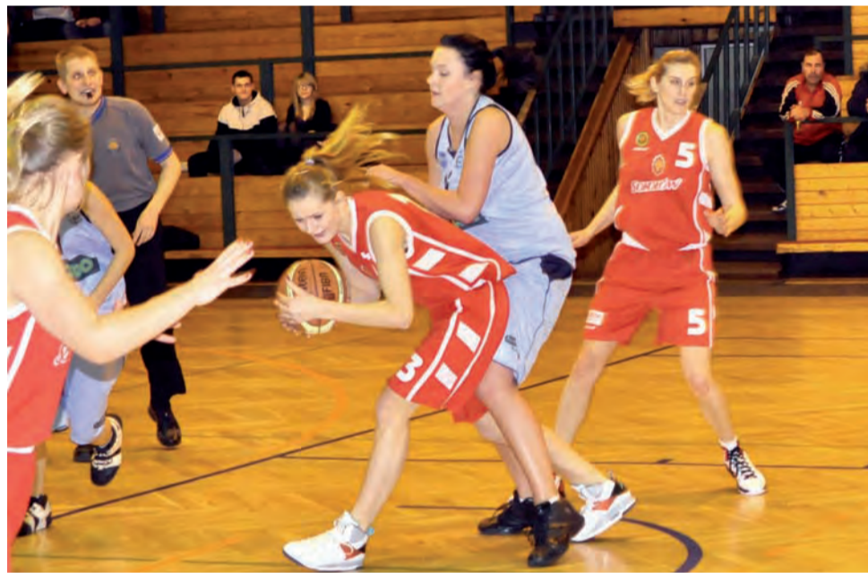
Łowiczanki rozpoczęły bardzo dobrze, ale w drugiej części tak dobrze już nie było...

Koszykówka | 10. kolejka wojewódzkiej ligi kadetek U-16