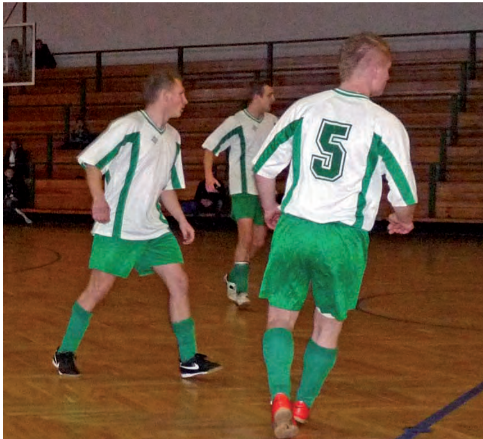
Fenix Boczki znowu wygrał i wciąż z kompletem punktów prowadzi w tabeli II ligi ŁoLiF.