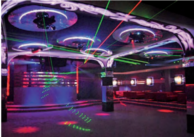
Takiego standardu OSP nie zapewnia. Wnętrze dyskoteki w Rybnie można zobaczyć na wielu portalach poświęconych muzyce klubowej.

Po rozmowach z druhami z kilku jednostek nie mamy wątpliwości, że organizowanie zabaw to tylko o pielęgnowaniu tradycji. Zabawy są jedną z niewielu możliwości zarobienia przez straż pieniądze. 3 lub 4 „dobre” zabawy w roku oznaczały dochody własne dla jednostki, a zarobione pieniądze mogła przeznaczyć na cele statutowe. Były to pieniądze dużo większe niż to, co można zarobić wynajmując pomieszczenia na wesela. Ale są też inne powody, dla których strażacy chcieliby zabawy organizować: bawią się na nich ich dzieci, kuzyni czy dzieci sąsiadów. Są przekonani, że na zabawach organizowanych blisko domu jest bezpieczniej niż na dyskotekę, na której bawić się może kilka tysięcy osób.