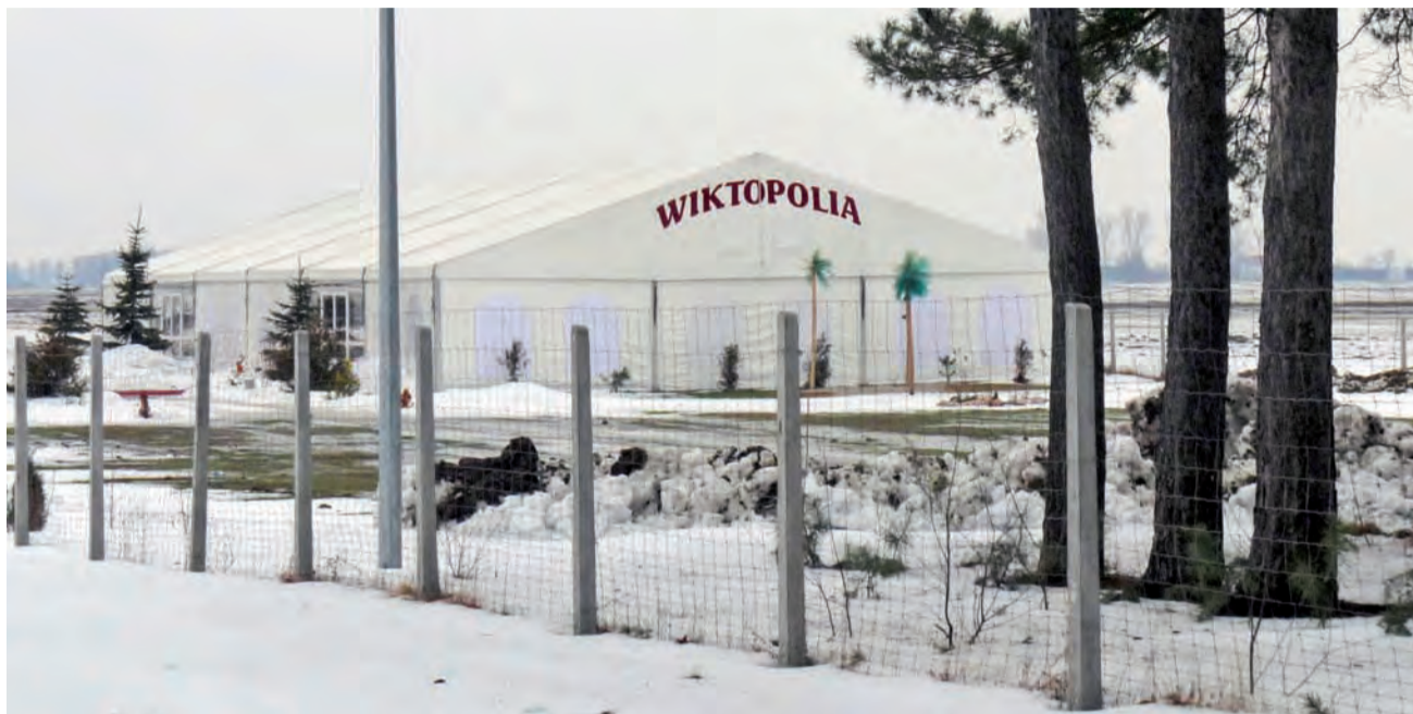
Namiot w Strzelcewie sąsiaduje z lasem. Kilkanaście drzew rośnie już na terenie weselnej posesji.