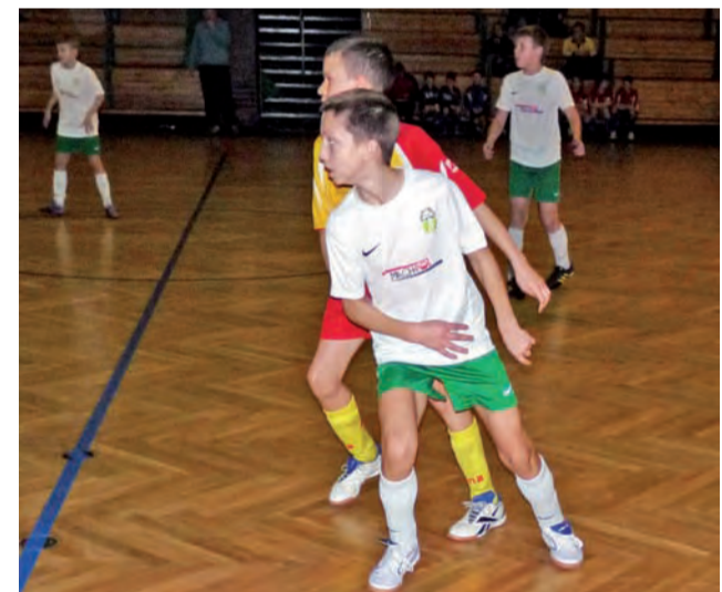
W turnieju rocznika 1998 wygrał Lider Włocławek, przed Pegazem Drobin i Akademią Piłkarską z Żyrardowa.