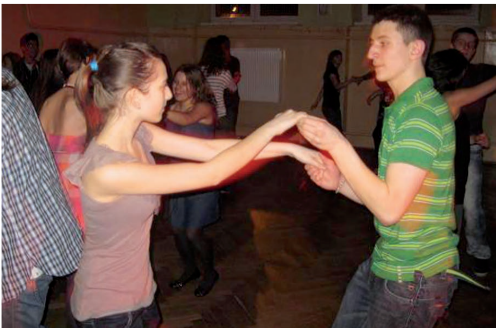
Dyskoteka cieszyła się powodzeniem. Uczniowie dobrze się bawili we własnym gronie.

■ Codziennie w Gimnazjum w Domaniewicach w godzinach 8.00–16.00 młodzież może skorzystać z hali sportowej. Na zakończenie ferii, 27 stycznia przeprowadzone zo-