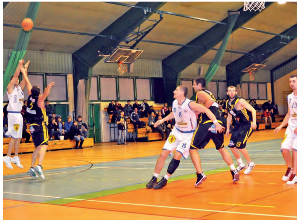
Niespodziewanie Akademicy z Częstochowy wyjechali z Łowicza z dwoma punktami...

Po zmianie stron AZS zagrał skuteczniej i już w 25. minucie wygrywał 59:50, dzięki dwóm rzutom „za trzy”. W 27. minucie był już prawie remis (62:63) po dwóch akcjach łowiczanie i celnych „trójkach” Włuczynskiego i Nogalskiego. Jednak w ostatnich akcjach znów górą byli goście i po trzech kwartach wygrywali 68:62 i o zwycięstwie miała zadecydować ostatnia odsłona. Księżacy już od pierwszych minut chcieli szybko odrobić straty, ale szło to bardzo ciężko. Bardzo do-