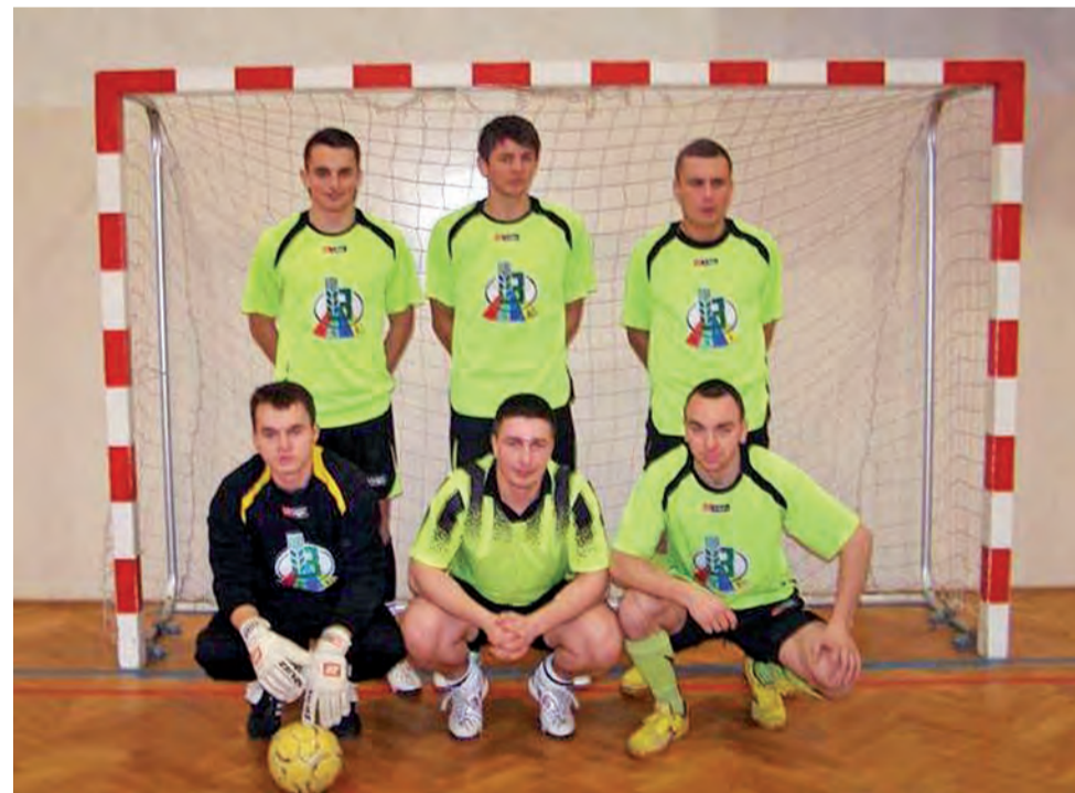
Ekipa Warriors broni tytułu mistrzowskiego w Bielawach.