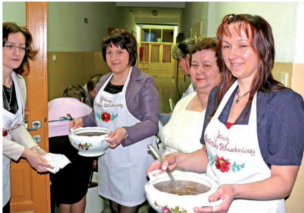
Panie z KGW w czasie noworocznej zabawy same zadbały o podanie potraw na stoły, przy których siedziały.

Owocna była także współpraca z ochotniczymi strażami, Radami Sołectw i gminą. Panie z KGW angażowały się zresztą, jak co roku, niemal w każde przedsięwzięcie na terenie gminy. Wielokrotnie prezentowały i promowały też gminę oraz powiat łowicki w innych