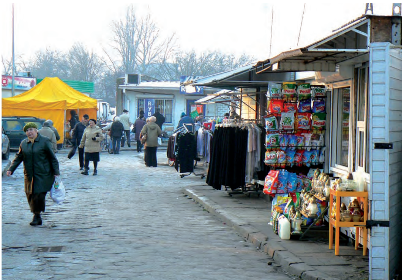
Miejskie targowisko. Część właścicieli pawilonów handlowych ma zastrzeżenia do treści umów proponowanych przez „Pelikana”.