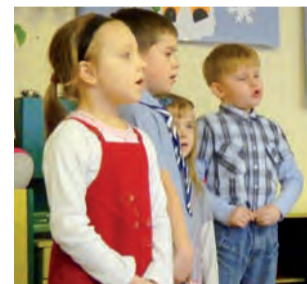
Grupa Krasnoludków przygotowała przedstawienie.

Każda grupa zaprosiła wcześniej swoich dziadków na dany dzień i pod kierunkiem opiekunek przygotowała dla nich krótką część artystyczną.