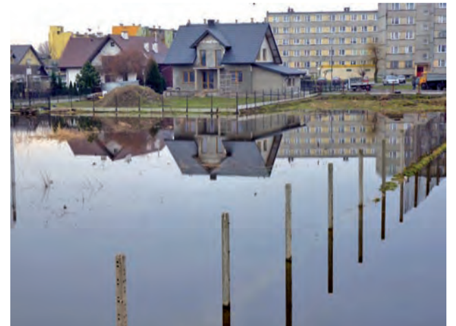
Woda z Bzury podeszła pod posesje przy ul. Konopnickiej.

Woda podeszła dość blisko także na ul. Wiatrakowej i na Łąkowej na Górkach, gdzie wdzierała się do ogródków i zalała niektóre z posesji rekreacyjnych. – Woda podchodzi i jest chyba wyższa niż rok temu, ale nie jest źle. Weszła na pole i do tunelów, ale na szczęście tam w tej chwili nic nie ma – powiedział mężczyzna, który na ulicy Łąkowej ma pole. td, mak