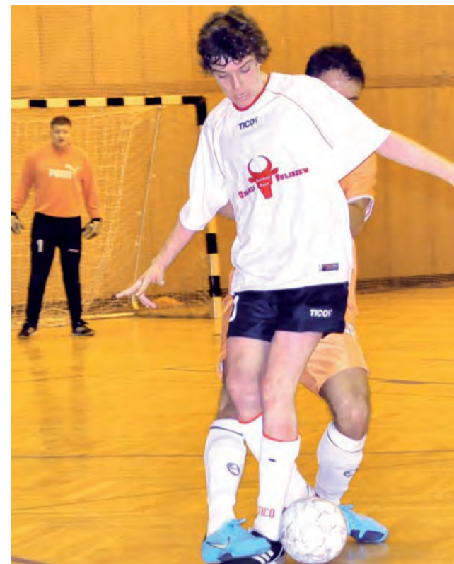
Ekipa FC Chinatown uległa Zatorzu 0:1, ale na zespół ten nałożony został walkower 0:5...