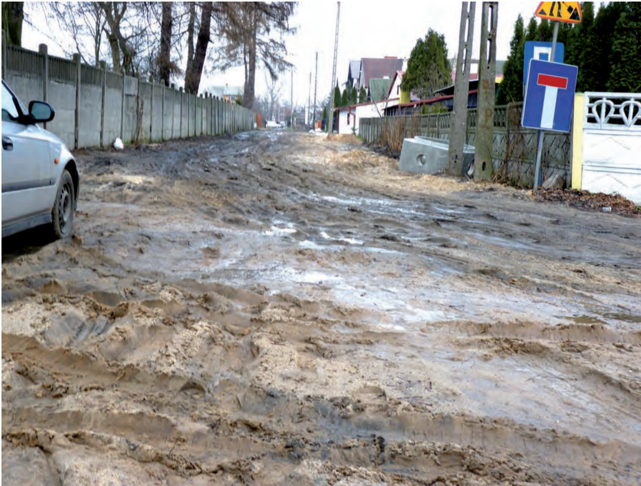
Ulica Ogrodowa w Łowiczu. Tak wygląda w czasie odwilży, po rozpoczętych w niej pracach kanalizacyjnych i w oczekiwaniu na utwardzoną nawierzchnię.

W lasach pod Łowiczem Buczyński przygotowuje się do skoku przez Bałtyk .str. 13