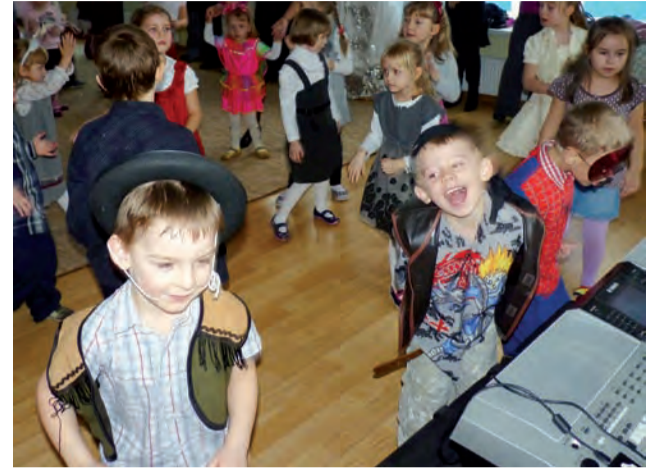
Bal noworoczny w przedszkolu w Łyszkowicach trwał przez cały dzień.

Św. Mikołaj po raz trzeci odwiedził w ciągu ostatnich kilku tygodni przedszkolaków z Łyszkowic. Zabawa choinkowo-noworoczna odbyła się w ostatni piątek, 14 stycznia. Atrakcją tego dnia w przedszkolu był nie tylko św. Mikołaj rozdający paczki ze słodyczkami, ale również zespół grający muzykę do tańca na żywo, wodzirej prowadzący zabawę oraz fotografowie wykonujący dzieciom pamiątkowe zdjęcia w atelier fotograficznym zaaranżowanym w jednej z sal. Tańce i konkursy odbywały się w przedszkolnej, dużej sali zabaw. W niektórych z nich uczestniczyli również rodzice. Część z przedszkolaków przysłała na bal w przebraniu, nie brakowało więc na sali Batmanów, Spidermanów oraz księżniczek.