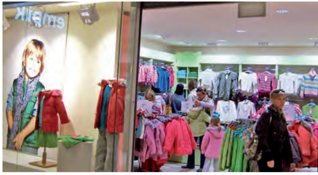
Tak było. Sklep 5.10.15 przed zamknięciem.