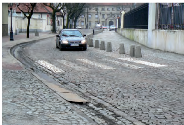
Ten fragment Starego Rynku zostanie zamknięty. Jest to tylko kwestia czasu.

rzędcy ruchu, czyli burmistrza i starosty łowickiego. Te uzgodnienia nie mają jednak kwestionować lub zatwierdzać zasadności tych zmian, a są po, żeby zatwierdzić, jakie zmiany będą na tym odcinku – wyjaśnia