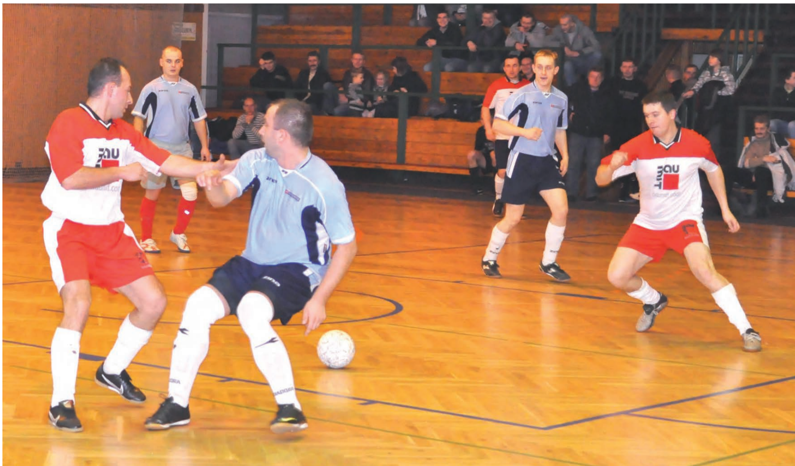
Agros Nova nadspodziewanie łatwo ograł łowicki Baumit.