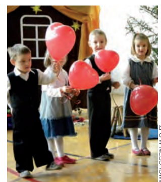
Co, jeśli nie serce, może dać przedszkolak swojej babci i dziadkowi w dniu ich święta...

Tuż przed przerwą feryjną, 12 stycznia, dzieci z Zespołu Placówek Oświatowych w Nieborowie zaprosiły do szkoły babcie i dziadków z okazji ich dnia.