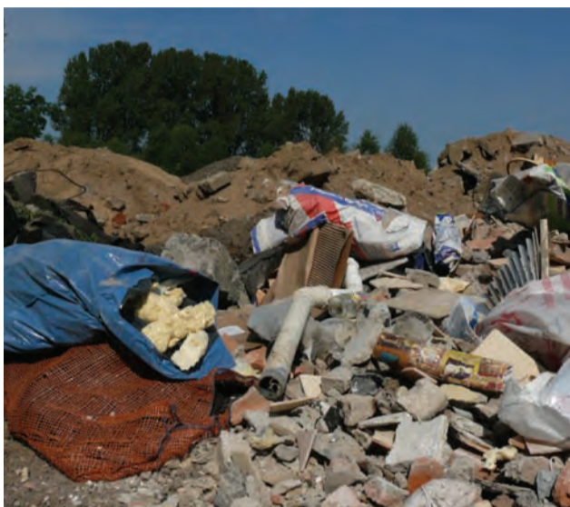
Gruz i śmieci na działce przy ul. Łęczycyckiej i Młyńskiej najbardziej widoczne były latem.

Słojewski dodaje, że dzięki jego staraniom działka, która nie była zagospodarowana i szpeciła miasto, będzie za jakiś czas (nie jest w stanie powiedzieć, czy to kwestia roku czy więcej lat),