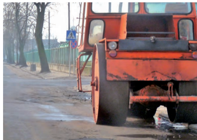
Zanim doszło do awarii, ZUK zdążył załatać dziury m.in. na ul. Sikorskiego.