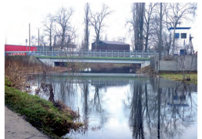
Jeśli stan wody w Zwierzyniu podniesie się, może zagrozić ulicy Arkadyjskiej.