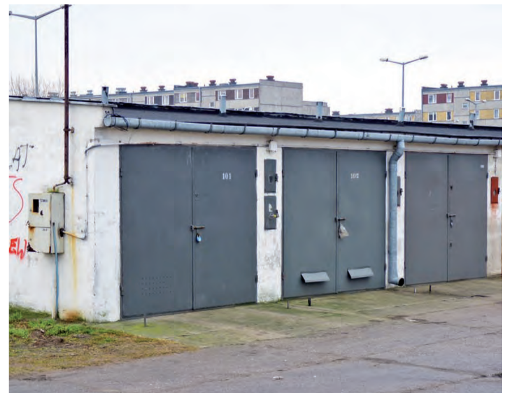
Nowe garaże na Bratkowicach mają powstać w sąsiedztwie istniejącego kompleksu garaży.

Udrażnianie kolektorów to koszt około 10 – 15 zł od metra bieżącego – tyle każda sobie płacić specjalizujące się w tym firmy. W Łowiczu jest około 80 kilometrów sieci kanalizacji sanitarnej. Dlatego dyrektor Kołodziejski uważa, że taki zakup bardzo szybko by się zwrócił. tb