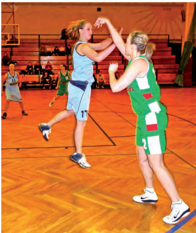
O meczu ze Zgierzem trzeba będzie szybko zapomnieć...

Kolejny mecz łowiczanki rozegrają już w piątek 4 marca