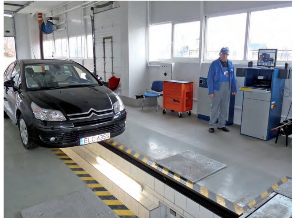
Nowa stacja kontroli pojazdów na Polmoblichu bada wszystkie pojazdy

Prac przy budowie kanału i ścieżki diagnostycznej podjęła się łowicka firma Budowa. – Należało spełnić bardzo rygorystyczne wymagania, na przykład co do płaskości powierzchni. Na długości 8 metrów tolerancja wynosiła tylko 3 milimetry – opowiada pre-