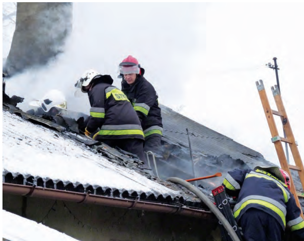
Strażacy gaszą pożar na Włókienniczej. Ogień strawił m.in. część drewnianego dachu.

Władze miasta zapewniły pogorzalcem lokale zastępcze oraz transport uratowanego z pożaru dobytku. Obie rodziny trafiły do nowego bloku na ul. Krudowskiego, gdzie będą przebywać do momentu remontu zniszczonego mieszkania. Rodziny dostały także po 2 tys. zł jednorazowego zasiłku z MOPS. td