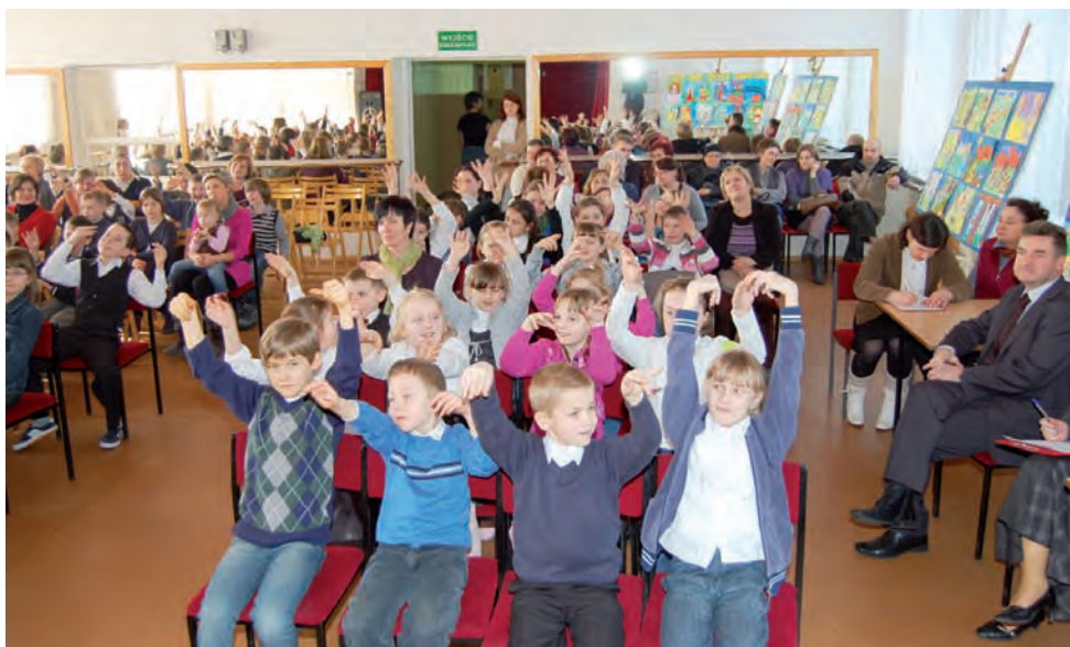
Podczas przesłuchań bawiła się cała publiczność.

Po naszej interwencji, tuż przed wydaniem gazety, 2 marca, oświadczenie majątkowe zostało opublikowane na stronie BIP Urzędu Gminy Bielawy. td