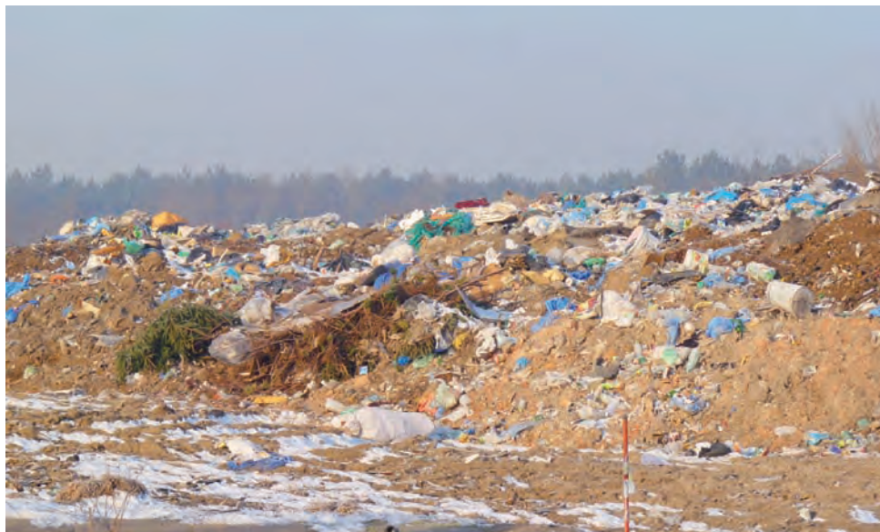
Składowisko odpadów pod Łowiczem. Jeśli miasto nie przeprowadzi kosztownych inwestycji może ono zostać zamknięte.

norm. Od roku 2005 do 2007 przeprowadzono tam szereg inwestycji, m.in. ogrodzono wysypisko, otoczono je wierzwą wiciową, która zatrzymuje folię oraz papiery, a do tego neutralizuje nieprzyjemny zapach, wjazd na wysypisko został utwardzony, postawiono budynek wagi, zamontowano wagę elektroniczną i wybudowano budynek socjalny. Do tego pobudowano rowy odciekowe odpowiedzialne za zbieranie wód spadowych, zapobiegający rozlewaniu się wody po terenie wysypiska. – Zainstalowaliśmy także 2 zbiorniki odprowadzające i zbierające wodę z tych rowów, 11 tzw. piezometrów do neutralizacji gazu składowiskowego i kilka takich urządzeń do obserwacji zanie-