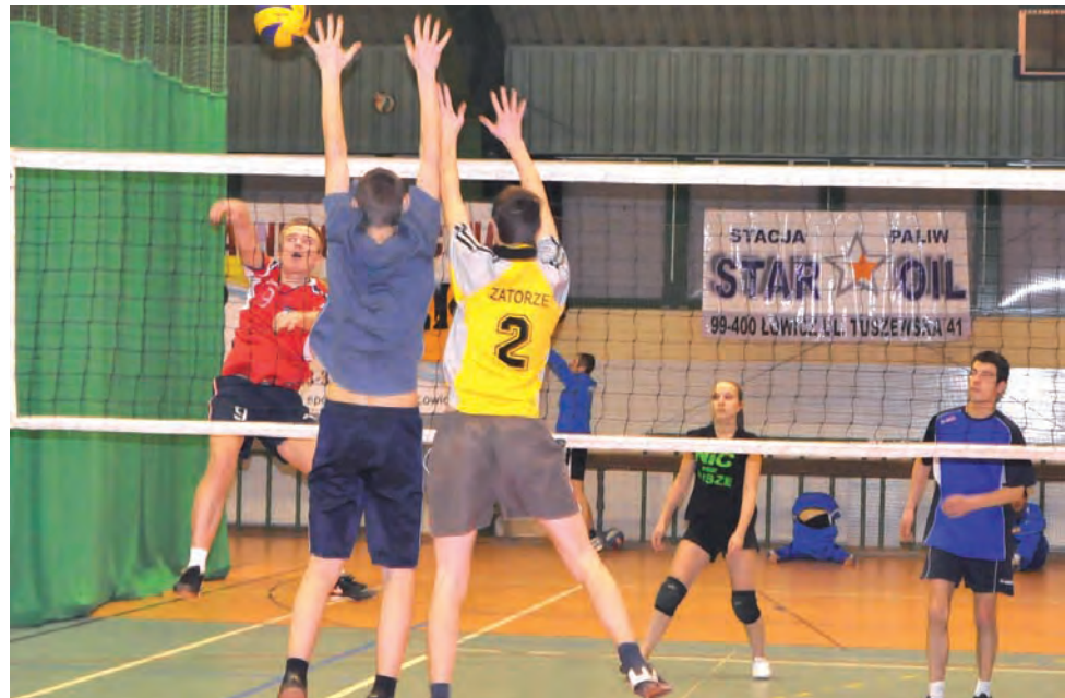
To już praktycznie koniec sezonu. Pozostał jeszcze tylko do rozegrania finałowy mecz AMŁ.