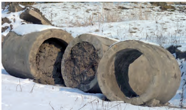
Wiele z przepustów w rowach było zapchanych ziemią i szlammem

Gmina będzie odnawiała również przepusty w rowach, po których możliwy jest dojazd do posesji. Jeśli przepustu gdzieś nie było w planie, a rolnik chciałby mieć na przykład dodatkowy dojazd do pola, może we własnym zakresie zamontować przepust w rowie. – Ważne jest, żeby to nie była jakaś cienka rura, tylko na przykład betonowy krąg o średnicy co najmniej 50 centymetrów. Przepust nie może hamować przepływu wody – mówił wójt Reczulski. mak