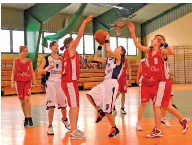
Rośniejsze i starsze rywalki z Głowno wygrały w Łowiczu.

3. kolejka wojewódzkiej ligi młodziczek U-14 o miejsca 6-11: Księżak Łowicz – TK Alles Głowno 60:84, ŁKS BW II Łódź –