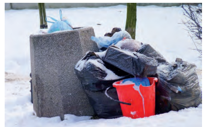
W poniedziałkowy poranek przy jednym z koszy na śmieci w Alejkach Sienkiewicza ktoś zostawił swoje worki po sprzątaniu. Kosz na śmieci najprawdopodobniej pomylił się tej osobie z wysypiskiem śmieci. am