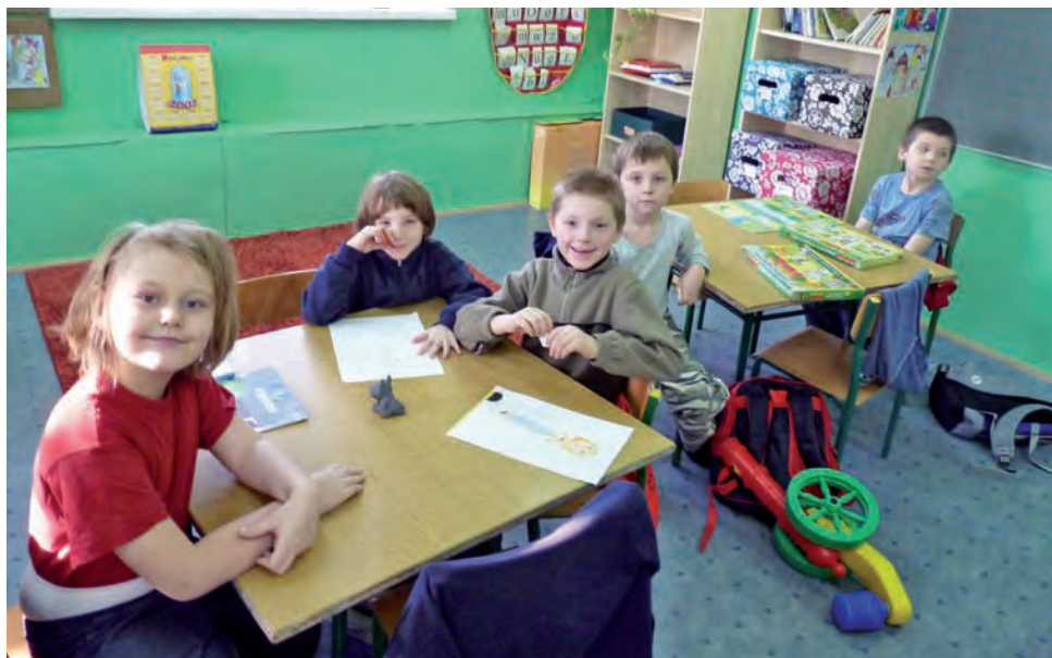
Zerówka w SP 1. 6-latki mogą zarówno chodzić zerówek w przedszkolach jak i w szkołach.

ku i przechodziły cały proces rekrutacji – wyjaśnia zmianę Mostowska – Teraz będzie inaczej. Od razu po otrzymaniu karty, na której zaznaczona jest chęć kontynuacji, zostaje ona odłożona na bok. Choć trzeba podkreślić, że dziecko, które chodziło do przedszkola, zawsze miało pierwszeństwo w dostaniu się do danej placówki. Dlatego rodzice, których pociecha jest już przed-