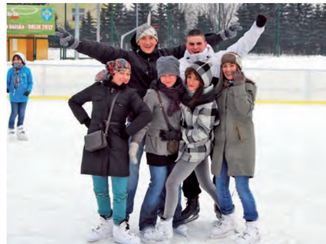
Czas wolny – to nie tylko wycieczki, ale także aktywny sport, tu na lodowisko w Skierniewicach.