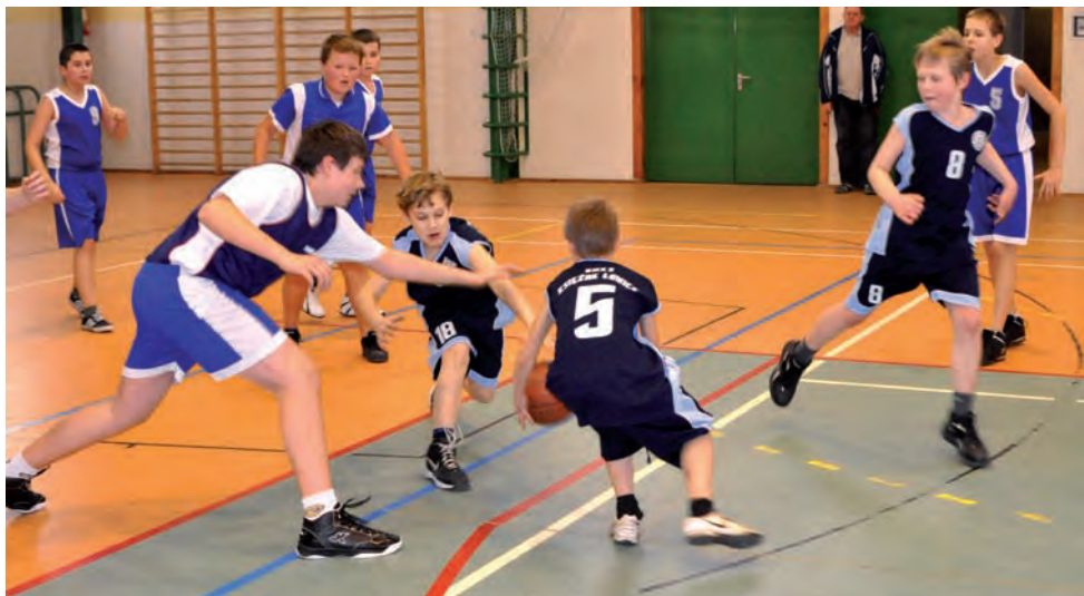
W meczu z Trójką Sieradz Księżak wygrał, choć się musiał troszkę namęczyć.