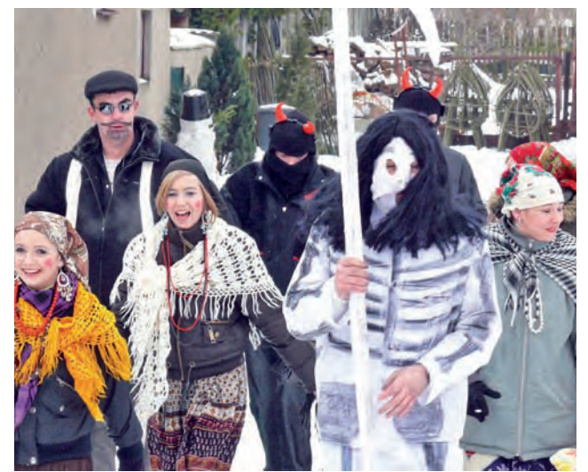
Tak chodzono z Misiem w 2009 roku, wśród osób idących w korowodzie przez Bobrowniki jest młodzież z zespołu ludowego Krzewina działającego w GOK.

„Chodzenie z misiem” lub inaczej „ostatki w Bobrownikach” odbywają się zawsze w ostatnią niedzielę karnawału, która w tym roku przypada 6 marca. W kolorowym korowodzie prowadzonym na słomianym powrośle idzie ubrany w plecione siano miś, śmierć