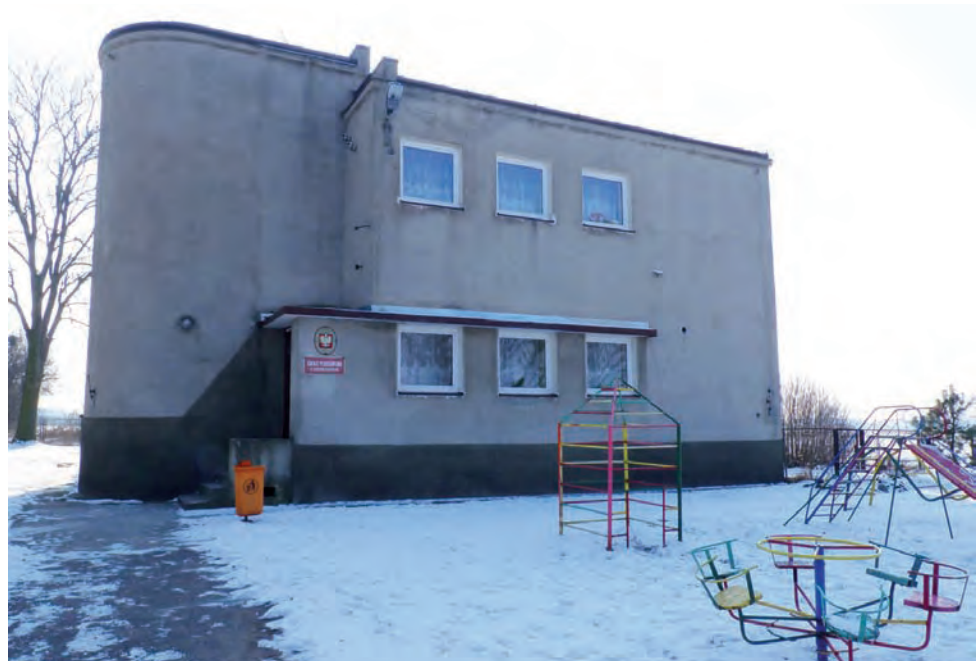
Szkoła Podstawowa ma zostać zamknięta. W tym budynku dalej funkcjonować będzie jednak przedszkole.

Na kilkanaście dni przed czwartkową sesją zorganizowano spotkanie z rodzicami dzieci uczęszczających do szkoły w Złakowie. Większość rodziców opowiedziała się za likwidacją szkoły. Podczas spotkania przedstawiono także pomysł uruchomienia tu przedszkola dla dzieci w wieku od 3 do 5 lat. Za tym pomysłem, z jednoczesnym poparciem zamknięcia SP, opowiedziało się 14 osób, przy 3 głosach sprzeciwu. W przedszkolu byłoby miejsce dla 25 osób, a swoje pociechy mogliby tu posyłać mieszkańcy Złakowa Borowego, Złakowa Nowego i Złakowa Kościelnego. td