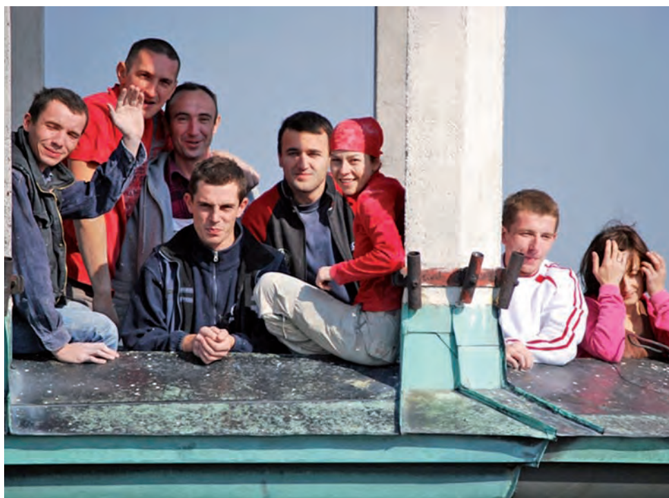
Katedra w Łowiczu. Pracownicy mieli także okazję zobaczyć widok rozpościerający się z wieży łowickiego kościoła.

W czasie wolnym, który przypada zawsze w sobotnie popołudnie i w niedziele, zwiedzają łowickie okolice. Byli już w Żelazowej Woli, w skansenie w Maurzycach, w Warszawie, w Walewiczach, w Skierniewicach oraz w Ło-