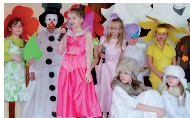
Uczniowie szczególnie zachwycali pięknymi strojami.

Sąd uniewinnił natomiast Kazimierza Ł., który według prokuratury, miał złożyć B. „obietnicę ugoszczenia” w Wiciu w zamian za pomoc w pozyskaniu dotacji dla jednej z jednostek OSP. – Zarejestrowana rozmowa nie zawierała konkretnych danych. Wynikało z niej, że Kazimierz Ł. ma lokal i że ugości drugiego oskarżonego. Nie wynikało jednak, że ugości za działania w ramach przekroczenia prawa – argumentował sąd. ■