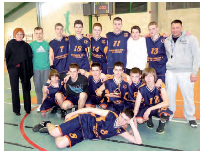
Koszykarze z Dwójki sprawili miły prezent swojej dyrektorce.