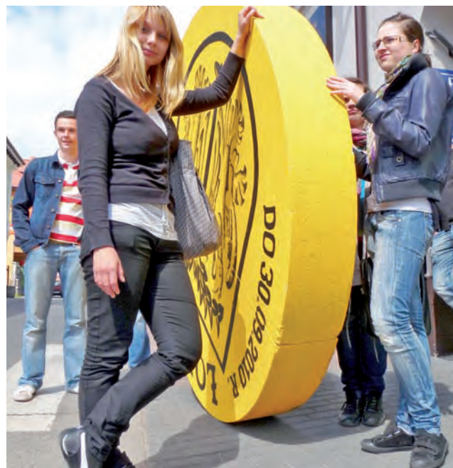
Tak inagurowano Książki. Spodobały się, ale na tym się skończyło

Właściciele punktów, którzy przystąpili do akcji potwierdzają, że ludzie kupowali książki przede wszystkim dla siebie