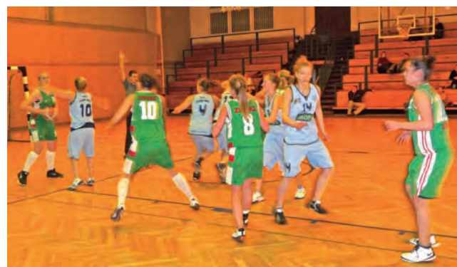
Trzeba będzie odpowiedzieć sobie na pytanie: co się stało?

Koszykówka | Wojewódzka liga młodziczek U-14