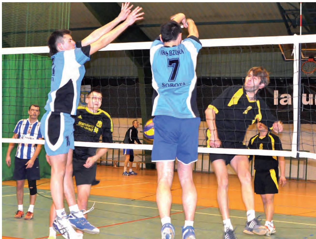
Bzura Sobota w ostatnim meczu I ligi zdobyła swój pierwszy punkt w rundzie finałowej.

Piłka siatkowa | 7. kolejka finałów Amatorskich Mistrzostw Łowicza