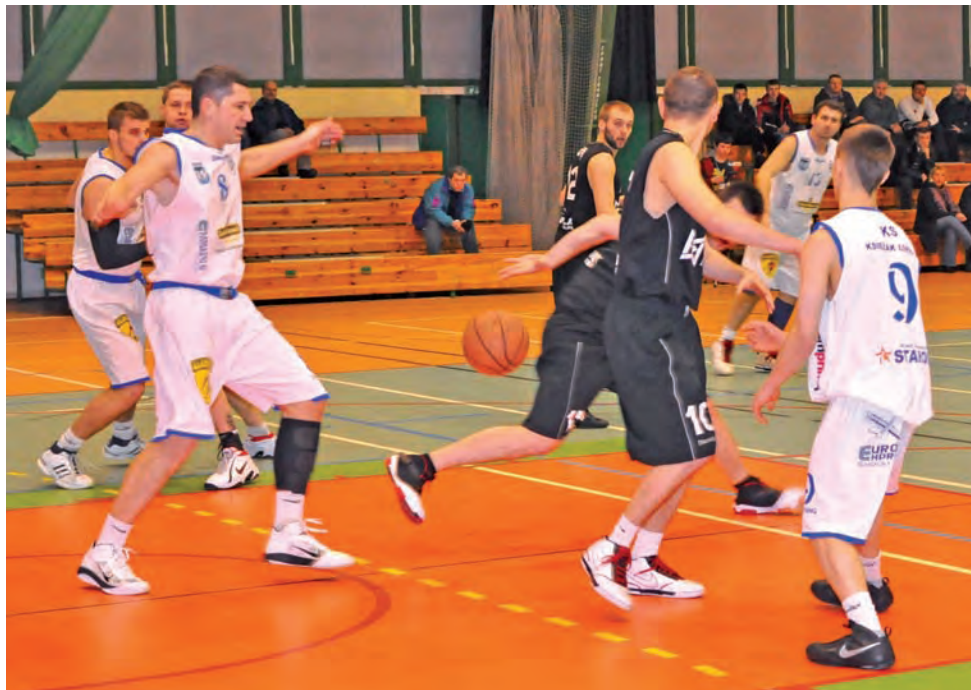
Na początku nie wyglądało to najlepiej, ale ostatecznie skończyło się zwycięstwem Księżaka.

tecznością. Po punktach Malony i dwóch „trójkach” Włuczynskiego po trzech kwartach nasza ekipa wygrywała 72:58.