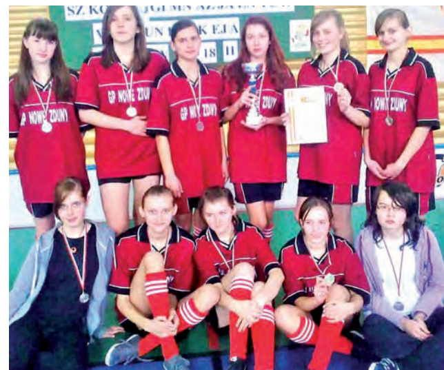
Srebrna ekipa gimnazjalistek z Nowych Zdun.