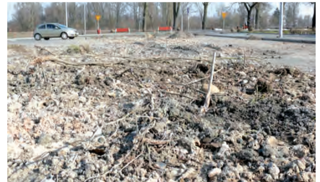
Ziemia, gałęzie i śmieci, wszystko co zostało zgarnięte z ulic miejskich wraz ze śniegiem trafiło na ratuszowy parking, przy okazji ciężki sprzęt zarwał nawierzchnię z kostki.

Burmistrz Krzysztof Kaliński zapytany przez nas o to, czy biorąc pod uwagę stan parkingu po zimie nie należy zastanowić się nad zmianą miejsca składowania śniegu w okresie zimy, odparł - Faktycznie, zastanawiamy się nad zmianą miejsca, możliwe, że śnieg będzie składowany przy ul. Kalińskiej, choć bywa tam grząsko i mieliśmy już problem z koparką, która tam utknęła - stwierdził. Za ratuszem śnieg nie będzie już składowany, m. in. właśnie z uwagi na uszkodzenia nawierzchni. tb