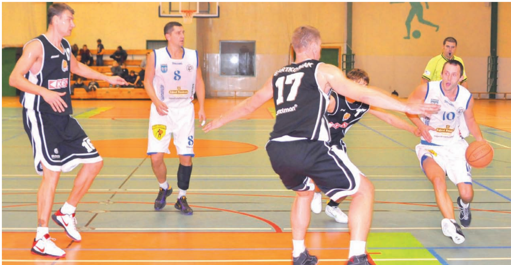
Najważniejszy cel został zrealizowany - Książak utrzymał się w II lidze koszykówki męskiej.