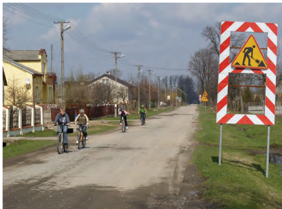
Droga Zakulin - Łagów przeznaczona jest dla pojazdów o dopuszczalnej masie całkowitej do 8 ton. Transport na budowę autostrady ma znacznie większy tonaż, stąd uszkodzenia nawierzchni.

Budowa autostrady A2 | Zniszczenia asfaltu na drogach dojazdowych