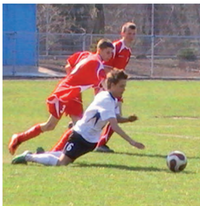
Ekipa Pelikana-96 odniosła w Rawie Mazowieckiej wysokie zwycięstwo.

Po zmianie stron gra wyglądała podobnie jak w pierwszej połowie. Pelikan ciągle atakował, a Mazovia wybijiała piłkę. W 45. minucie w zamieszaniu pod bramką Mazovii piłka ponownie trafiła do „Koziołka”, który z 5. metrów wpakował ją do bramki. W 60. minucie kapitalnym prostopadłym podaniem popisał się Tomasz Kaźmier-