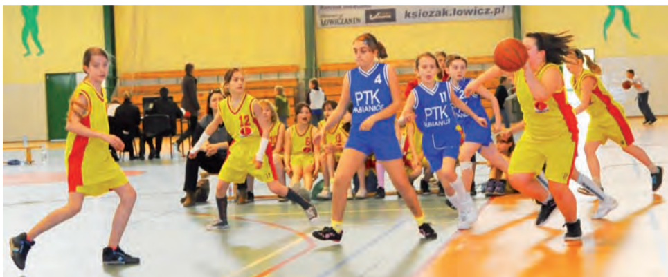
W Głowniu najmłodsze koszykarki Księżaka doznały dwóch porażek.