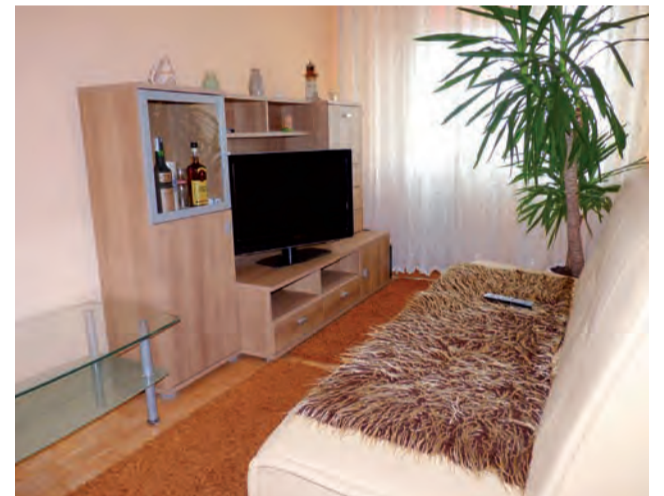
Tak wygląda zadłużone mieszkanie na osiedlu Bratkowice.

Windykatora i komornika sądowego zdziwił szczególnie stan mieszkania, w którym przebywała zadłużona rodzina.