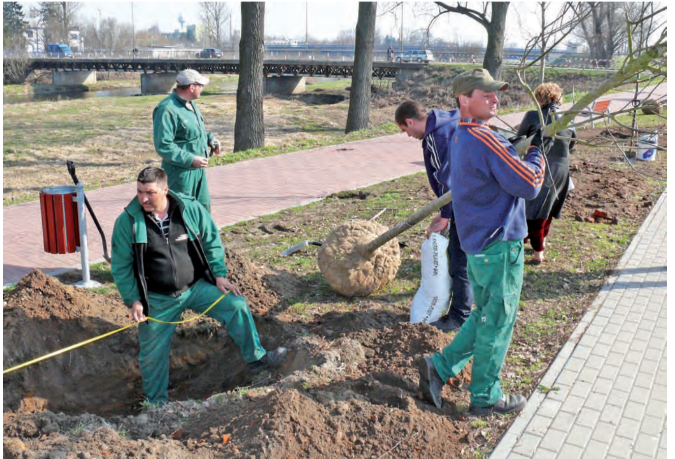
Pracownicy łódzkiej firmy Tracz, zaczęli w tym tygodniu sadzić drzewa w Parku Błonie. Jako pierwsze posadzono dęby czerwone.