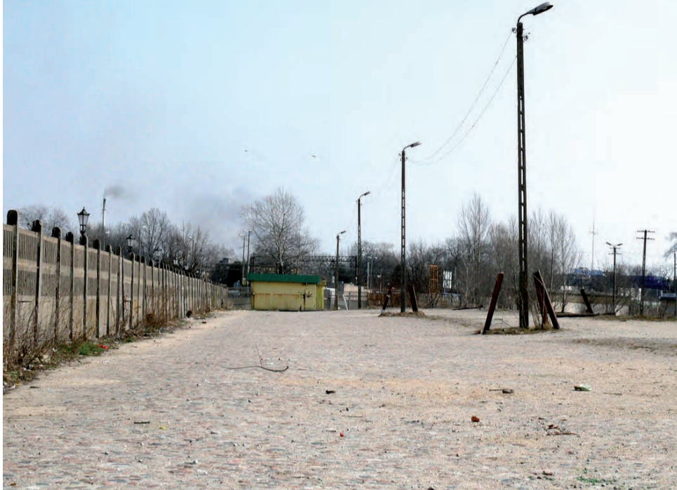
Obecnie teren rampy kolejowej jest niewykorzystywany, w przyszłości może tu parkować nawet 10 samochodów.

Ratusz chce rozebrać betonowe ogrodzenie, odgradzające chodnik przy ul. 3 Maja od przyszłego parkingu i wykonać nowe, odgradzające go od