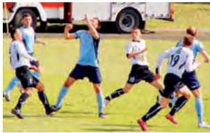
W Nadarzynie znowu remis.

Sędziował: Ł. Szczeczek (Białystok). Żółte kartki: T. Lewandowski (6), Michał Wrzesiński (2) i P. Grajek (5) - wszyscy GLKS oraz Krzysztof Brodecki (7), W. Marcinkiewicz (7) i M. Solecki (4) - wszyscy Pelikan. Widzów: 100.