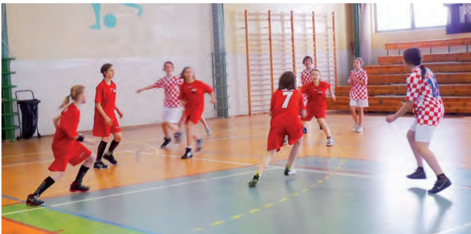
W finale koszykarki z SP 4 Łowicz wygrały aż 108:2.

Sport szkolny | Miejskie IMS w minikoszykówce dziewcząt