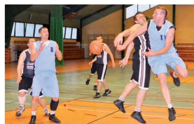
W ubiegłym sezonie w Łowiczu zagrało osiem zespołów.

PROGNOZA BIOMETEOROLOGICZNA Pogoda niekorzystnie wpłynie na nasze samopoczucie.