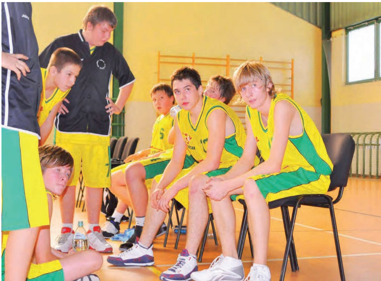
Kadeci Księżaka awansowali na trzecie miejsce w finale B.

Koszykówka | 5. kolejka finałów wojewódzkiej ligi kadetów U-16 o miejsca 7-13