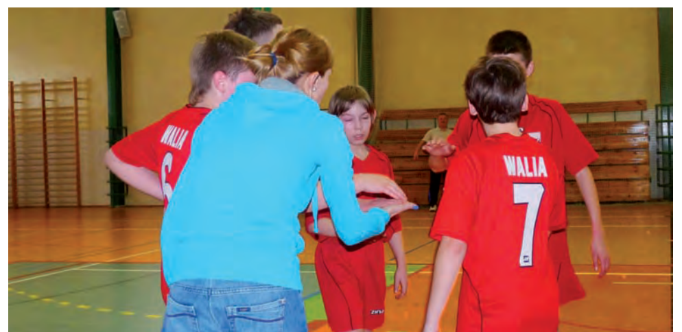
Otpęcała się walka do końca - decydujący kosz wpadł równo z syreną...