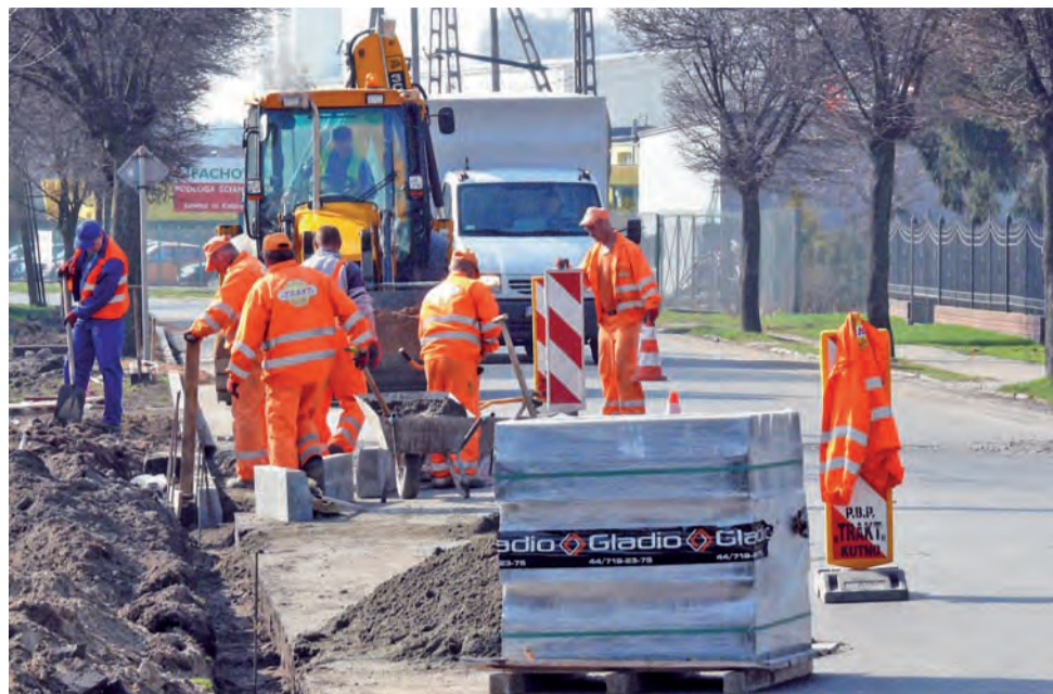
Prace na ul. Katarzynów w Łowiczu, prowadzi kutnowska firma Trakt, która zajmowała się już w naszym mieście modernizacją ul. 3 Maja, czy budową ul. Starorzecze.