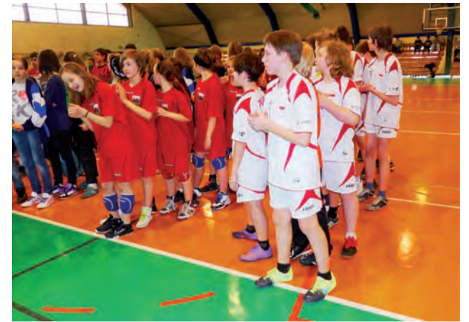
Chłopcy z Czwórki w rawskich zawodach zajęli trzecie miejsce.