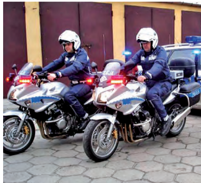
Nowe Hondy. Policjanci z drogówki mogą teraz z łatwością złapać piratów drogowych.

działania mające na celu przywrócenie ładu i porządku czyli próbuje powstrzymać innych od popełnienia przestępstwa np. kradzieży, włamania czy wandalizmu, korzysta z ochrony prawnej takiej samej jak funkcjonariusz policji. Natomiast każdy ewentualny atak sprawcy na takie osoby, w tym uderzenie bądź naruszenie nietykalności cielesnej, będzie traktowany w sensie prawnym jak atak na funkcjonariusza publicznego. Przestępstwo to jest zagrożone karą pozbawienia wolności do lat 3. jr