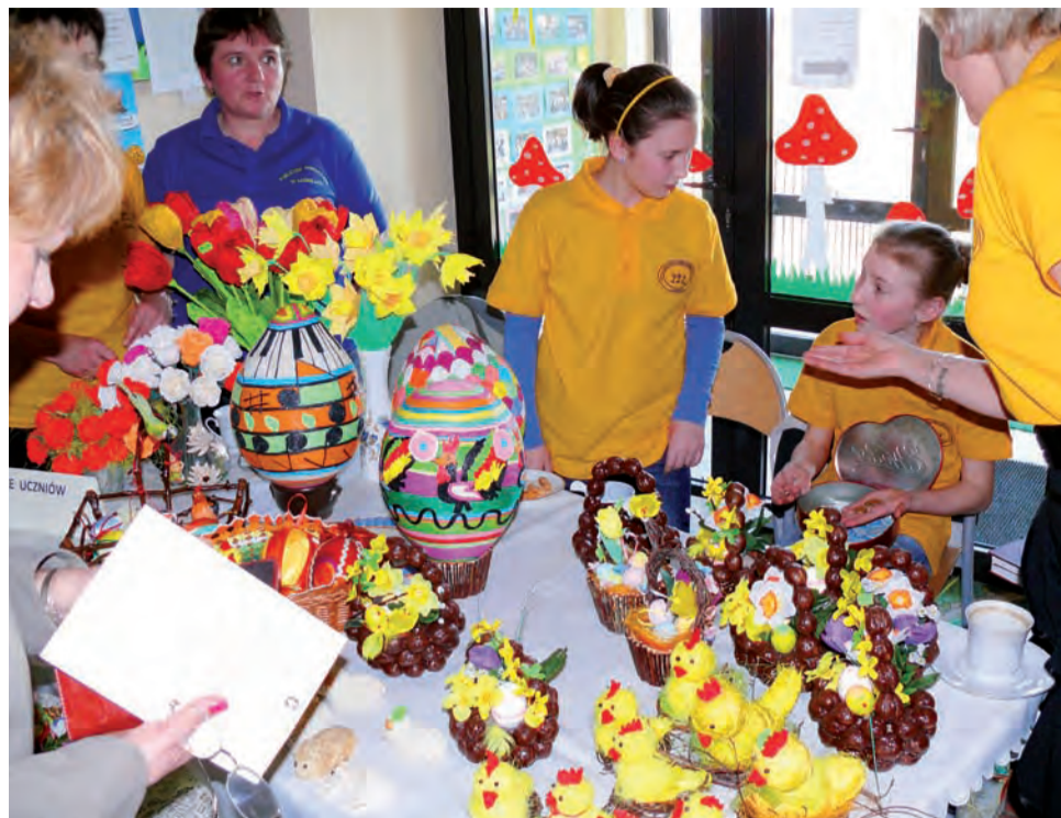
Pisanki różnej wielkości, papierowe kwiaty, wielkanocne koszyczki, kurczaczki i inne świąteczne gadzety można było kupić podczas kiermaszu towarzyszącego koncertowi w Sannikach.