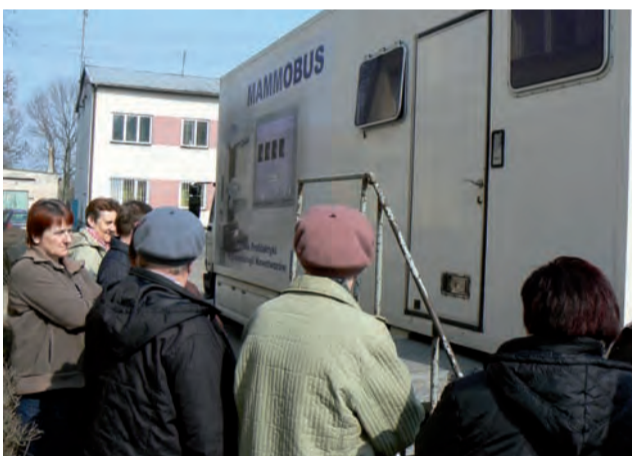
Mammobus w Bielawach. Mieszkaniczki chętnie korzystały z badania.

Podczas festynu zorganizowany został też mini konkurs „Wiem wszystko o Wielkanocy” i odbywały się zabawy dla dzieci na świeżym powietrzu. mak