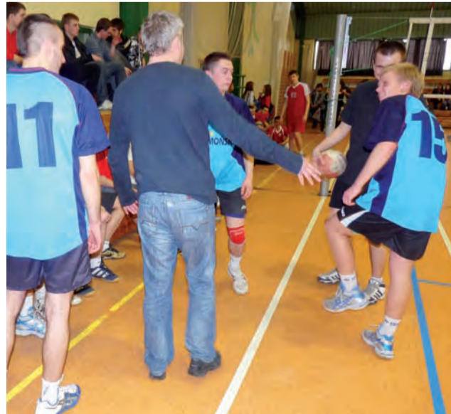
Łowiczanie odnieśli dwa zwycięstwa, ale na finał zabrakło już siły...