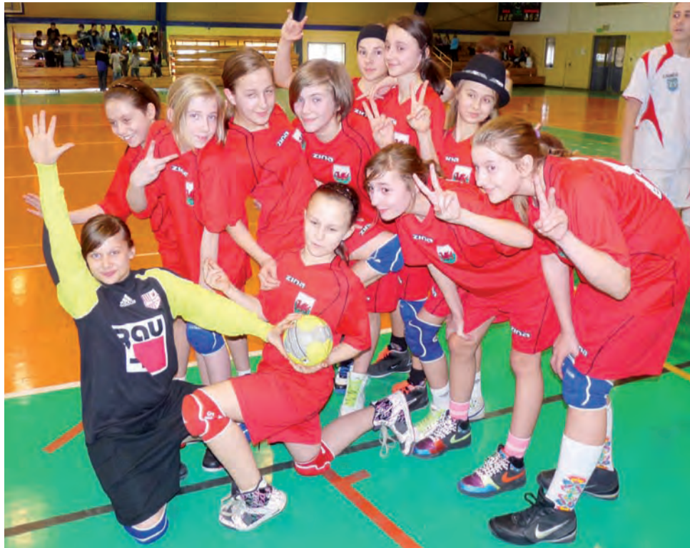
Koszykarki z łowickiej „Czwórki” wywalczyły awans na mistrzostwa województwa łódzkiego w minipiłce ręcznej dziewcząt.

■ SP 4 Łowicz - SP 4 Skierniewice 4:1 (3:1); br.: Aleksandra Sie-