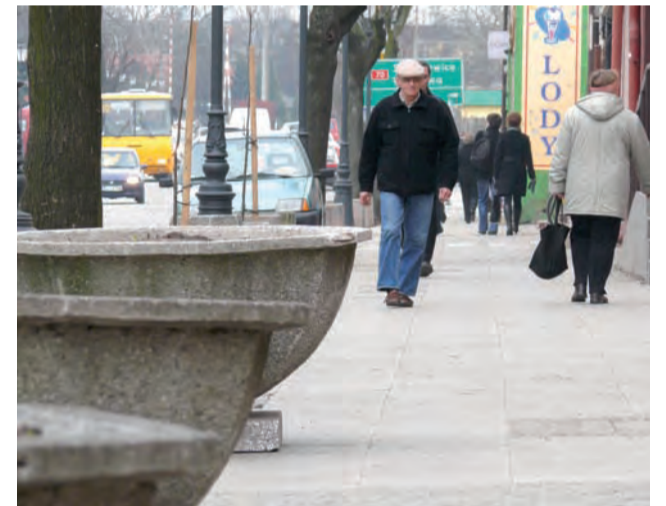
Donice z kwiatami blokują kierowcom dostęp do chodnika przy ul. 3 Maja, ale zawsze znajdzie się jakaś luka.

By uniemożliwić parkowanie samochodów ratusz ustawił na chodniku donice z kwiatami. Zmniejszyło to znacznie liczbę parkujących samochodów. tb