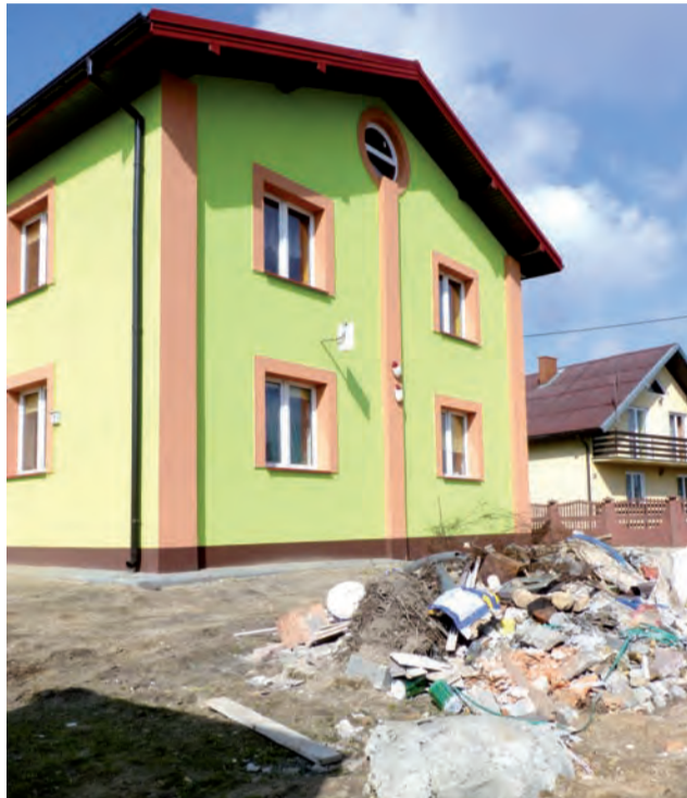
Gmina ma zastrzeżenia do jakości wykonanych prac na elewacji i terenu wokół biblioteki, który nie został na czas sprzątnięty.

Ma to swoje skutki w protokole odbioru. Uzyskana w drodze przetargu cena rozbudowy wyniosła 589 tys. 766 zł brutto (z czego 350 tys. zł wynosi dotacja na „Odnowę wsi” z Programu Rozwoju Obszarów Wiejskich), a po zwiększeniu zakresu prac wykonawca miał otrzymać łącznie 675 tys. 326 zł. Otrzyma o 100 tys. zł mniej, ponieważ teren budowy nie został sprzątnięty, a na elewacji jest wiele niedoróbek. Wstrzymane pieniądze wykonawca odzyska pod warunkiem wykonania pow. elewacji lub poprawek na tej zrobionej (w zależności od wyniku ekspertyzy). Jak do tej pory Probud nie dostał od gminy żadnych pieniędzy, ponieważ umowa przewidywała, że cała należność zostanie zapłacona po 30 dniach od odbioru inwestycji.