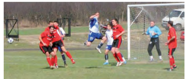
Orzeł odniósł cenne zwycięstwo z Jutrzenką Drzewce.