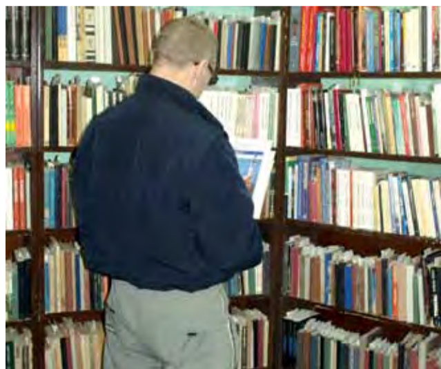
Skazani mogą korzystać z więziennych bibliotek.

– Wykonujecie zawód bardzo trudny, bo to od państwa pracy zależy, czy ci ludzie wyjdą lepsi – powiedział poseł, wspominając swoje związki z ZK w Łowiczu, gdy orzekał tu na posiedzeniach sądu penitencjarnego jako sędzia Sądu Wojewódzkiego w Skierniewicach. td