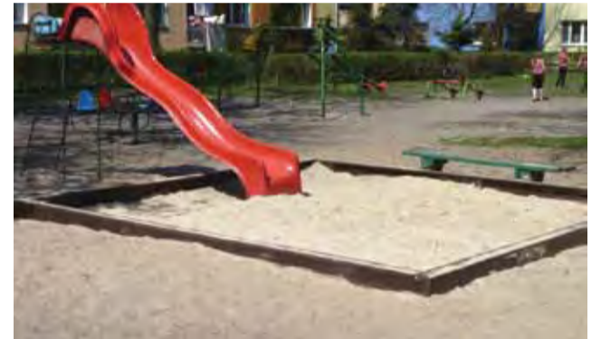
Piasek na placach zabaw został wymieniony, teraz remont przejdą ławki przy placach oraz wejściach do budynków.

Wymianę piasku w dziecięcych piaskownicach przeprowadziła w ostatnich dniach brigada remontowo-budowlana Łowickiej Spółdzielni Mieszkaniowej. Teraz kolej na przegląd, ewentualne naprawy oraz malowanie ławek przy placach zabaw, a potem przed blokami.