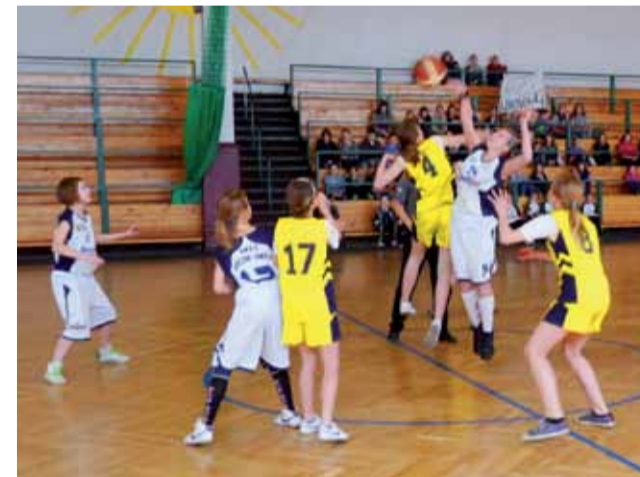
Praktycznie już pierwsze zwycięstwo z ekipą z Wieruszowa dał ekipie z Łowicza upragniony awans.