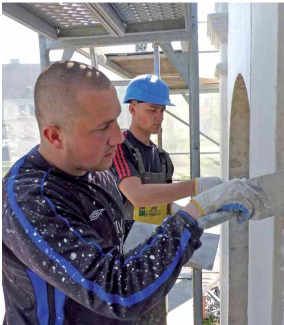
Coraz większe połacie elewacji zewnętrznej łowickiej katedry pokrywane są w ostatnich tygodniach nowym tynkiem. Tych pracowników spotkaliśmy na ścianie absydy w środę, 27 kwietnia.