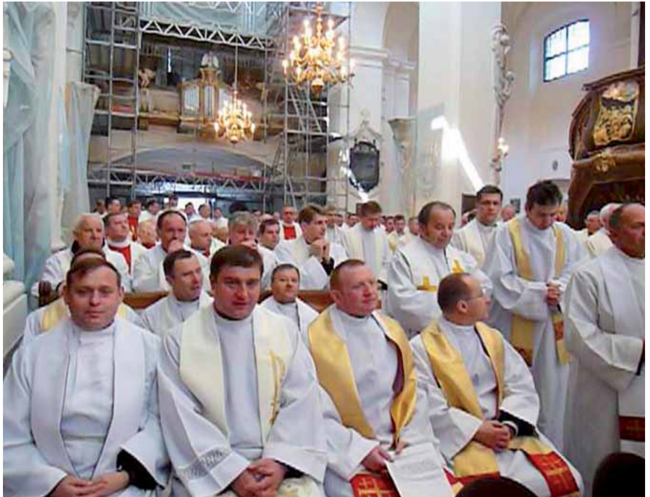
Wyjątkowy czas i miejsce. Wszyscy kapłani z łowickiej diecezji przybyli do katedry na mszę świętego krzyżma.