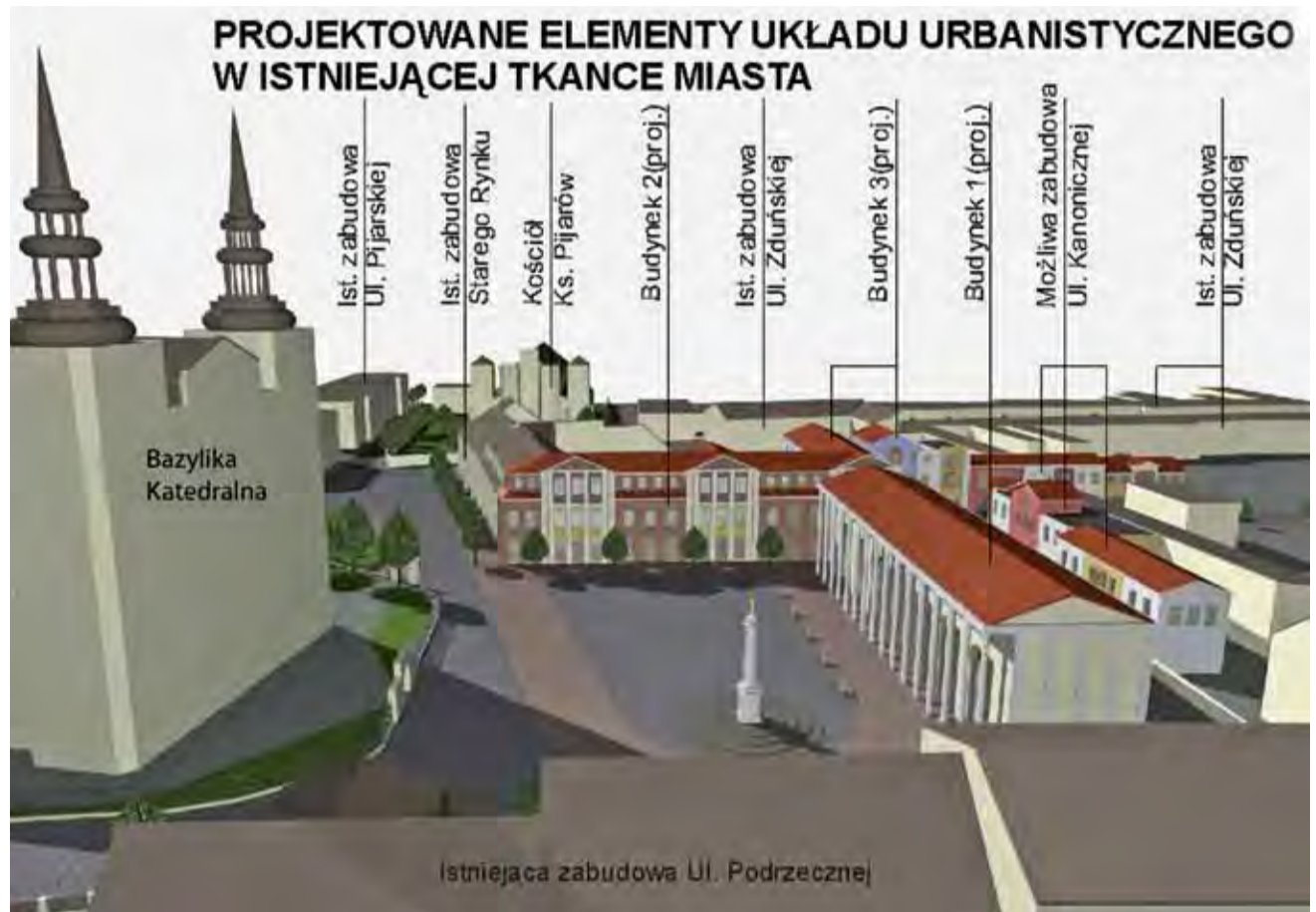
Budynki przy ul. Kanonicznej. Jak wybudować wysokie kondygnacje i jednocześnie zostawić wolny plac przed katedrą? W projekcie Jacka Gałaski jest to możliwe do przeprowadzenia.

Nowe budynki tworzyłyby widzialną z lotu ptaka literę T. Jeden, równoległy do budynków ul. Podrzecznej, byłby połączony pod kątem 90° z obecną siedzibą kurii. Dzięki takiemu zagospodarowaniu miejsca, mimo wybudowania wysokich budynków, nadal w bezpośred-