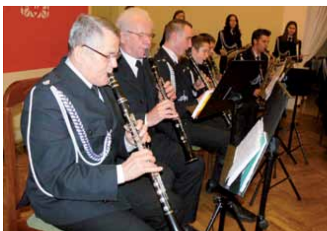
Miejska Orkiestra Strażacka wnioskuje o pieniądze i dostała 50 tys. zł.