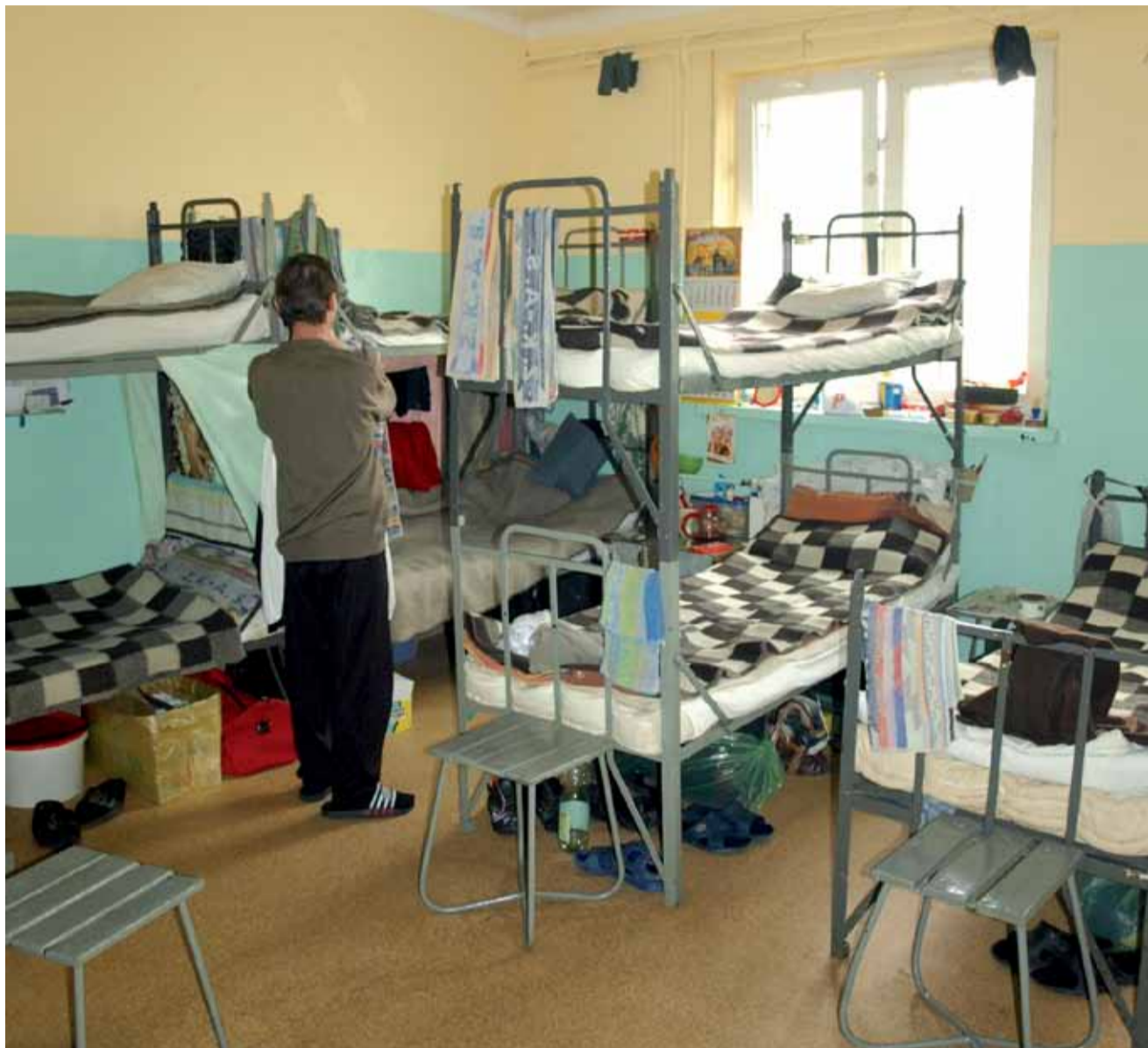
Zdaniem dyrektora ZK - wiele cel wymaga gruntownego remontu.

Dodajmy, że 10-osobowa grupa skazanych jest objęta nauczaniem w systemie e-learningu. Nauka odbywa się w ramach współpracy z Europejskim Liceum Ogólnokształcącym dla Dorosłych w Warszawie, za pośrednictwem internetu. System ten pozwala na ukończenie szkoły bez ko-