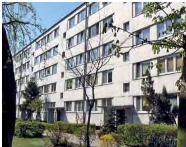
To z tego bloku planowana jest kolejna eksmisja. Czy dojdzie do skutku?

te 30 kwietnia zacznie już normalnie działać. Michalak powiedział nam, że znajdują się w niej wszystkie materiały promocyjne, które przygotowało miasto na tegoroczny sezon turystyczny, oprócz map, folderów, których w sumie ma być wydrukowanych 15 tys. sztuk, będą tam także wydawnictwa książkowe i albumowe o Łowiczu, pocztówki, smycze, breloki i kubki o tematyce łowickiej lub inspirowane twórczością ludową. tb