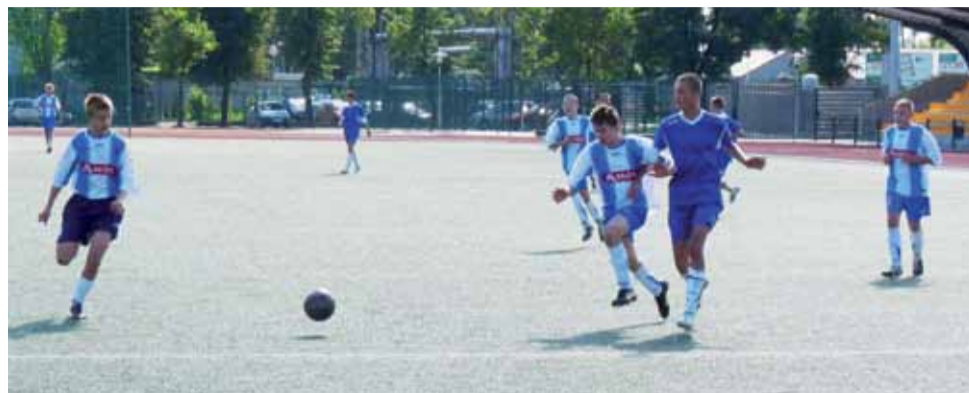
Piłkarska wiosna w okręgu skierniewickim w kolejny weekend ruszy już na dobre...