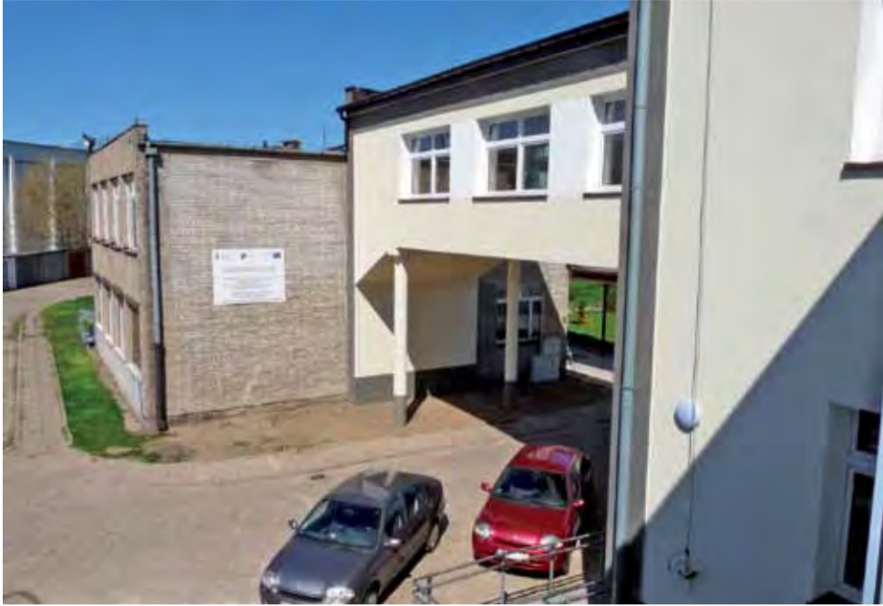
Dotychczasowy budynek szkoły połączony jest z dawnym budynkiem internatu widocznym łącznikiem.