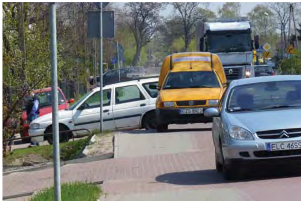
Tak wyglądała ścieżka rowerowa w piątkowe południe, 22 kwietnia.

Problemy ze swobodnym poruszaniem się po chodniku, będącym jednocześnie drogą dla rowerów, na ul. Łęczyckiej mają mieszkańcy os. Górki. Zdaniem jednego z mieszkańców, który zasygnalizował nam problem, zastawiony przez samochody chodnik często zamienia się w tor przeszkód.