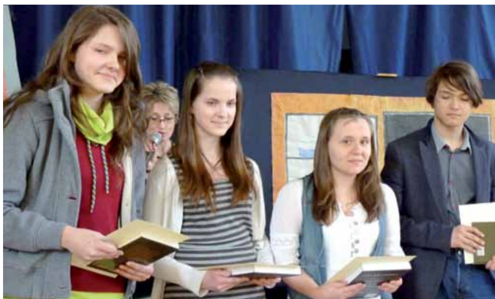
Laureaci trzech pierwszych miejsc w konkursie chemicznym.

Wystawa portretów Prymasów Polski z łowickich kościołów str. 26