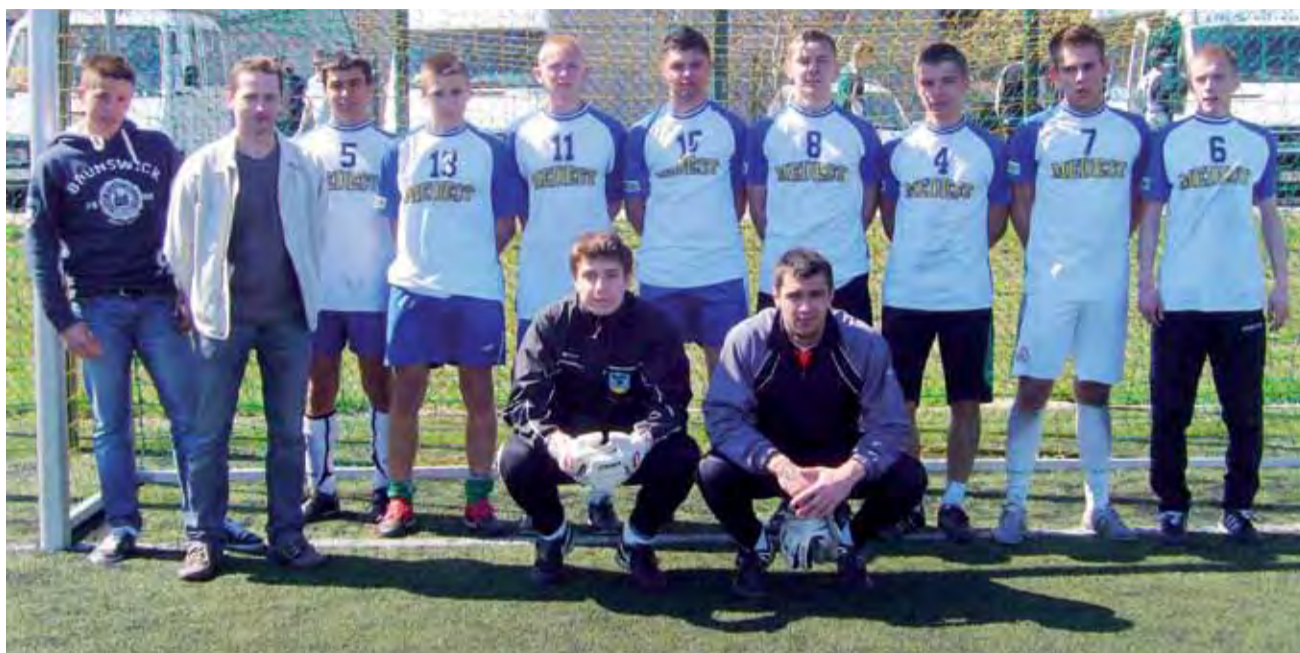
Reprezentacja Zespołu Szkół Ponadgimnazjalnych nr 4 w Łowiczu nie przegrała żadnego meczu, a mimo to zajęła tylko trzecie miejsce.