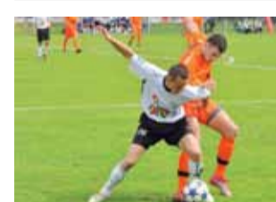
Czyżby „Mumię” czekała dłuższa pauza?