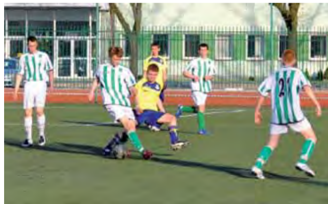
W Łowiczu Pelikan-94 nie dał większych szans sieradzkiej Warcie aplikując rywalom pięć goli.