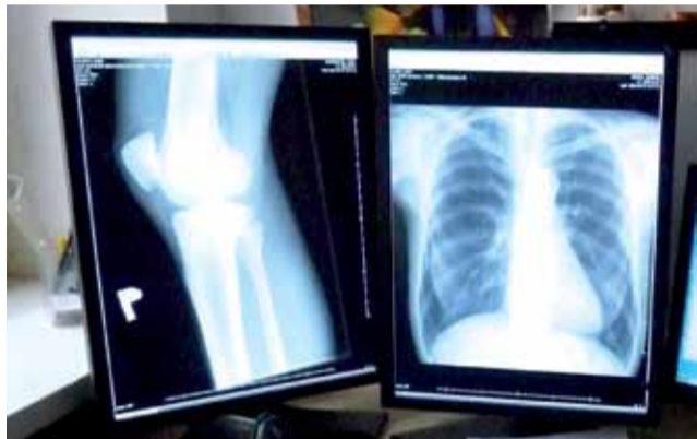
Zdjęcia cyfrowe lekarz może obejrzeć w każdym komputerze. Nie jest do tego potrzebne specjalistyczne oprogramowanie.

– Dla nas to nawet lepiej. Przychodnia jest całkiem skomputeryzowana. Jak pacjent przyniesie płytę, od razu ją wczytujemy i zawsze możemy do niej sięgnąć, jak będzie taka potrzeba. mwk