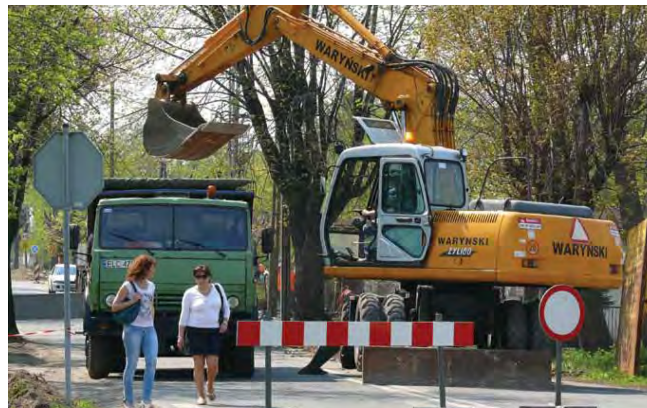
W środę przed południem zamknięty dla ruchu został wjazd w ulicę Chełmońskiego z ul. Poznańskiej. Tędy nie dojedziemy do centrum Łowicza do końca miesiąca.

Firma, na zlecenie inwestora, wybuduje na terenie oczysz-