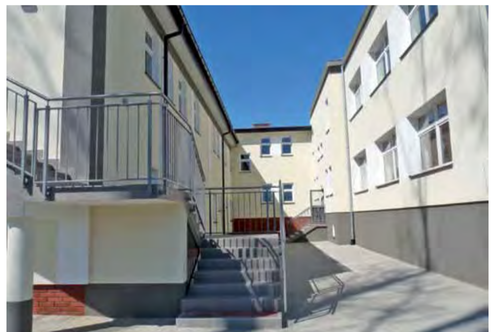
Po lewej stronie elewacja nowej sali gimnastycznej, po prawej – wyremontowanego budynku dawnego internatu SOS-W, na wprost – łącznik.

Obecnie trwają odbiory obiektu po budowie. Prawdopodobnie w maju szkoła będzie mogła już korzystać z sali gimnastycznej. Co do sal lekcyjnych i pracowni może to potrwać dłużej, bo potrzebne będzie wyposażenie. – Uroczyste otwarcie planujemy w nowym roku szkolnym. Czy będzie to 1 września, czy później, tego na razie nie wiem – mówi Jan Sałajczyk. – Na pewno będziemy