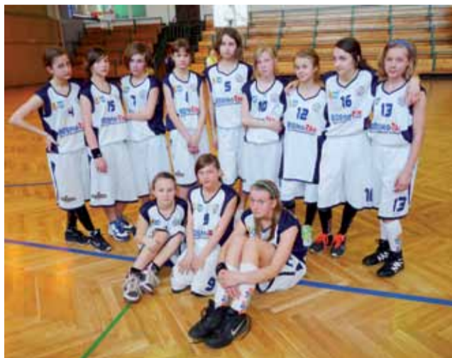
Koszykarki ze Szkoły Podstawowej nr 4 w Łowiczu awansowały do czterodrużynowego finału.

Nowy Łowiczanie. Tygodnik Ziemi Łowickiej, członek Stowarzyszenia Gazet Lokalnych.