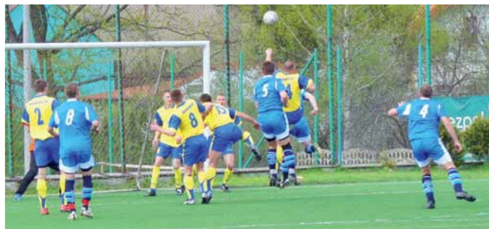
W Skierniewicach ekipa Czarnych Bednary uległa liderom rozgrywek 1:2.