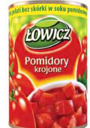
Pomidory całe, krojone i przecier pomidorowy to nowe produkty marki Łowicz. Zwracają uwagę swoimi barwnymi opakowaniami.

wiele innych znanych marek, nie zawsze mających związek z naszym miastem, z powodu nazwy lub miejsca produkcji. Są to: Fortuna (Karlova), Garden, Tarczyn, Pysio, Dr Witt, Krakus, Kotlin, Włocławek. Poza Łowiczem firma posiada zakłady produkcyjne w Tymienicach i Włocławku. W całej spółce pracuje łącznie ok. 2.300 osób. opr. mwk