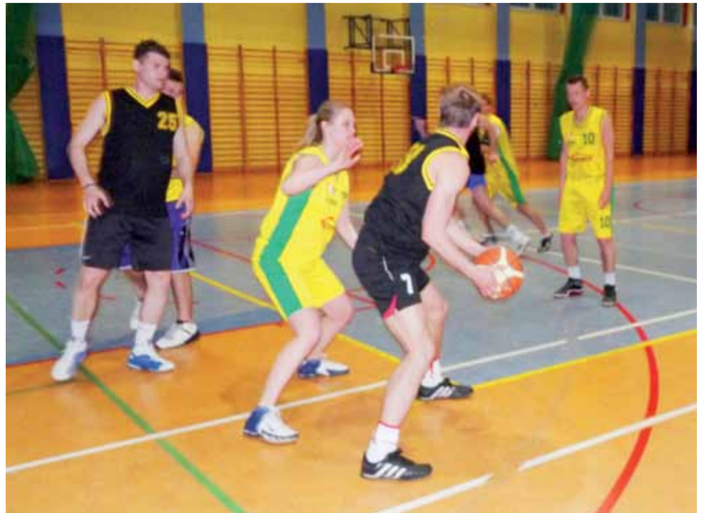
W pojedynku z faworyzowaną Oświęcią drużyna z Łowicza doznała porażki.