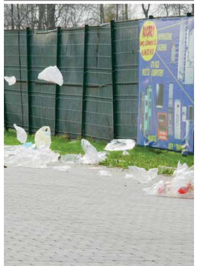
Tak w jedno z ostatnich sobotnich popołudni wyglądała droga dojazdowa do zaplecza marketu Kaufland przy ul. Starzyńskiego.

Wiatr sprawia, że folie, które dotarły tam prawdopodobnie z terenu miejskiej targowicy, raz wznosiły się do góry, raz opadały.