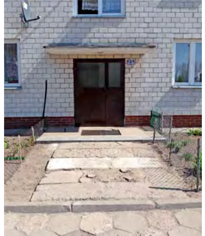
Wejście bloku przy ul. A. Krajowej 43M pozostawia wiele do życzenia.