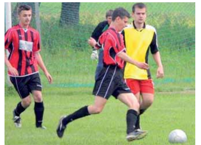
Zryw chce zagrać w klasie A.