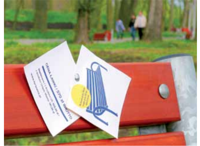
Jedna z ławek w parku Błonie, na której znalazła się informacja przygotowana przez łowickie koło FOR.

I jeszcze jedno: do tych 240 tysięcy należałoby spokojnie dorzucić prawie 32,5 tysiąca. Skąd? Tyle Łowicki Ośrodek Kultury przeznaczył na ubiegłoroczne Książackie Jadło. W tym roku ma być podobnie. Jak tego typu imprezę zaliczyć do kultury? Papier wszystko przyjmie. ■