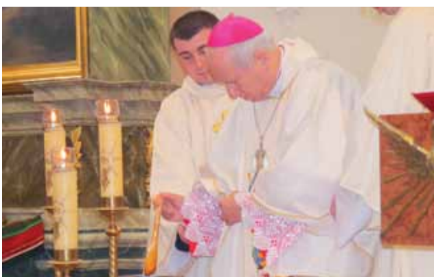
Wielki Czwartek. Bp Andrzej Dziuba najpierw drewnianą tyżką mieszał oleje – krzyżmo, by potem je poświęcić.