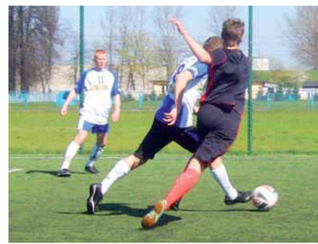
W małym finale padło aż dziewięć goli, a łowiczanie ostatecznie wygrali z rywalami z Bełchatowa aż 5:4 (3:2).

Sport szkolny | Półfinał Wojewódzkich Igrzysk Młodzieży Szkolnej w minikoszykówce dziewcząt