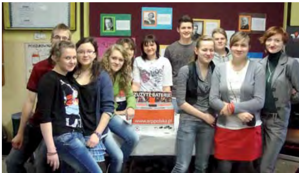
Uczniowie klasy I c wraz z opiekunem chcą walczyć o czyste środowisko

Przypominają, że elektrośmieci zawierają wiele szkodliwych i groźnych substancji, takich jak rtęć, ołów, kadm, brom, a także freon niszczący górne