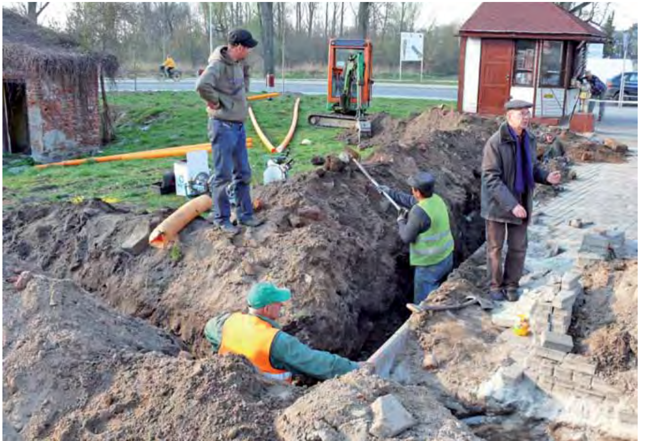
Prace przy wykonaniu przecisku pod ul. Mostową, dzięki któremu zasilony zostanie odcinek gazociągu wykonanego po drugiej stronie ulicy.

jącej sieci trzeba będzie jednak poczekać, w maju rozpoczyna się prace przy budowie sieci gazowniczej od przepompowni przy przedłużeniu ul. Klickiego, na terenie Zielkowiec, do ul. 1 Maja, Placu Koński Targ, Alei Sienkiewicza, dalej ul. Pijarską na Stary Rynek i dalej do istniejącej już sieci w ul. Starorzecze. Pozwoli to zasilić w gaz instytucje i prywatne posesje m.in. przy ul. Podrzecznej, Świętojańskiej i dalej Bonifraterskiej oraz Długiej. tb