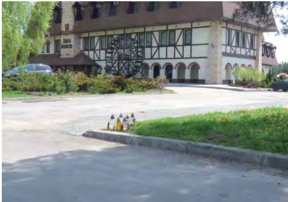
W miejscu, gdzie zabity został mieszkaniec Wrzeczka, rodzina i przyjaciele zapalili następnego dnia znicze.

Policja ciągle jeszcze ustala okoliczności zdarzenia, nie wszystko jest bowiem do końca całkiem jasne. Zabezpieczone zostały między innymi nagrania z wszystkich kamer monitoringu, które rejestrują obraz w sąsiedztwie lokalu, parkingu i stacji paliw. Policja jeszcze tej samej nocy oraz nad ranem następnego dnia zatrzymała 4 mieszkańców gminy Bolimów