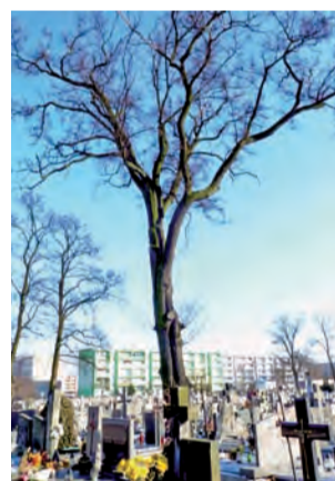
Drzewo z cmentarza przeznaczone jest do wycięcia.

U podstawy pnia widoczne są ubytki miękkie ze śladami spróchnienia. W koronie drzewa widoczne są ślady wylamań konarów i gałęzi, a posusz (martwa tkanka) wynosi około 30%. Drzewo rośnie bezpośrednio przy grobach, obumarłe gałęzie spadają na pomniki powodując zniszczenia. Drzewo zostanie wycięte przez specjalistyczną firmę w maju tego roku. mak