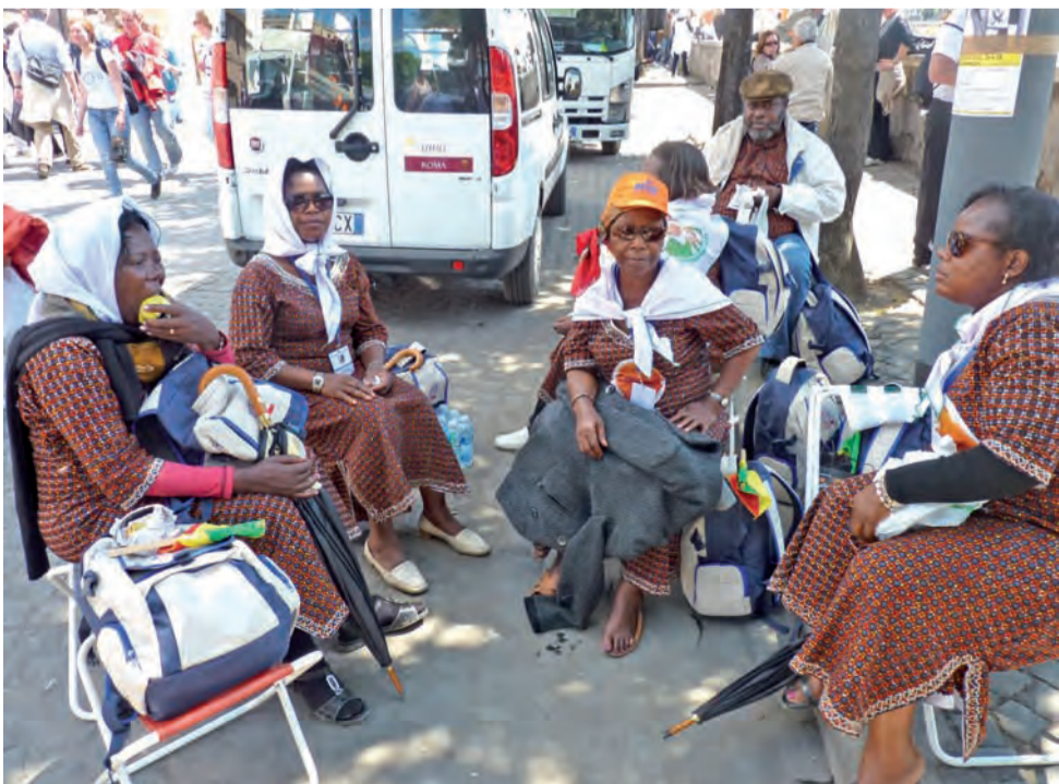
Pielgrzymi przybywali z całego świata. Ta grupa przyleciała z Konga Brazzaville.