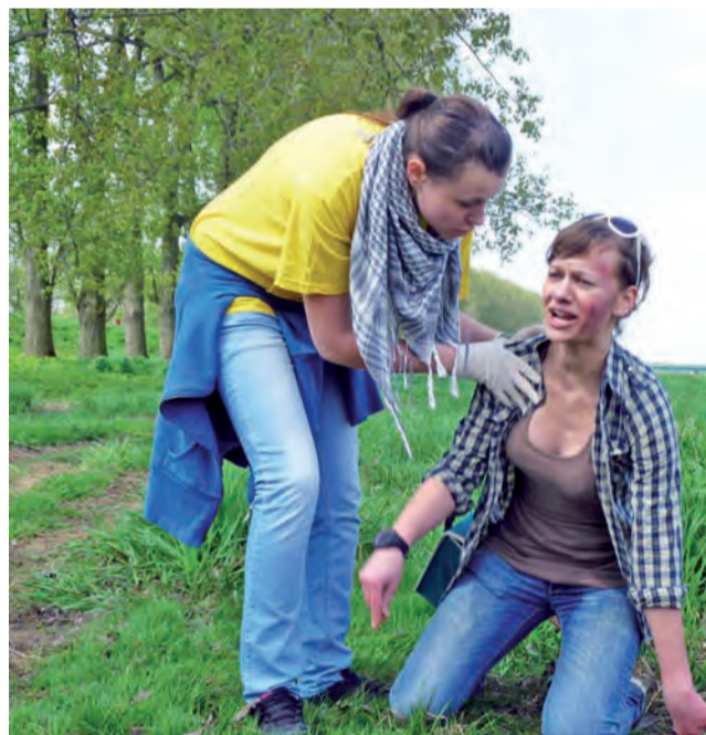
Pierwsza pomoc na Błoniach. Uczniowie z II LO bez wahania pomagali potrzebującym.

Podczas zawodów oceniano umiejętności. Zwracano uwagę na odpowiednie ułożenie poszkodowanych, działanie w rękawiczkach, techniki chłodzenia, udzielanie pomocy bez spowodowania dodatkowego bólu czy też zachowanie zasad aseptyki. W tym roku najlepsza okazała się grupa uczniów z II LO. Miejsce drugie zajęli uczniowie ze szkoły w Bolimowie, trzecie zaś druga drużyna z II LO. Warto przypomnieć, że w ubiegłym roku zwyciężyło również II LO. - Zadania były trudne, musieliśmy wykazać się wiedzą i umiejętnościami, ale także dobrą współpracą w grupie - podsumowują uczniowie. am