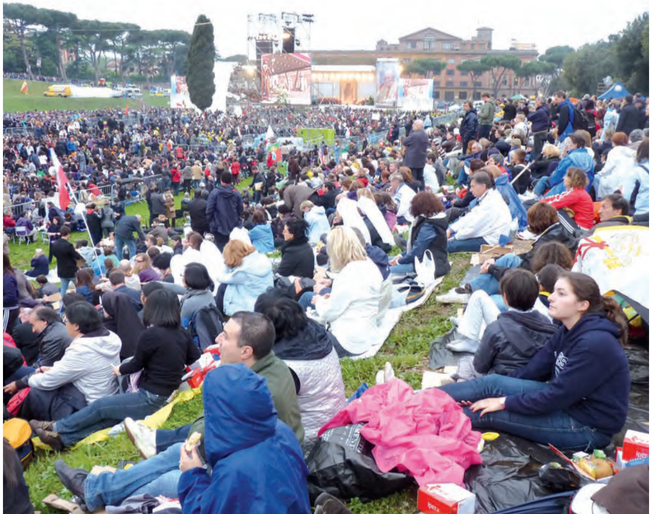
Circo Massimo, sobota, w oczekiwaniu na wieczorne czuwanie modlitewne.

Dzień później, mszę św. także przeżywaliśmy w byłym cyrku, które to miejsce było świadkiem męczeństwa tysięcy chrześcijan – bo na plac św. Piotra ani nawet na prowadzącą doń Via del Concilliazione się nie dostaliśmy. Wraz z nami w skupieniu w tej mszy uczestniczyło w tym miejscu około 100 tysięcy ludzi. Zdjęcia, które tu zamieszczamy, pochodzą w większości właśnie stamtąd. Zdjęcie ze mszy wykonane na placu św. Piotra jest autorstwa Doroty Filipowicz z łowickiej grupy. To ona trzymała nad grupą flagę Łowicza – więc na zdjęciach tej flagi nie ma. Ale w telewizji było ją widać. →