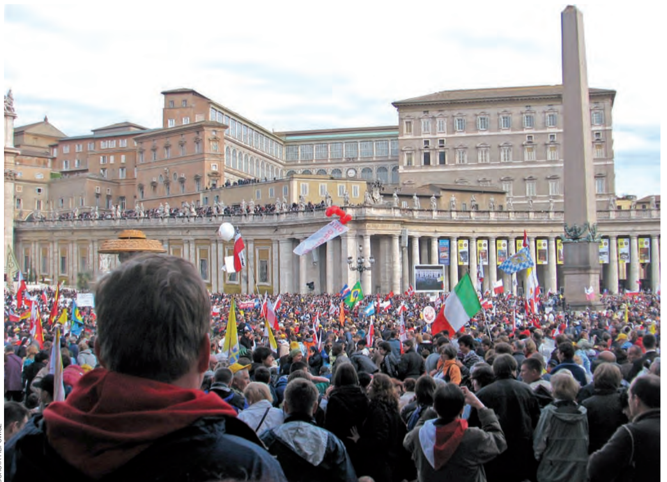
Plac św. Piotra był w niedzielę rano pełen pielgrzymów.