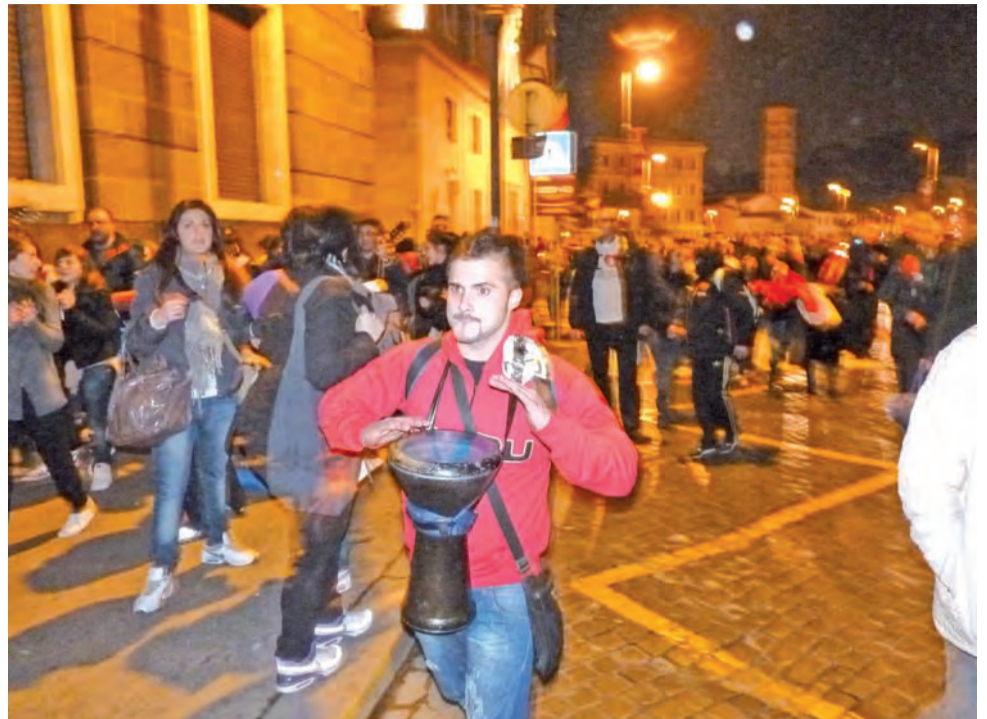
Ta hałaśliwa i sympatyczna grupa młodych to neokatechumenat z Tarentu na południu Włoch.

chać do nas. A przeżycia? Każdy miał swoje. Ja mam w głowie burzę myśli, które muszę poukladać. Najważniejsze, że dzięki temu mogliśmy być bliżej Boga.