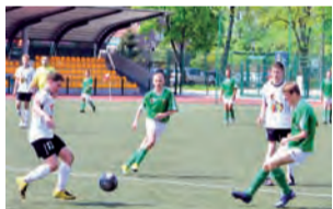
Pelikan-96 ma wciąż stratę pięciu punktów do „podium”.

Pierwsza część spotkania w Łowiczu nie była najlepsza w wykonaniu młodych Ptaków.