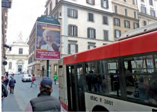
Ulice Rzymu w dniach beatyfikacji były oklejone takimi i podobnymi plakatami witającymi pielgrzymów.