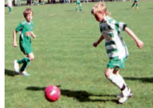
W derbach w lidze orlików