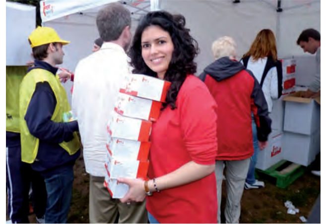
Pielgrzymom służyły tysiące włoskich wolontariuszy. Ta miła dziewczyna rozdawała paczki z prowiantem na Circo Massimo.