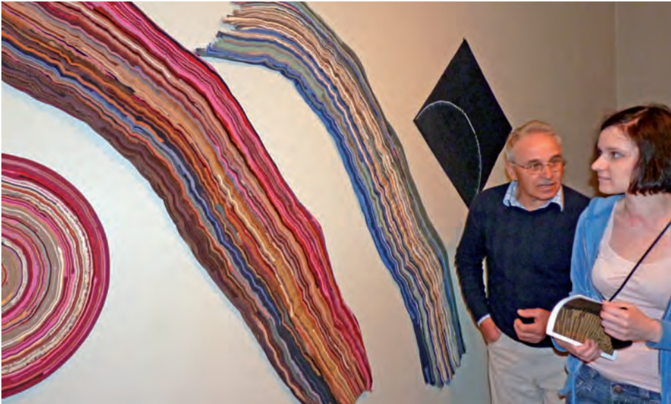
Na wernisażu pojawiło się około 50 osób, które podziwiali prace artysty.