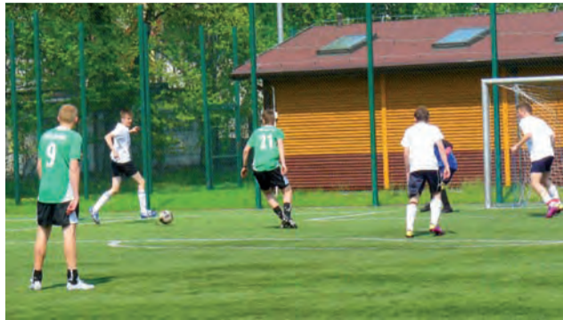
W każdym z trzech meczów w łowickim turnieju padało wiele bramek.