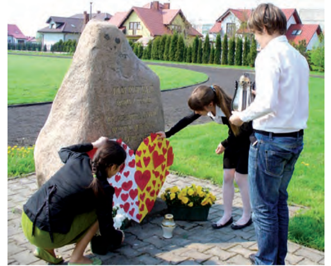
Pomnik w pobliżu szkoły to przede wszystkim pamiątka mszy św., którą Jan Paweł II odprawił w Łowiczu w 1997 r.