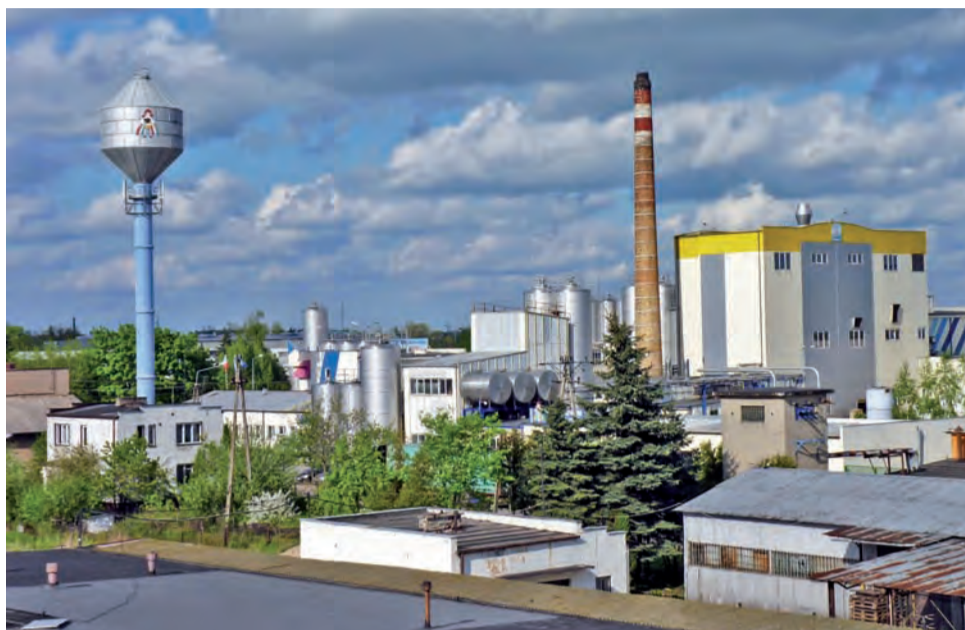
Łowicka OSM utrzymuje wysoką pozycję nie tylko wśród branży mleczarskiej.

Co roku jesteśmy w najlepszej trzasetce przedsiębiorstw i to cieszy.