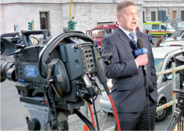
Dziennikarze pracowali przed Watykanem po kilkanaście godzin na dobę i więcej. Reporter TVP podczas nadawania korespondencji po mszy.