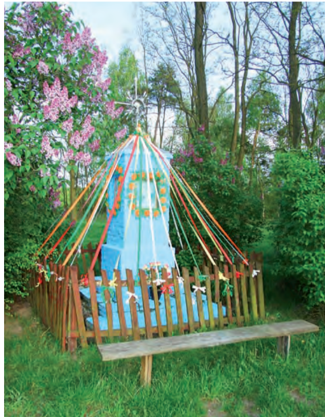
Tak wyglądała kapliczka w Seligowie w 2008 roku.

Kapliczka, której grozi zagłada, powstała około 1960 r.