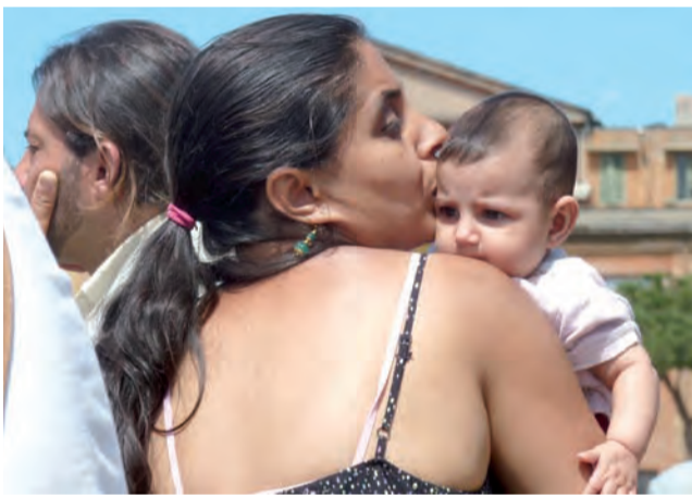
Na beatyfikację przychodzili ludzie starsi, młodzi... i najmłodszy.