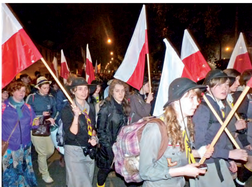
Po zakończonym czuwaniu w Circo Massimo do centrum miasta udaje się grupa polskich harcerzy z ZHR.