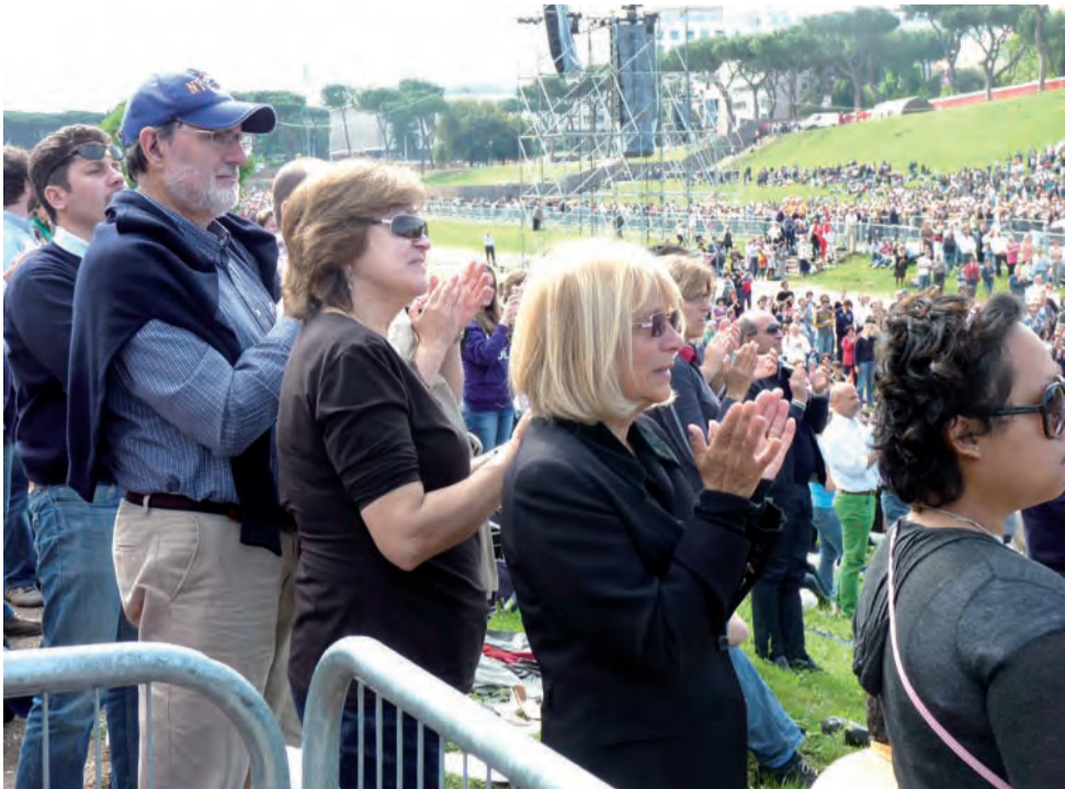
Circo Massimo, niedziela. Oklaski po tym, jak Benedykt XVI ogłosił Jana Pawła II błogosławionym.