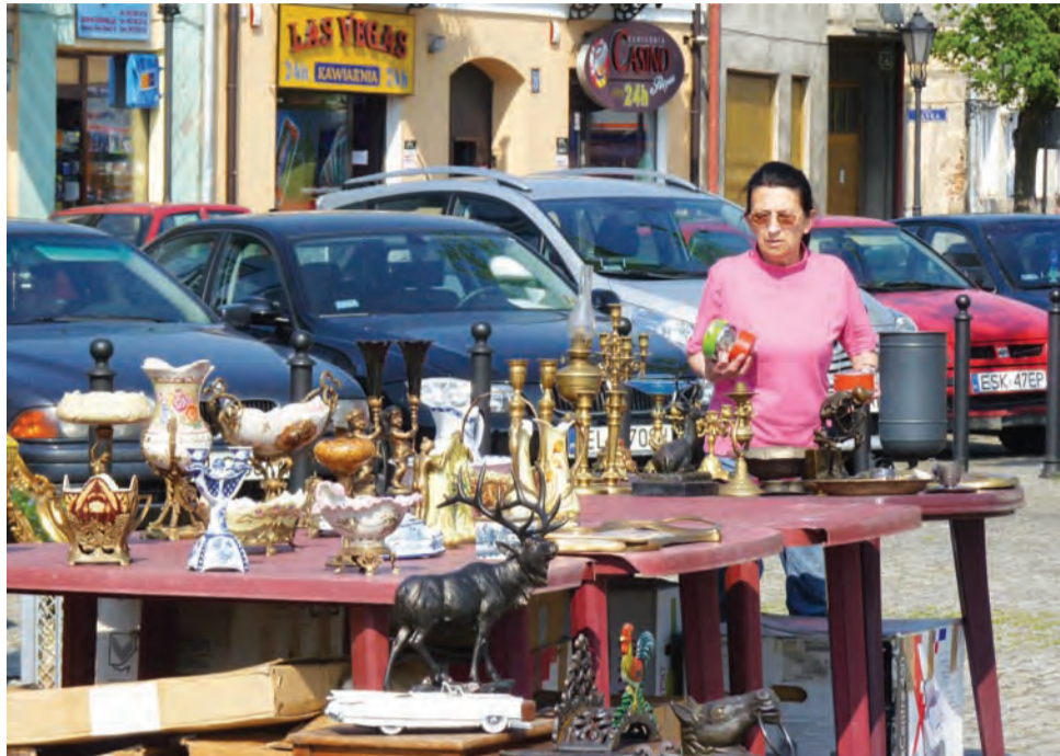
Przedmioty, które sprzedawane są na jarmarku pochodzą ze zbiorów różnych ludzi.

– Bywało nas więcej, ale z powodu długiego weekendu majowego i zapowiadanej deszczowej pogody w niedzielę, część osób zrezygnowała – mówiła jedna ze sprze-