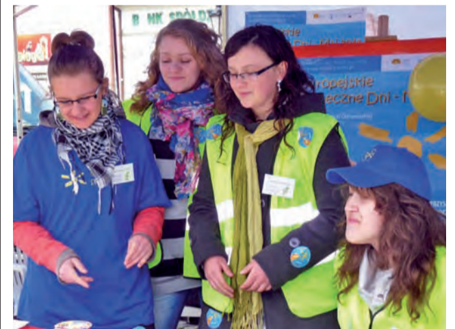
Grupa uczennic z I LO śpiewem i uśmiechem zachęcała do przyniesienia elektronicznych śmieci.

Przedstawienie, jak i konkurs to elementy programu edukacyjnego „Ekoprzedszkolak”, które realizują w tym roku szkolnym wszystkie łowickie przedszkola. jr