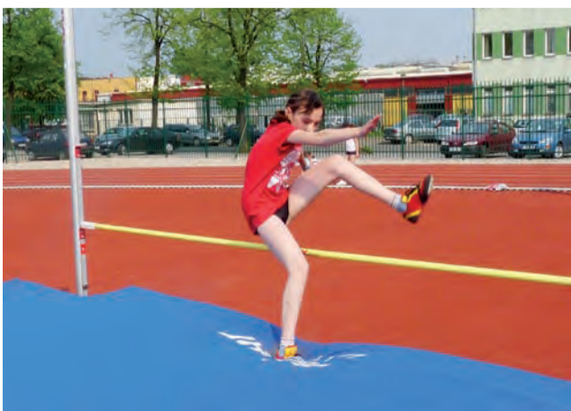
Chyba najbardziej „techniczną” konkurencją jest skok wzwyż.