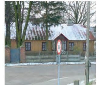
Plebania z Pszczonowa trafi do skansenu pod Łowiczem jeszcze w tym roku.

Dodajmy, że pszczonowska plebania została ofiarowana przez tamtejszą parafię jako darowizna 2 lata temu. Teraz udało się pozyskać pieniądze na rozebranie i przeniesienie budynku do Maurzyc. 95 tys. zł pochodzi z dofinansowania