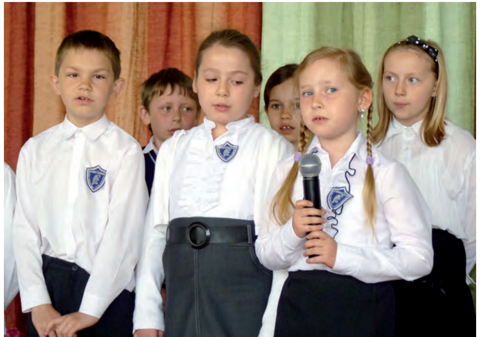
Uczniowie ze Szkoły Podstawowej z Bobrownik i z Mysłakowa zaśpiewali wspólnie dla papieża.