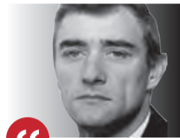
WALDEMAR WOJCIECHOWSKI przewodniczący komisji budżetu RP

ne będzie przyłączy gazowe – Centrum Promocji na Starym Rynku oraz Poradnia Psychologiczno-Pedagogiczna przy ul. Armii Krajowej.