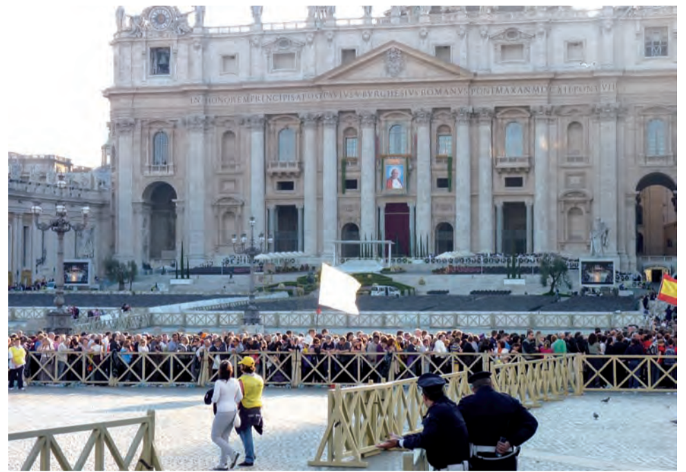
Niedziela popołudniu, już po beatyfikacji. Chcący oddać hołd doczesnym szczątkom błogosławionego ustawiali się w gigantycznej, wielogodzinnej kolejce prowadzącej do wnętrza bazyliki.