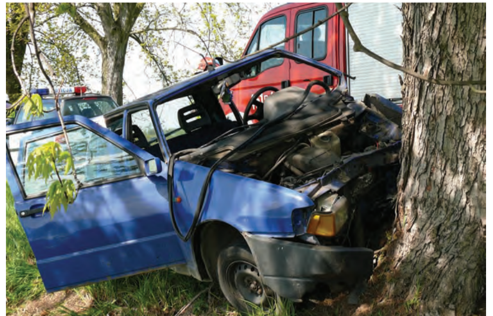
Żeby wyciągnąć kierowcę z Fiata Uno strażacy musieli w nim wyciąć drzwi.

wo. Opatrującym go ratownikiem medycznym mówił, że z naprzeciwka jechał inny samochód, wystraszył się i dlatego zjechał z drogi i uderzył w drzewo. Kierowca był trzeźwy. Samochód po wypadku nadaje się wyłącznie do kasacji. Kierowca może mówić o dużym szczęściu. Pierwsze pytania postronnych osób, które widziały samochód rozbity na drzewie, dotyczyły tego, czy kierowca przeżył. mak