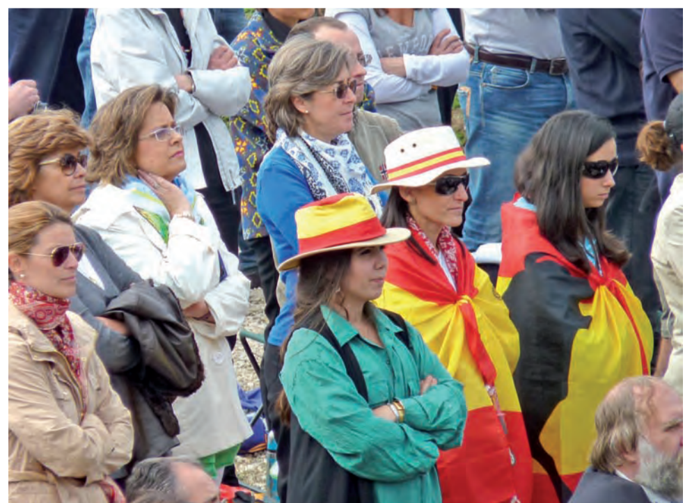
Hiszpanie byli, po Polakach, bodaj najliczniej reprezentowaną na uroczystościach nacją spoza Włoch.