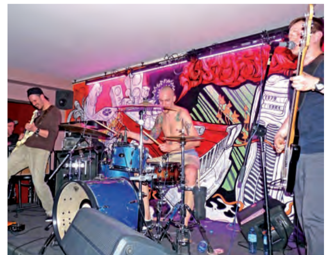
Zespół Plum grał w Łowiczu po raz pierwszy.

Na koncerty przyszło nie tylko wielu łowiczian, ale także przyjechały osoby z Łodzi, Warszawy, Żyrardowa i Skierkiewic. W piątek, 29 kwietnia koncerty Plum i Ed Wood trwały łącznie ponad 3 godziny, w sobotę, 30 – trochę krócej. Wszystkie zespoły grały utwory z najnowszych swoich płyt. W czasie festiwalu, dzięki ustanowieniu stoisku wytwórni mu-