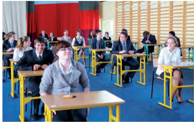
Uczniowie z pijarskiego liceum tuż przed rozpoczęciem egzaminu maturalnego.