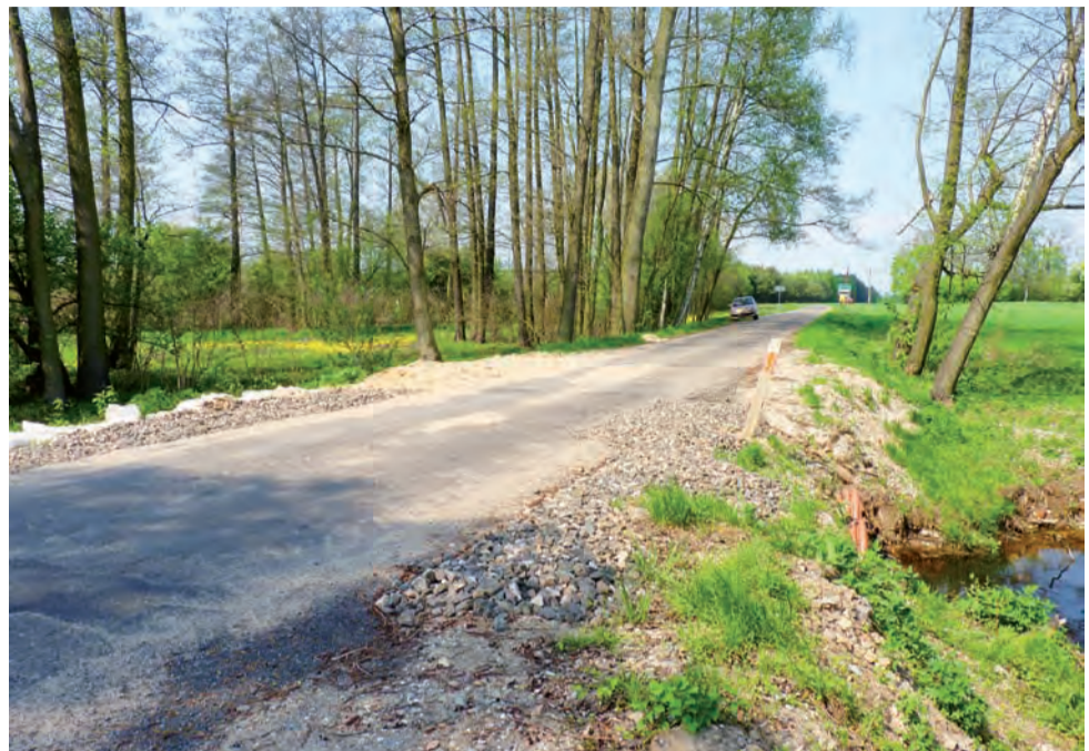
Jedną z dróg planowanych do remontu w ramach Narodowego Programu Przebudowy Dróg Lokalnych jest droga Otolice - Szczudłów, uszkodzona w wyniku powodzi.