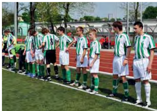
Łowiczanie w sezonie 2010/11 zajęli ostatecznie 9. miejsce.

Ogółem meczów rozegranych: 24, zwycięstw: 9, remisów 2, porażek: 13. Stosunek bramek: 41-52. Liczba punktów: 29.