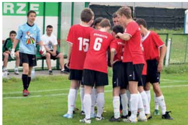
Pelikani-96, po udanej jesieni, ostatecznie wywalczyli szóste miejsce.