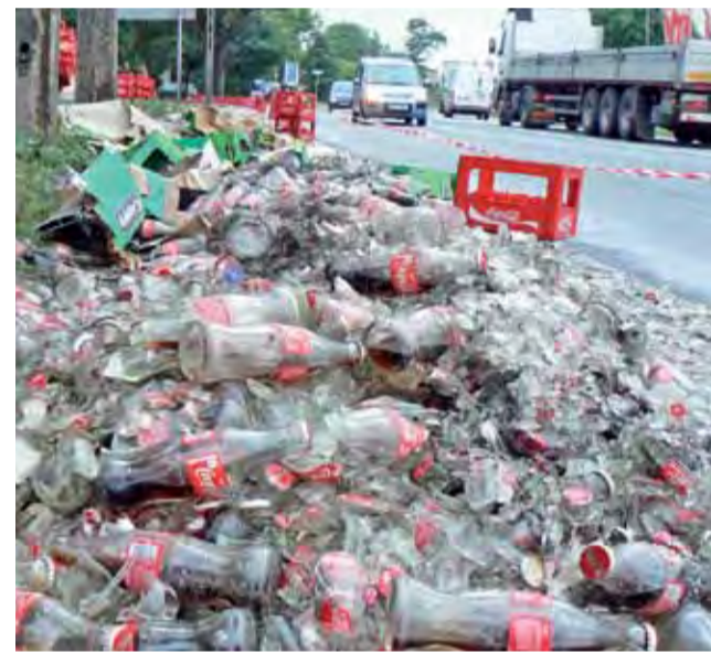
Kierowca DAF-a zbyt szybko wjechał w zakręt. W efekcie na ulicę wysypało się kilkanaście ton gazowanych napojów.

z przyczepy na pobocze i chodnik – opowiadał niebawem po zdarzeniu kierowca ciężarówki, należącej do firmy z Radomia. Szklane i plastikowe butelki w skrzynkach wysypały się na długości kilkunastu metrów. Akcja sprzątnięcia trwała kilka godzin. Zniszczeniu uległo 15 ton napojów gazowanych oraz poszycie naczepy. td