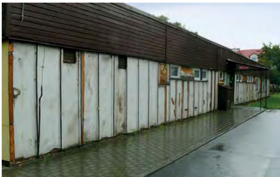
Firma spod Kutna demontując azbest ze ścian Przedszkola nr 4, nie ogrodziła oraz nie oznakowała terenu, tak jak jest to określone w wymogach bezpieczeństwa.

Strażacy ratowali bociana, który wypadł z gniazda. str. 15