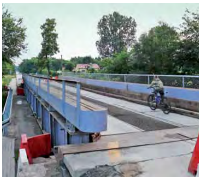
Na nadbudowaną konstrukcję mostu nad właściwym mostem będzie można wjechać dopiero po zapaleniu się zielonego światła.

Przymię śmieci i gałęzi leżących na placu manewrowym koło cmentarza przy ul. Seminaryjnej w Łowiczu gasili łowiccy strażacy w nocy z 27 na 28 czerwca około godziny 23.30. Ogień objął swym zasięgiem obszar około 15m 2 . Za przyczynę wybuchu pożaru uznano nieostrożność osób dorosłych w posługiwaniu się ogniem. td