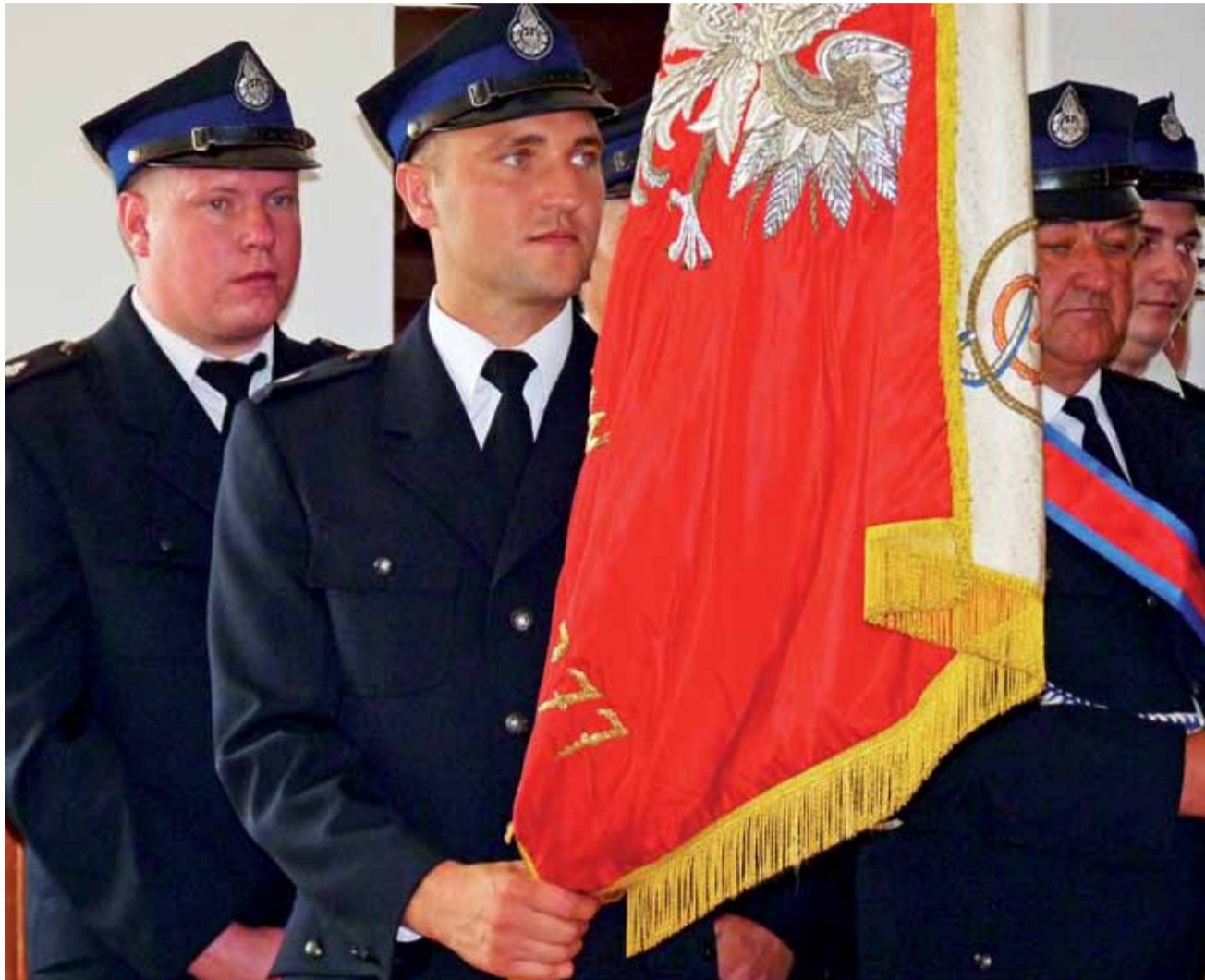
Na uroczystość w Wyborowie przybyły poczty sztandarowe okolicznych jednostek OSP.