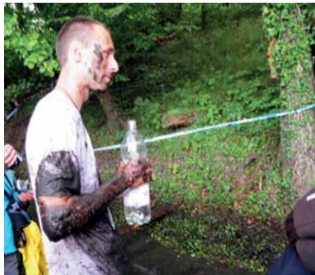
Na mecie najpierw łyk wody, a dopiero później do... wody.

Pływanie | Zapraszamy na XVII Maraton im. Pawła Pioruna