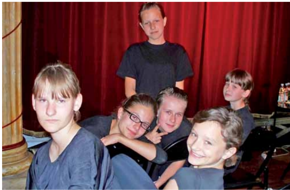
Grupa Trzy po trzy była jedną z najmłodszych grup biorących udział w festiwalu, na którym dominowali licealiści.

Trzecia scena jest najtrudniejsza do nazwania. Kłosińska mówi, że jest ona efektem obojętności lub przemocy, ale nie