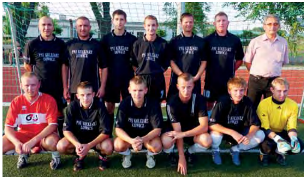
Na czele ligowej tabeli znajdują się kolejarze z PNI Łowicz.

Nowy Łowiczanie. Tygodnik Ziemi Łowickiej, członek Stowarzyszenia Gazet Lokalnych.