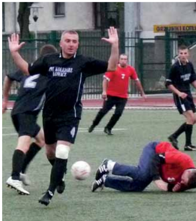
Ekipa PNI w meczu na szczycie lepsza od Bo-Dachu Grudze i stąd realna szansa na „majstra”.

■ ZNP Łowicz – Agros-Nova Łowicz 7:3 (4:1) ; br.: Remigiusz