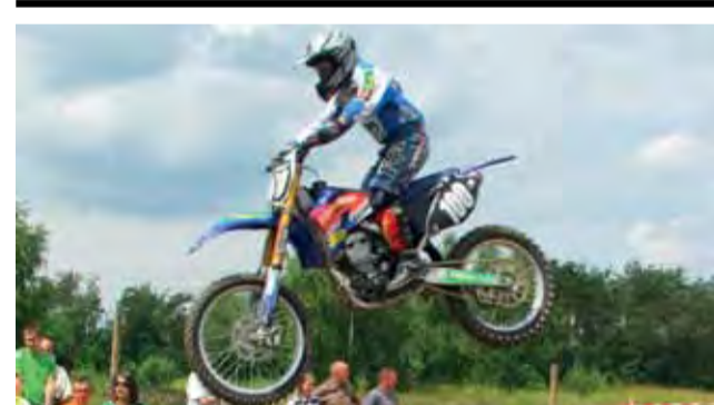
Poprzednie zawody w Nieborowie odbyły się w listopadzie 2010 roku.