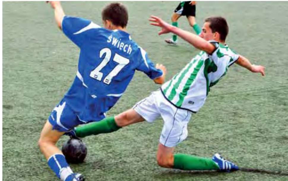
Pelikani-94 w nowym sezonie będzie występował w rozgrywkach ligi wojewódzkiej, ale juniorów starszych.

Po rundzie jesiennej pisaliśmy, że z tego zespołu już niebawem powinniśmy zobaczyć dwóch, trzech zawodników w zespole drugoligowego Pelikana. I tak się stało. W ostatniej kolejce w meczu ze Świttem