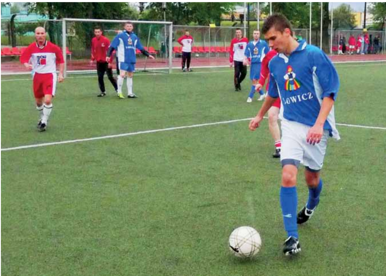
Piłkarze OSM Łowicz długo nie mogli znaleźć sposobu na rywala z Baumitu, ale ostatecznie wygrali 2:0.