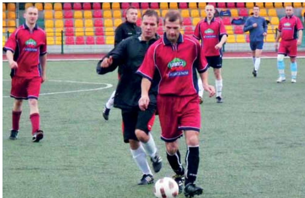
Nauczyciele z ZNP grają coraz lepiej i stąd podium w tegorocznej Wa-Li-Zy jest już prawie pewne...