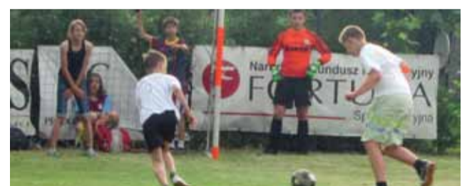
Harcerze z drużyn ZHP działających na terenie gminy Nieborów, przed rozpoczęciem wakacji rozegrali w Nieborowie turniej piłkarski.

Miejsce pierwsze zajęli starsi chłopcy z drużyny Laer Cuilin – „Jeszcze nie wiem”, drugie