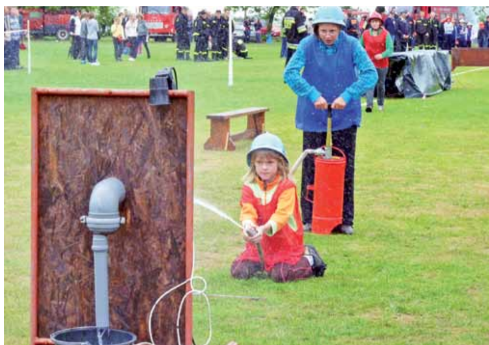
Mając 12 lat, można już brać udział w zawodach Młodzieżowych Drużyn Pożarniczych. Uczestników w tym wieku nie brakowało 3 lipca na boisku w Jackowicach, gdzie odbyły się zawody jednostek OSP z gminy Zduny. O ich przebiegu, wygranych drużynach i samej rywalizacji piszemy więcej na str. 17. jr

Muzeum w Łowiczu | Ponad 8 milionów na przebudowę