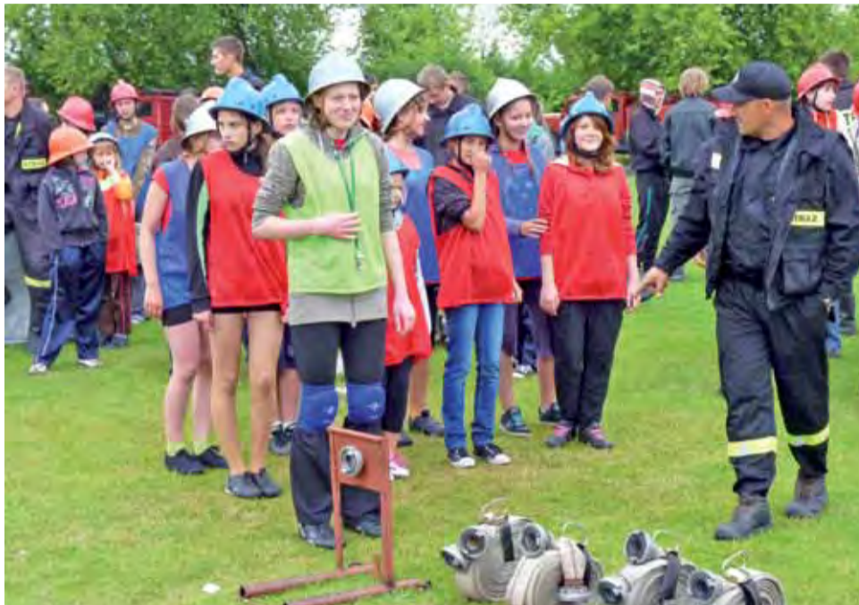
Na chwilę przed rozpoczęciem zawodów, wszystkim udzielała się lekka trema.

W kategorii MDP dziewcząt I miejsce zajęła drużyna z Bogorii Dolnej. Druhny zdobyły łącznie 1005 punktów. Za nimi uplasowały się na II miejscu na podium dziewczęta z Bąkowa Dolnego ze zdobytymi 983 punktami. III miejsce zajęły natomiast drużyny z Bąkowa Górnego z 964 punktami.