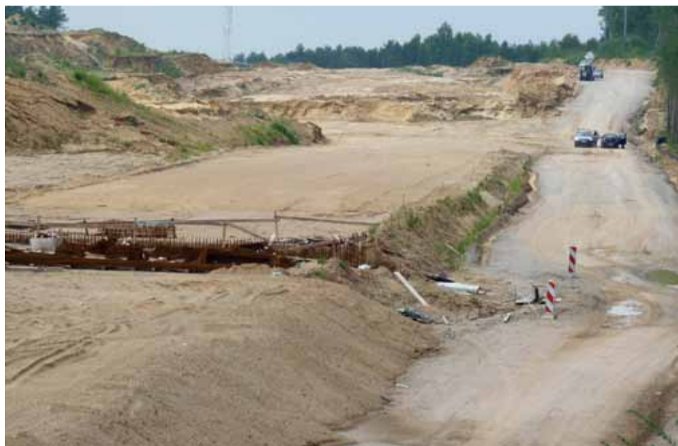
Na opuszczony przez Chińczyków plac budowy w okolicach drogi z Kalenic do Głowna wkrótce wróci ciężki sprzęt.