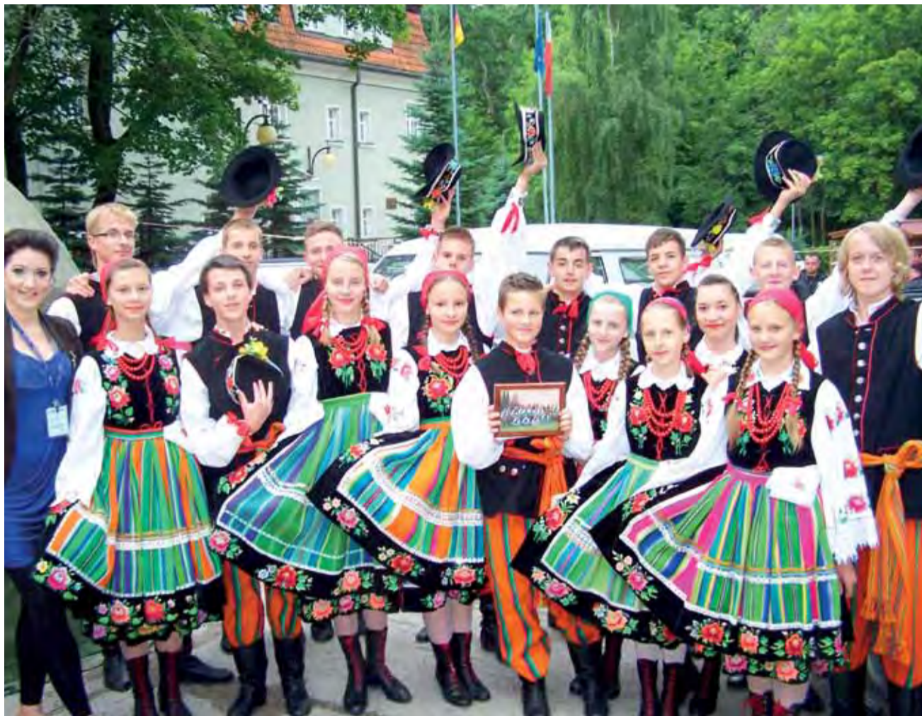
Kodereki z festiwalu w Olsztynie tak jak z Bośni, mogły wracać do domu szczęśliwe. Na Mazurach ich występy przyjęto z dużymi uznaniem.

A skąd tańce łowickie w brazylijskim wykonaniu? Otóż