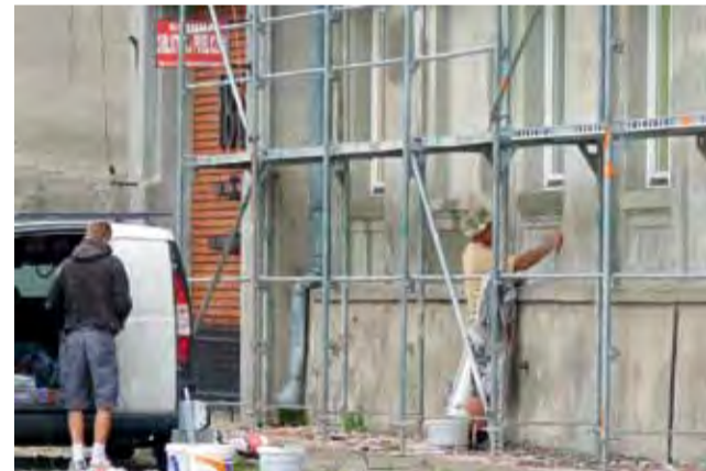
Remont elewacji „Mydlarni” rozpoczął się od strony zabytkowej bramy oraz wejścia do biblioteki gminnej

W ubiegłym roku wspólnota własnymi siłami wykonała remont około 30 kominów na budynku. Wcześniej natomiast została przeprowadzona wymiana sieci elektrycznej w budynku, a kilka lat temu został przeprowadzony gruntowny remont dachu. Trwające teraz roboty przy elewacji zewnętrznej powinny zostać zakończone jeszcze przed zimą. mak