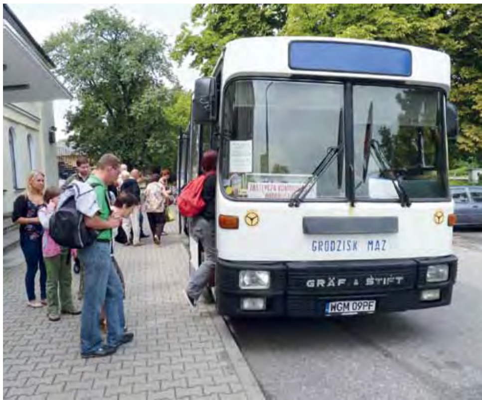
Autobus o godzinie 13.24. przyjechał punktualnie. Pasażerowie nie narzekali, a dla każdego znalazło się miejsce siedzące.

Zastępcza komunikacja została uruchomiona 30 i 31 lipca pomiędzy Łowiczem i Sochaczewem. Spowodowane było to wymianą toru pomiędzy Bednarzami a Sochaczewem. Zamiast pociągu Kolei Mazowieckich 4 razy pod dworzec podjeżdżał autobus z PKS w Grodzisku Mazowieckim. 2 kursy odbywały się w godzinach porannych, a 2 po południu. Podobne zmiany przewidziane są 5 i 6 sierpnia. Autobusy odjadą z dworca o godzinie 5.30 (dotyczy pociągu o 6.09), o 6.40 (pociąg z 7.09), o 9.20 (pociąg z godz. 10.19), ale autobus jedzie tylko do Bednarz, gdzie pasażerowie znów przesiadają się do pociągu i o godzinie 13.25 (dotyczy pociągu z godziny 14.05). td