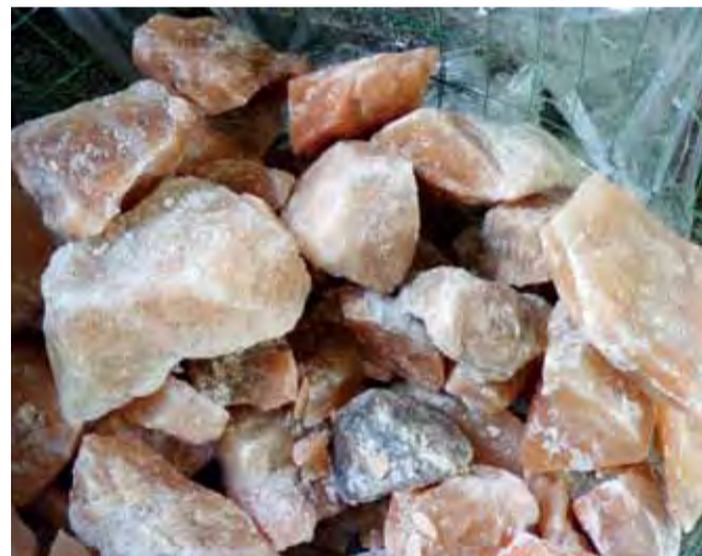
Bryły soli, które posłużyły do zbudowania ścian w grocie solnej, stały przez pewien czas w holu pływalni miejskiej.

Panujący w grocie solnej mikroklimat przypomina ten, który mamy nad morzem. Grota będzie zamykana przezroczystymi drzwiami. Będzie można do niej wejść tak jak do sauny. Najpierw będzie trzeba skorzystać z szatni, w której zostawi się rzeczy, a później w kłapkach przejść do grotty.