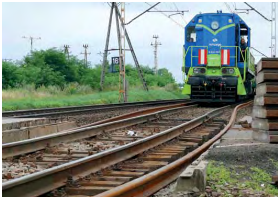
Tamara bardzo często wykorzystywana jest podczas modernizacji torowisk.