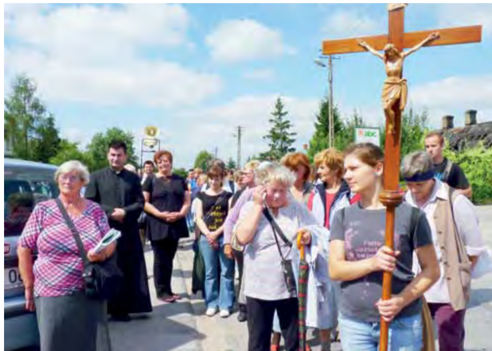
Pielgrzymi zatrzymali się na chwilę przed Urzędem Gminy w Bolimowie, gdzie spotkali się z pracownikami urzędu i GOK.

Łowicz | Ponad setka pątników wędrowała do Miedniewic