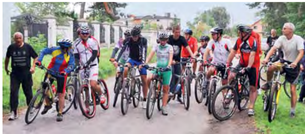
Rok temu łowicki cross rowerowy na zakończenie wakacji na pewno był udany...

Tak, oczywiście. Ja nawet zachęcam wszystkich do wcześniejszych zapisów. To ułatwi nam organizację. Będziemy wiedzieć ile przygotować nagród. Zapisać można się telefonicznie dzwoniąc do mnie na numer 664-70-31-39 lub do OSiR Łowicz na numer 46-830-20-28. Zapraszamy gorąco do udziału. Spotkajmy się w sobotę 27 sierpnia na łowickich Błoniach i pojedźmy rowerami wzdłuż Bzury. ■