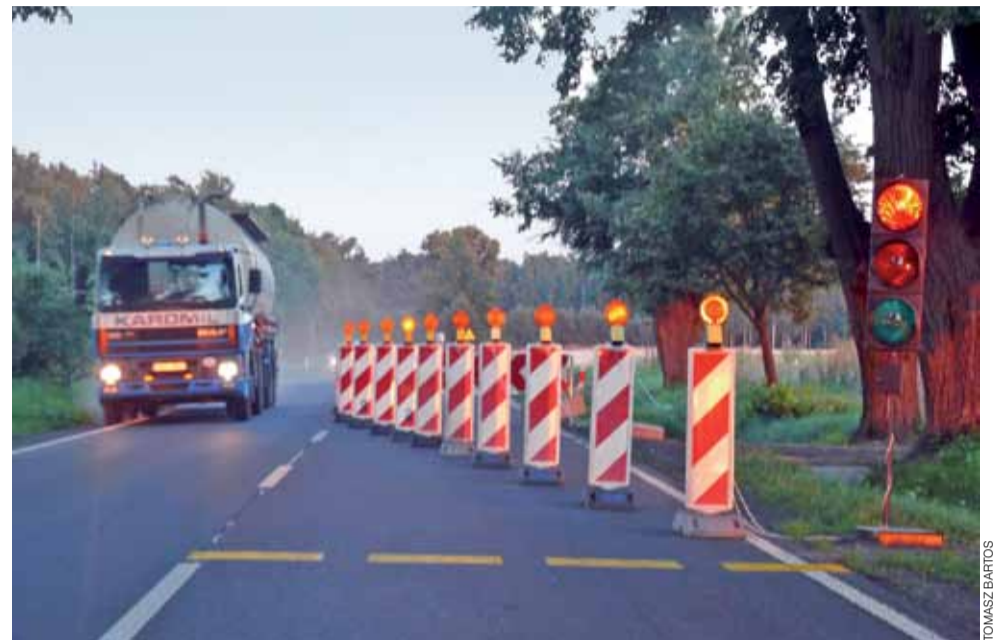
Jadąc do Skierniewic , czekają nas utrudnienia, na wysokości Zygmunta, przed Nieborowem, ruch odbywa się jednym pasem drogi, a steruje nim sygnalizacja świetlna.

W drodze do Skierniewic można alternatywnie korzystać z objazdu tego miejsca przez Arkadię, Bobrowniki i Dzierżogów, natomiast do Nieborowa można dojechać przez Mysłaków i Julianów. tb