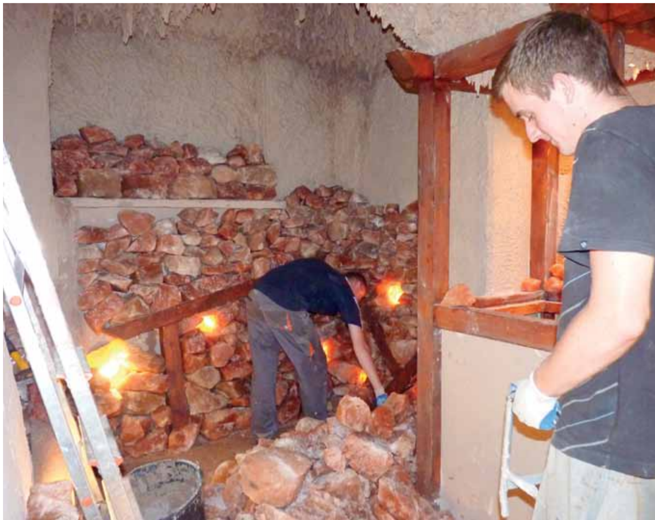
Tak to będzie wyglądało. Pracownicy szczecińskiej firmy instalowali już podobne grotty w kilku miejscach w Polsce.

W grocie nie będzie dodatkowego nawilżenia. Będzie natomiast stał mały wentylator. Czyste, zjonizowane powietrze, które powstanie w grocie, dzięki znajdującym się w niej kryształom soli, ma przede wszystkim właściwości relaksacyjne.