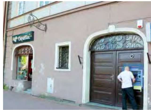
Elewacja kamienicy nr 11 wymaga od dłuższego czasu remontu, ale w najgorszym stanie jest przeciekający dach.

Zakres prac obejmuje wymianę poszycia dachu z obecnych płyt onduliny na blachodachówkę, uzupełnienie bądź wymianę obróbek blacharskich, a także wymia-