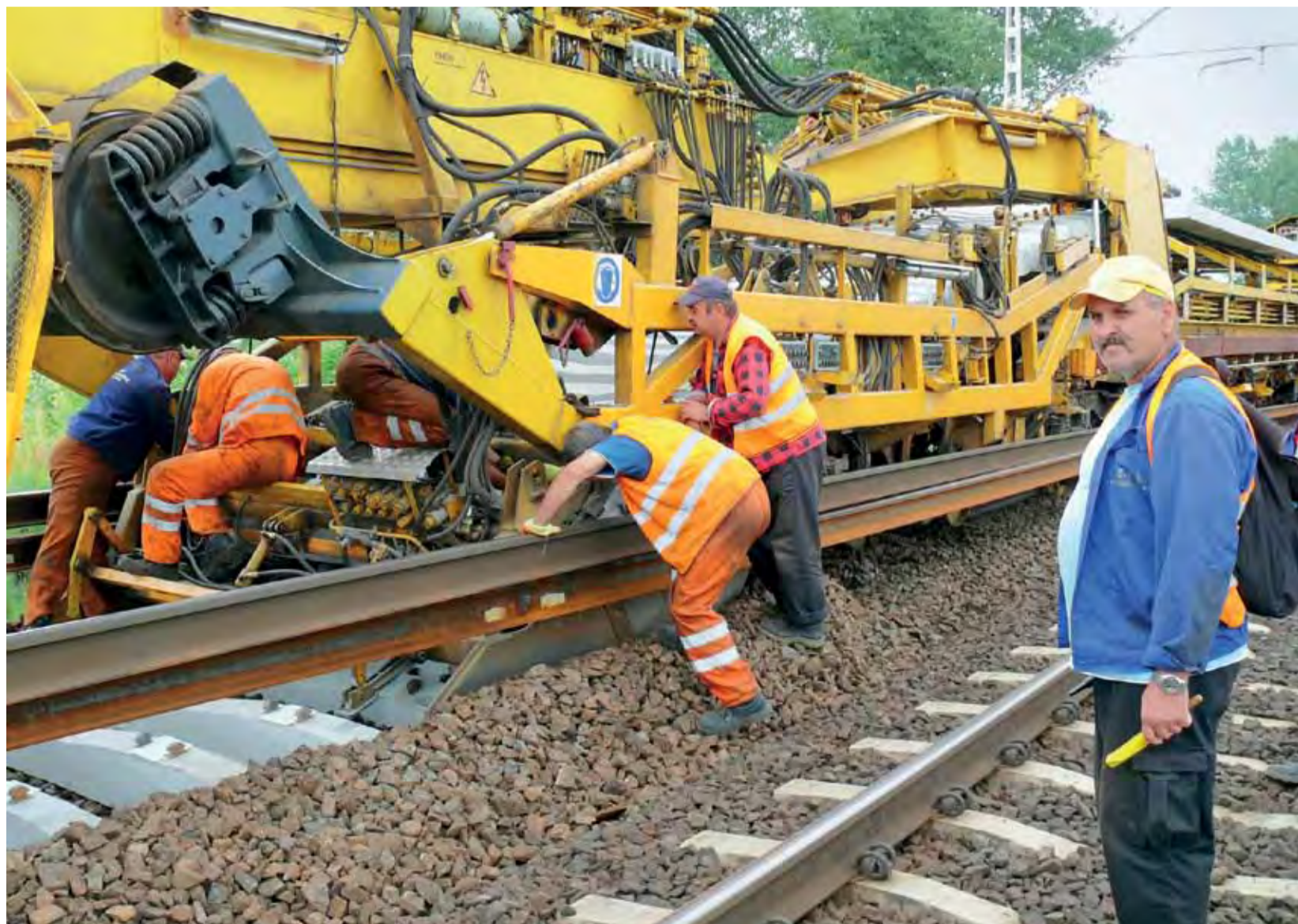
PUN-2 obsługuje kilkunastu pracowników, wśród nich jest osoba odpowiedzialna za informowanie trąbką sygnalizacyjną o nadjeżdżającym po innym torze pociągu.