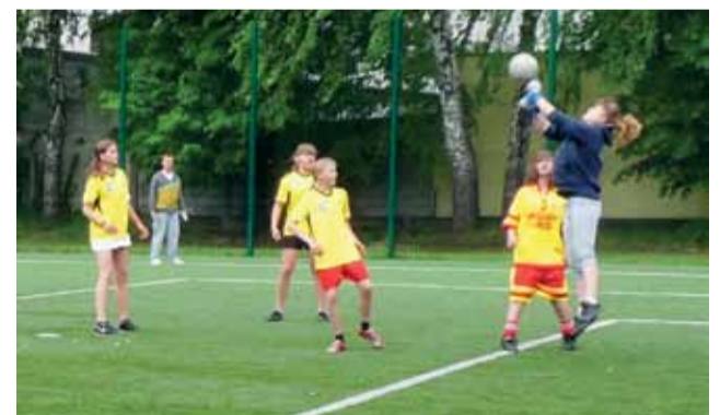
Gimnazjalistki tym razem w piłkę nie pograły...