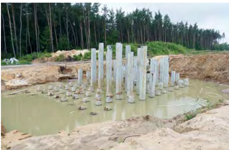
Zalana wodą konstrukcja żelbetowa mostu na Mrodze pod Dmosinem bez osuszenia nie nadaje się do kontynuacji robót.