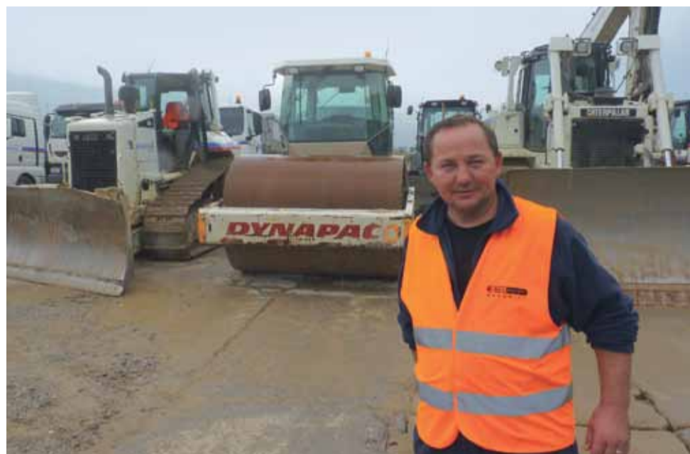
Sprzętu, który już stoi w bazie pod Łyszkowicami, przez całą dobę pilnuje wynajęta ochrona.