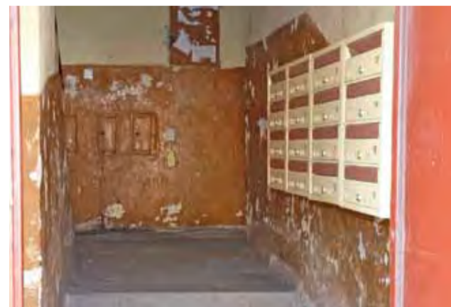
To jest klatka schodowa w budynku komunalnym przy ul. Armii Krajowej, w którym J. otrzymała mieszkanie tymczasowe.

Kiedy starszy pan umarł pod koniec marca 2008 r., kilka dni później, 6 kwietnia, nauczycielka