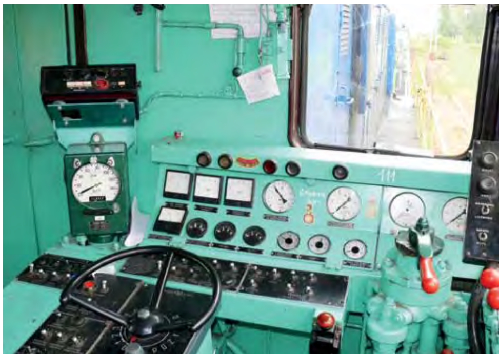
Wnętrze rosyjskiego spalinowozu Tamara.