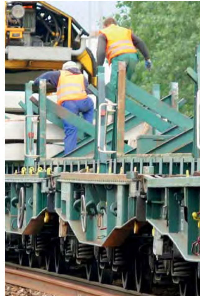
Specjalistyczny pociąg PUN-2 wiele czynności ułatwi, ale za człowieka ich nie wykona. Czasami np. trzeba wejść na pociąg.