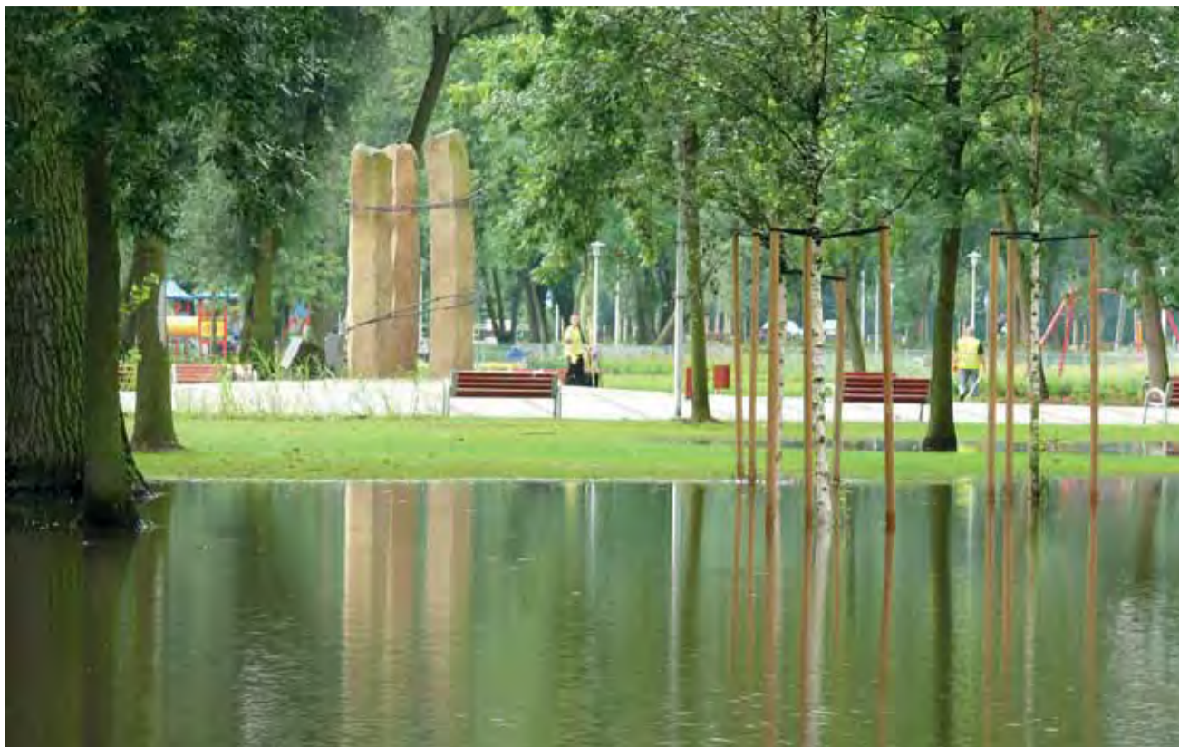
Park Błonie znowu zalany - źle zamontowano kraty kanalizacji deszczowej, nie ukształtowano odpowiednio terenu. Teraz spacerowicze mogą liczyć na roje komarów.

Łowicz | Park na Błoniach znowu pod wodą