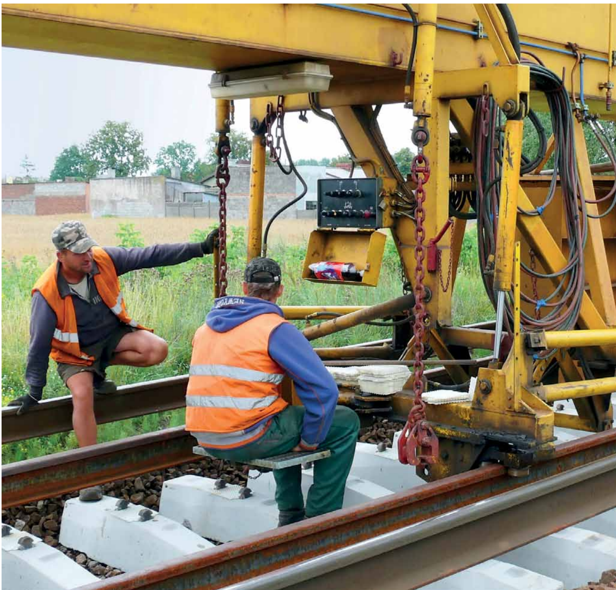
Maszyna PUN-2 układa betonowe podkłady, a na nich tory. Pracownicy Przedsiębiorstwa Napraw Infrastruktury kontrolują proces na każdym etapie.