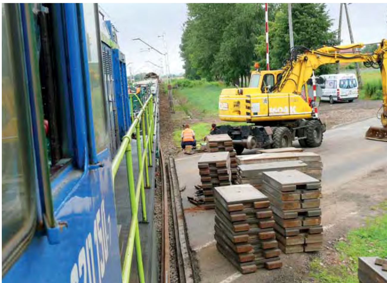
Przełożenie podkładów i torów możliwe jest po zdemontowaniu nawierzchni przejazdów kolejowych. To zdjęcie wykonaliśmy na przejeździe w ul. Seminaryjnej w Łowiczu.