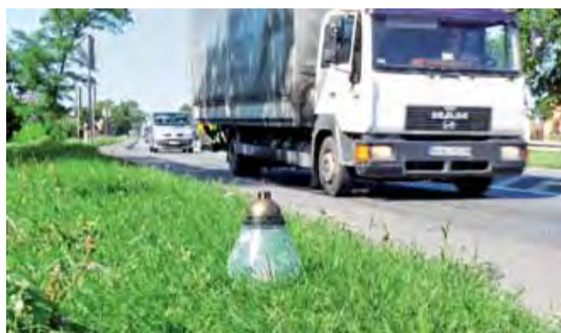
Krajowa czternastka. W okolicach miejsca, gdzie doszło do tragedii, zapalono znicze.

Do śmiertelnego w skutkach wypadku drogowego doszło 28 lipca ok. godziny 22.40 na ulicy Podgródzie w Łowiczu. 52-letni mieszkaniec Łowicza przechodzący przez jezdnię zginął pod kołami Forda Transita.