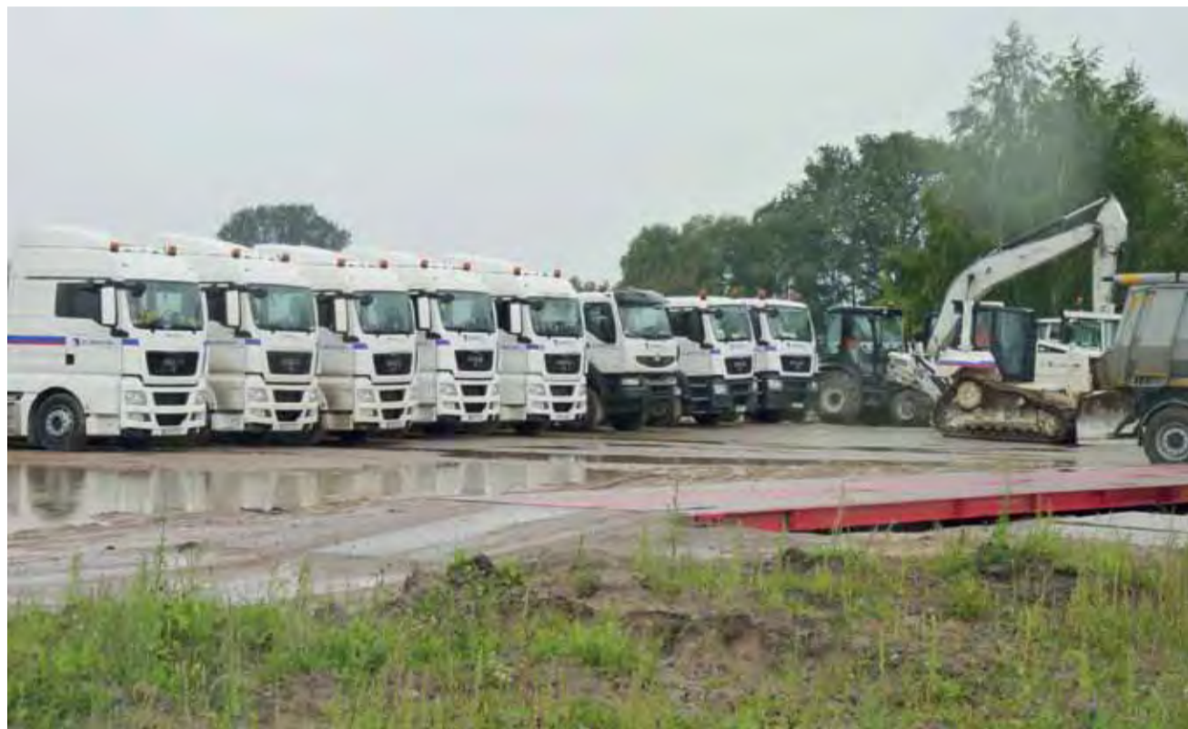
W sobotę na plac budowy przyjechały maszyny i ciężarowe samochody z logo Eurovia. Prace ruszą niebawem.

Czy Platini i Blatter wpadną do nas z wizytą? str. 17