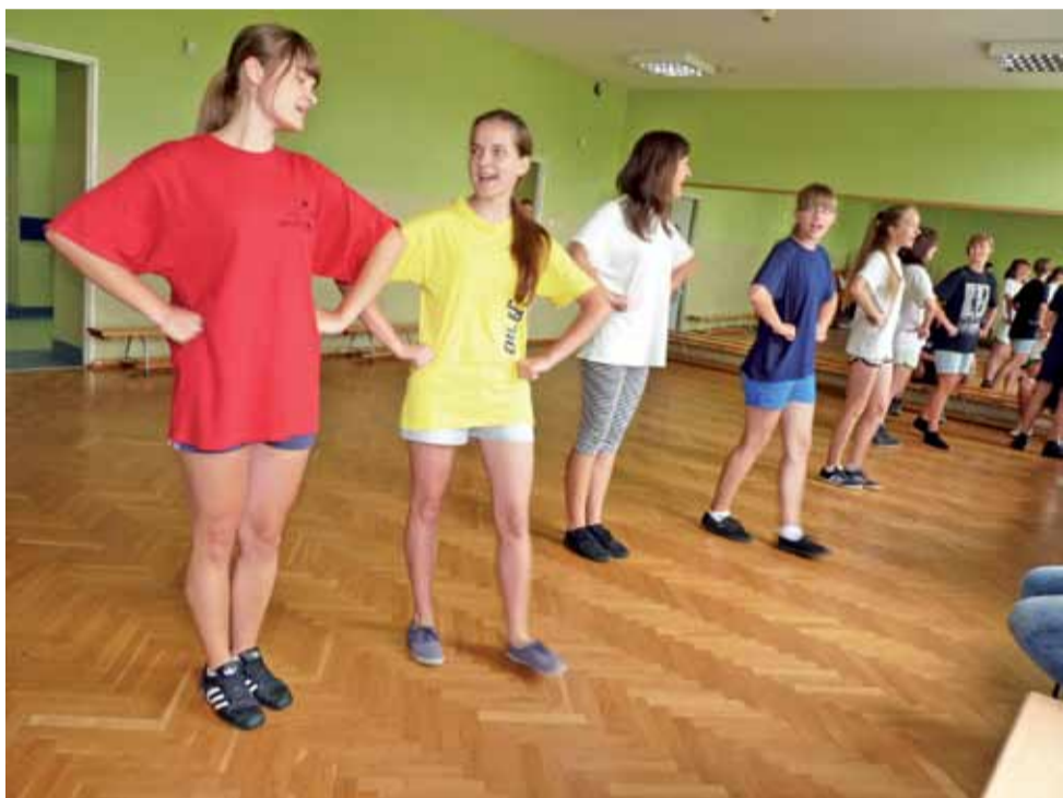
Taki obrazek uchwyciliśmy obiektywem aparatu pod koniec lipca, na próbie Dziecięco – Młodzieżowego Zespołu Ludowego Koderki w sali Łowickiego Ośrodka Kultury. Członkowie zespołu ćwiczyli tańce i śpiew przed wyjazdem na kilkudniowy przegląd do Strzegomia, na który wyjechali we wtorek 9 sierpnia. jr