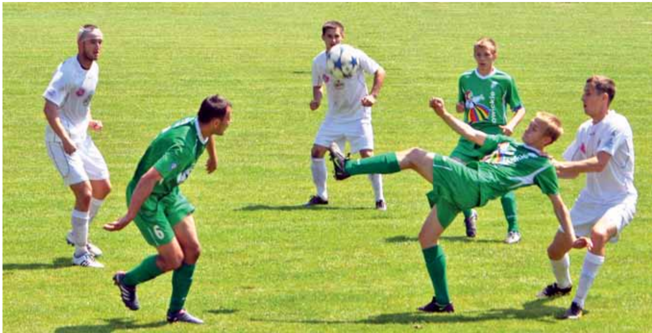
Łowiczanie rozegrali w Brzesku naprawdę niezłe spotkanie, ale znowu zeszedli z boiska pokonani...

Piłka nożna | Runda wstępna Pucharu Polski