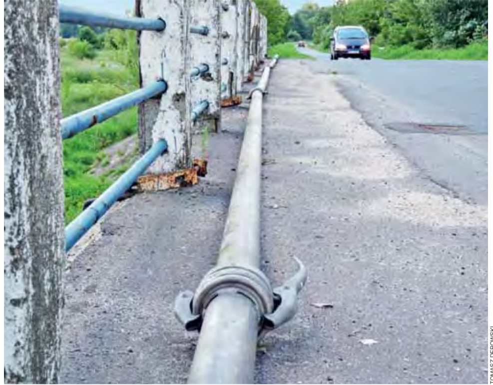
Mieszkańcy Soboty z niecierpliwością czekają na nowy wodociąg. Aktualnie woda jest tłoczona za pomocą rur do deszczowania upraw.

Aktualnie mieszkańcy korzystają z wody ciągniętej z hydrantu od Walewskiej Wsi za pomocą rur do deszczowania upraw. W chwili oddania do użytku wodociągu, woda będzie tłoczona z hydroforni w Oszkowiecach i Waliszewie. Wodociąg ma być gotowy w 3-4 tygodnie od momentu rozpoczęcia prac. td