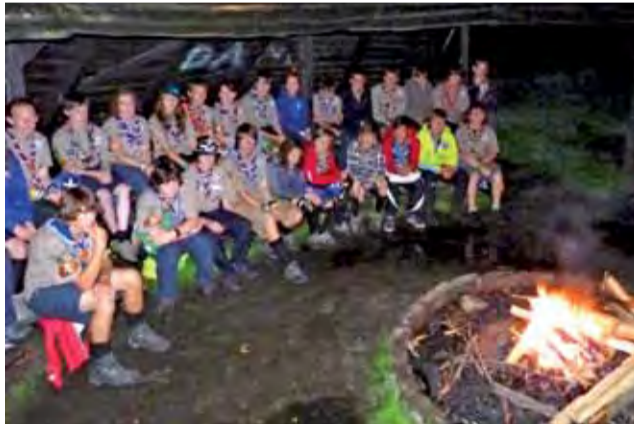
Przy ognisku w lasu miejskim. Komary, których u siebie nie znają, zmusiły Anglików do założenia spodni zamiast tradycyjnych spódnic kilt.