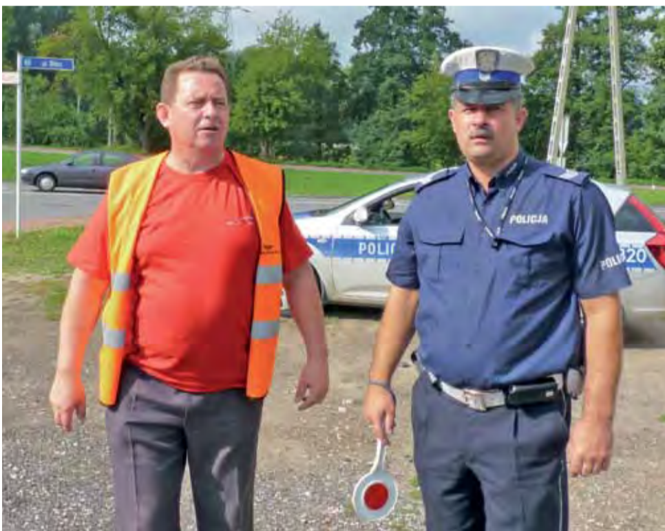
Policja karała mandatami, a kolejjarze przypominali zasady bezpiecznego zachowania przy przejazdach PKP.

przyczynę uznano nieostrożność w posługiwaniu się ogniem osób dorosłych. Tego samego dnia ok. godz. 18.15 zapaliła się słoma po kombajnie, tym razem w Bąkowie Górnym. Przyczyną było zapalenie się balotu wewnątrz komory prasy, która pracowała na polu. Spłonęło 0,6 ha słomy. 5 sierpnia kilkanaście minut przed 8 doszło do zapalenia się beli ze słomą na przyczepie ciągnika na polu w Przemysławie. Za przyczynę uznano iskry wydobywające się z rury wydechowej ciągnika. td