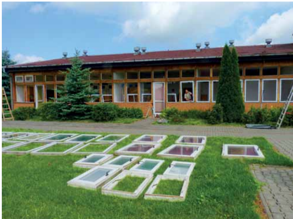
Praca nad wymianą okien trwa w najlepsze. W sumie trzeba będzie ich wymienić kilkadziesiąt.

Przypomnijmy, że remont liczącego sobie niespełna osiemnaście lat budynku szkoły, w którym swoją siedzibę mają Szkoła Podstawowa nr 7 oraz Gimnazjum nr 4, był wymuszony przez słabą kondycję budynku, zbudowanego w lekkiej technologii, w zale-