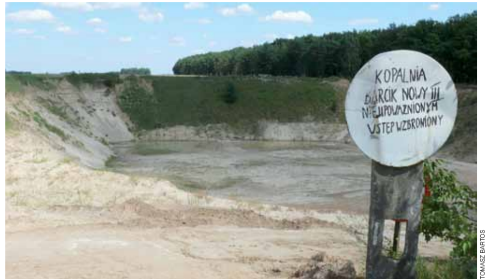
Kopalnia Barcik Nowy III może w przyszłości stać się składowiskiem odpadów azbestowych.

Tak naprawdę kwestią czasu było, że pojawi się ktoś, kto będzie chciał to zrobić. – Zwirownie działają na całego, ciągle jeżdżą samochody ciężarowe, kurzą. Czasem nie widać drugiej strony drogi. Jak jest upał nie mogą otworzyć okien, ani powiesić na zewnątrz prania, a teraz jeszcze ten azbest... – nie krył przerażenia jeden z mieszkańców Barcika, który od nas dowiedział się o planach budowy składowiska. Bezpośredni sąsiedzi ewentualnego składowiska,