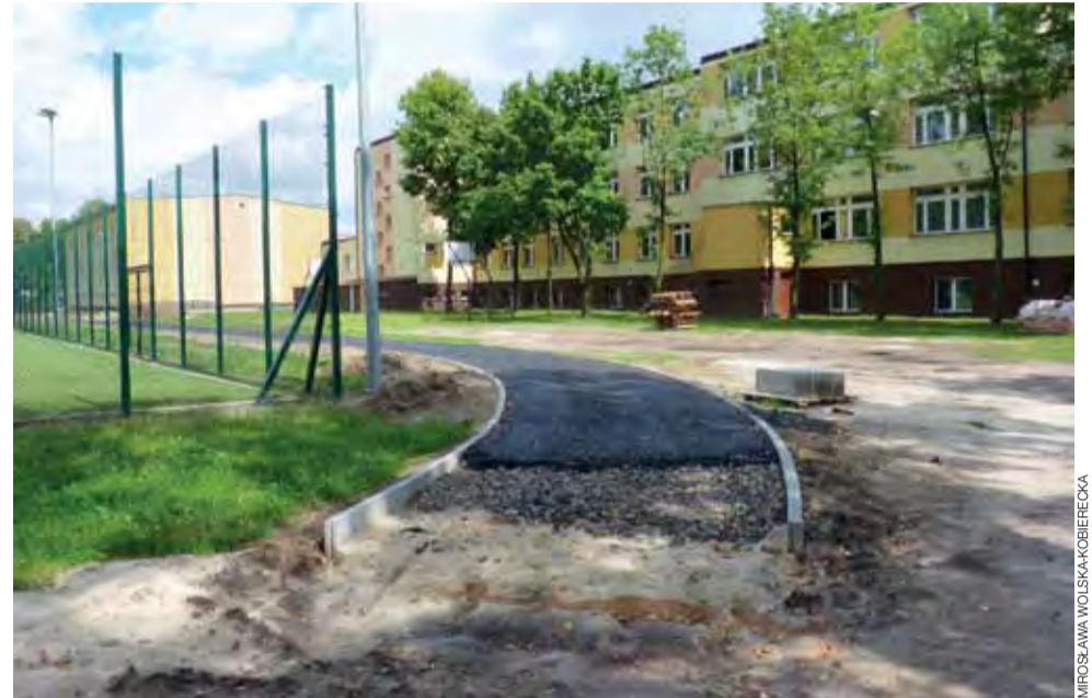
Bieżnię częściowo już widać, ale w tym tygodniu prace przy jej budowie nie są prowadzone.

Wykonawcą prac jest Zakład Usługowy Budra z Ło-