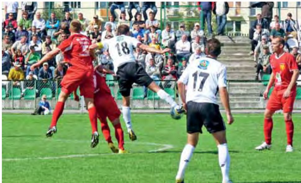
Pelikan nigdy nie przegrał z Sokółem i seria ta została także podtrzymana w pojedynku w Sokółce.