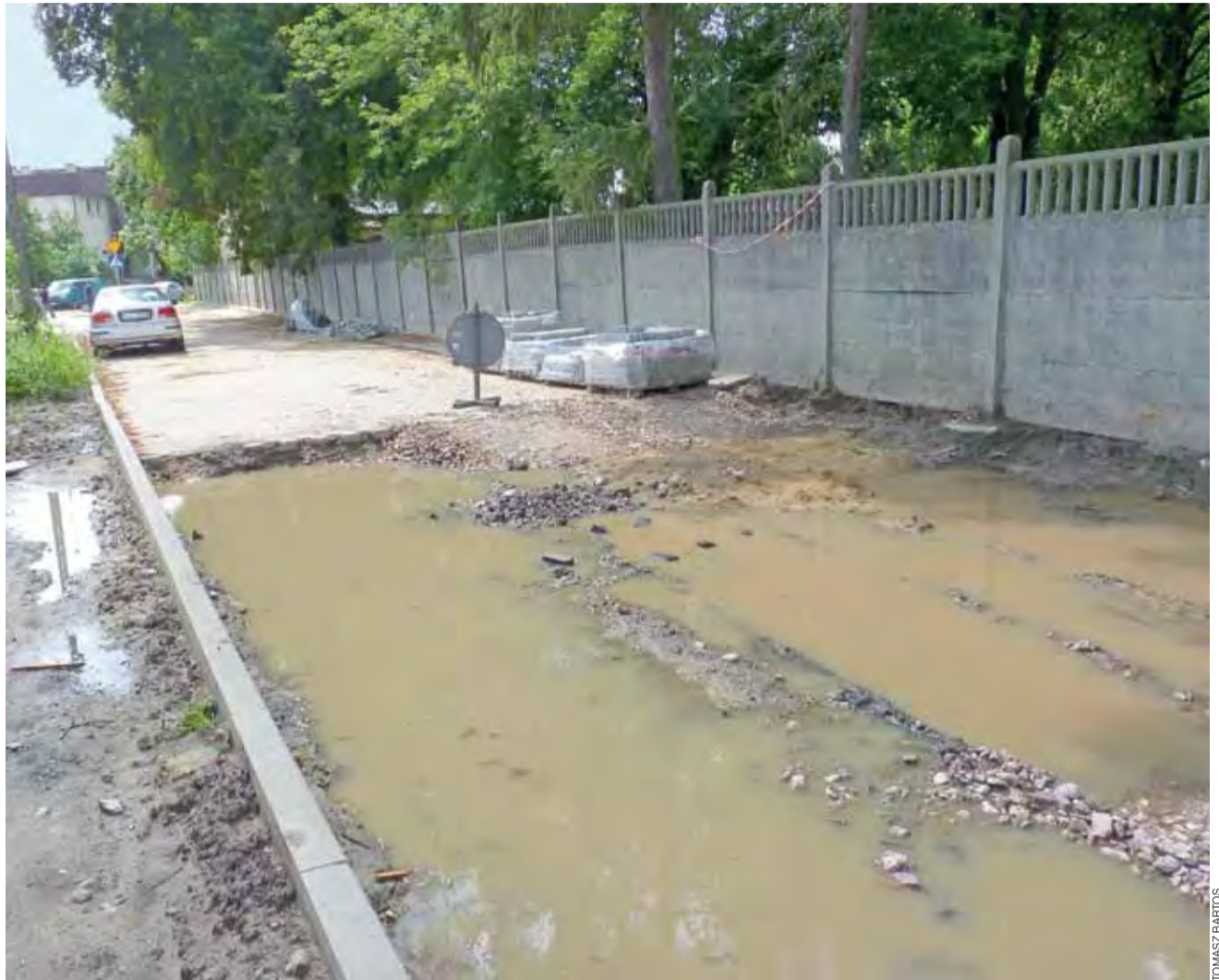
Ulica Ogrodowa w Łowiczu po deszczu wygląda makabrycznie.

Naczelnik Wydziału Inwestycji i Remontów w ratuszu Grzegorz Pełka zapewnia, że gdy tylko przez kilka dni nie będzie padać i ziemia przeschnie, prace na Ogrodowej zaczną się na nowo, z nastawieniem, by je jak najszybciej zakończyć. tb