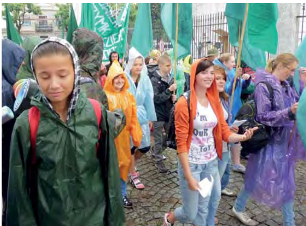
Pątnicy z grupy zielonej, zwanej grupą „łowicka” w większości pochodzą z dekanatu łowickiego. W sobotę grupa wychodziła w strugach deszczu.