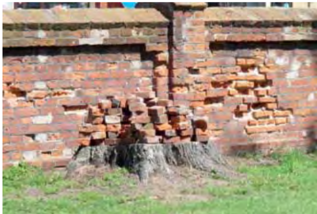
Na pierwszym planie cegły z rozebranego słupka. W tle ogrodzenie, które też wymaga remontu.