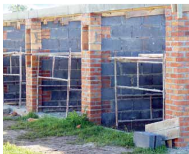
Garaze już stoją, teraz firma zakłada dach.