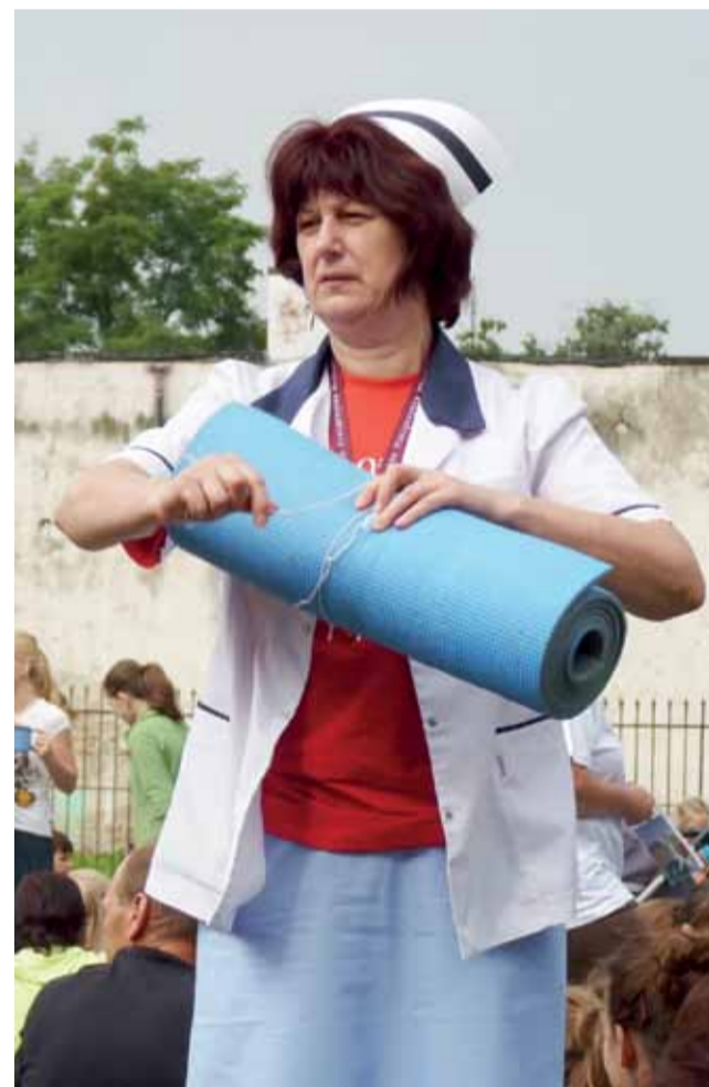
Nieosiągalne jest, aby pielgrzymka wyruszyła bez służby medycznej.