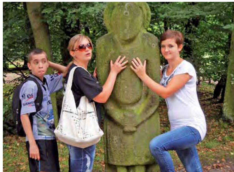
Jednym z miejsc, które odwiedzała grupa był park w Nieborowie.