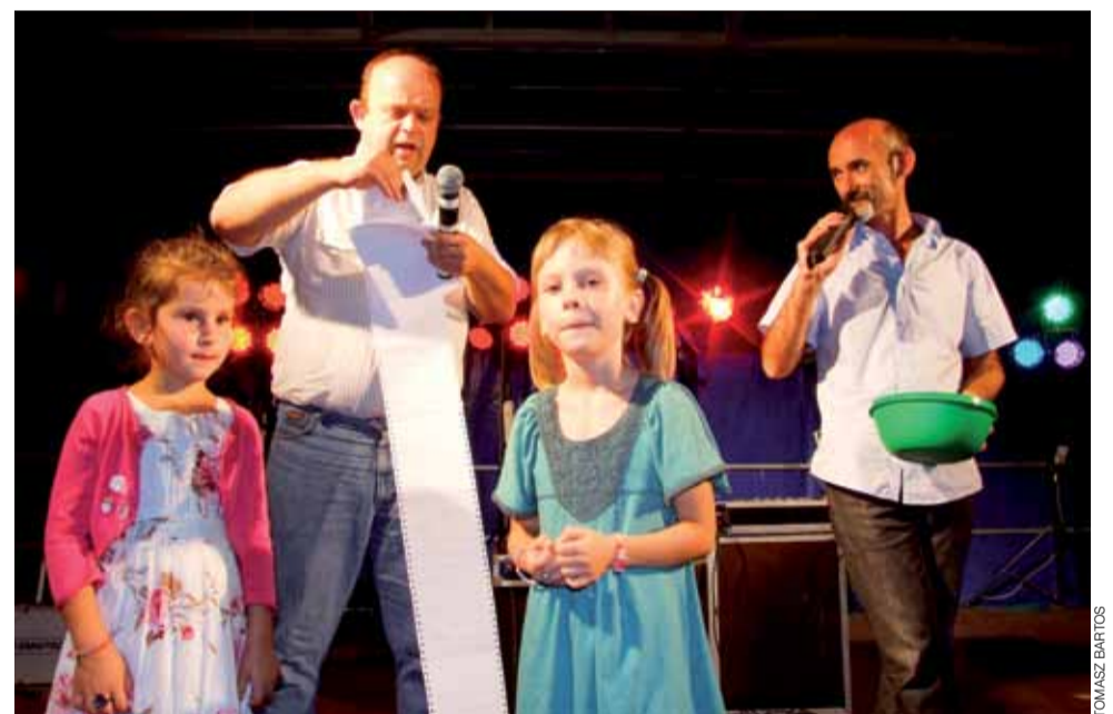
Tak wyglądało losowanie nagród głównych w loterii w czasie pikniku parafialnego w 2010 roku.

W czasie festynu czynne będzie wesołe miasteczko, grill i stoisko z ciastami. Tym także zajmą się parafianie. tb