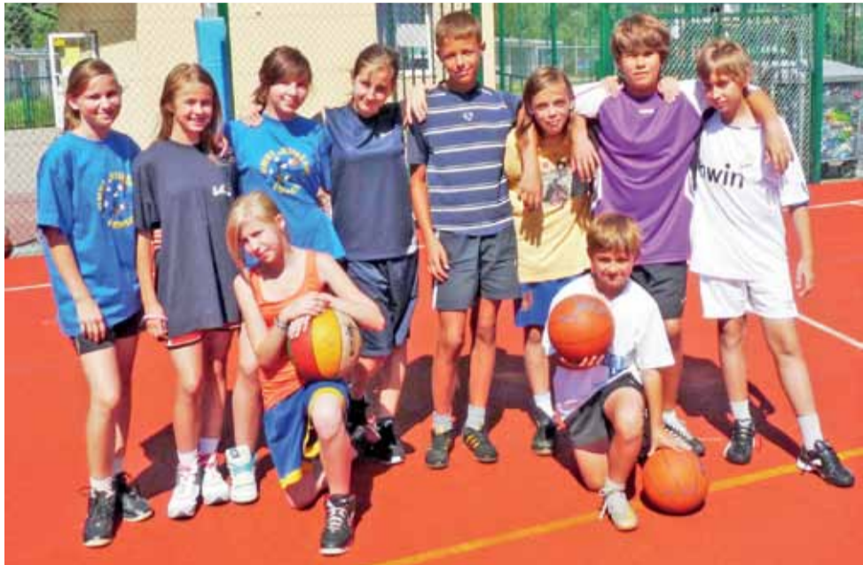
W turnieju wakacyjnej koszykówki wzięły udział dwa zespoły.