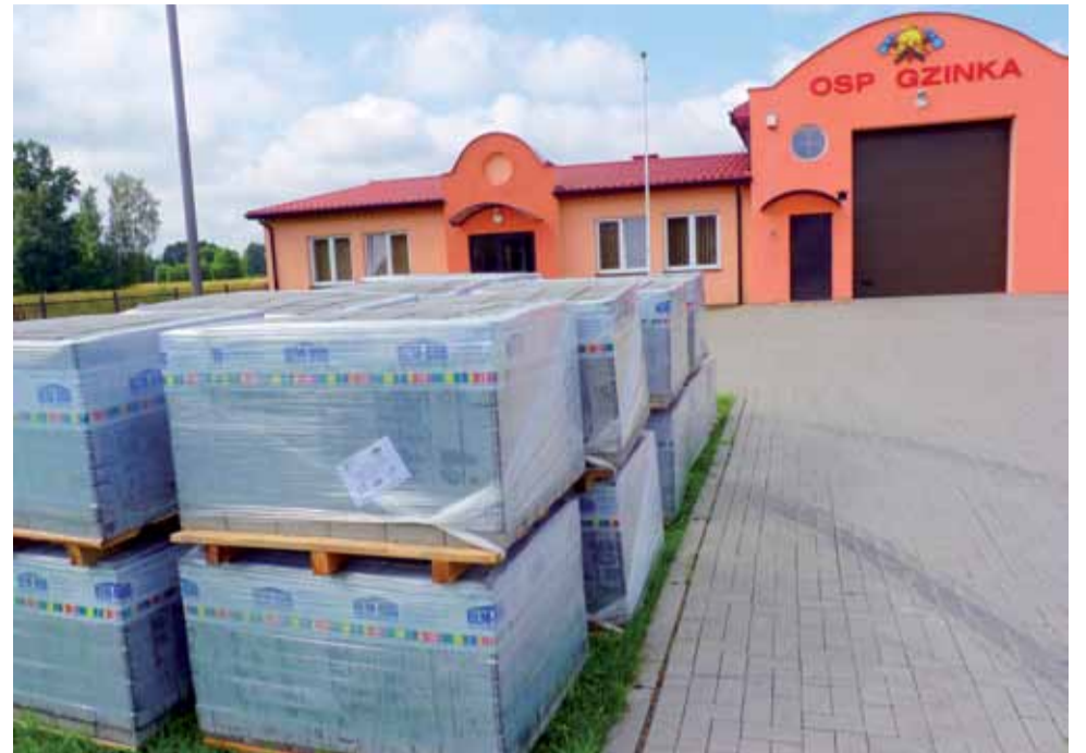
Kostka na budowę parkingu już stoi na terenie OSP.