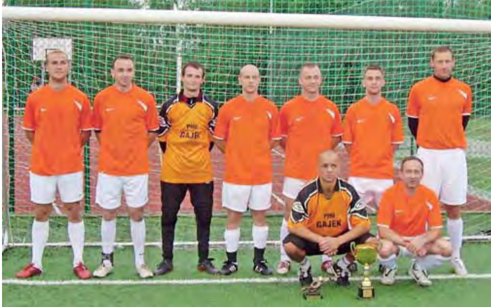
Kolejny zespół piłkarski PHU Gajek znowu sięgnął po mistrzowski tytuł w gminie Zduny.