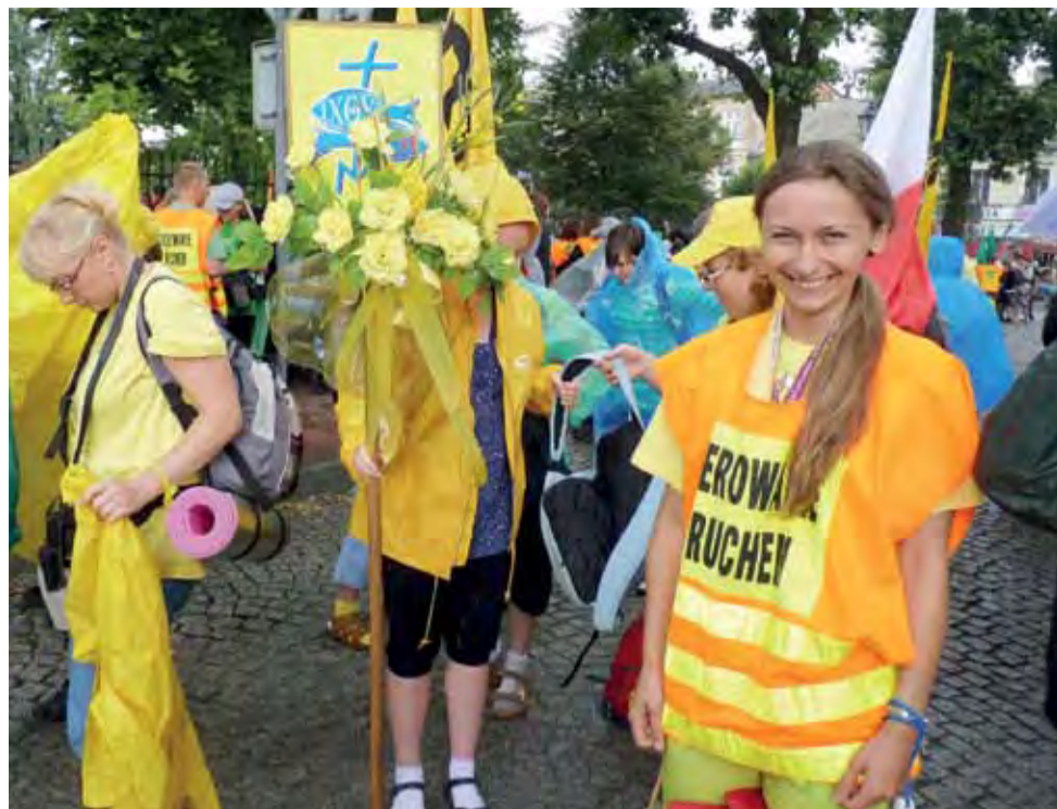
W grupie cytrynowej pielgrzymują pątnicy z 2 dekanatów: zychlińskiego i sannickiego. Najliczniej w grupie cytrynowej reprezentowane są parafie z Żychlina, Sannik oraz Bedlna, Kiernozi i Oporowa.