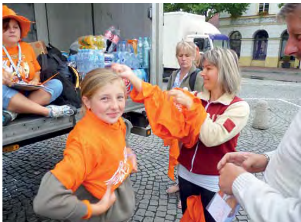
Grupa pomarańczowa to grupa salezjańska, w której wędruje 115 pielgrzymów. Pielgrzymi tej grupy przybywają z różnych części kraju. Najwięcej pielgrzymów stanowią parafianie z Żyrardowa.