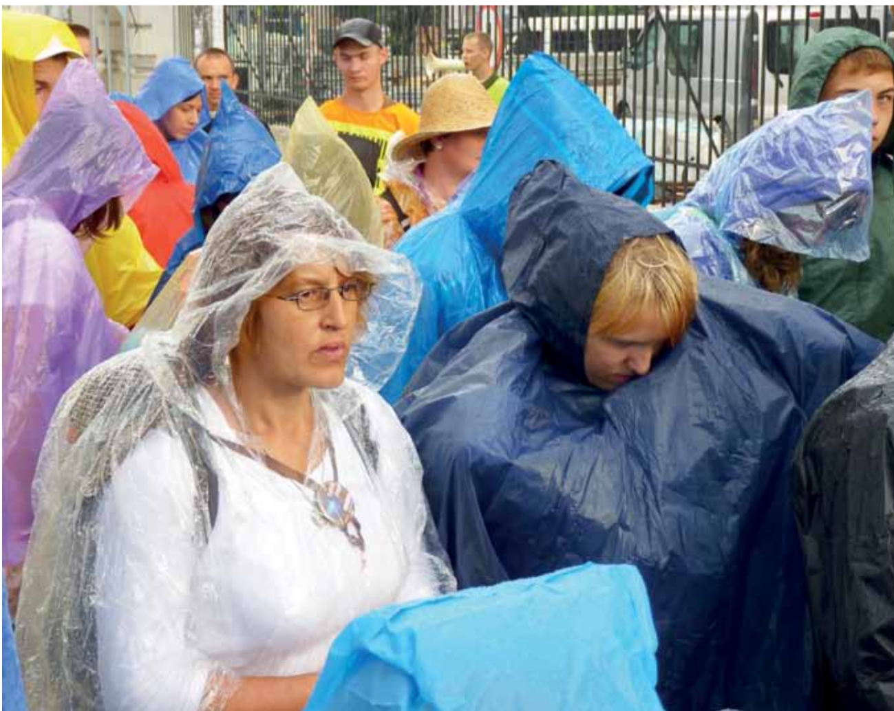
Niektóre grupy wyruszyły w strugach deszczu, inne deszcz dopadł po drodze. Pątnicy byli jednak na to przygotowani i po chwili większość z nich miała na sobie przeciwdeszczowe peleryny.