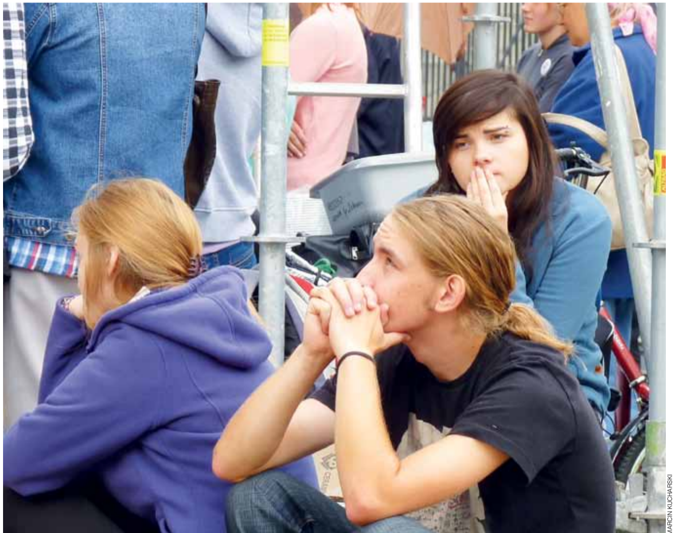
Nie wszyscy pielgrzymi zmieścili się w katedrze. Część z nich słuchała w skupieniu kazania pomiędzy rusztowaniami wokół niej.

Wieści z trasy dochodzą optymistyczne. Pierwszego dnia pielgrzymi pokonali ponad 24 km z Łowicza do Makowa. – Wędrowaliśmy dziś zarówno w słońcu, jak i deszczu. Czego było więcej – trudno powiedzieć – dowiedzieliśmy się od pielgrzymów. W niedzielę przez cały dzień pielgrzymom towarzyszyło słońce, ale wieczorem znowu zaczęło padać. W wyniku burzy w Wysokienicach, dokąd dotarli nie było światła. Nieszpory odprawione zostały w kościele przy świetle kilkunastu laterek. Dziś, w czwartek, pielgrzymi powinni być już pomiędzy Longinówką a Gosławicami. Na jasnoogórskie wały mają wejść w niedzielę, 14 sierpnia. mak