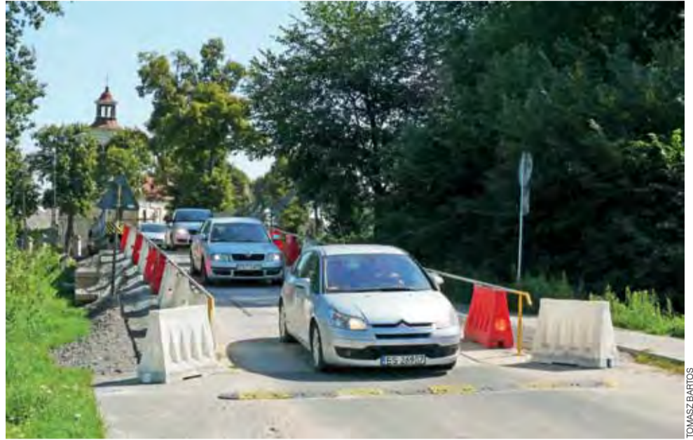
Tymczasowy most w Bełchowie, wymaga od kierowców dużej ostrożności w czasie jazdy.

Jedyną poważną zastrzeżeniem do obecnej konstrukcji tego tymczasowego mostu (mającego chronić most na czas budowy autostrady) miał jeden z rolników. – Kłopot jest, jak najbardziej. Kombajn tędy nie przejedzie, bo jest za wąsko, musi szukać drogi przez most w Sierakowicach – powiedział. Taka jazda to nadłożenie ok. 5 km drogi i to po dość wąskiej drodze w Bełchowie. Kombajn na