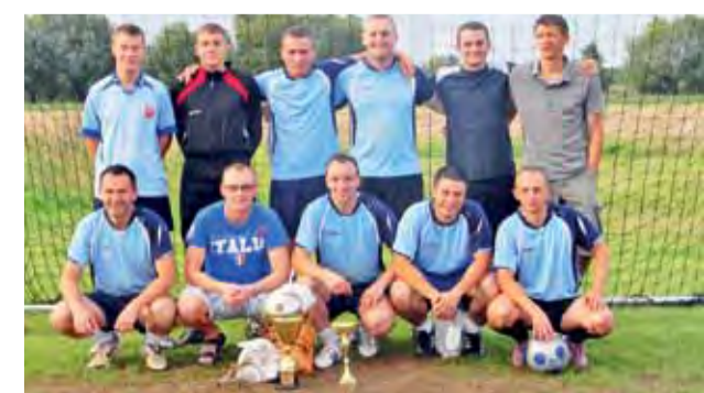
Warriorsi po raz piąty sięgnęli po mistrzostwo gminy Bielawy.