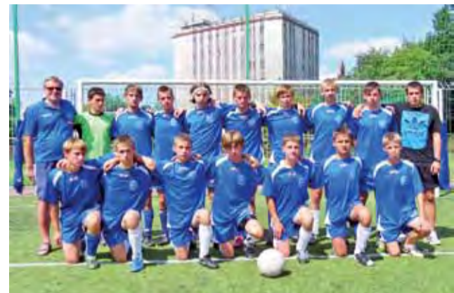
Laktoza-96 przygotowuje się do ligi w nadmorskich Sianorzętach.

Liga wojewódzka to jednak duże wyzwanie dla zawodników i trenera zwłaszcza, że występują w niej tak dobre zespoły jak SMS Łódź, ŁKS, GKS Be-