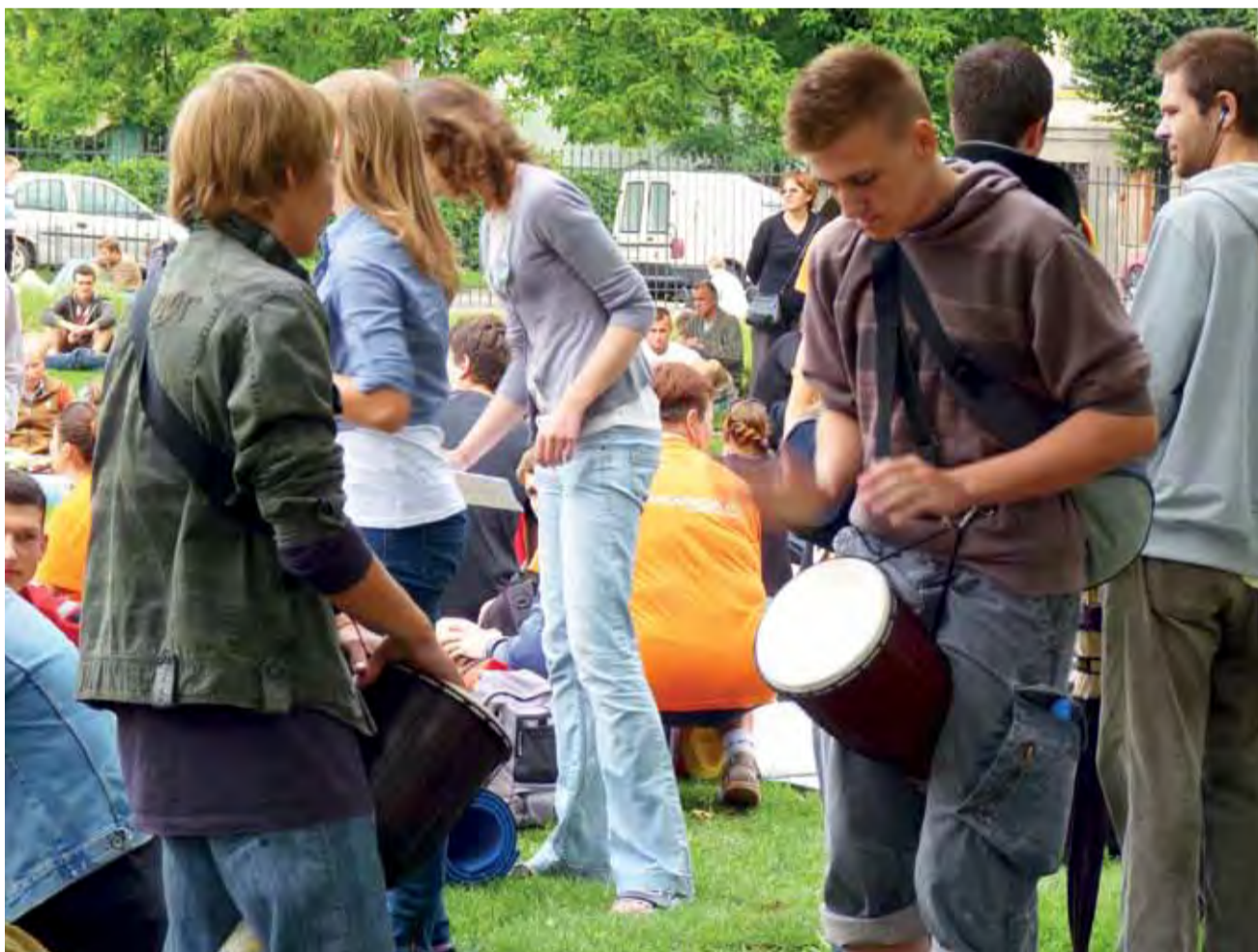
Młodzież próbuje grać na różnych instrumentach. Także na pielgrzymce można spotkać młodych grających na djembe.