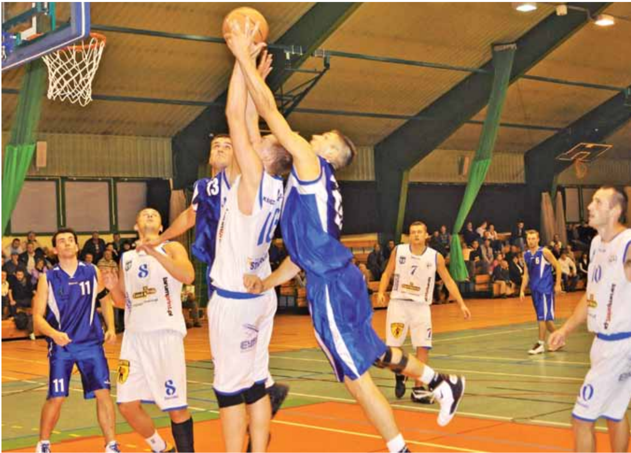
Łowicki Księżak przed nowym sezonem stawia sobie wyższe cele niż tylko walka o utrzymanie.

Koszykówka | Przygotowania do rozgrywek II ligi męskiej