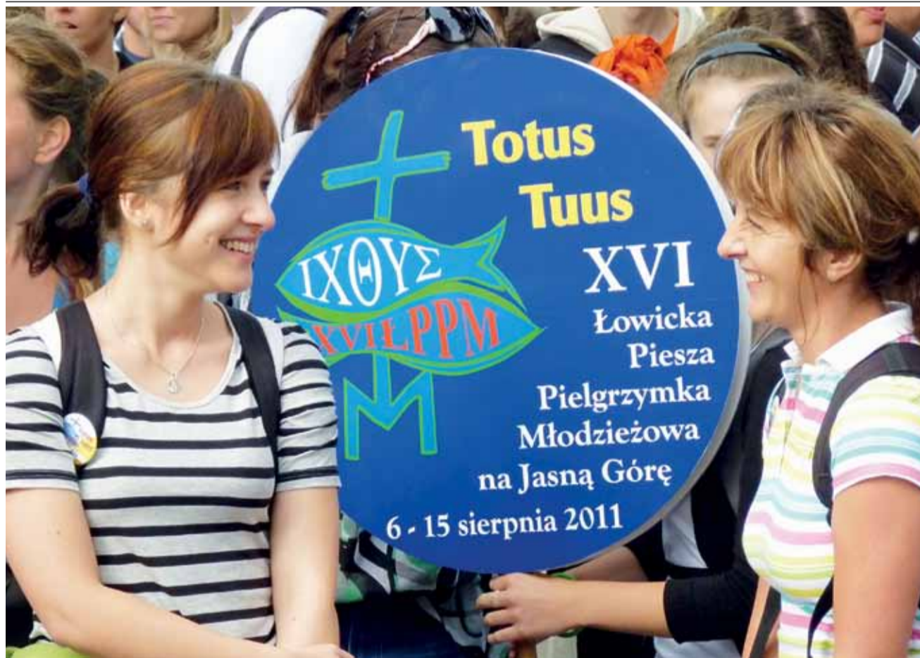
Humory dopisywały uczestnikom tegorocznej młodzieżowej pielgrzymki, którzy w sobotę wyruszyli z łowickiej katedry na Jasną Górę - choć akurat zaczęło padać i niektóre grupy ruszały w kapturach na głowach. Fotoreportaż ze startu pielgrzymki znajdziesz na str. 20-21.

RZUT OKIEM | JUŻ SIĘ ZBLIŻAJĄ DO CZĘSTOCHOWY