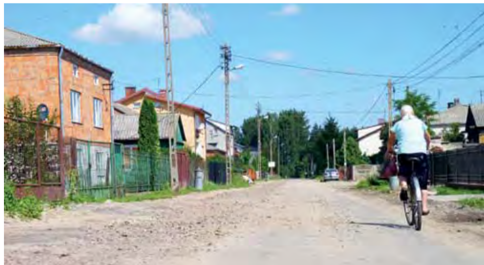
Na gminnej drodze w Sierzychowie kierowcy mandatu otrzymać raczej nie powinni, bowiem póki co więcej niż 30 km/ godz. pojechać tam się nie da.