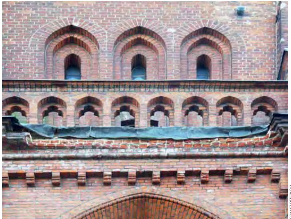
Uszkodzenia spowodowały oberwanie się gzymsu. Został on zabezpieczony przez strażaków.