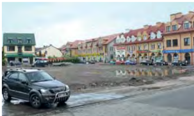
Na parkingu przy ul. Koziej obecnie nie parkują samochody, teren ma zostać uporządkowany i w przyszłym tygodniu udostępniony kierowcom.

Aby było możliwe zrobienie tam parkingu, potrzebne są zmiany, w planie zagospodarowania przestrzennego Łowicza. Jego zapisy mówią, że teren ten