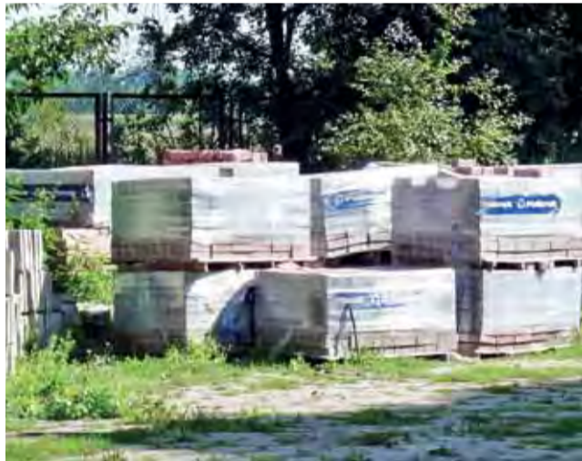
Kostka czeka na położenie. Ma to nastąpić za kilka tygodni.

– Niestety, żaden skazany nie przystał na takie warunki. Udało nam się co prawda pozyskać 4 pracowników przysyłanych przez Powiatowy Urząd