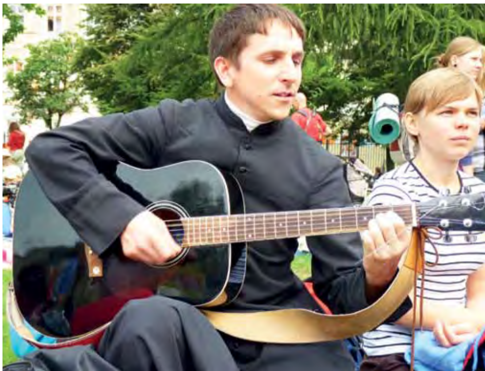
Ksiądz z gitarą to na pielgrzymkach młodzieżowych żadna nowość. Kilometry łatwiej jest pokonywać śpiewając i rozważając Słowo Boże.