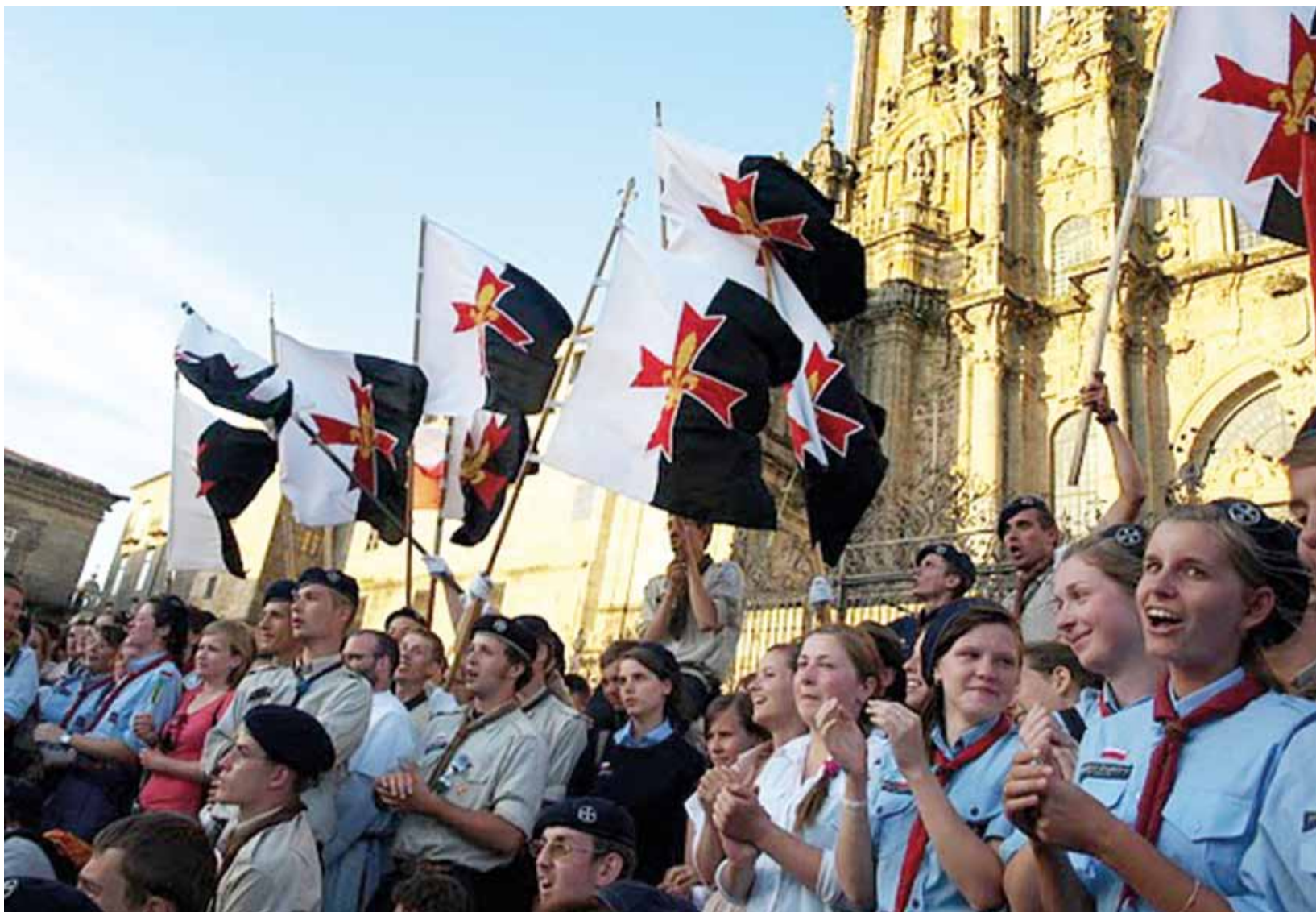
Skautki Europy – Zawiszacy – pod katedrą w Santiago de Compostella. Za sobą mieli pielgrzymkę, przed sobą służbę w Madrycie.