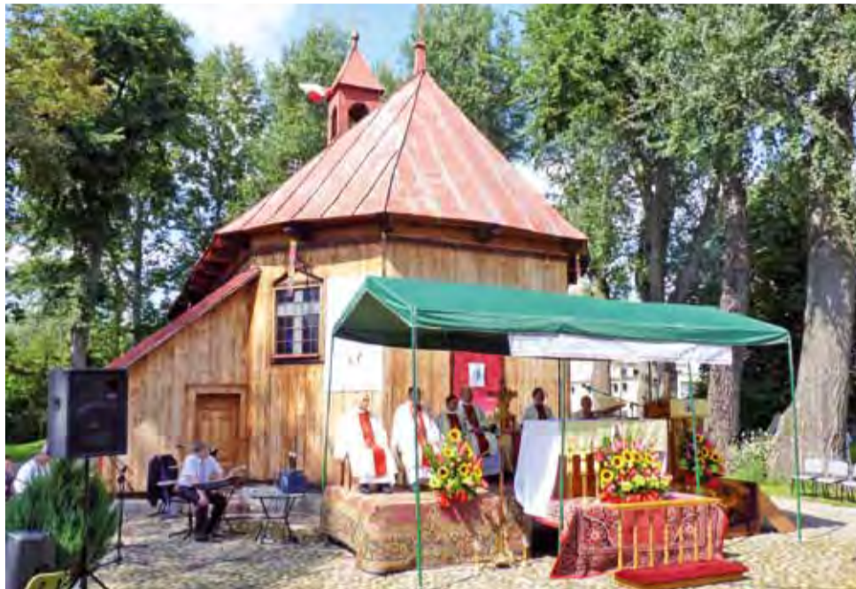
Dzisiaj kaplica rzadko pełni funkcję sakralną, nabożeństwa nie są tu odprawiane.

Jest to późnobarokowa świątynia konstrukcji zrębowej, oszalowana z dwuspadowym dachem i sygnaturką, orientowana na planie prostokąta. W zachodniej części znajduje się kruchta z nadwieszonym chórem, a w południowej zakrystia. Najciekawszym zabytkiem jest feretron z obrazem Trójcy Świętej przedstawionej jako głowa o trzech twarzach. Jest to unikat w skali światowej. Co ciekawe, obraz ten został potępiony przez sobór trydencki, a w 1628 roku papież Urban VIII wydał zakaz używania go jako przedmiotu kultu religijnego, ze względu na możliwość narażenia się na drwiny ze strony protestantów, którzy nazywali takie przedstawienie Świętej Trójcy – katolickim Cerberem. Jak czytamy w opracowaniach historycznych, ciekawostką jest także fakt, że pomimo formalnego zakazu, potwierdzonego w 1745 roku, obraz jednak powstał i to w roku 1768. We wnętrzu drewnianej kaplicy znajdziemy także cenne wyposażenie liturgiczne