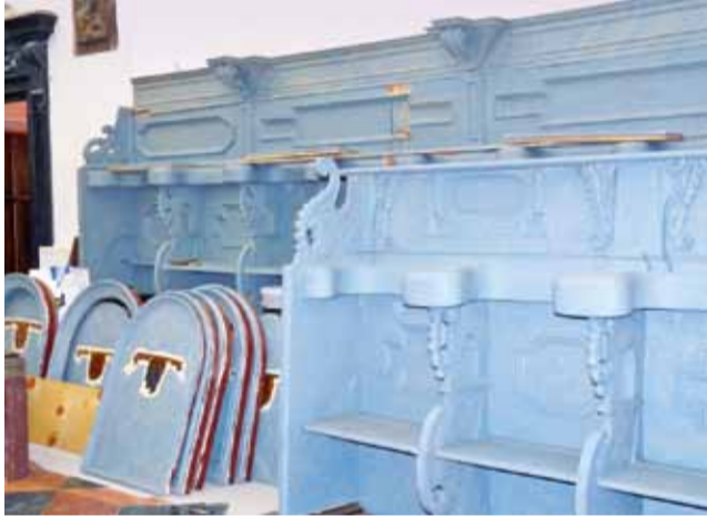
Jeszcze we wtorek tylko dolna część ławek była zamontowana. Restauracja stali odbywa się jednak poza projektem.

Teraz, przy okazji renowacji kościoła, kiedy odnowiono i pomalowano różnymi odcieniami szarości sztukaterię na sklepieniach i przy oknach, a także odnowiono kolor ścian, okazało się, że brązowy kolor zupełnie nie pasuje do nowego wnętrza. Pobrano więc próbki