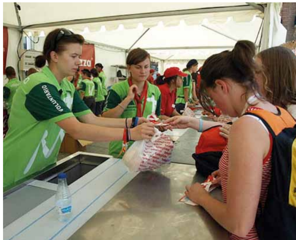
Jedną z typowych służb było wydawanie paczek z jedzeniem dla pielgrzymów.

W metrze każdy miał czas. Nie było osób, które bałyby się do nas zagadać. Wszystkich interesowało to, skąd jesteśmy, jak to się stało, że jesteśmy wolontariuszami i dlaczego na tych jaskrawo zielonych koszulkach mamy chusty. To było fajne, że ludzie zauważali nas w tym zbiorowisku wielu tysięcy innych osób.