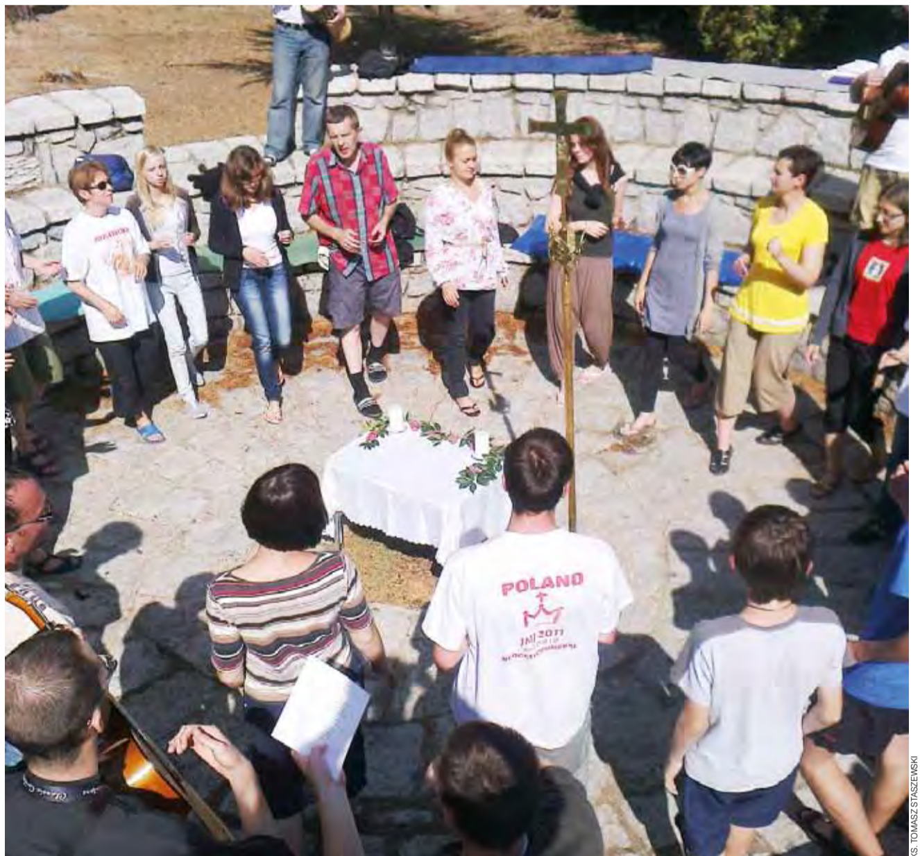
Młodzież z neokatechumenatu spontanicznym tańcem i śpiewem przekazywała świadectwo swojej miłości do Boga.