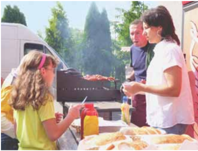
Uczestnicy pikniku mogli skosztować smakołyków z grilla.

W czasie pikniku przeprowadzono szereg konkursów dla najmłodszych. Był taniec w parach z balonami, taniec na gazecie, konkurs rysunkowy pod nazwą „Wymarzona rodzina”. Uczestnicy, zarówno rodzice, jak też dzieci, mogli zjeść ciepły posiłek, po nim był słodki poczęstunek. Na zakończenie pikniku każde dziecko otrzymało niespodziankę – maskotkę. am