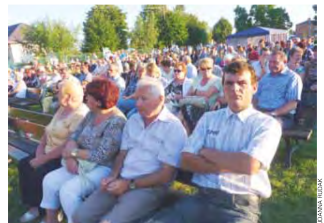
Wiele osób siedziało na ławkach ustawionych przed sceną, jednak większość spędzała wolny czas w ogródkach piwnych.

Później odbyły się spektakle w wykonaniu dwóch trup teatralnych: Teatru Scena oraz Teatru Akt. Pierwsze przedstawienie, Legendy Sp. z o.o., było dla dzieci. Jednak to drugi spektakl „Płonące laski 4” zrobił na zebranych największe wrażenie. Choć rozpoczął się późno, bo o godz. 21, pozostało na nim wiele dzieci, które z otwartymi