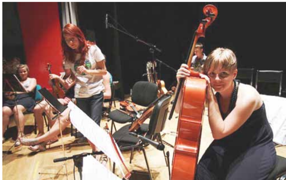
Muzycy z Łowicza na chwilę przed 13. wystawieniem Pieśni Jerozolimskich w kolegium o. pijarów w Madrycie.