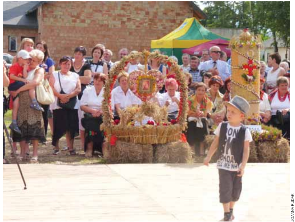
Dożynki gminne są też dobrą okazją do pokazania trendów w modzie. Świadczy o tym strój kilkuletniego chłopca, który z bliska przyglądał się temu, co działo się na scenie.

Rozstrzygnięto także ogłoszony wcześniej konkurs na najlepszy własny chleb, w którym równorzędne pier-