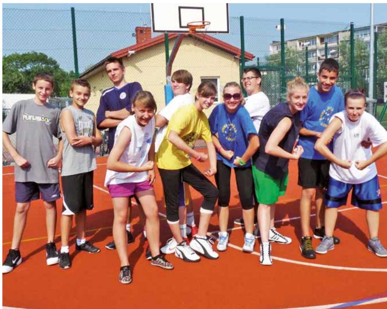
Pomimo że to już koniec wakacji, to humory młodym koszykarzom nadal dopisują.