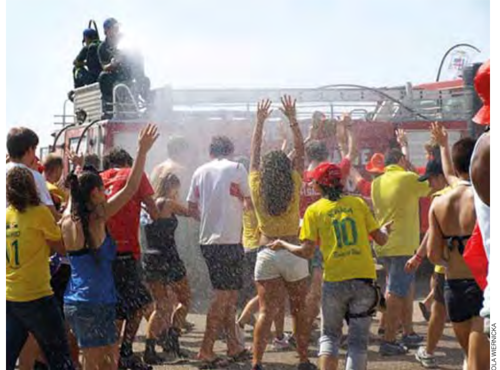
Upały sięgały 40°C, więc gdy strażacy polewali zebranych wodą, chętnych nie brakowało.

Nikogo nie przerażały tłumy w metrze. Wręcz przeciwnie – każdy się cieszył na widok przetłoczonych wagonów, na widok innej grupy i po prostu innego człowieka. To właśnie my i nasza mieszanka wielonarodowa, a raczej jej spontaniczność tworzyła tę wspaniałą atmosferę.