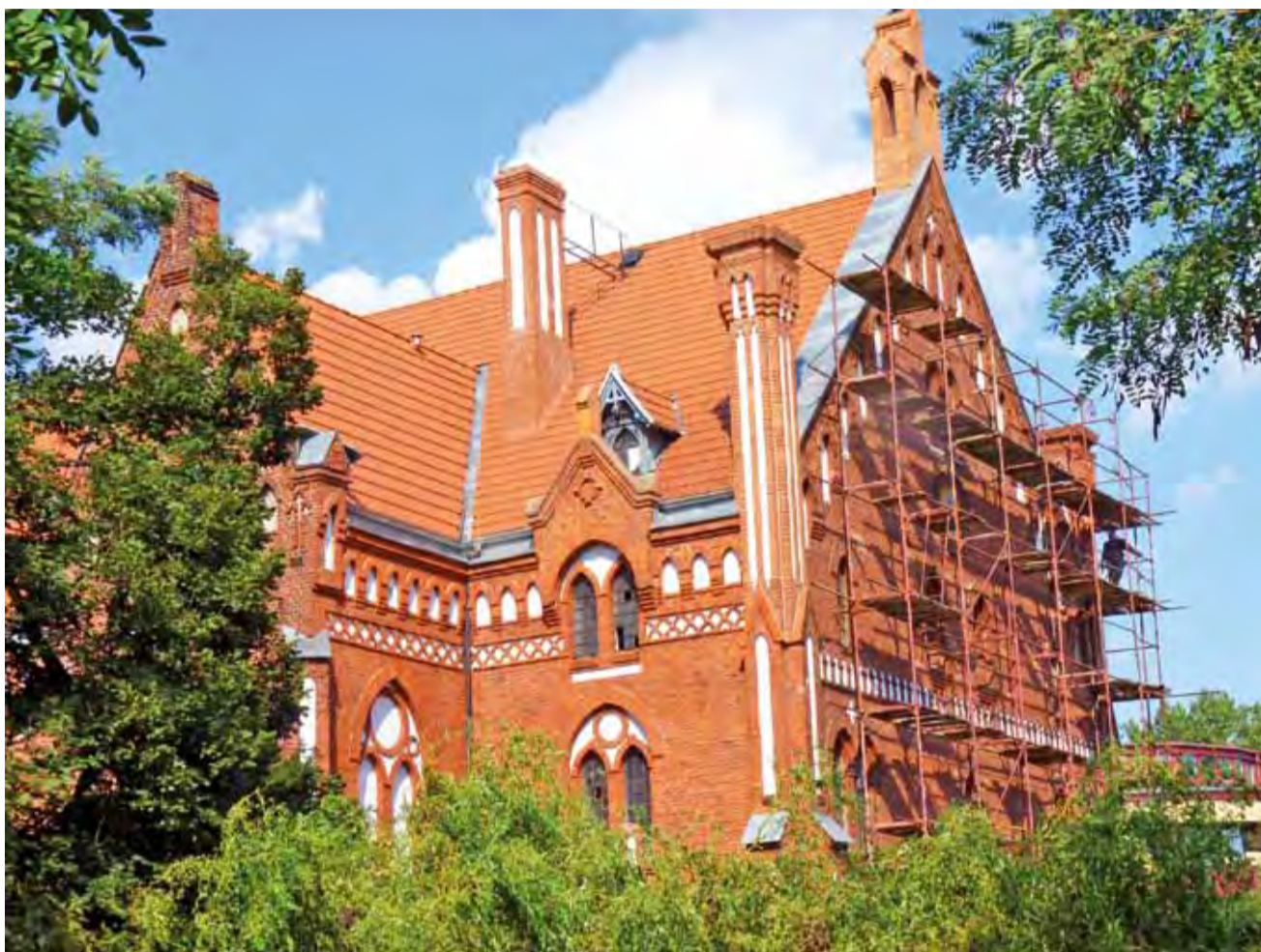
Przy kościele mariawickim trwają ostatnie prace – wykonywane są nowe obróbki blacharskie.

– Potrzeb jest bardzo dużo, ale brakuje nam pieniędzy – mówi ksiądz Żaglewski. Przeciekanie dachu spowodowało liczne przecieki wewnątrz kościoła. W wielu miejscach zaczął już odpadać tynk, dlatego kolejne pozyskane przez parafię środki będą przeznaczone na remont wnętrza świątyni.