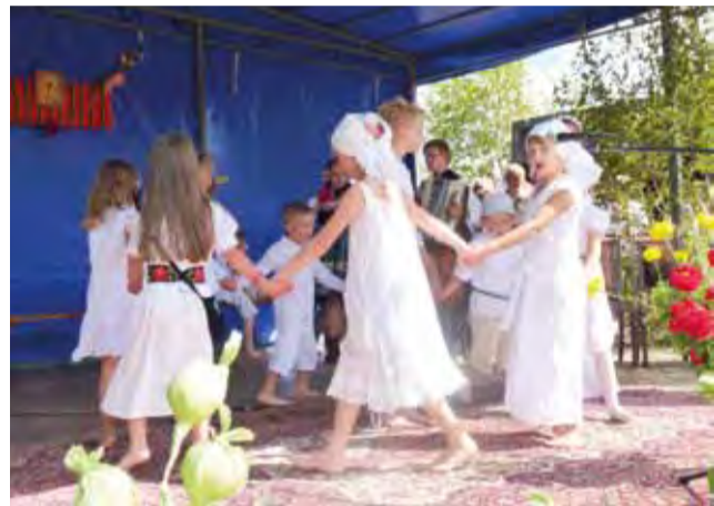
Dzieci z Wygody w białych sukienkach i sukmanach śpiewały o żniwach. Ich występ został nagrodzony dużymi brawami.