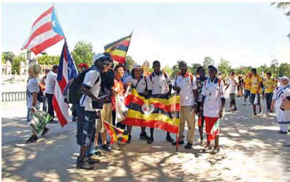
Na madryckich polach i ulicach spotykała się młodzież z całego świata.