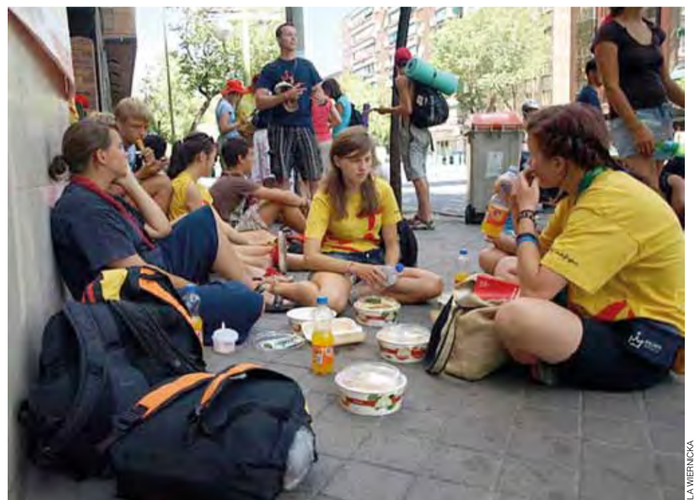
Młodzi przybyli do Madrytu mogli się żywić w restauracjach za otrzymane kupony albo mogli odbierać porcje żywnościowe – i wtedy często miejscem posiłku był trotuar.