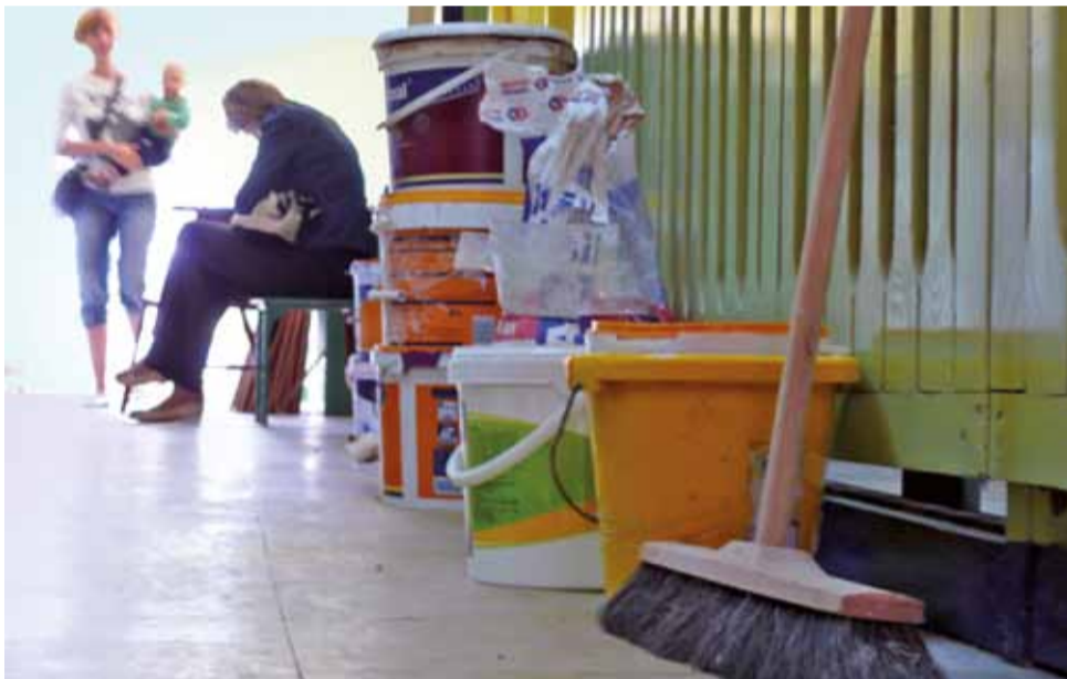
Na dzień przed rozpoczęciem roku szkolnego w Przedszkolu nr 10 przy ul. Książęckiej w Łowiczu rodziców wypełniających dokumenty witały wiadra z farbą i zgromadzone na korytarzach meble z sal.

W Przedszkolach nr 4 i 10 oraz w Zespole Szkół Integracyjnych na osiedlu Bratkowice w Łowiczu ciągle trwają prace przy ich termomodernizacji. Jeszcze wczoraj nie wszystko było gotowe na dzisiejsze rozpoczęcie nauki przez dzieci. W „Siódemce” już było wiadomo, że w piątek zajęć w szkole nie będzie.