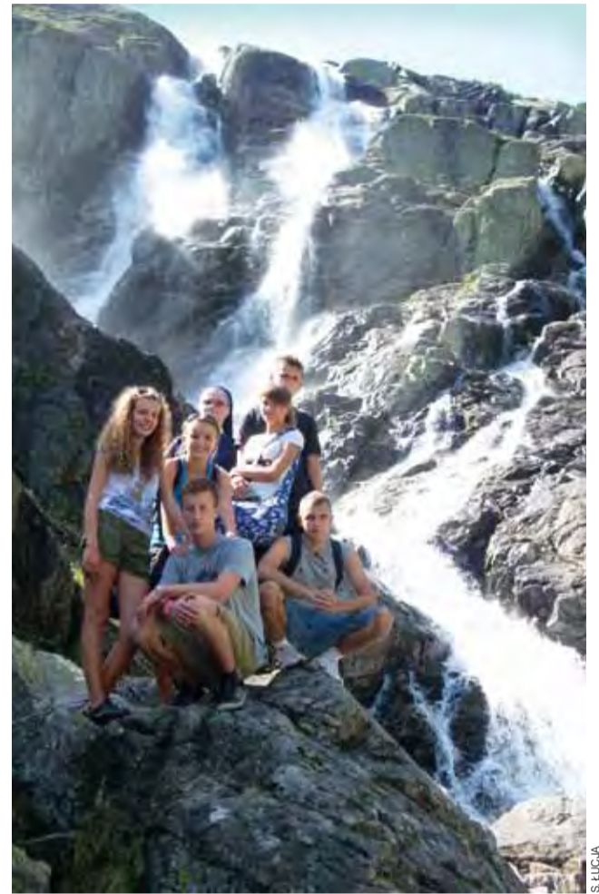
Uczestnicy wyjazdu na Podhalu przy Wilkiej Siklawie, na szlaku do Pięciu Stawów.

– Była codzienna msza św., krótkie konferencje, wspólne oglądanie takich filmów, które dają coś do myślenia. Chodziliśmy też w góry i na basen – opowiada ks. Domański, który wraz z grupą dotarł do Murowańca, Czarnego Stawu Gąsienicowego, Doliny Pięciu Stawów, nad Morskie Oko, do jaskini Mroźnej. Właśnie w ostatnim w wymienionych miejsc jedna osoba straciła przytomność i z pomocą do niej przyleciał śmigłowcem TOPR. Opiekun uspokaja jednak, że