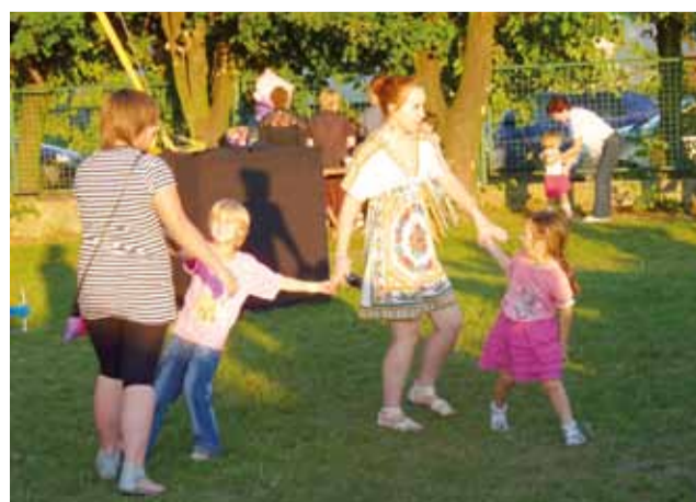
Pierwsze osoby pod sceną pojawiły się, gdy zaczął grać zespół „Party” z Płocka.

Jak się jednak okazało, sierpniowy termin nie pasował z kolei twórcom ludowym, którzy do tej pory zjeżdżali do Sannik, a którzy w tym roku nie dopisali. W tym samym czasie odbywał się bowiem duży kiermasz sztuki ludowej w Krakowie.