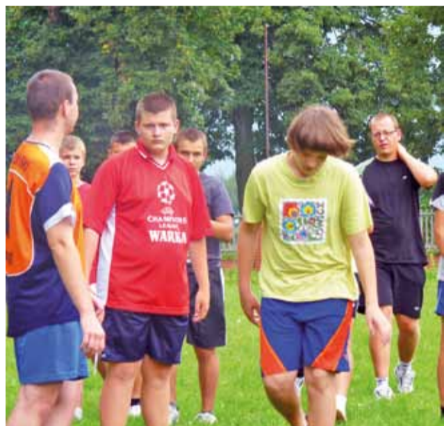
Ministranci swój wolny czas spędzali na grze w piłkę nożną.

Łowicz | Przygotowują się do służby lektorskiej