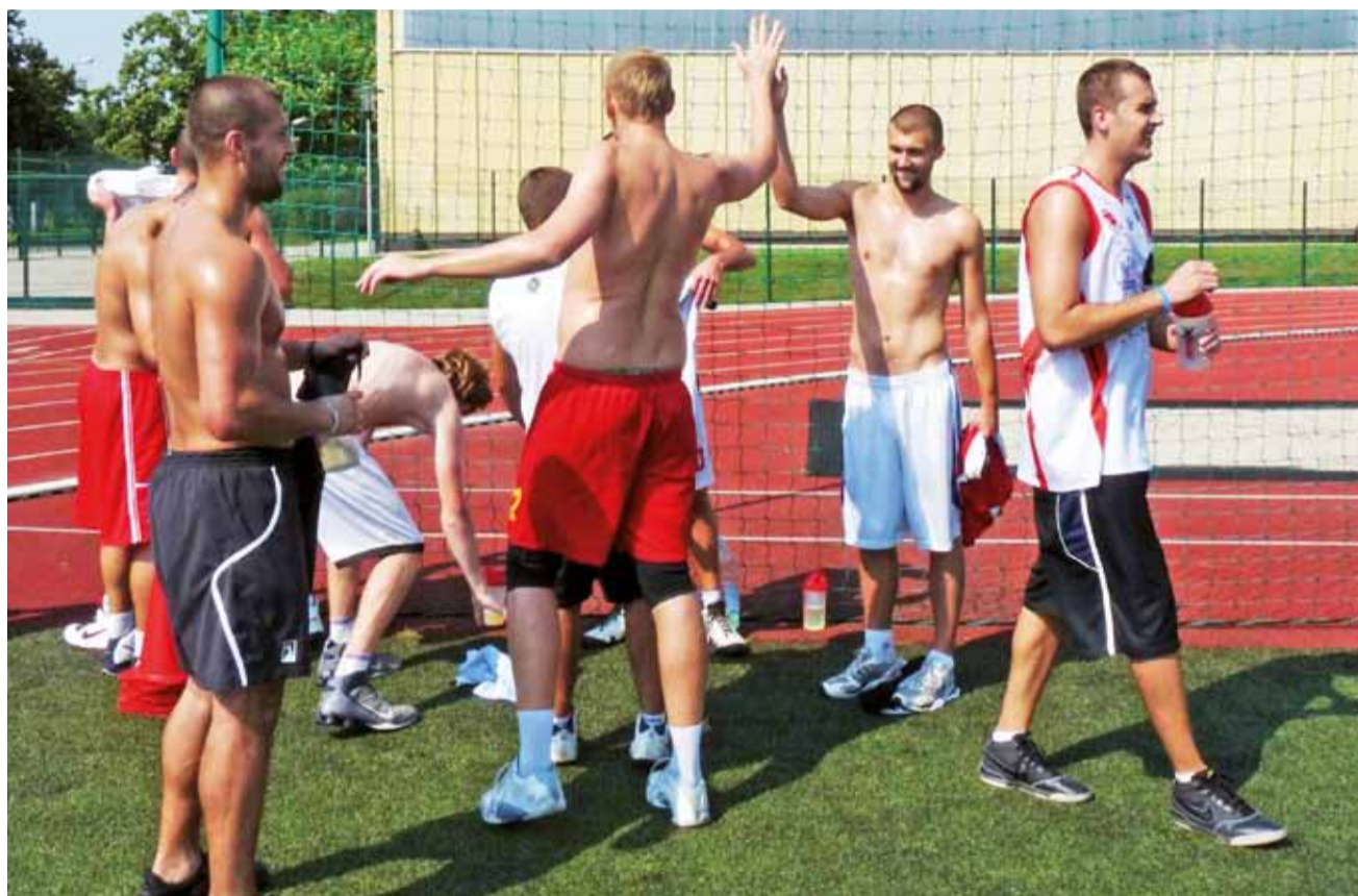
Jeszcze w piątek łowiczanie trenowali w terenie, a już następnego dnia ograli w Skierniewicach tamtejszy MKS.