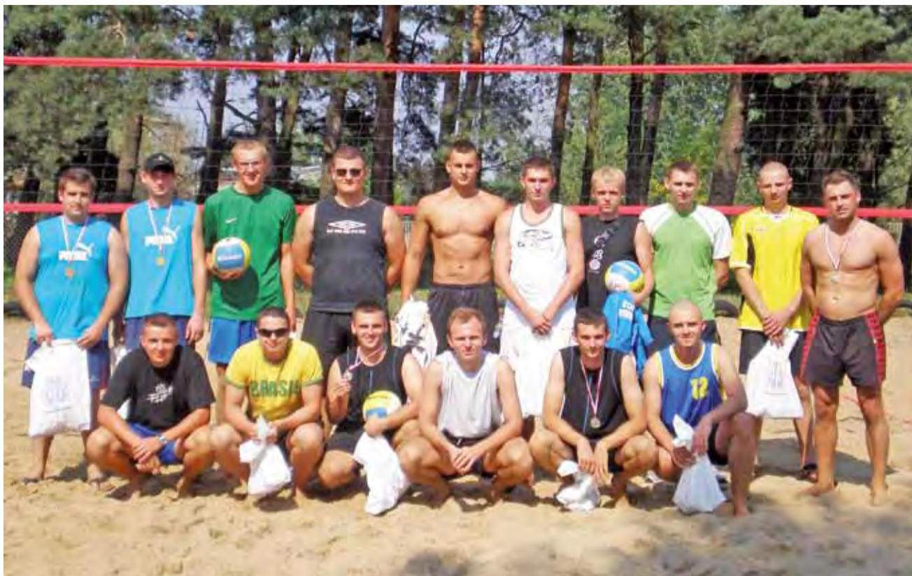
W turnieju plażówki na Korabce rywalizowało osiem zespołów.

Piłka siatkowa | Łowicki Turniej Siatkówki Plażowej Korabka 2011