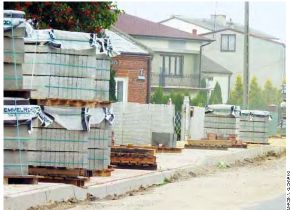
Budowa chodnika powinna zakończyć się w ciągu ok. 2 tygodni, kostka już jest.

W środę 31 sierpnia i w czwartek 1 września – po zamknięciu tego numeru NŁ, do Łowicza miał zostać sprowadzony sprzęt do układania masy bitumicznej. Do wyasfaltowania jest 528 metrów ulicy od strony centrum miasta do skrzyżowania z ul. Poznańską oraz około 1.260 metrów drogi za Poznańską w stronę ulicy Strzelcewskiej. mak