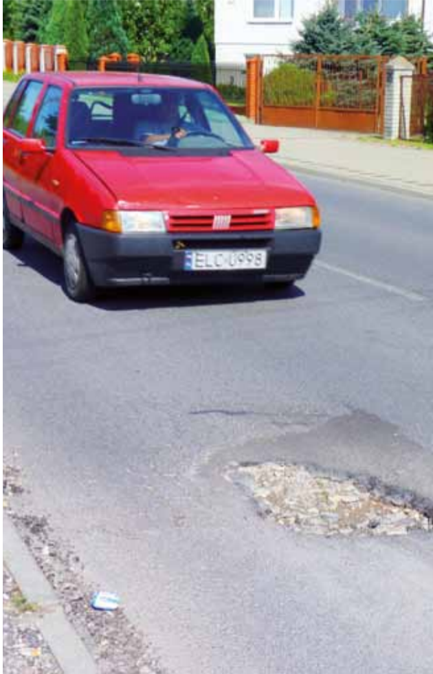
Wielu kierowców wpada w dziurę na ul. Kiernozkiej. Ilu z nich musi wymienić felgi?