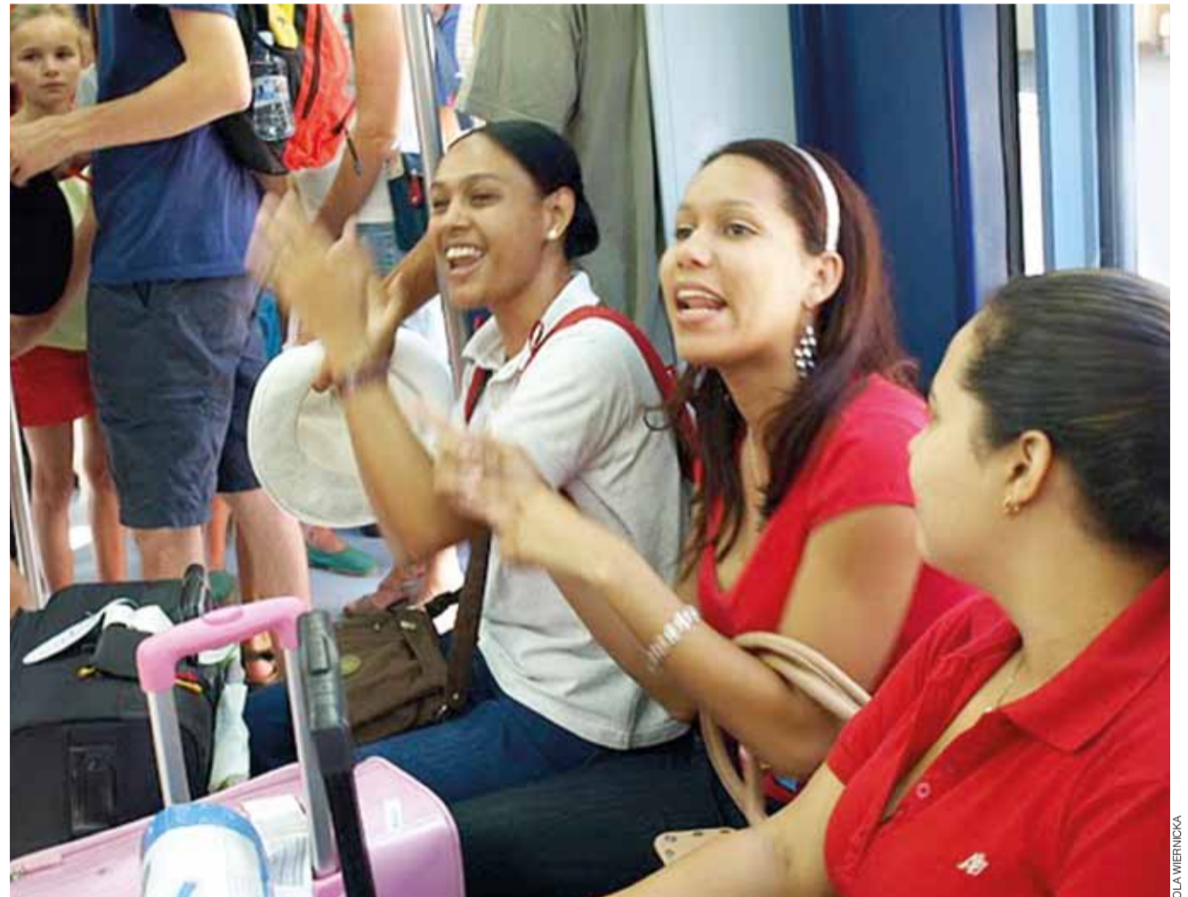
Niezapomniane chwile radości i braterstwa w madryckim metrze.