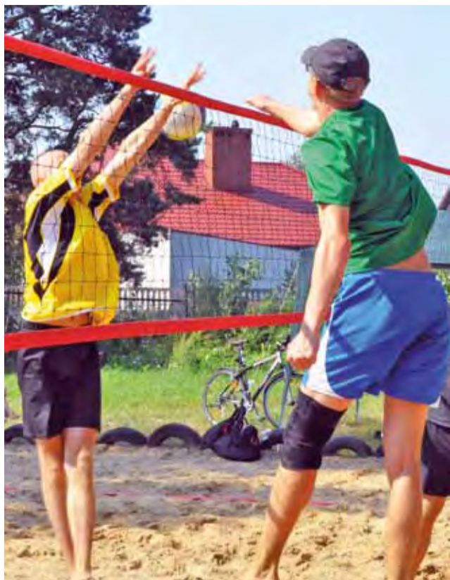
Sobotnia rywalizacja, pomimo upału, stała na wysokim poziomie.