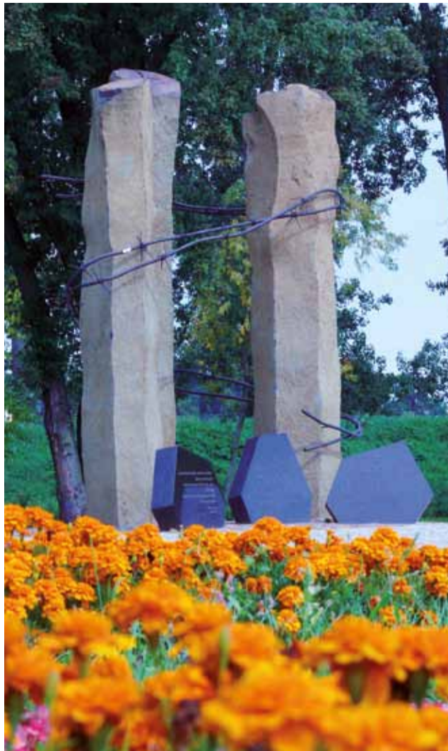
Widok na pomnik stojący w centrum parku przez kwiaty rosnące w rabatach tworzące łowicki pasiak.

Pod koniec roku utrzymanie parku stanie się jednym z zadań w ramach ogólnego przetargu, który ratusz ogłosi na konserwację zieleni. Konserwacja całej zieleni miejskiej za lata 2010 i 2011 kosztowała miasto 460 tys. zł – przetarg obejmował bowiem te dwa lata łącznie. tb