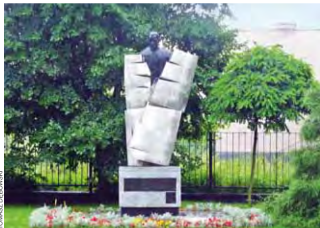
Pomnik po raz trzeci zmieni swoją lokalizację. Teraz stanie przed „Ekonomikiem”.

Łowicz | Odświeżenie pomnika 30 września