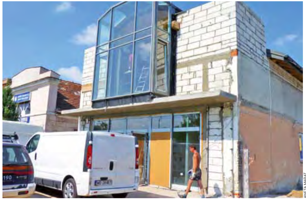
Nowa przychodnia przy ul. 3 Maja zostanie otwarta na początku października.