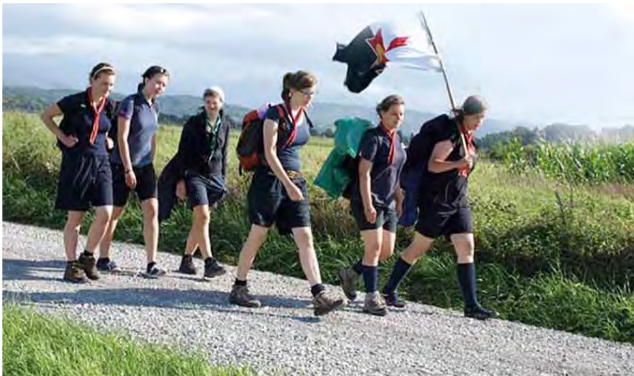
Camino znaczy droga. Skautki szły do Santiago różnymi drogami, zawsze miały nieco lepiej od skautów, bo ci nieśli cały ekwipunek w plecakach, je wyręczał autobus.