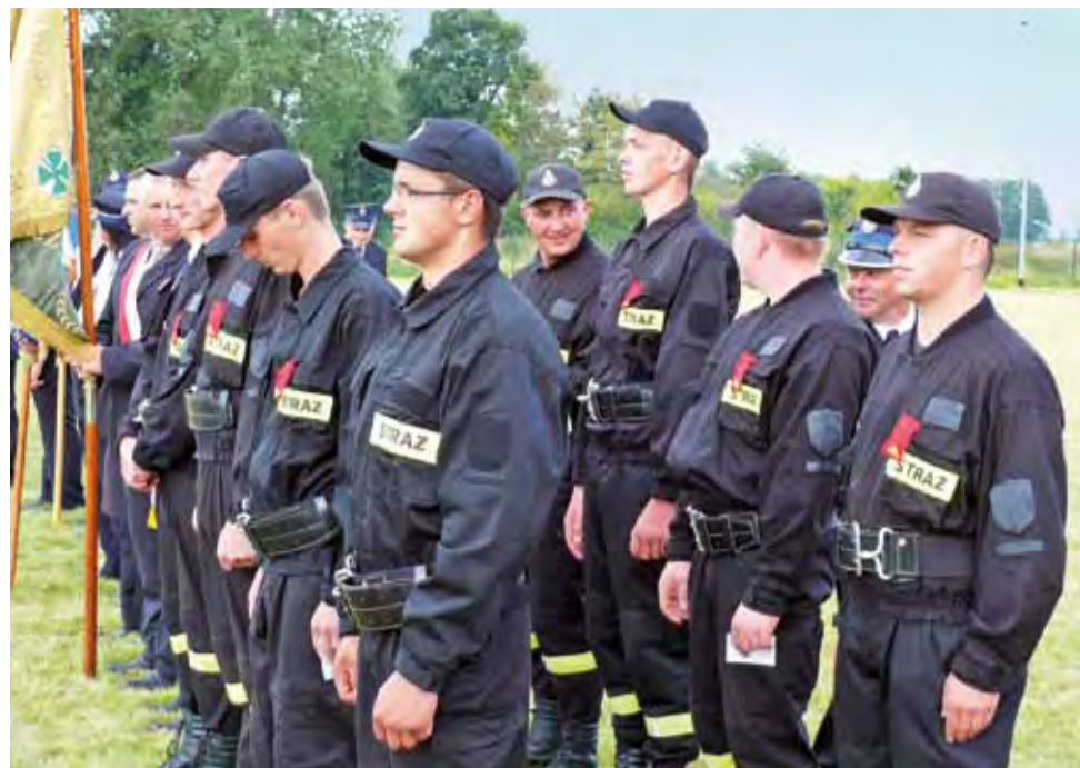
Pododdział strażacki Ochotniczej Straży Pożarnej Jamno w czasie uroczystości 100-lecia prezentował się w nowych mundurach.