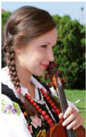
Śpiewające dzieci mogły liczyć na wsparcie skrzypiec.