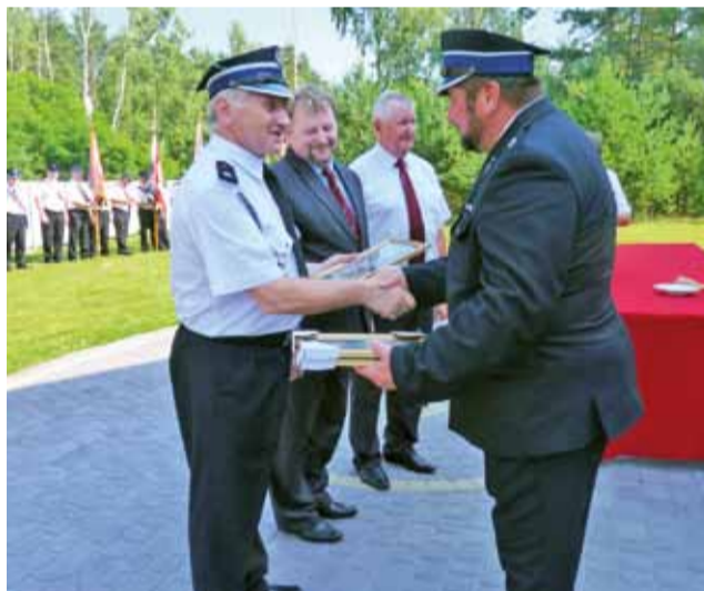
Prezes OSP w Dzierzgowie wręczał obrazki św. Floriana gościom, którzy uczestniczyli w jubileuszu OSP w Dzierzgowie.