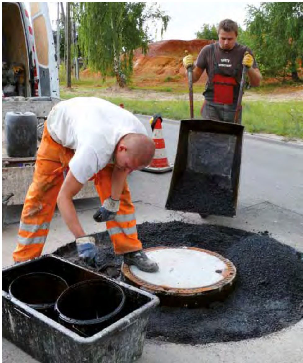
Pracownicy śląskiej firmy kończą prace naprawcze przy jednej ze studni.

ISSN 1231-479x | INDEKS 326097 (dot. RUCH)