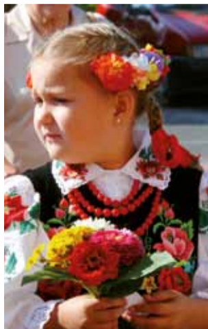
Dziewczęta przyniosły ze sobą mszę bukieciki.