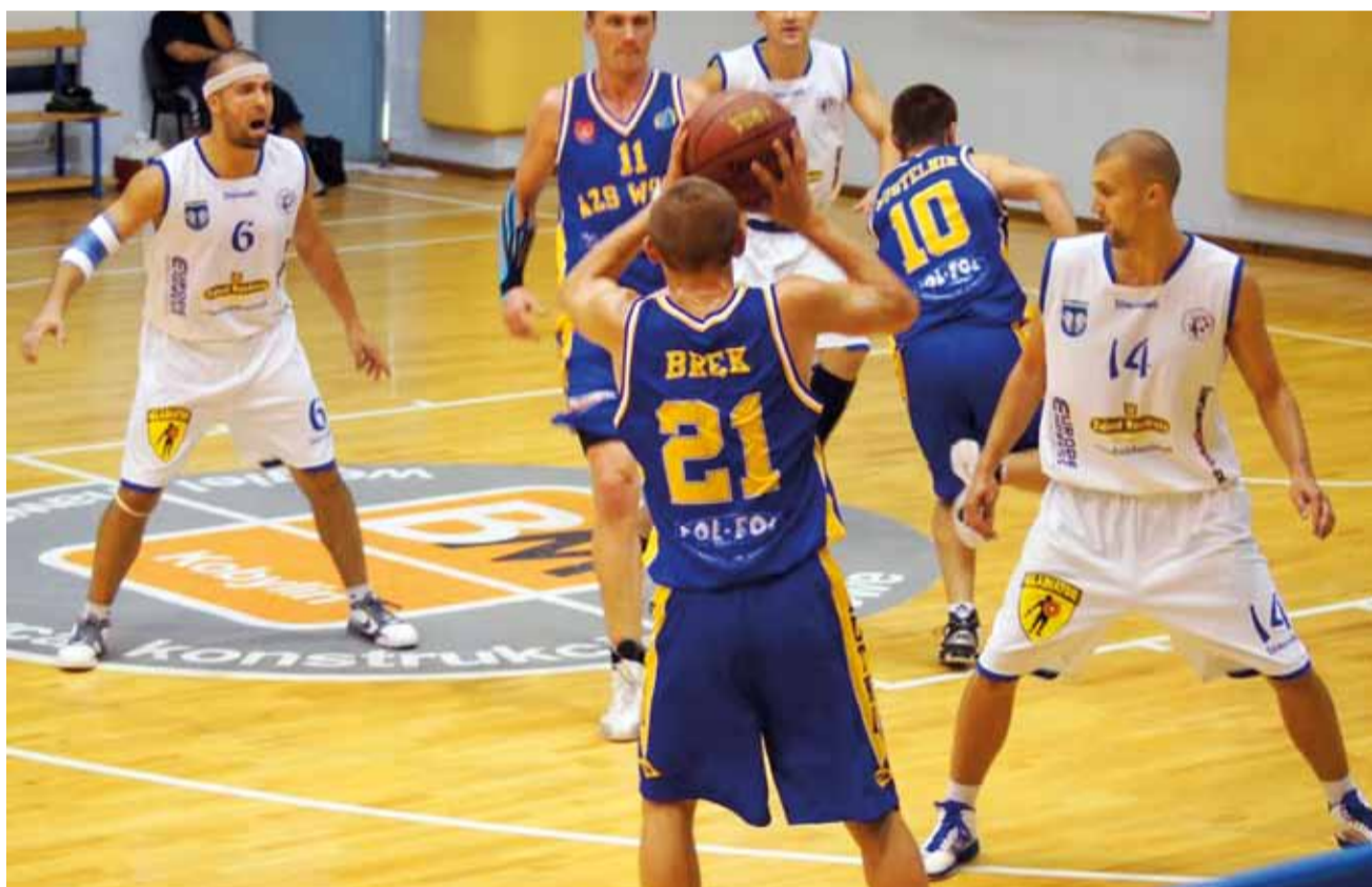
W drugoligowej drużynie Księżaka nastąpiły spore zmiany kadrowe, które zapewne wpłyną na postawę łowiczanie w nowych rozgrywkach. Działacze znad Bzury celują w tym sezonie na miejsce w play-off... A może uda się ugrać coś więcej?

Początek koszykarskich drugoligowych emocji w Łowiczu już w sobotę 24 września o godz. 18.30, kiedy to Księżak podejmował będzie u siebie zespół AZS Politechnika Poznańska Poznań.