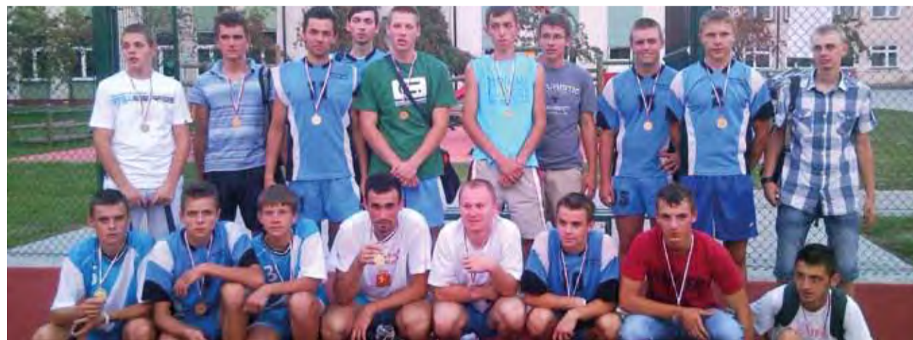
Siatkarze UKS Bzura Sobota znowu okazali się najlepsi. Najpierw wygrali w Zduńkach, a następnego dnia w Sobocie.