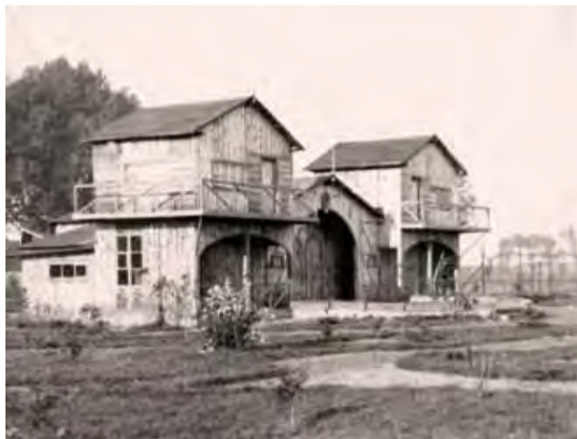
Co to było?

Ustalenie lokalizacji i funkcji obiektu z pewnością przyczyni się do pogłębienia wiedzy na temat 10 PP. Osoby, które potrafią rozwikłać tę zagadkę historyczną proszone są o kontakt z redakcją NŁ. ■