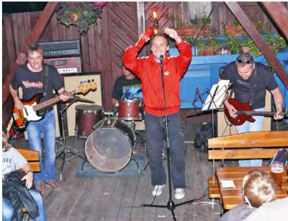
Bluesrockowy zespół Dzień Zapłaty zagrał w Pizza House przy ul. 3 Maja, występ oglądało i słuchało kilkadziesiąt osób.

W najbliższy weekend pizzeria ponownie zaprosi na żywe granie, informacje o tym kto wystąpi podamy na stronie internetowej www.lowicznanin.pl tb