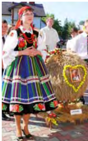
Delegacja z Zawad ze swoim wieńcem.