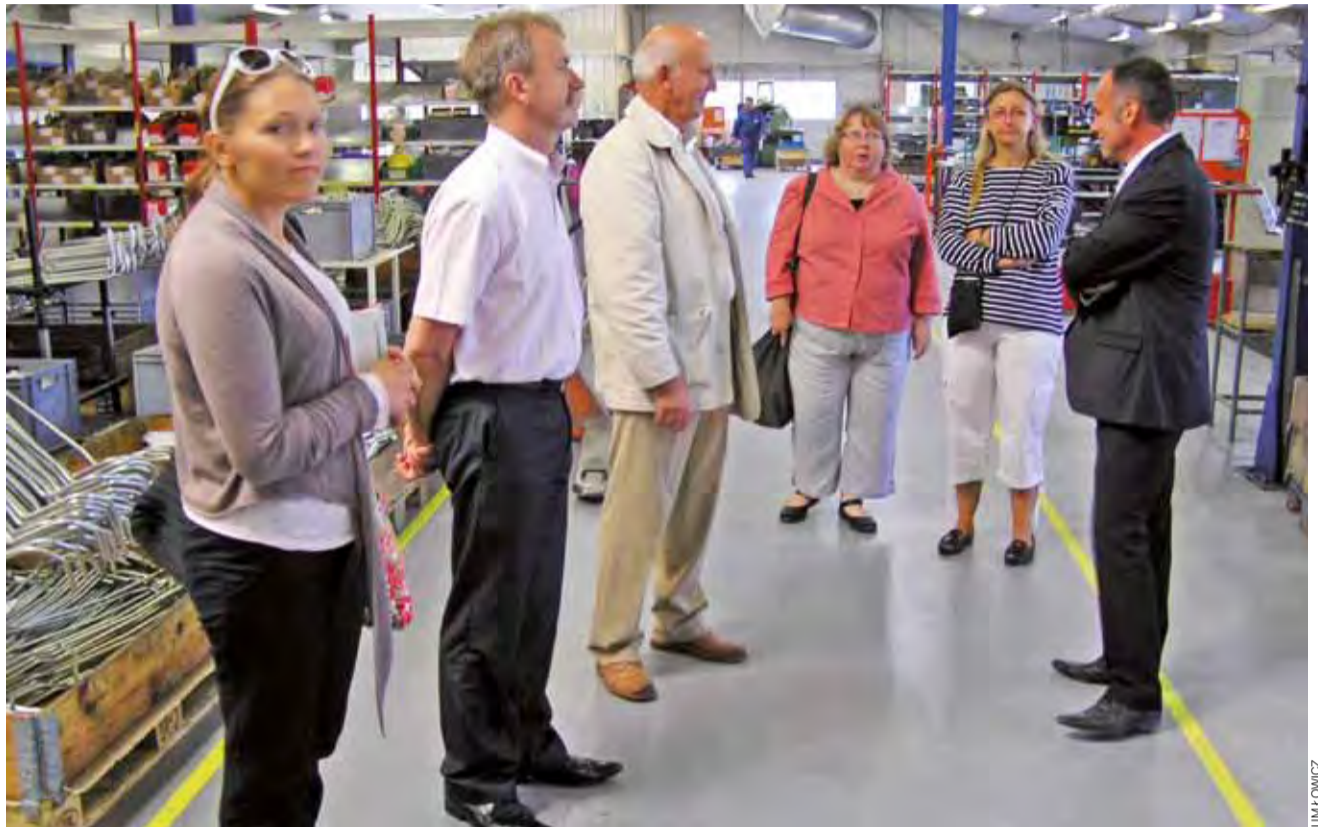
W fabryce Altia powstają kompletne kabiny do ciągników Ferguson.