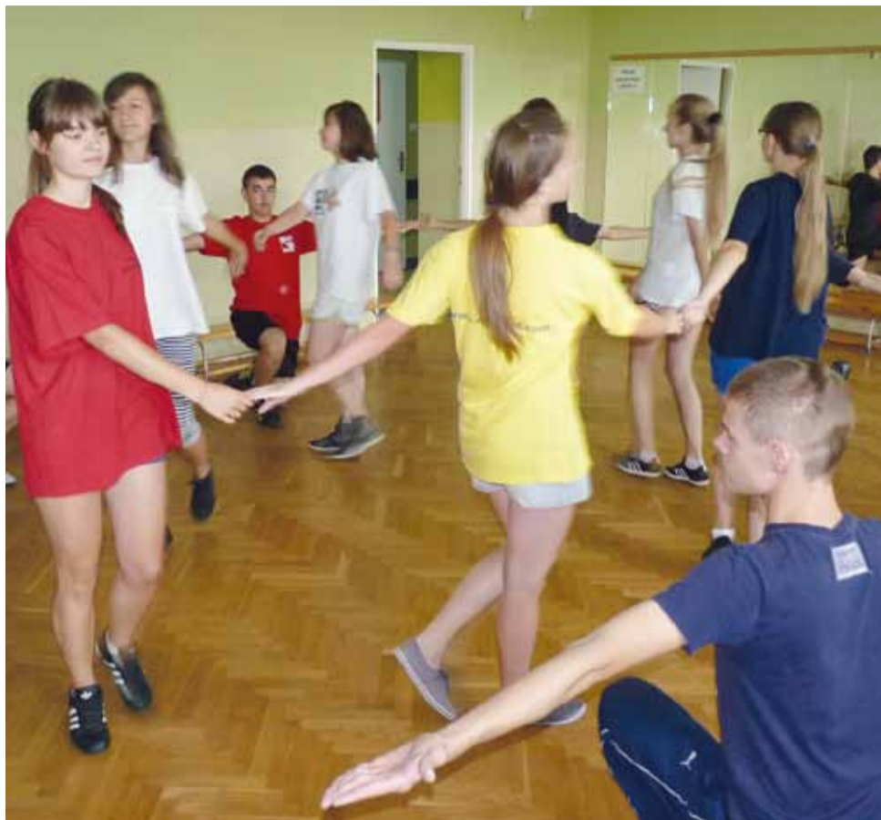
W czasie roku szkolnego próby Koderek odbywają się dwa razy w tygodniu.