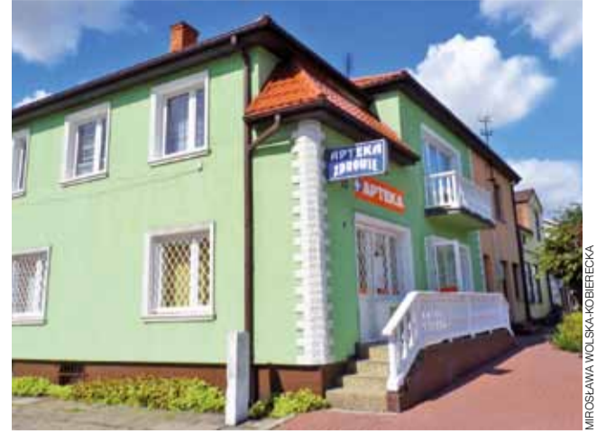
Jeden z narożnych domów przy głównym rynku w Kiernozi. Jak widać nie ma oznakowania ani nazwy rynku, ani odchodzącej od niego ulicy.