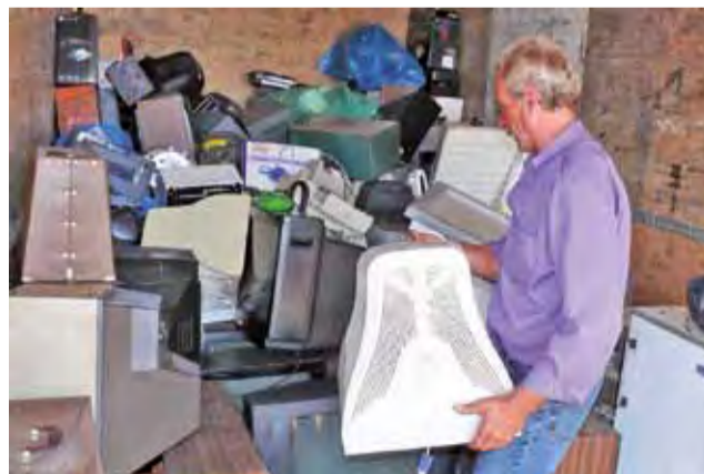
W Łowiczu trwa kolejna zbiórka starych, niewykorzystywanych elektrouządzeń, można je oddać w soboty w wyznaczonych punktach.

Ilość oddanych przedmiotów nie była tym razem oszałamiająca, firma liczyła, że będzie ich więcej. Mieszkańcy Łowicza, którzy mają jeszcze stare, nieużywane sprzęty RTV i AGD będą mogli go oddać w kolejne soboty września: 10 września przy skrzyżowaniu ul. Grunwaldzkiej z ul. Brzozową, 17 września na parking przy pawilonie PSS „Społem” na ul. Łęczyckiej, 24 wrze-