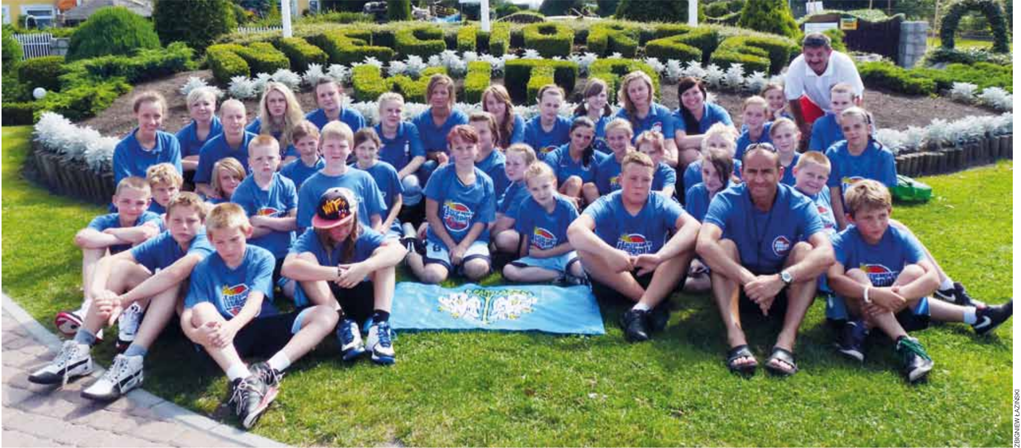
Koszykarki i koszykarze łowickiego Księżaka do nowego sezonu przygotowali się na obozie sportowym w nadmorskim Niechorzu.

Koszykówka | Przygotowania UMKS Księżak do sezonu 2011/12