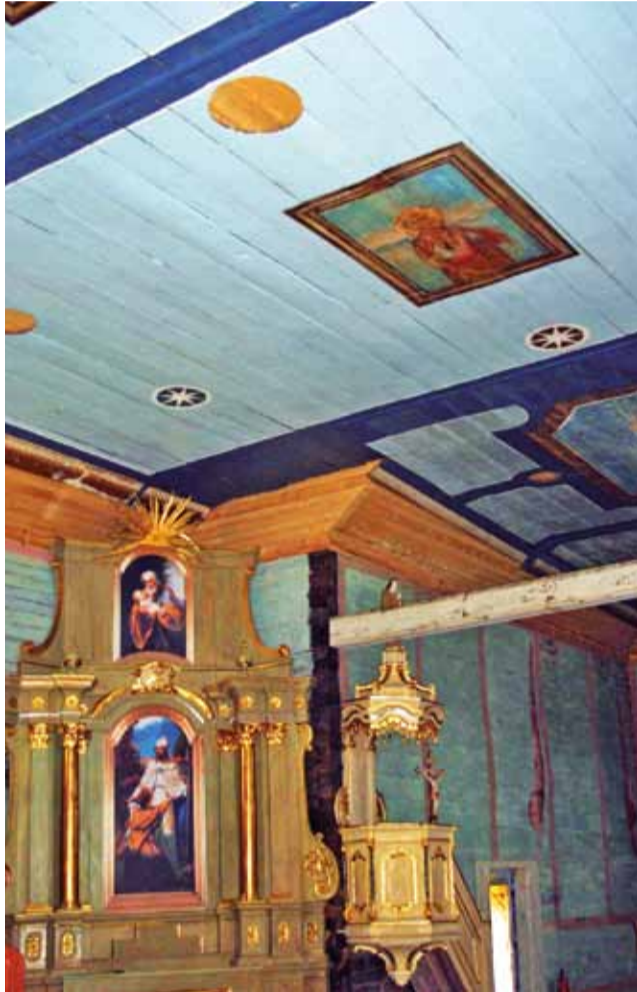
Zabytkowy kościół został odnowiony. Dla turystów zostanie otwarty w przyszłym roku.

W tej chwili kościół można oglądać na życzenie. Oficjalne otwarcie ma nastąpić już w przyszłym roku. td