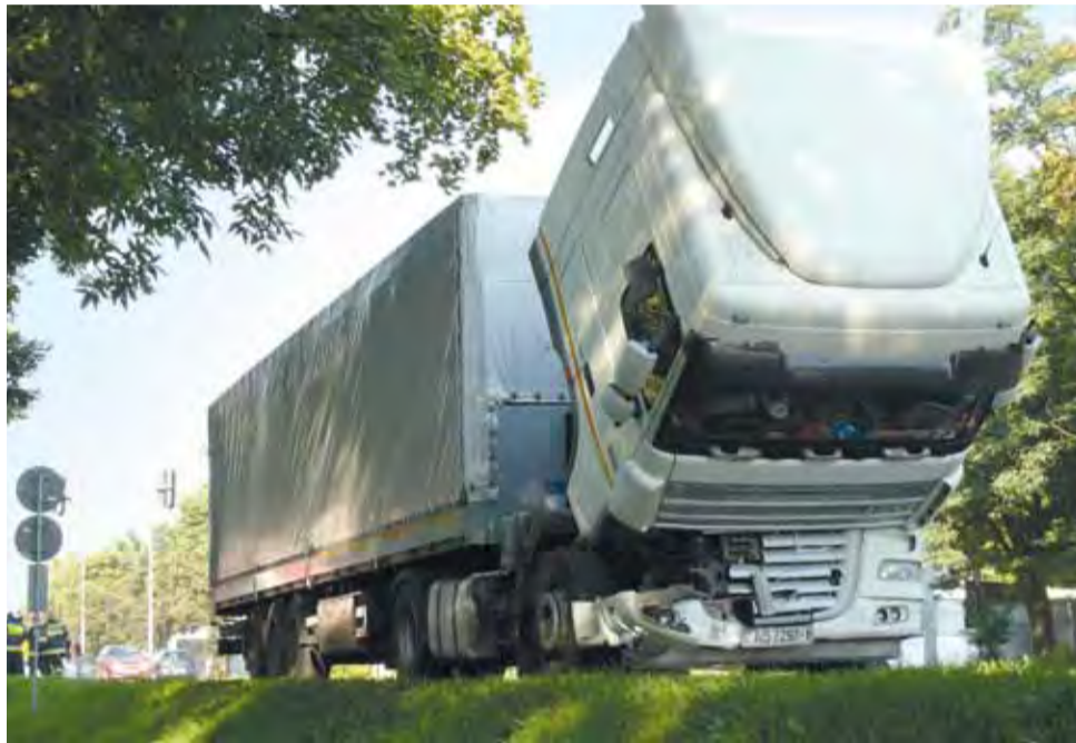
TIR w wyniku zderzenia uszkodził część karoserii pod kabiną. Kierowca nie odniósł żadnych obrażeń.

TIR marki DAF prowadzony przez 34-letniego Białorusina, nadjechał od strony Poznania. Wjeżdżając na skrzyżowanie uderzył w przejeżdżający przez nie samochód Opel Kadet, który prowadził 48-letni mieszkaniec powiatu łowickiego. W wypadku ucierpiał kierowca tego ostatniego pojazdu, trafił do szpitala ze stłuczeniem kręgosłupa. Jego samochód został poważnie uszkodzony, TIR na-