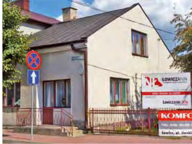
Jedna z niewielu zachowanych tablic na Rynku Kopernika jest jeszcze widoczna, ale w większości ulic oznakowania ich nazw nie ma.

■ Waldemar Woliński – radny z Plaskocina nie miał na koniec roku zgromadzonych środków pieniężnych. Jest właścicielem domu o pow. 100 m 2 , wartości 79.500 zł oraz gospodarstwa 21,90 ha, wartości 356.000 zł oraz 168.000 zł z zabudową murowaną. Z tytułu jego prowadzenia osiągnął przychód 50.000 zł, dochód 10.000 zł, wysokości dopłat nie podał. Jako radny odebrał diety w wysokości 2.460 zł. Posiada ciągnik Zetor z 1990 roku, wartości 18.000 zł. Nie ma zobowiązań pieniężnych powyżej 10.000 zł. mwk