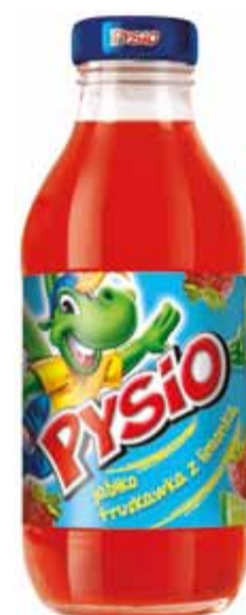
Sok w kolorze czerwonym ma smak jabłka, truskawki i limonki.