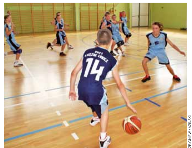
Po emocjonującym meczu młodziczki wygrały jednym punktem.