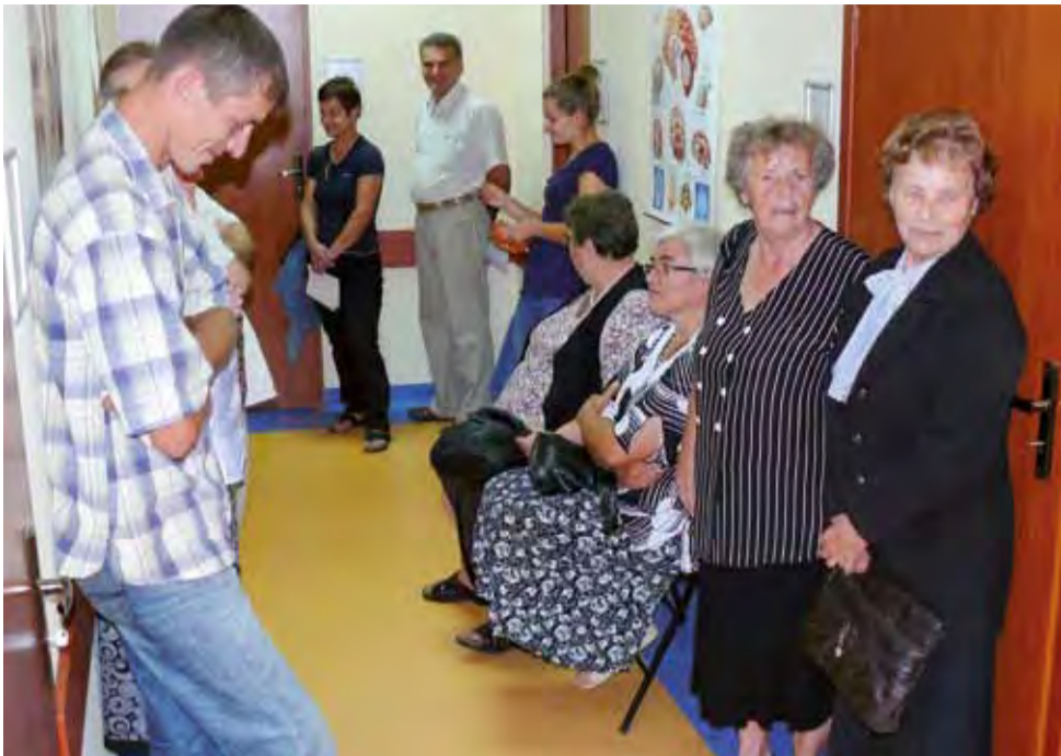
W poczekalni NZOZ Vitamed na Korabce w czasie Białej Niedzieli było cały czas tłoczno. W sumie przyjęto 150 osób.