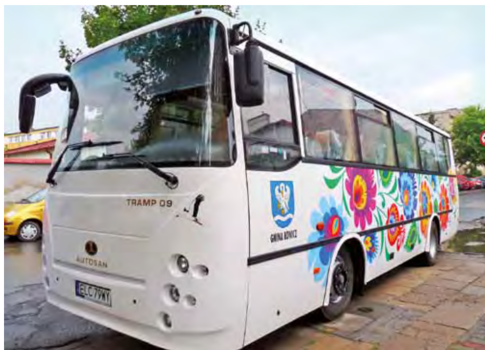
Autobus z wycinanką będzie przede wszystkim wykorzystywany w szkolnych dowozach.

Autobus kosztował 418 tys. 200 zł. Ma 39 miejsc siedzących. Wykorzystywany jest już w szkolnych dojazdach oraz w innych wyjazdach, np. na