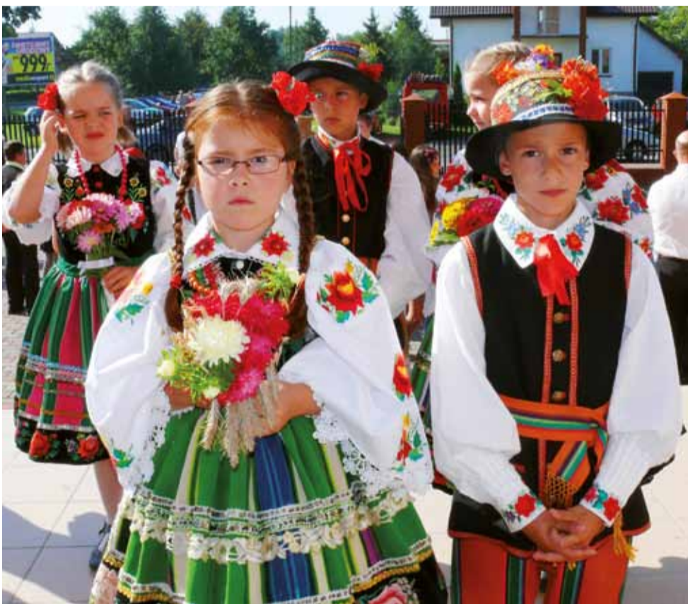
Dzieci, m. in. z Jastrzębi, ubrane w ludowe stroje, wzięły udział w oprawie mszy świętej.

Łowicz | Parafia Chrystusa Dobrego Pasterza