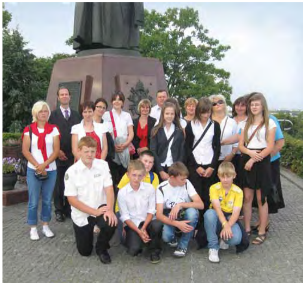
Gimnazjaliści wraz z opiekunami pod pomnikiem Jana Pawła II na Jasnej Górze.

Szkoła to nie tylko miejsce pracy nauczycieli. Szkoła to żywa struktura, którą tworzą uczniowie, rodzice i nauczyciele. Ważna jest też dobra współpraca ze środowiskiem, dlatego dla mieszkańców i zainteresowanych osób chcemy organizować Dni Seniora czy Dni Otwarte.