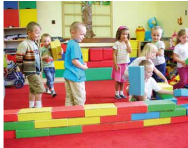
Przedszkole w Kęszycach jest wyposażone we wszystko, co potrzebne dzieciom.

Opiekunka grupy z Kęszyc pozytywnie wypowiada się także o zmianach w świadomości i podejściu rodziców, którzy coraz bardziej się aktywizują, chociażby przy organizowaniu uroczystości. Dość szybko zanikły też u nich obawy, że przedszkole zabierze dzieciom dzieciństwo i przekonanie, że również dobrze dzieci mogą do czasu półrocznej do szkoły przebywać