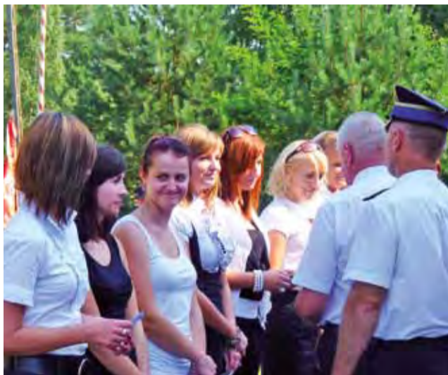
Dziewczyny w straży? Jak najbardziej – uważają druhowie. Za działalność w zawodach pożarniczych otrzymały odznaki Strażaka Wzorowego.

Kiedy w sobotę wręczono odznaczenia, wozy strażackie przejechały na sygnale dookoła remizy. Później zaproszeni goście udali się na obiad. Na ustawionej na zewnątrz scenie zagrali dla strażaków i ich gości dziecięco-młodzieżowy Zespół Ludowy Krzewina działający przy filii GOK w Bobrownikach oraz Zespół Ali i Babki z Koła Seniorów w Belchowie. Wspólna zabawa na świeżym powietrzu trwała jednak jeszcze kilka godzin.