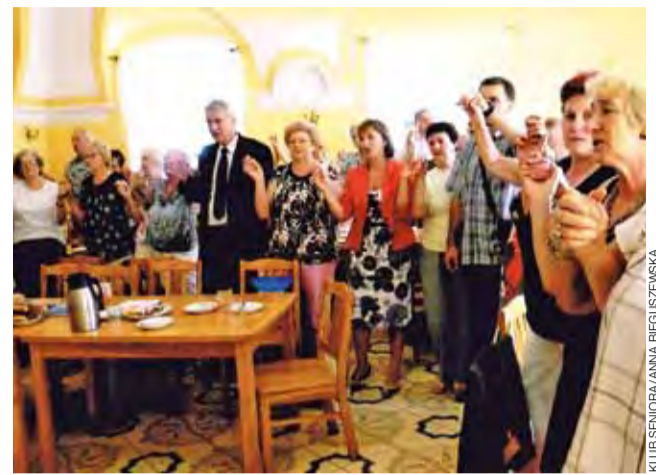
Integracyjne spotkanie seniorów nie mogłoby odbyć się bez śpiewu.

Gospodarze zakwaterowali łowickich klubowiczów w internacie Specjalnego Ośrodka Szkolno-Wychowawczego dla Dzieci Niewidomych w Owińskach. Oprowadzono też gości po placówce, która ma 60-letnią historię i jest jedną z najnowocześniejszych w kraju. – Nikt