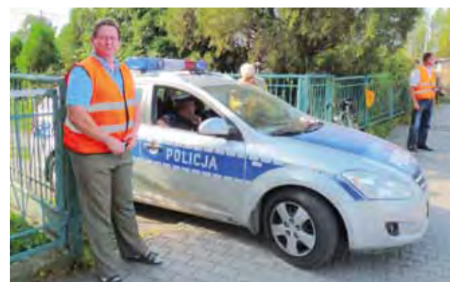
Kontrole na przejazdach kolejowych prowadzą wspólnie policjanci, SOK-iści i pracownicy sekcji eksploatacji PKP PLK.

Akcja kontrolna rozpoczęła się pechowo dla starszego rowerzysty z Łowicza. Minał on rowerem radiowóz z 2 policjantami i wjechał lewą stroną drogi na przejazd - już po opuszczeniu prawej rogatki. Po drugiej stronie przejazdu stał jednak patrol SOK. Rowerzysta zauważył wychodzą-