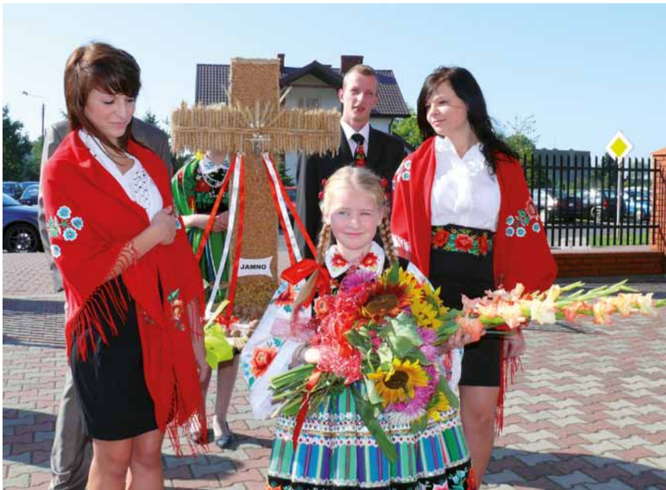
Reprezentacja Jamna przyniosła wieńiec oraz bukiet kwiatów.