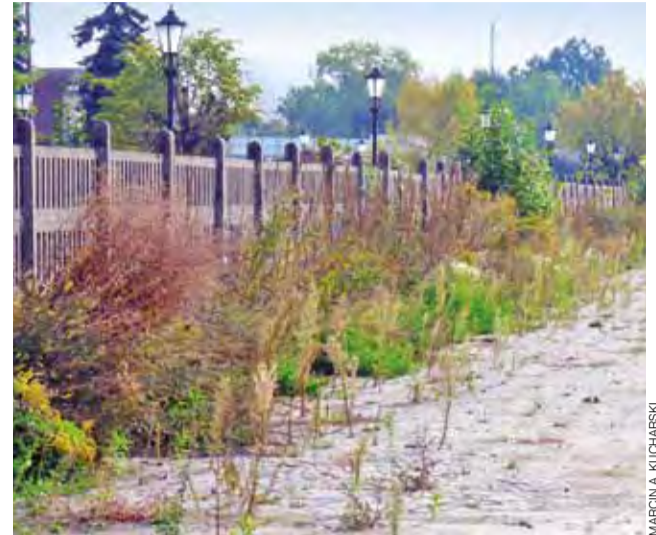
Dawna rampa kolejowa wzdłuż 3 Maja zarasta krzakami. Jak długo jeszcze będzie stała nieużywana?

Mniejsza działka, będąca kolejowym terenem u zbiegu ulicy Kaliskiej i Powstańców (powierzchnia 5.226 m 2 ) miała ustaloną w pierwszym przetargu cenę wywoławczą w wyso-