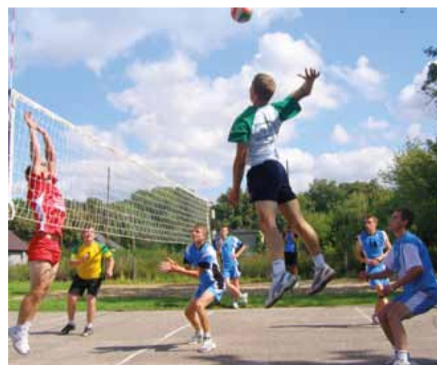
Drużyna UKS Bzura prezentuje całkiem solidny poziom.