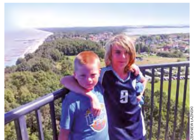
Młodzi koszykarze Księżaka „zdobyli” latarnię, z której można podziwiać przepiękny widok na Niechorze.

■ Kadra Obozu – UMKS Księżak Łowicz (II LK) 3:1 (21:14, 25:16, 20:22, 21:13)