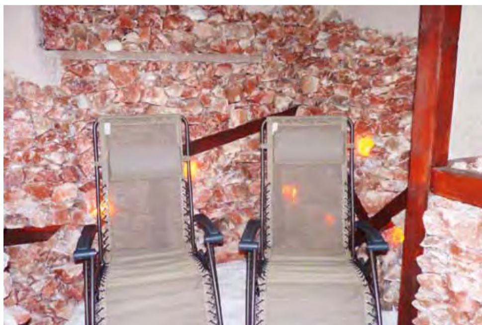
Wygodne fotele tylko „czekają”, by ktoś na nich usiadł.

Do budowy grotty zostało wykorzystanych ok. 5 ton soli z kopalni w Kłodawie. Koszt jej wykonania przez firmę Vitual Sauna ze Szczecina wyniósł 45 tys. zł. Pieniądze na ten cel zostały zapisane przez radnych w budżecie miasta kilka miesięcy wcześniej. Grota solna została urządzona w pomieszczeniu sąsiadującym z sauną, którą również wcześniej wykonała i zamontowała ta sama firma Vitual Sauna. Bryły soli zostały