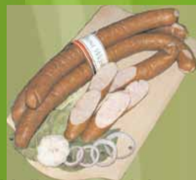
kiełbasa wiejska drobiowa