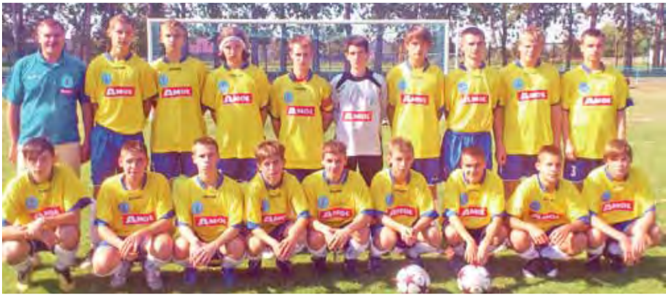
Piłkarze Lakozy-96 Łyszkowice na starcie debiutanckiego sezonu zgromadzili na koncie już 5. punktów.

Piłka nożna | 3. kolejka wojewódzkiej ligi Deyny