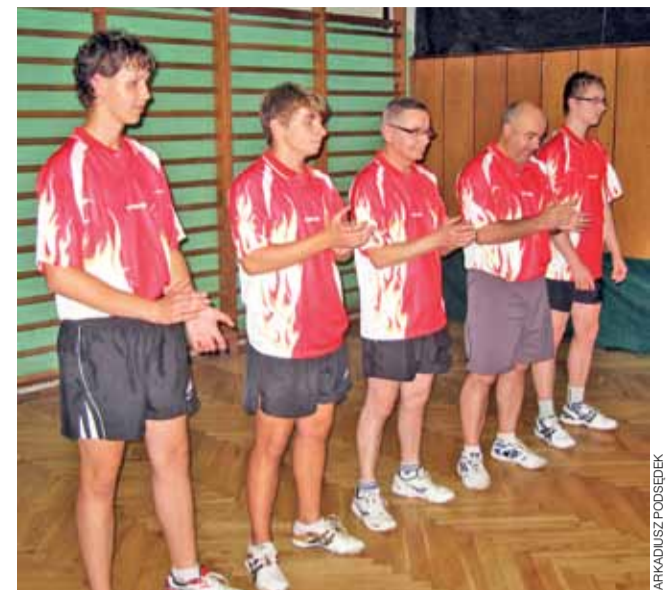
Księżak rozpoczął nowy sezon od wysokiego zwycięstwa w III lidze.