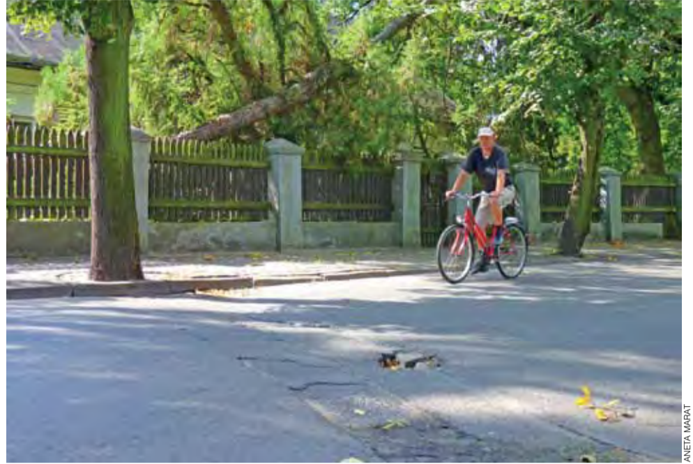
Aleje Sienkiewicza i dziury, które zostały do zrobienia.

znaczoną konkretną długość nawierzchni do remontu. – Musimy się trzymać dokumentacji. Nie możemy wykraczać poza nią, ponieważ istniała by wówczas obawa, że stracimy dofinansowanie – wyjaśnia Pełka. Zapewnia jednak, że nawierzchnia zostanie poprawiona przez miasto i będzie to jedno z bieżących zadań w ramach utrzymania stanu dróg. am