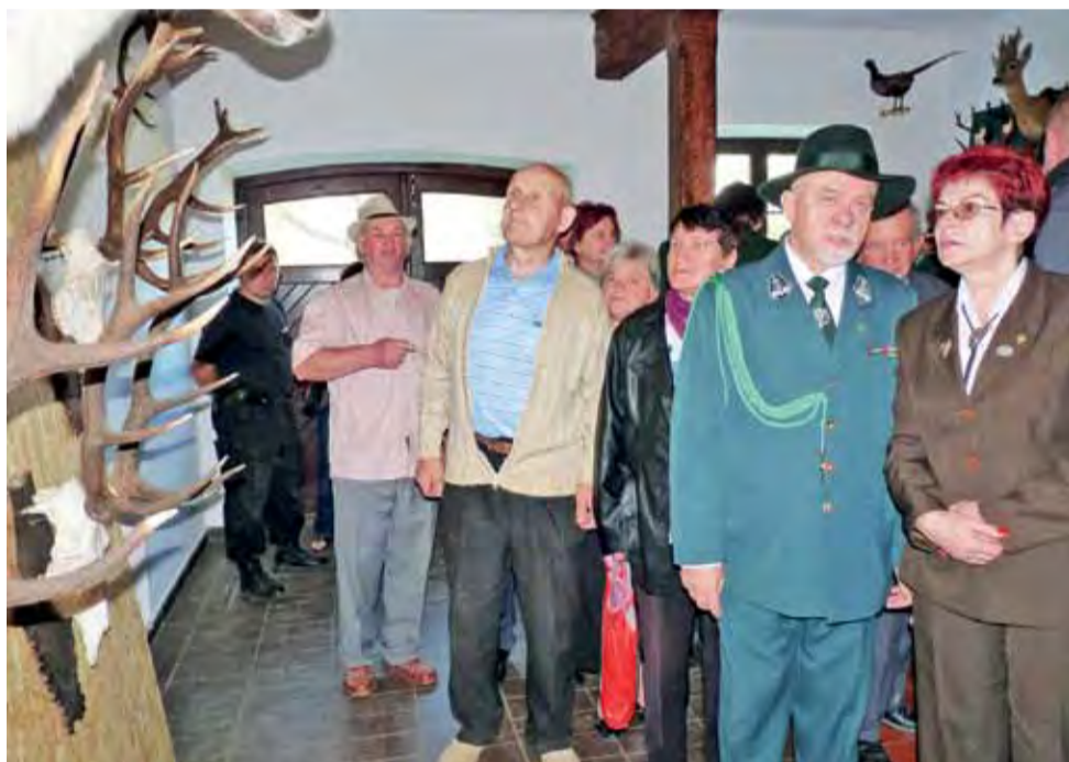
Choć na wystawę trofeów, nie dotarło to najważniejsze, to goście i tak oglądali zgromadzone eksponaty z nieukrywanym podziwem.

Najbardziej emocjonującym momentem festynu, przynajmniej dla najmłodszych jego uczestników, było wręczenie nagród w konkursie plastyczno-fotograficznym, który dotyczył ochrony środowiska i łowiectwa. Konkurs rozegrano w trzech kategoriach wieko-