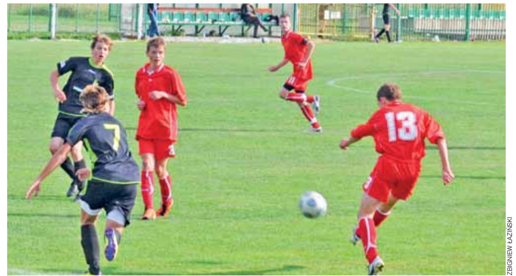
Pelikan-96 gra w „kratkę”. W pięciu meczach łowiczanie wygrali dwa mecze, a trzy razy kończyli bez punktów.