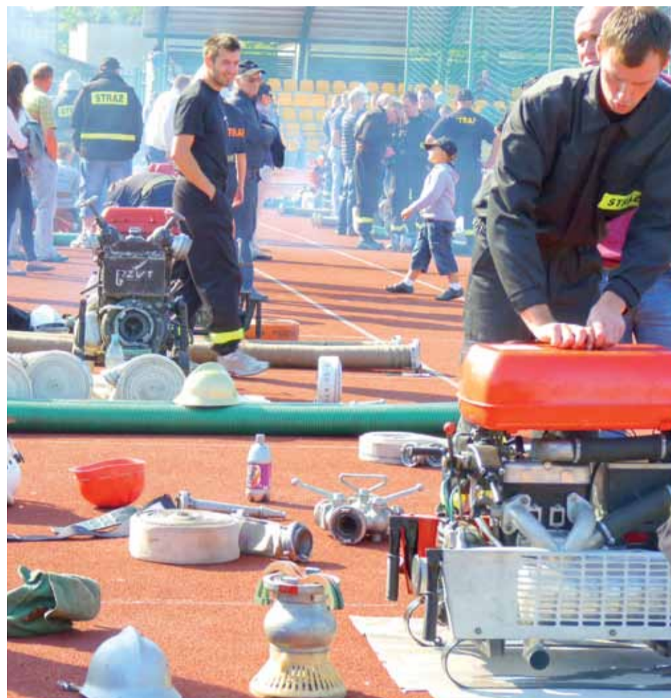
Hałas silników strażackich prądnic był słyszalny nawet kilka ulic od łowickiego stadionu.

niewielkie różnice punktowe. Na najwyższym stopniu podium stanęli ponownie strażacy z OSP Wrzeczko z gminy Łyszkowice zdobywając 101,02 pkt. II miejsce zajęli druhowie z OSP Dzierżgów z gminy Nieborów z 104,16 pkt., a III miejsce OSP Waliszew z gminy Bielawy zdobywając 104,96 pkt. Tuż za podium, znaleźli się natomiast strażacy z OSP Stroniewice z gminy Domaniewice ze 105,11 pkt. Dalsze miejsca zajęli druhowie z OSP Złaków Borowy z gminy Zduny, OSP Niedzielska z gminy Kiernozia, OSP Bocheń z gminy Łowicz, OSP Czatonin z gminy Łyszkowice, OSP Wicie z gminy Kocierzew, OSP Przemysłów z gminy Chaśno i OSP Łowicz. Tę ostatnią jednostkę od zwycięzców dzieliło ponad 30 punktów różnicy. W tym roku zawody powiatowe nie są eliminacyjnymi. Dopiero za dwa lata zwycięzcy, z rozgrywanego wówczas etapu powiatowego, przejdą do szczebla wojewódzkiego. Zawody na etapie wojewódzkim odbywają się co 4 lata.