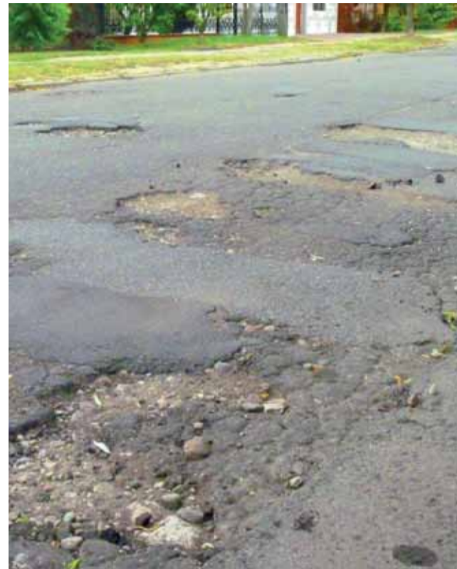
Samochody starają się omijać dziury z daleka, ale nie zawsze jest to wykonane.