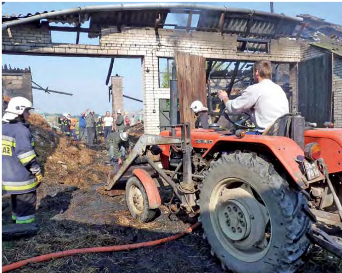
Stodoła spłonęła niemal doszczętnie. Pożar gasili strażacy z PSP i OSP, pomagali także sąsiedzi.