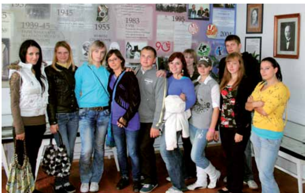
Uczniowie z Blichu w jednej z sal muzeum ZNP w Pilaszkuwie.