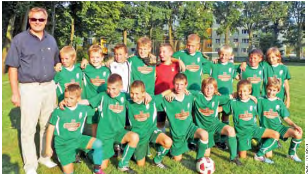
Ekipa Pelikana-2000 objęta już prowadzenie w rozgrywkach ligi okręgowej orlików.

■ Białka Biała Rawska – Pelikan Łowicz 2:5 (2:5) ; br.: Kacper Rzeźny, Mikołaj Kwasek, Błażej Grzegory-Roróg i Grzegorz Jaska.