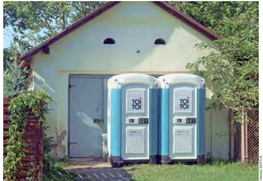
Toalet publicznych w centrum Nieborowa nie będzie, gmina postanowiła je usunąć po wyraźnych protestach mieszkańców miejscowości.

Osobom chcącym skorzystać z toalet w centrum Nieborowa pozostanie udać się do toalety znajdującej się w zabudowaniach parkowych okalających pałac w Nieborowie. Wójt jest zdania, że zaspokoi to potrzeby turystów, którzy gdy przyjeżdżają do Nieborowa, zazwyczaj kierują swe kroki do parku i pałacu czy restauracji. tb