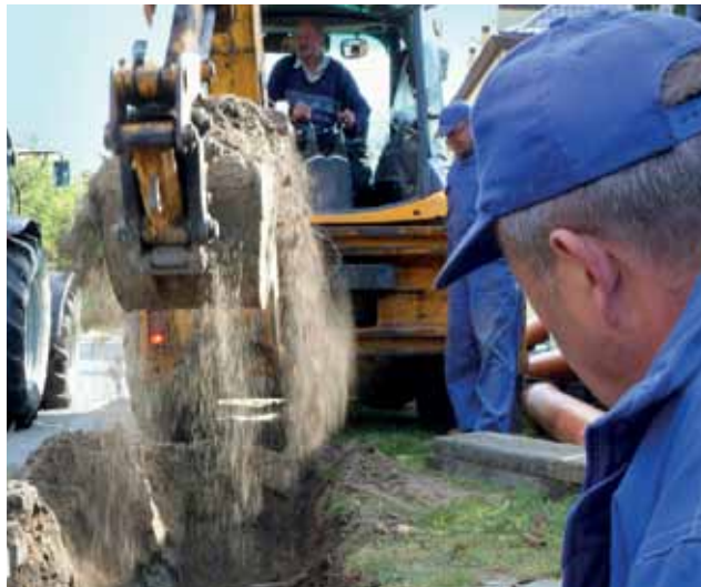
Naprawa kanalizacji deszczowej w ul. Starościńskiej polegała na wymianie starych betonowych rur na rury z PCV.