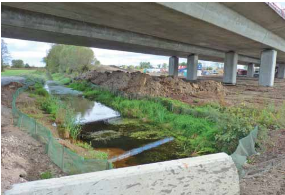
To jest teren Natura 2000, więc plac budowy oddzielono od strumyków i łąk plastikową folią, budowę nawiedza co tydzień inspektor ochrony środowiska, a w okresie migracji żab zatrudniono 2 ludzi, by je wyłapywali i przenosili na drugą stronę budowy. Pracowali 2 dni, przenieśli ich 3 tysiące.