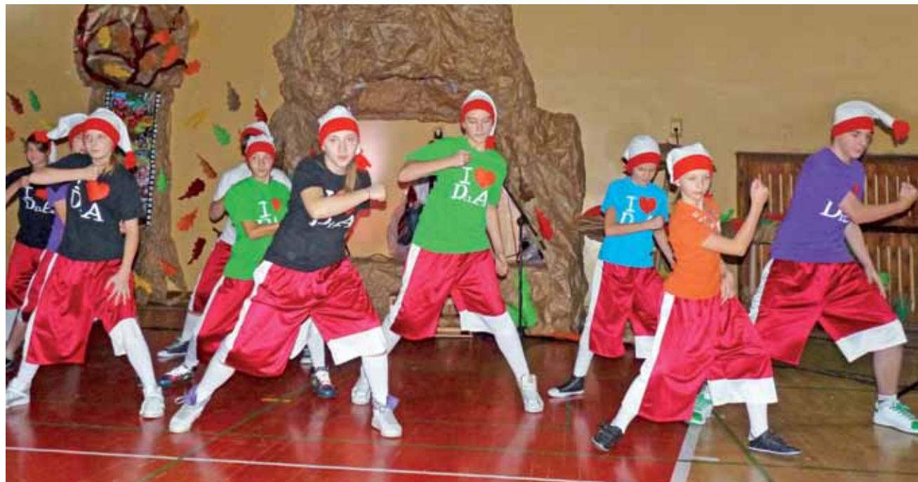
Gośćcinie w „Czwórce” wystąpił zespół DNA, tym razem tancerze przebrani byli za krasnale.

Zaproszeni goście – władze miasta, powiatu, dyrektorzy