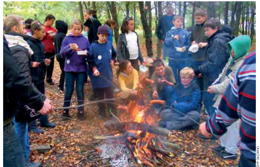
Ognisko. Tego na harcerskiej imprezie zabraknąć nie mogło.

Na jarmarku, adresowanym do dzieci i młodzieży z terenu miasta i gminy Głowno, Łowicza, Strykowa oraz Domaniewic, można było błysnąć talentem, a także nauczyć się nowych umiejętności, np. strzelania z łuku. Z powodu deszczowej pogody impreza odbywała się głównie na terenie Szkoły Podstawowej nr 1, a nie jak planowano wcześniej – w plenerze nad zalewem. Mimo kapryśnej aury, na zalewie odbywały się zjścia żeglarskie, prowadzone przez Akademię Animatorów Społecznych. Młodzi adepci żeglarstwa zapoznali się z podstawowymi zasadami pływania na łodzi typu Omega. Każdy otrzymał „Książeczkę młodego żeglarskiego” zawierającą sprawności żeglarskie oraz podstawowe informacje. Animatorzy zadbałi o niecodzienne atrakcje i upomnieli o bezpieczeństwo i przeprowadzili akcję ratunkową.