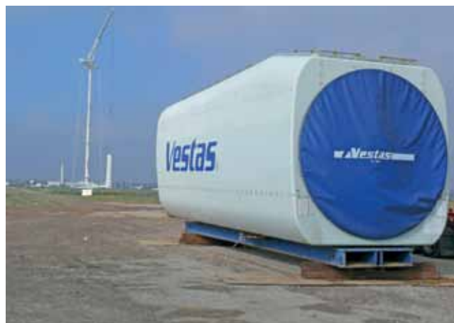
Taka turbina umocowana została na wysokości 105 m.