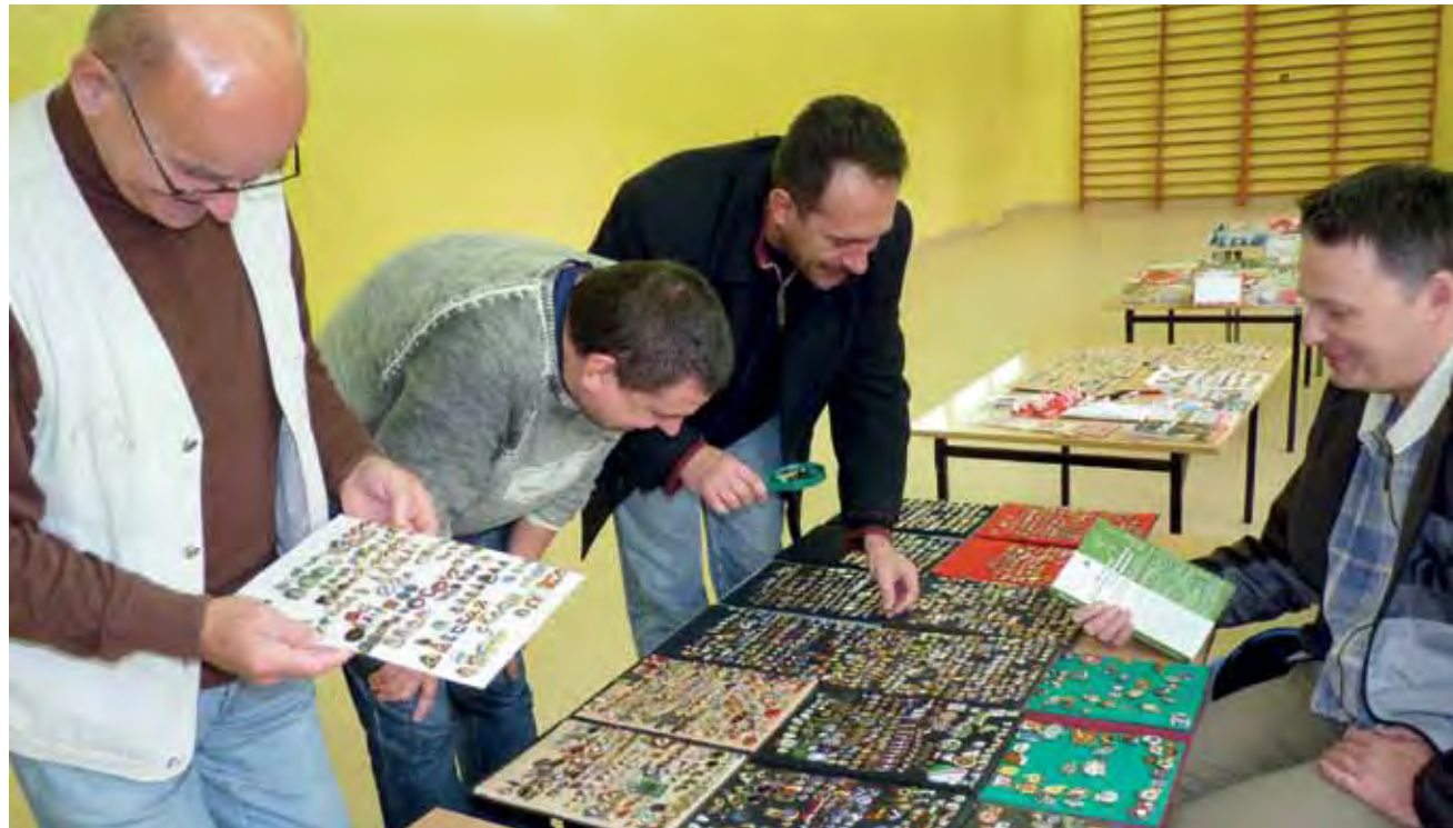
Choć stoisk było mało, to i tak entuzjaści sportowych gadżetów mieli co oglądać.

– Rozglądamy się, bo interesuje nas piłka, więc może znajdziemy dla siebie coś ciekawego. Pierwszy raz jesteśmy na takiej giełdzie i szczerze mówiąc nie wiedzieliśmy czego się spodziewać. Ale pomysł jest jak najbardziej fajny, dlatego że w Strykowie sport się rozwija, szczególnie jeśli chodzi o piłkę nożną, bo przecież trenuje teraz dużo młodych chłopców, m.in.