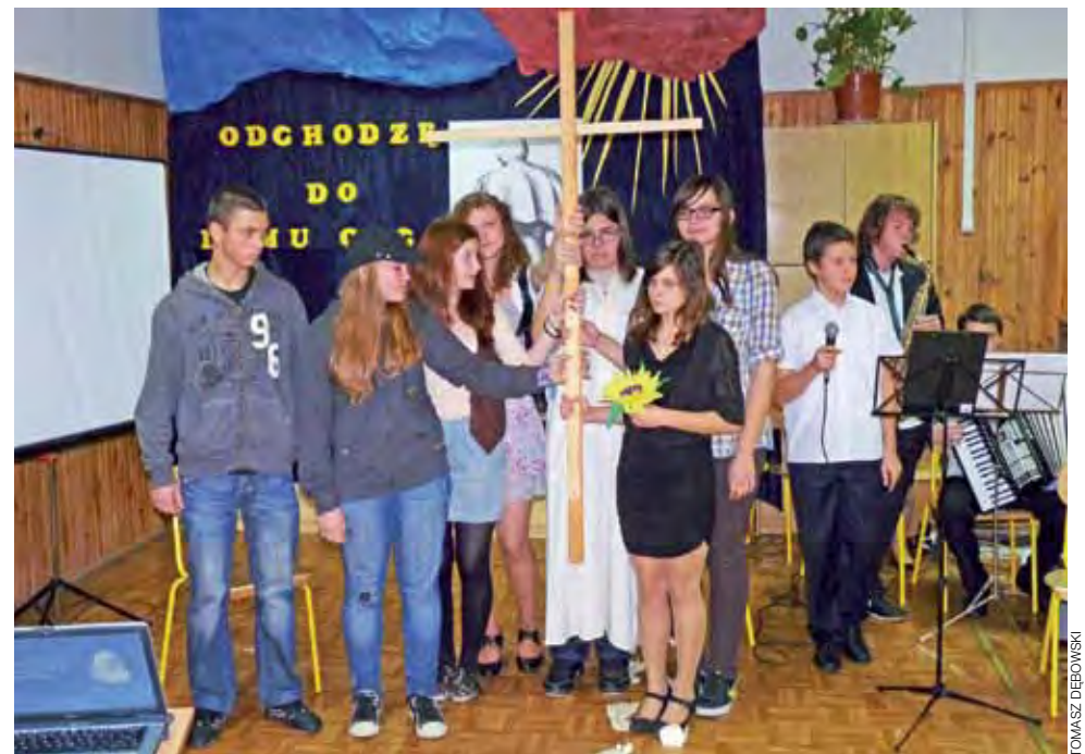
Pantomima opowiadająca o tym, że tylko przyjęcie krzyża pozwala iść za Chrystusem, była głównym wydarzeniem Wieczoru Papieskiego, obchodzonego 19 października w Gimnazjum nr 1 w Łowiczu. W dalszej części młodzież śpiewała pieśni religijne i recytowała wybrane teksty autorstwa papieża Jana Pawła II. td

RZUT OKIEM | DZIEŃ PAPIESKI W GIMNAZJUM NR 1