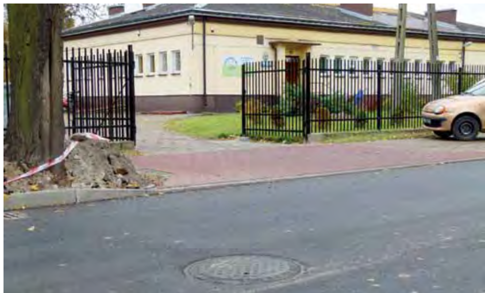
Do zdarzenia doszło niemalże naprzeciwko wjazdu do przedszkola. Dzisiaj jest tu wąż, wtedy była dziura i kamień.

Przypomnijmy, że przebudowa ulicy Chełmońskiego trwa już około 3 lat i ma zakończyć się wraz z końcem października. Aktualnie prace kończy firma Eurovia. Wiadomo już jednak, że jest kilka usterek. – Firma ma