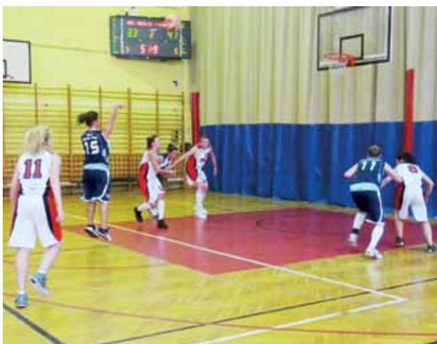
Po zwycięstwie humory koszykarkom Księżaka-96 dopisywały...

Koszykarki Księżaka doznały kolejnej porażki w meczu II ligi kobiet, ale w drodze powrotnej z Siedlec podopiecznym trenera Pawła Dolińskiego humory nieco się poprawiły. Okazało się,