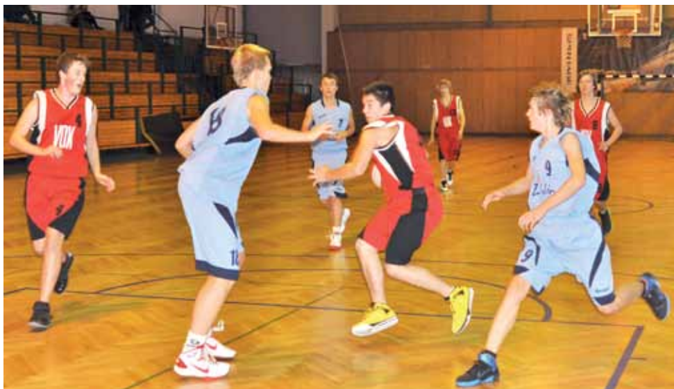
Kadeci Księżaka-96 mają już na koncie dwa zwycięstwa.

Koszykówka | 1. kolejka wojewódzkiej ligi kadetów U-16