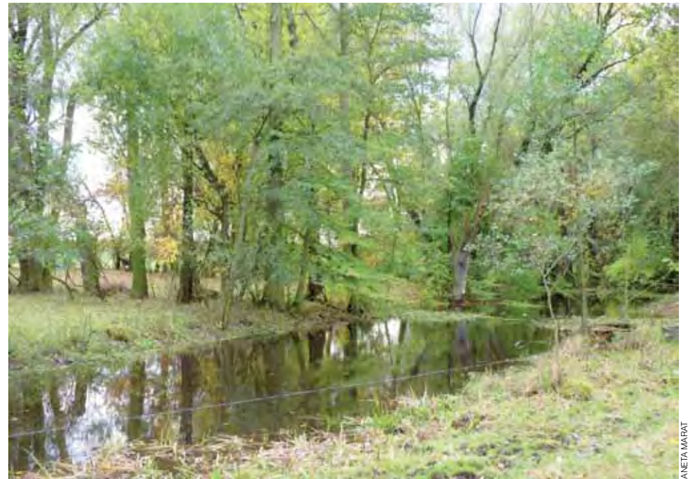
Kalinówka, mimo że od kilku dni deszcz nie padał, jest wypełniona wodą i zalewa przejazd na pola. Jak będzie wyglądała, kiedy zacznie padać?

Mieszkańcy gminy skarżą się przede wszystkim na to, że wiosną i jesienią, kiedy opady deszczu są obfitsze, nie mogą wjechać na własne pola, ponieważ wszystkie drogi dojazdowe do pól są pozalwane. Tylko część wody spływa bowiem rzeką, której koryto jest zarośnięte przez drzewa i krzaki. Mieszkańcy już w tym roku na własną rękę próbowali sytuacji zaradzić. Sami przekopali rowy na polach i tuż przy gospodarstwach, by woda chociaż w części spływała z ich pól. am