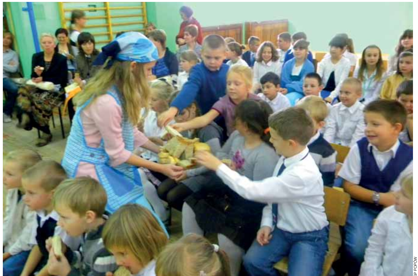
Uczniowie starszych klas rozdawali swoim kolegom i koleżankom świeżo upieczony chleb.

Uczniowie kl. III już 12 października musieli je wprowadzić w czyn, ponieważ wspólnie z mamami piekli chleb. Rodzice przynieśli tego dnia przenośny piekarnik elektryczny, dzięki czemu zapach świeżo upieczonego chleba rozniósł się po szkolnym korytarzu. Wy-