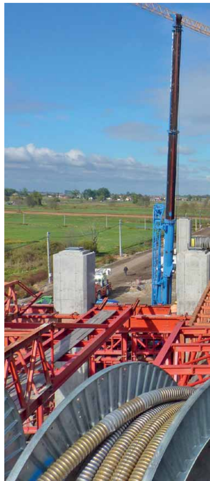
Widok na północ z poziomu estakady – czyli z 16 metrów nad ziemią. Gdy tam by