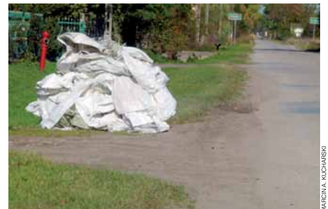
Folie wystawione przed gospodarstwo w Zakulinie.

Łącznie rolnicy pozbyli się kilku ton tego typu odpadów. Folie były odbierane od rolników bezpłatnie sprzed posesji. – Wyglądało to tak, że jak ktoś miał folie, to je wiązał sznurkami, żeby wiatr ich nie rozwiał i taką przyzmę wystawiał przy drodze – powiedział nam rolnik z Zakulina. Jeśli ktoś spóźnił się