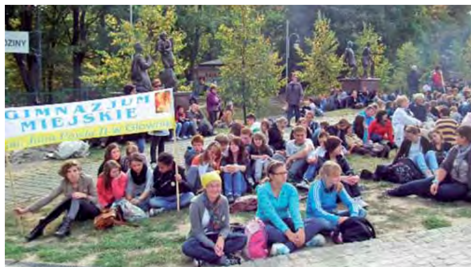
Pielgrzymi z Głowna na Jasnej Górze.

Szkoły imienia JP II z całej Polski zadeklarowały także sfinansowanie budowy pierwszej szkoły w Togo w Afryce, która będzie nosiła imię bł. Jana Pawła II. Poczyniono już nawet pierwsze starania. Na ten cel można