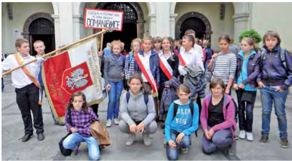
Dzieci ze Szkoły Podstawowej w Domaniewicach ze szkolnym sztandarem.