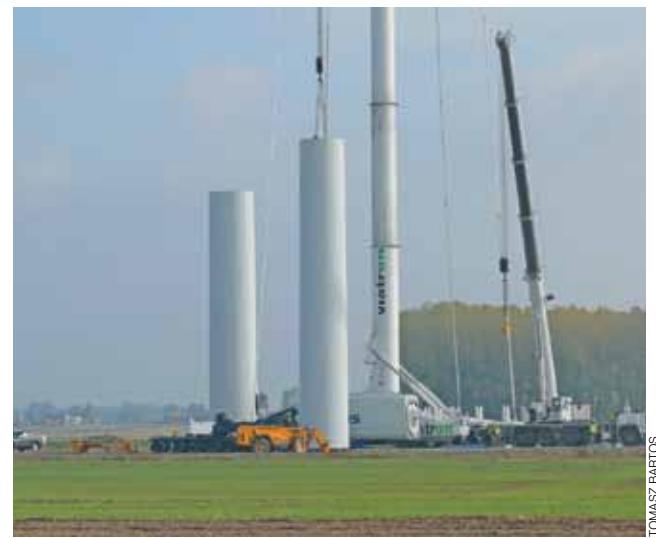
Montaż potężnych kolumn.

Dzięki inwestycji gmina zyskała też ok. 3 km drogi, co prawda o nawierzchni mineralnej, ale o dobrej podbudowie. Poprawi ona rolnikom dojazd do pól, nadaje się też do przykrycia asfaltem.