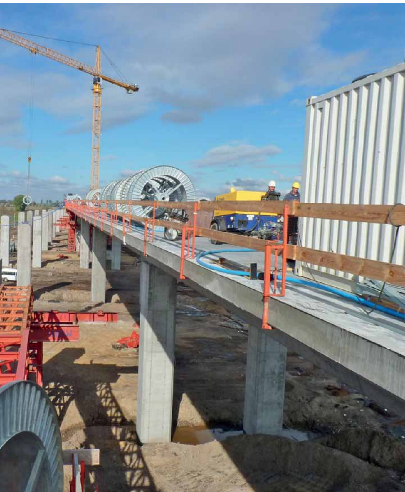
Wielki, zaawansowanie prac przekraczało właśnie półmetek.