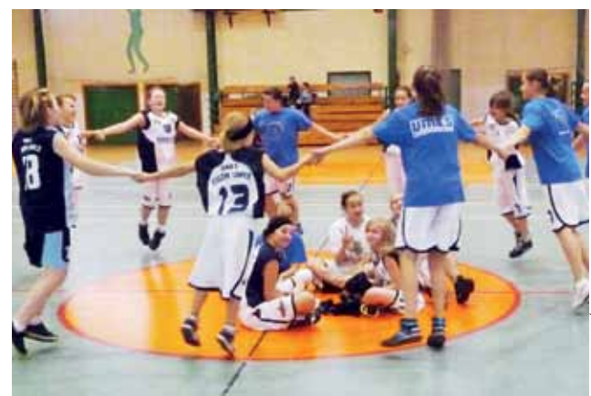
Tradycyjny zwycięski taniec młodzielek Księżaka z rocznika 1998-99.