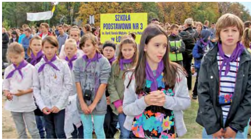
Dzieci ze Szkoły Podstawowej nr 3 w Łowiczu podczas mszy świętej.

Częstochowa | Pielgrzymki szkół imienia Jana Pawła II