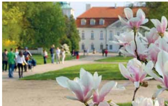
Pałac w Nieborowie tylko w tę niedzielę dla wszystkich zwiedzających będzie dostępny w cenie biletu ulgowego.

Ciekawostką będzie także możliwość zwiedzenia pracowni ceramicznej, która po reaktywacji stale pracuje. Do pracowni będą mogły wejść tylko małe,