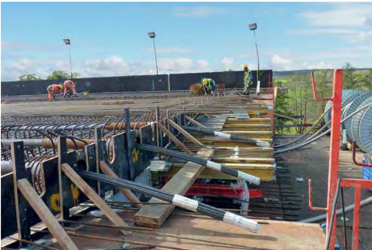
Grube jak męskie przedramię kable sprężające, produkowane w Gdańsku. Jest ich na każdym przęśle każdej jezdni 19. 36 godzin po zalaniu konstrukcji betonem, gdy osiągnie on wymaganą wytrzymałość, są równomiernie naciągane przez hydrauliczny tłok. Naciąg? – drobiazg: kilkaset ton na jeden kabel.

Dodajmy: fajne także dla dziennikarza. Zresztą zobaczcie, nasze zdjęcia rąbek tej fascynującej przygody odkrywają. Gdy już autostradę oddadzą – co ma się stać 30 kwietnia przyszłego roku – jako kierowcy, jadąc estakadą, nawet tego nie zauważycie. Ekran dźwiękochłonne zasłonią prawie wszystko. wal