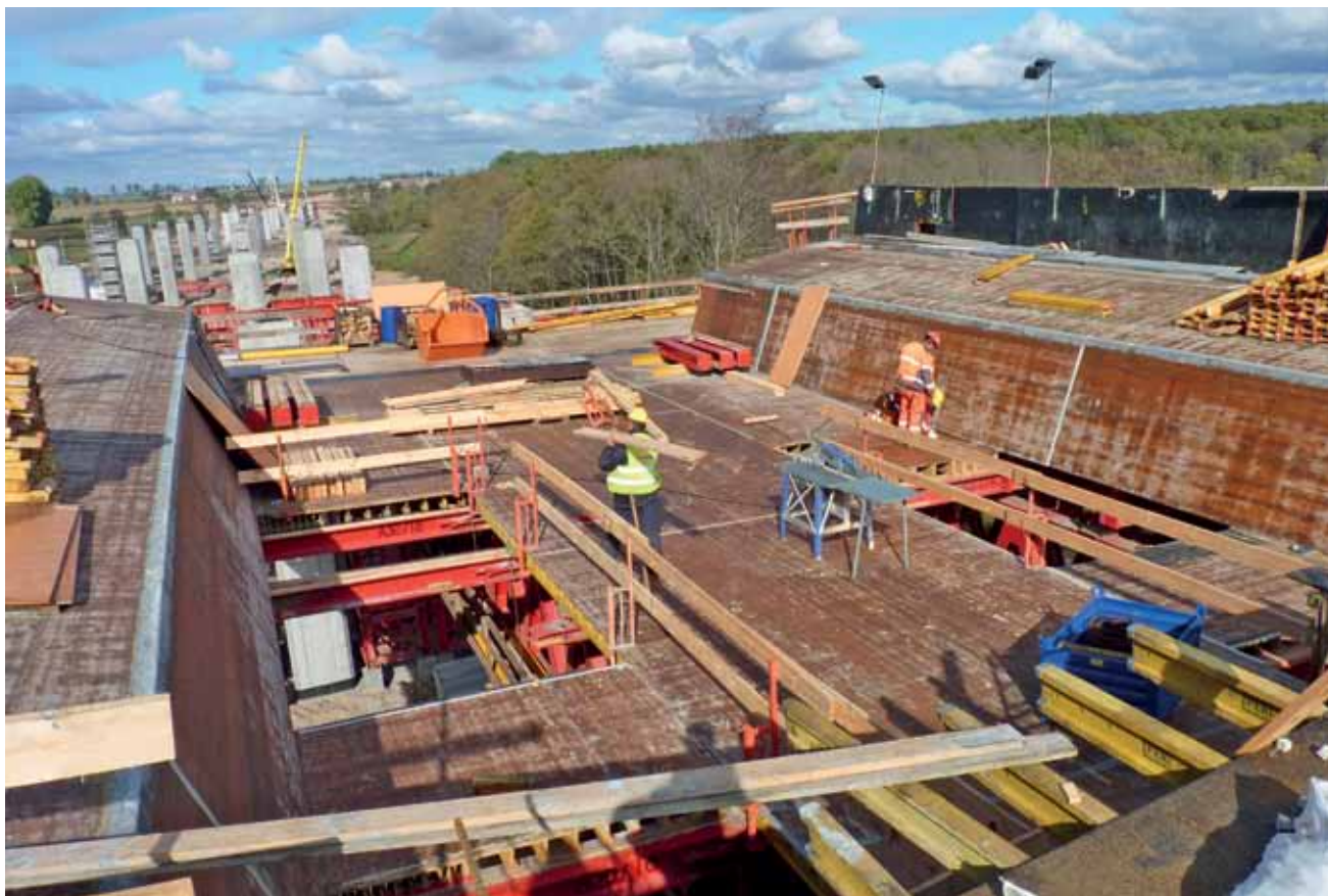
Montaż szalunku pod kolejny segment estakady. Widać, że konstrukcja płyty nośnej ma kształt odwróconego trapezu. Po zabetonowaniu szalunek jest wysuwany spod gotowej konstrukcji i przeciągany na nowy segment. Takich cykli trzeba na każdej jezdni powtórzyć 39. System przejezdnych rusztowań i szalowania sprawia, że jeden cykl trwa zaledwie tydzień.