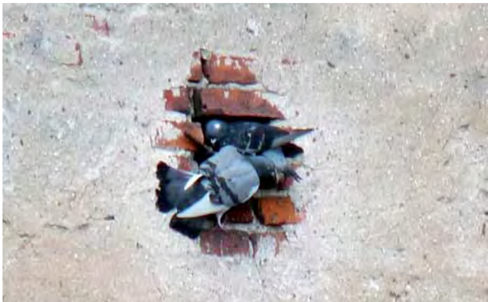
Nietypowe „gniazdo” można zobaczyć przy ulicy Nowej w Łowiczu. Gołębie zagnieździły się tam w wymiocie muru, w jednej z tamtejszych kamienic. td

RZUT OKIEM | GOŁĘBIE W ŚCIANIE KAMIENICY