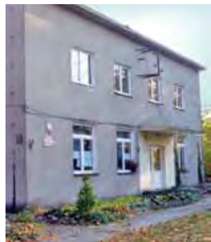
Budynek w Kurabce od 2000 roku stoi nieużytecznie.

Wójt zapowiada zaś, że nie zmieni się docelowe przeznaczenie nieruchomości. Gmina chce, by w Kurabce, w budynku po dawnej szkole, powstał Dom Spokojnej Starości. – Musimy poczekać, być może do przetargu zgłosi się ktoś inny – deklaruje więc.