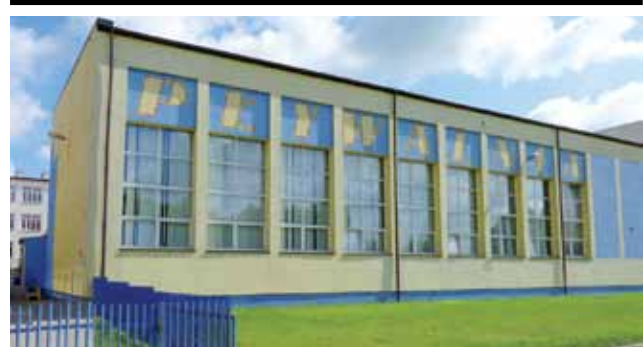
W tym roku na miejskiej pływalni można skorzystać nie tylko z basenu i sauny, ale także grot solnej.

Od redakcji: Zdjęcie zamieszczone w naszym serwisie internetowym miało obrazować, że sytuacja dotyczy tego przewoźnika – łowickiego PKS, a nie tego konkretnego autobusu. Jeśli jednak ktoś orientujący się, który kierowca jeździ którym autobusem, tak pomyślał, to prostujemy: nie chodziło o Pana. Za nieporozumienie przepraszamy. Podkreślamy przy tym, że twarz kierowcy nie jest na zdjęciu rozpoznawalna.