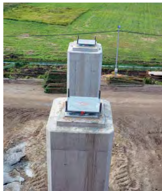
Filary stoją na zagłębionych w ziemię palach , a konstrukcja mostu może się na nich przesuwac, w zależności od zmian temperatury, dzięki widocznym na tym zdjęciu łożyskom garnkowym.