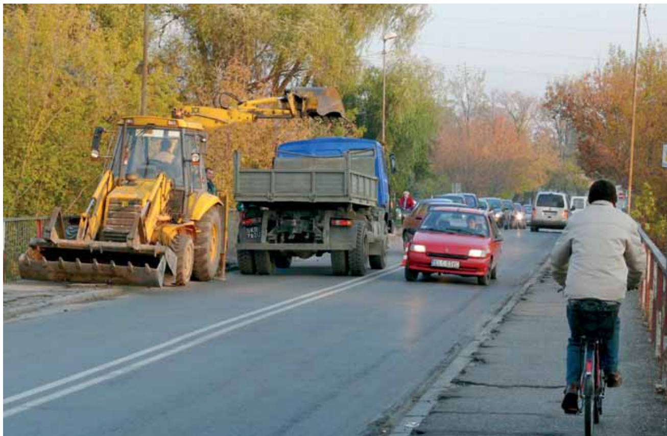
Prace na moście na ul. Mostowej spowodowały rano poważne utrudnienia w ruchu samochodowym.

Stary asfalt zostanie natomiast po wschodniej stronie, gdzie jest w nim na tyle niewiele dziur, że da się je załatać. tb