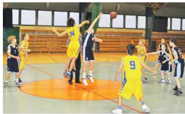
Księżak-99 odniósł swoją pierwszą wygraną w meczu z AZS II Kutno.