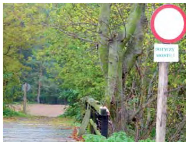
Oprócz znaku zakazującego poruszania się po moście, wejście zabezpieczono także taśmą, która została zerwana.

koszykówkę, budynek socjalny, a już niedługo plac zabaw, którego budowa jest na finiszu. am