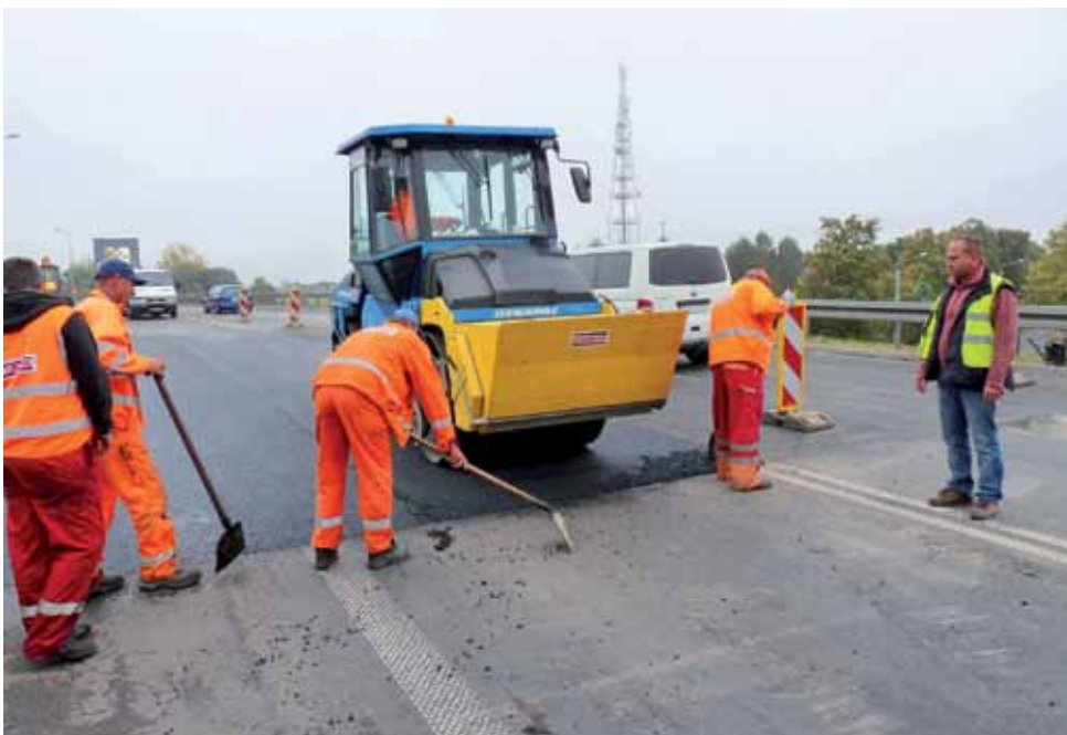
Pracownicy firmy Strabag kładli nową nakładkę asfaltową. Pracowali w weekend, bo wtedy było mniejsze natężenie w ruchu samochodów.