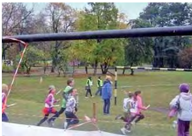
Domaniewiczanki rozpoczęły całkiem obiecująco, ale po połowie dystansu już tak dobrze nie było.

■ Dziewczęta: 1. SP 3 Aleksandrów Łódzki 29:41,6 min, 2. SP Gornice 29:49,0 min, 3. SP 12 Tomaszów Mazowiecki 29:52,4 min, 4. SP 3 Opoczno 29:56,4 min, 5. SP 9 Kutno 30:14,8 min, 6. SP 4 Żelów 30:25,9 min, 7. SP 4 Ozorków 30:28,3 min, 8. SP Sędziejowice 30:46,8 min, 9. SP 81 Łódź 30:52,7 min, 10. SP 7 Łódź 30:54,4 min, 11. SP Domaniewice 31:11,9 min, 12. SP Szadek 31:24,2 min.