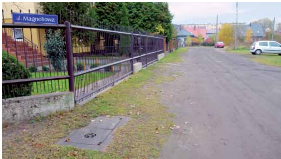
Mieszkańcy ulicy Magnoliowej w Łowiczu narzekają, że są jedną z niewielu ulic w tej części osiedla, która nie ma utwardzonej nawierzchni.

Ulica ta nie jest ważną arterią komunikacyjną, nie jest też długa, ma ok. 100 metrów długości, więc położenie twardej