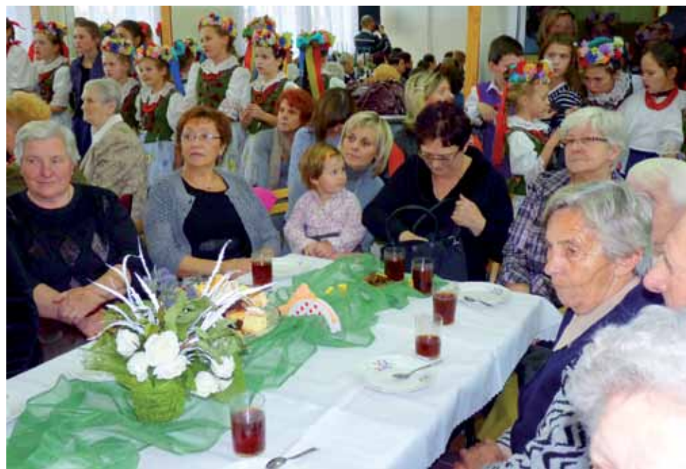
W spotkaniu międzypokoleniowym w Domaniewicach, poza występującą młodzieżą, wzięło udział ok. 120 osób.

W części artystycznej spotkania najpierw wystąpiła młodzież z Gimnazjum Publicznego w Domaniewicach z montażem słowno-muzycznym na temat Święta Niepodległości. Śpiewał też szkolny chór. W części drugiej wystąpił Zespół Pieśni i Tańca Kalina. mwk