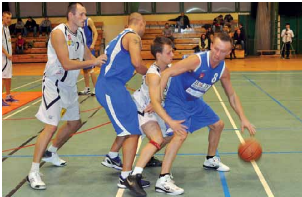
W pucharowej rywalizacji Księżak minimalnie przegrał po dogrywce z pierwszoligowcem z Siedlec.