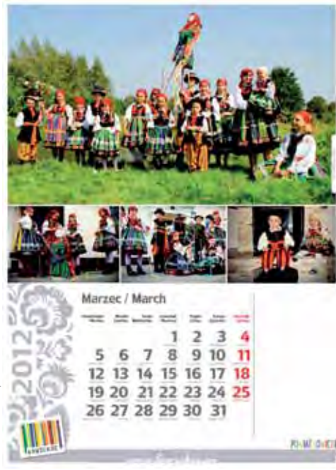
Zdjęcia zespołu Jarzębina, przedstawiające obrzędy wielkanocne, zostały umieszczone na stronie z miesiącem marcem.