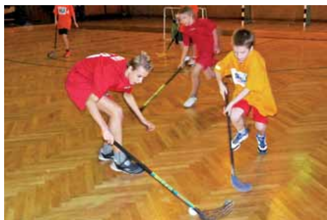
W mistrzostwach Łowicza Czwórka dwukrotnie pokonała Dwójkę.