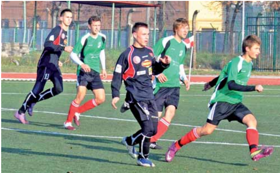
Pelikan-95 zakończył rundę jesienną na dziewiątym miejscu w wojewódzkiej lidze juniorów starszych.

Druga połowa to także nasza optyczna przewaga lecz miej-