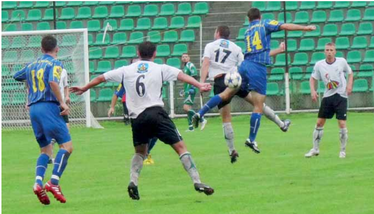
Pelikan po raz drugi w tym sezonie przegrał z Motorem Lublin, tym razem 0:1.