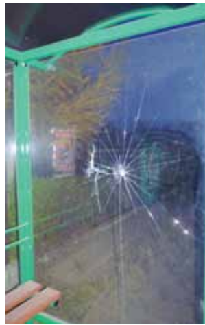
Efekt wandalizmu na przystanku w Strzelcewie.