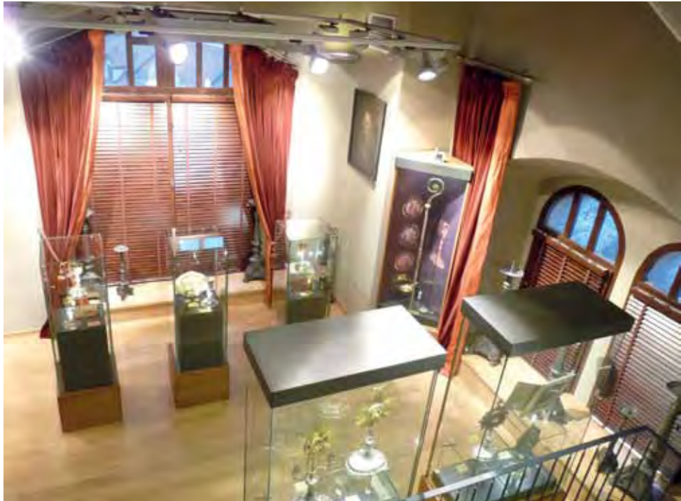
Sala poświęcona złotnictwu robi na zwiedzających największe wrażenie.