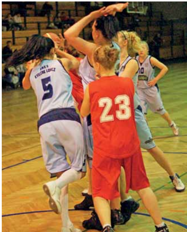
Łowiczanki ustanowiły swój strzelecki rekord w rozgrywkach senierek.

– W meczu z słabszym rywalem zmieniłem praktycznie całe piątki, tak aby wszystkie zawodniczki sobie pograły, ale się także ograli – opowiada trener Doliński. – Chodzi tu przede wszystkim o zgranie się zespołu, który w tym składzie funkcjonuje przecież dopiero od