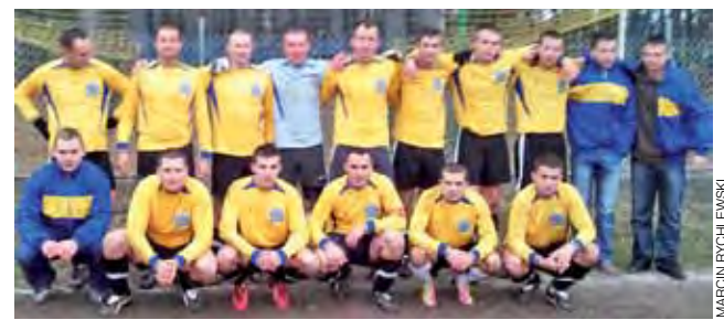
Mistrzami jesieni w klasie A gracze Pogoni Bełchów.