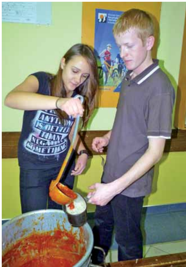
W sobotę, gdy odwiedziliśmy harcerzy, właśnie jedli obiad, na który było spaghetti.

Drugiego dnia zajęcia w terenie były nie mniej ciekawe, bo miały charakter gry technicznej. W czasie jej trwania należało np. rozpaścić ognisko