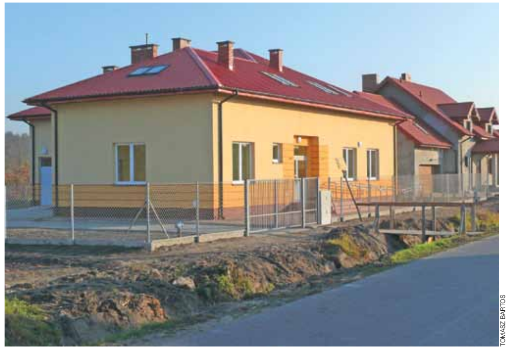
Budynek, w którym będzie mieściła się świetlica i biblioteka w Arkadii jest już gotowy, aby mógł zacząć żyć, potrzebne jest tylko oficjalne pozwolenie na użytkowanie.

Urząd Pracy radzi młodym mamom, jak wrócić na rynek pracy. str. 12