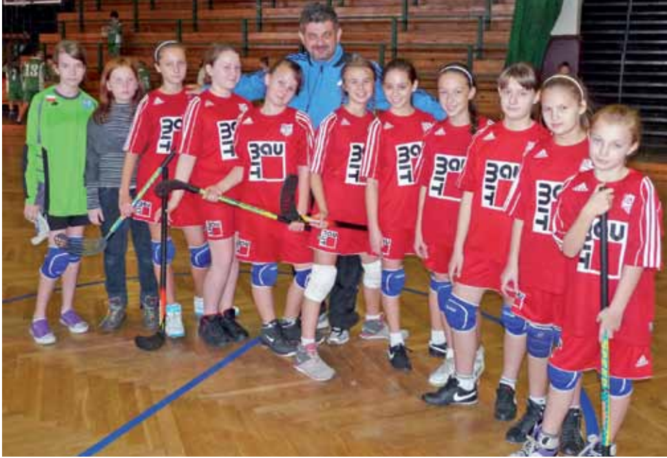
Reprezentantki Czwórki okazały się najlepsze w mistrzostwach Łowicza w unihokeju.