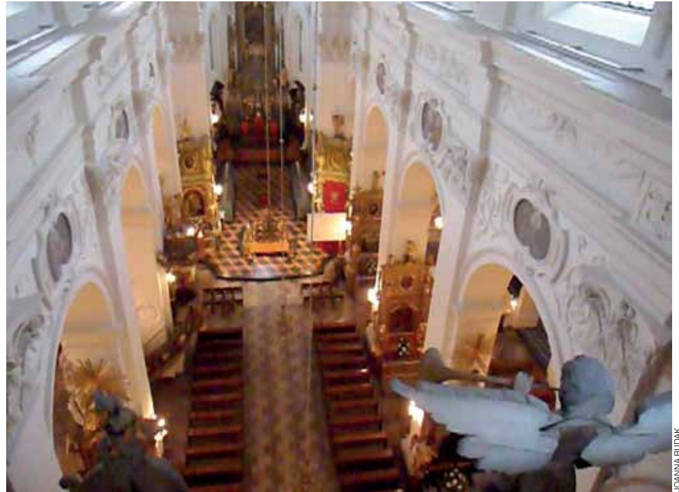
Przechodząc z wieży południowej do północnej można z balkonu widokowego oglądać wnętrze kościoła.