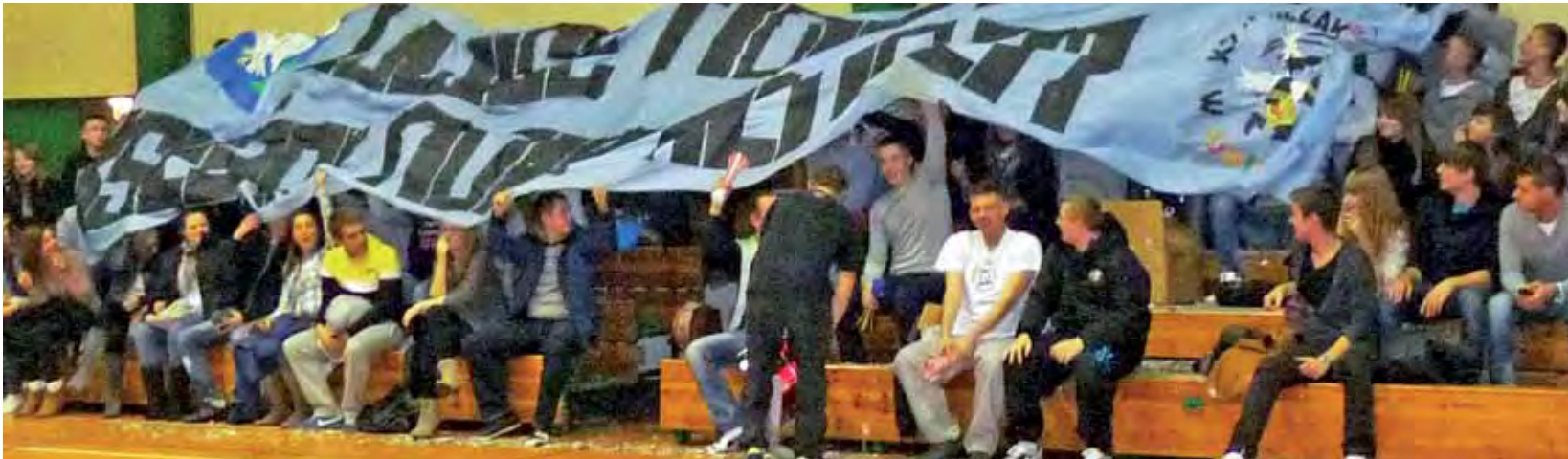
Na trybunach w łowickiej hali w meczu z liderem z Pleszewa było bardzo głośno i kolorowo. Czy taka atmosfera będzie normą, czy to tylko jednorazowa akcja kibiców?