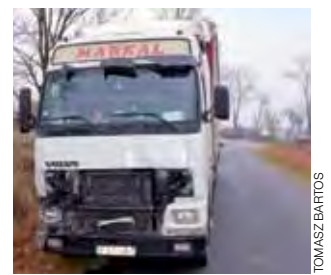
ł, oba samochody natomiast miały poważnie uszkodzone nadwozia. tb

25-letni kierowca z Litwy, jadący samochodem ciężarowym Volvo, nie zachował ostrożności, w wyniku czego uderzył w jadący przed nim samochód Renault Master prowadzony przez 59-letniego mieszkańca Kutna. Kierowcy byli trzeźwi, nic im się nie sta-