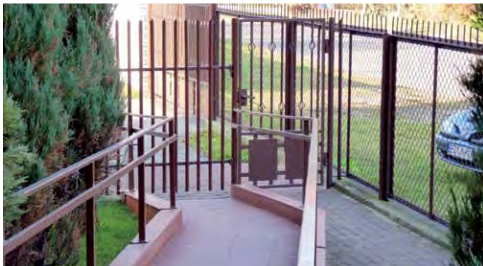
Tak wygląda podjazd dla niepełnosprawnych od strony głównego wejścia do przychodni.

„Dołączam zdjęcie, aby ukazać, jak wygląda podjazd dla wózków przy ośrodku zdrowia, z którego nie da się skorzystać” – zakończyła swój mail.