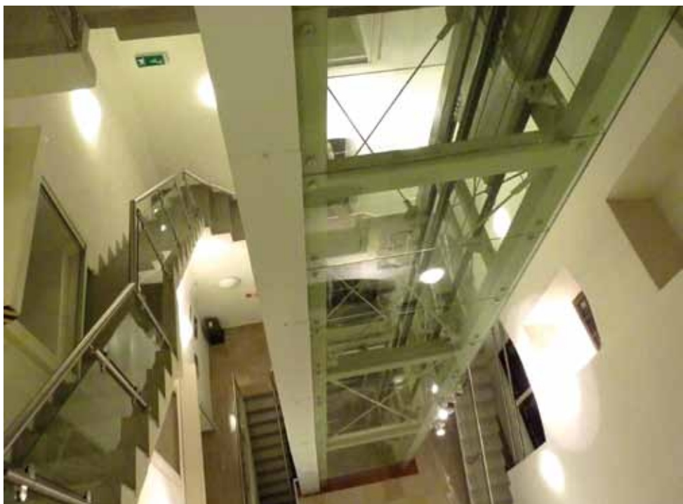
Szyb windy został wbudowany w środek klatki schodowej wiodącej na wieżę północną.