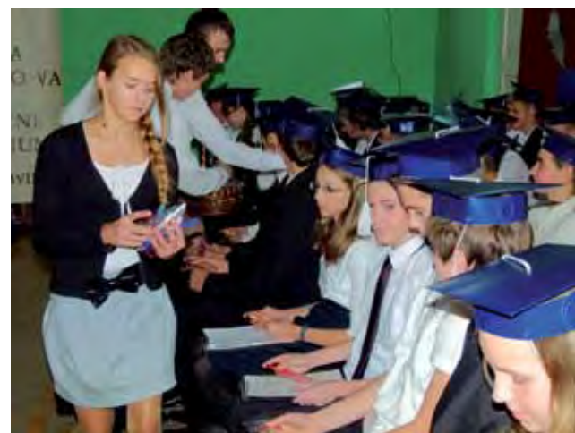
Starsi uczniowie z Gimnazjum w Błędowie wręczyli pierwszoklasistom przybory do pisania oraz okładki na legitymacje szkolne.

Po akademii uczniowie najstarszych klas gimnazjum wręczyli pierwszoklasistom długopisy oraz okładki do szkolnych legitymacji. Później, w salach lekcyjnych, odbyło się mniej formalne spotkanie związane ze ślubowaniem. Do wspólnego stołu ze słodkim poczęstunkiem zasiadli pierwszoklasiści, wy-