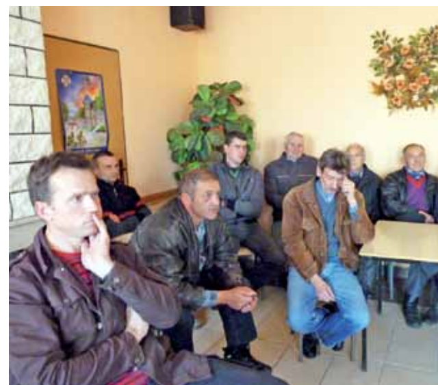
Mieszkańcy licznie zgromadzili się w strażnicy w Stroniewicach.

Zgromadzeni mieszkańcy zaproponowali, by wybudować chociaż dwa przejazdy, na co Jędryka odpowiedział, że nie jest to niemożliwe, ale każdy musiałby oddać wówczas kawałek swojej ziemi, ponieważ w takiej sytuacji trzeba by zorganizować dojazdy do tych przejazdów. Ponadto utworzoną drogę dojazdową czy wybudowane mosty gmina musiałby