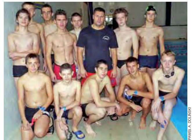
Pływacy z Dwójki wywalczyli awans do finału wojewódzkiego.

■ Chłopcy: 1. ZS-CEZIU Rawa Mazowiecka 32:43,25 min, 2. ZS 1 Kutno 33:01,76 min, 3. I LO Łowicz 33:23,32 min, 4. LO Rawa Mazowiecka 33:31,60 min, 5. LO Skierniewice 34:05,29 min, 6. ZSP 2 Łowicz 34:29,12 min, 7. ZSZ 3 Skierniewice 34:31,56 min.