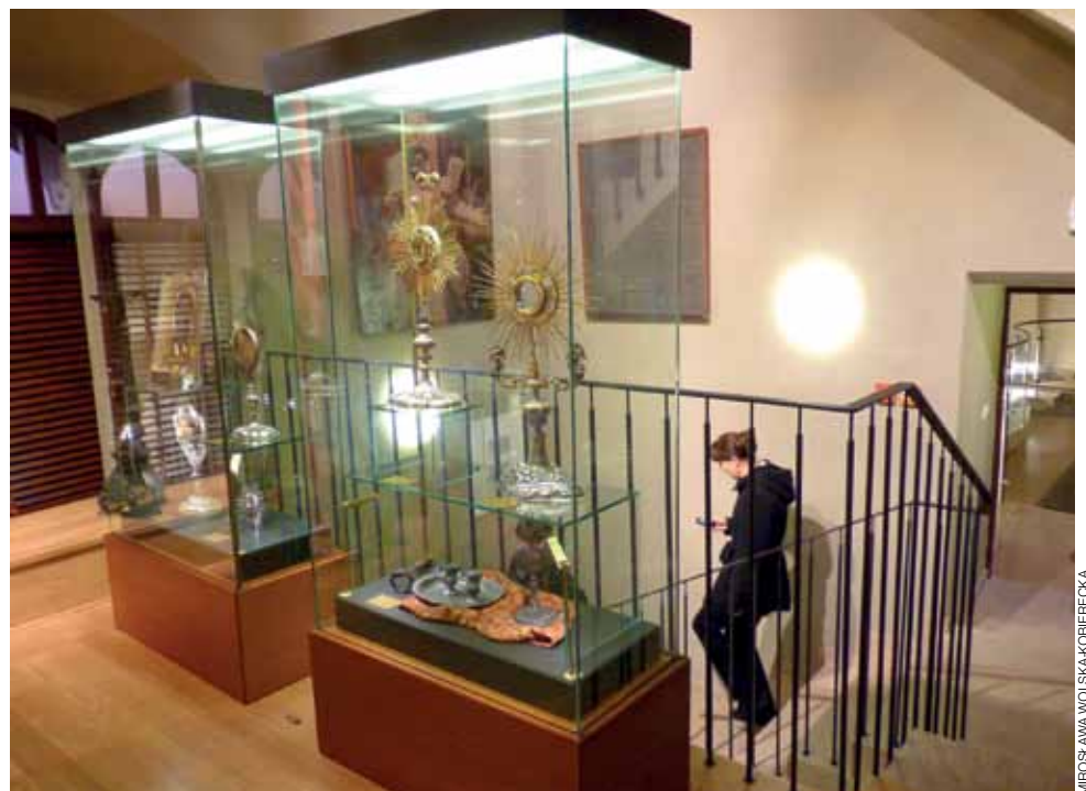
W jednej z sal muzealnych, eksponowane są m.in. monstrancje.