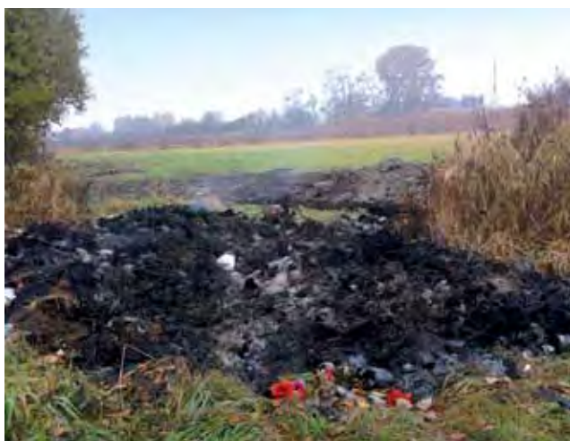
W resztkach śmieci spalonych za kościołem widać znicze, które nie powinny się tam znaleźć.

– Będziemy myśleć nad różnymi rozwiązaniami – zapewnia burmistrz – Jedną stroną ul. Łódzkiej można by podłączyć do sieci kanalizacyjnej znajdującej się na terenie podstrefy ekonomicznej. Na pewno będzie to droga inwestycja, bo sieć kanalizacyjna obejmująca działki przy ul. Łódzkiej po obu stronach to odcinek ponad 2 km. Kaliński dodaje, że miasto na ten cel będzie na pewno szukało dotacji, możliwe że z Wojewódzkiego Funduszu Ochrony Środowiska i Gospodarki Wodnej w Łodzi. jr