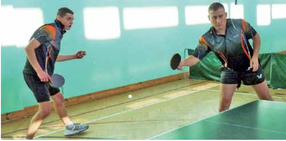
Pingpongiści UKS Bednary ma już tylko matematyczne szanse na utrzymanie się w II lidze.