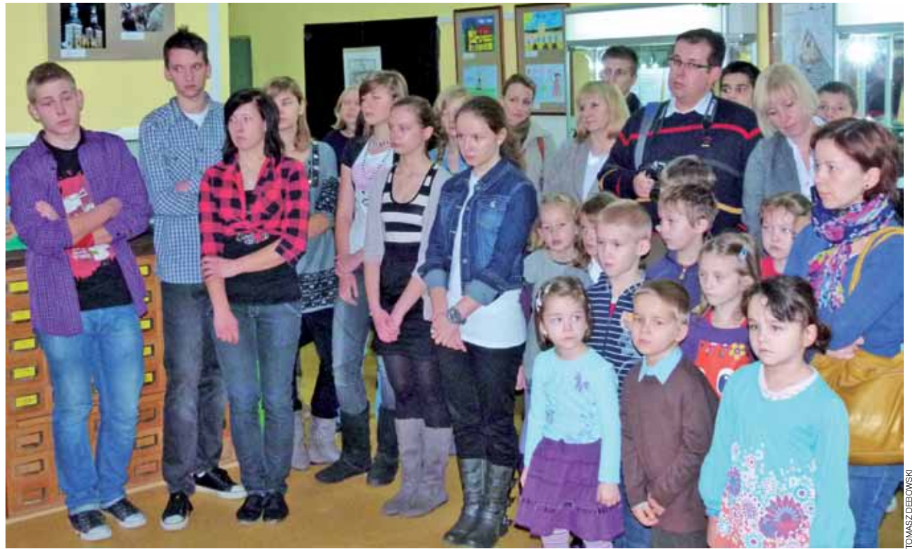
Konkurs był przeznaczony dla wszystkich. Brały w nim udział dzieci, młodzież i osoby dorosłe.

Bilety na każdy ze wspomnianych seansów kosztują 10 zł. am