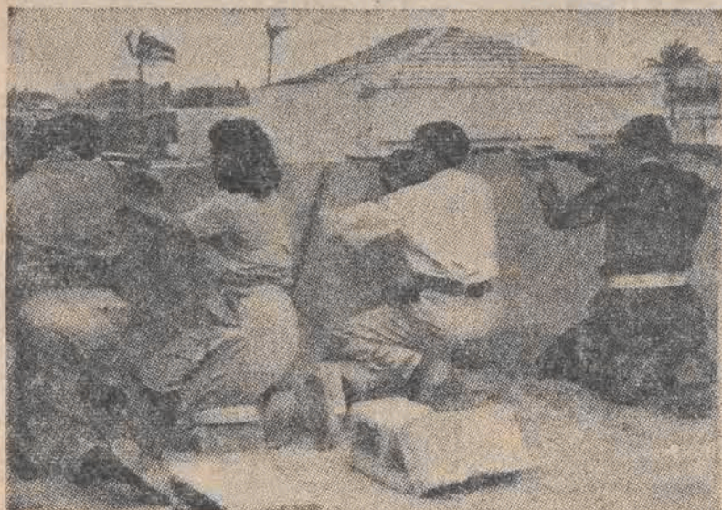
W Palestynie doszło ostatnio do bardzo krwawej potyczki. Z jednej strony wystąpiły poważne siły partyzantów arabskich („pilotowanych” przez policję brytyjską), z drugiej — kilkunastoletnie dzieciaki z organizacji „Hagana”. Potyczka skończyła się zwycięstwem „Hagany”.