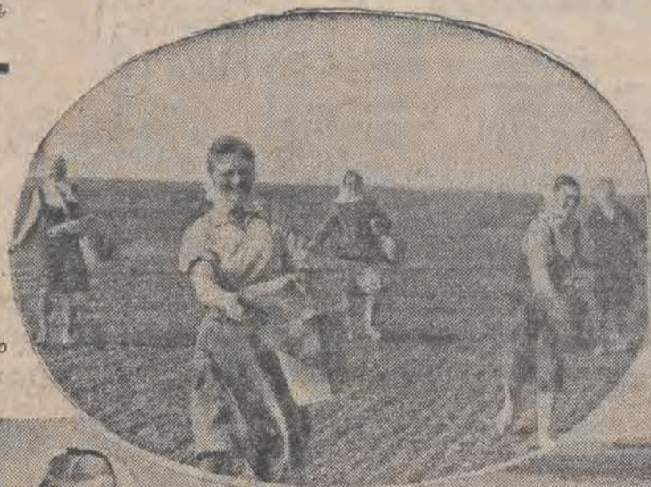
A w kraju Attajskim przystąpili rolnicy do walki, nie... z chwastami na polach.