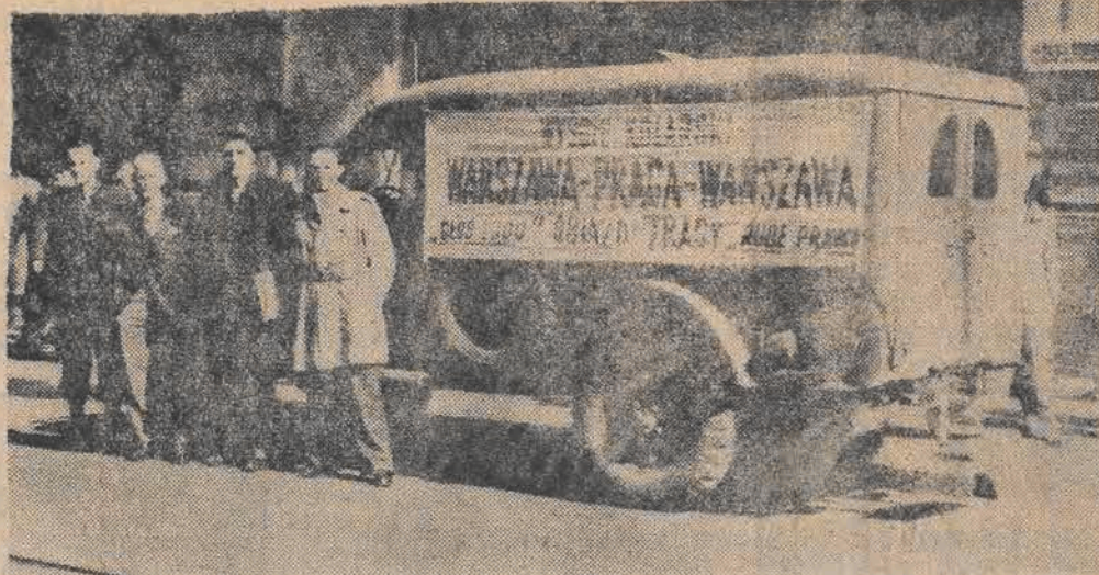
Wóz Komisji Technicznej wyścigu kolarskiego Warszawa — Praga przed redakcją „Głosu Robotniczego”.

Jakżeśmy już donosili, w tych dniach bawiła w Łodzi Komisja Techniczna objeżdżająca trasę wyścigów Warszawa — Praga i Praga — Warszawa organizowanych przez redakcję „Głosu Ludu” i „Rude Prawy”. WSZYSTKO MUSI BYĆ ZAPIĘTE NA OSTATNI GUZIK Łódź, jak wiemy, będzie pierwszym miastem w Polsce, które w Warszawie witać będzie elitę kolarzy europejskich, biorących udział w wyścigu Warszawa — Praga, toteż pobyt Komisji Technicznej trwał w naszym mieście aż dwa dni, aby na miejscu omówić wszystkie sprawy związane z tą gigantyczną imprezą. Wszystko musi być „strikte”, zapięte na ostatni guzik — oto dewiza, która musi przyswiecać organizatorom łódzkim.