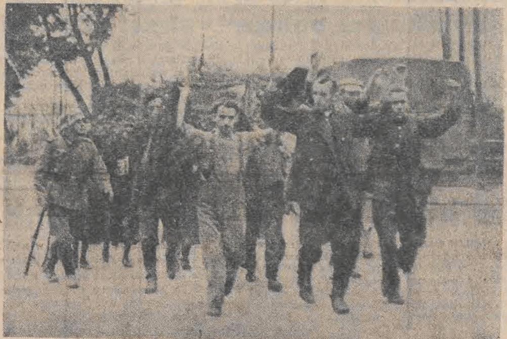
Tak się zaczęło panowanie Alberta Forstera w Gdańsku. — Pędzenie Polaków na rzeź.

wego bezpieczeństwa, a także jego zbliżenie ideologiczne do zasad faszystwu niemieckiego wytworzyły podłoże, na którym ówczesny minister spraw zagranicznych Józef Beck mógł oprzeć zasadę złatwiania wszelkich sporów polsko-gdańskich z pominięciem Ligi Narodów. Zasada ta była zgodna z linią polityki NSDAP dążącej do skłócenia obozu państw demokratycznych i Fors-