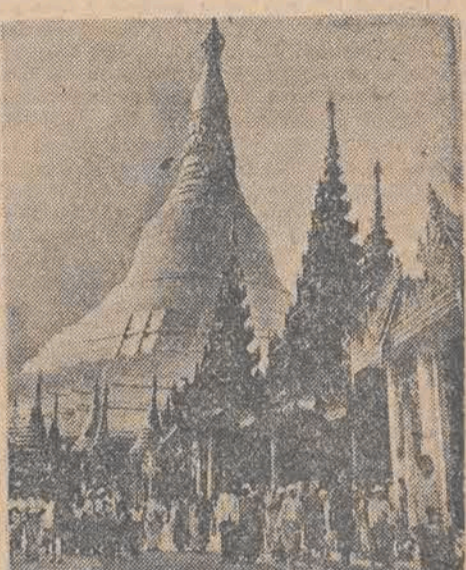
W stolicy Burmy — Rangoonie (ilustracja), wybuchły ponownie rozruchy antybrytyjskie.