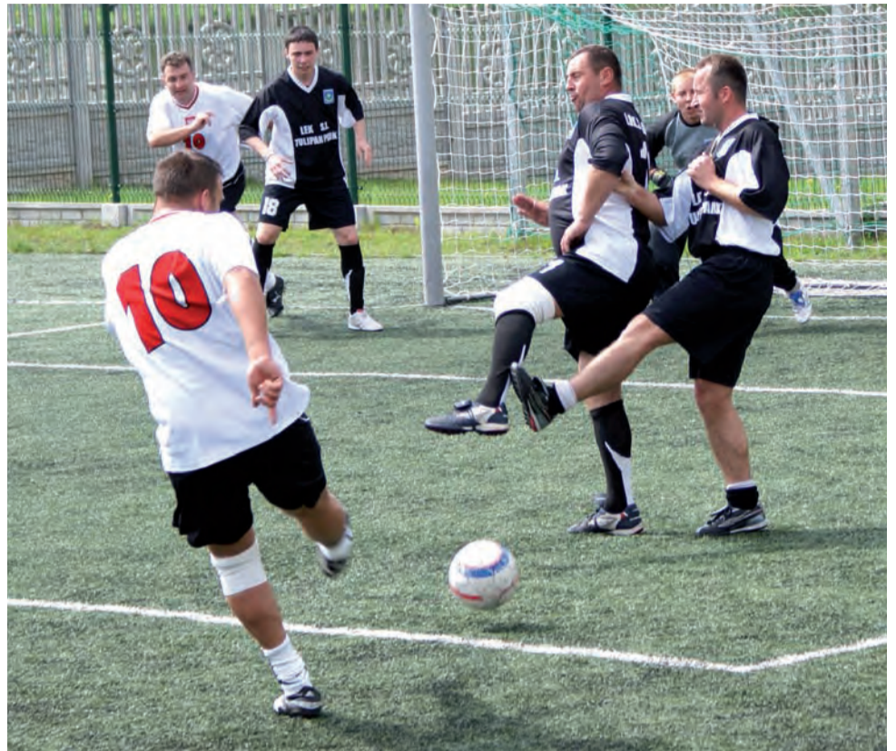
Pierwszy sparing w tym roku i od razu efektowne zwycięstwo. Piłkarze LUKS „Dwójki” Sandoz Stryków bardzo dobrze rozpoczęli przygotowania do wiosny.

Kolejnym przeciwnikiem w okresie przygotowawczym LUKS-u będzie także silny zespół z Głowna. Ekipa Profart z pewnością postawi trudne warunki strykowianom, więc mimo iż to tylko sparing, to zapowiada się bardzo ciekawe widowisko. wp