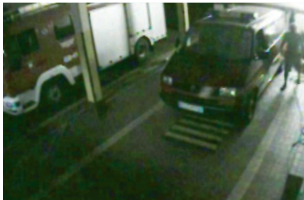
Osoba uwidoczniiona na monitoringu nie kryła się z tym co robiła.

Światło w części garażu, w którym stał zaparkowany strażacki samochód zapaliło się o godzinie 20.45:53, co wi-