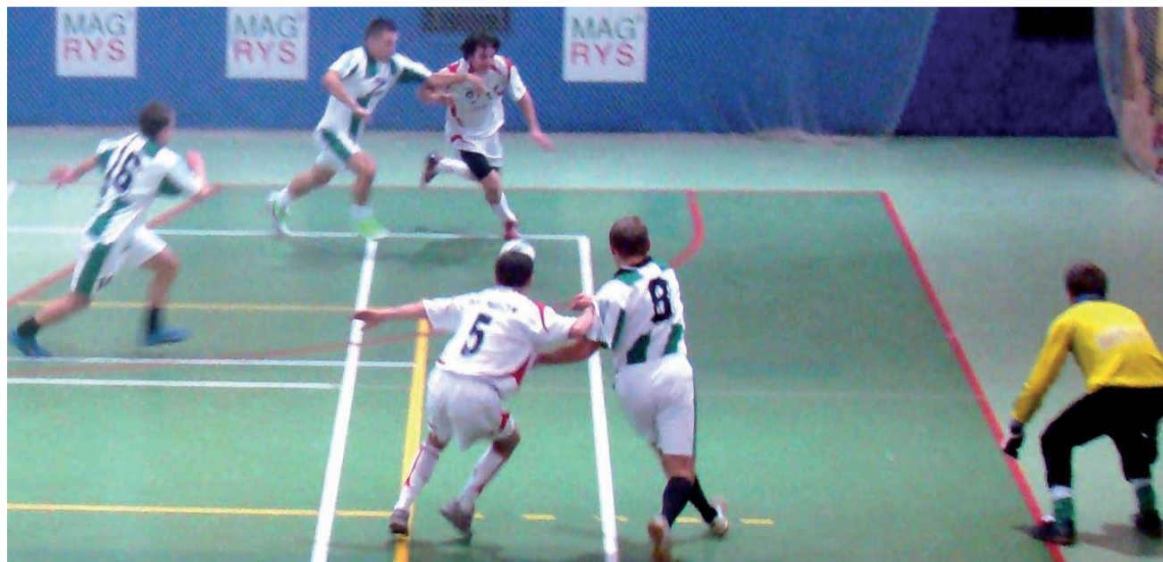
Piłkarze Zjednoczonych w ubiegłym roku nie zdołali obronić mistrzostwa powiatu. Czy powetują niepowodzenie w bieżących rozgrywkach?