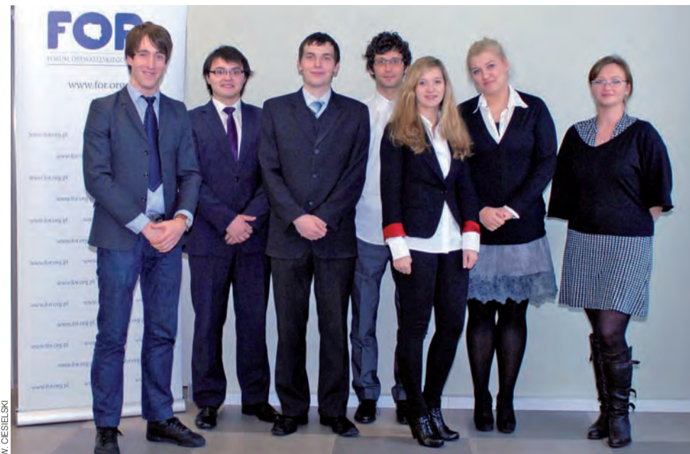
W Łowiczu powstał klub Fundacji FOR. W tej chwili tworzy go 7 osób.

– Nam chodzi o stopniowe działania. Nie chcemy zaistnieć na chwilę, zrobić dużo szumu i zaraz zniknąć. Chcemy działać systematycznie. Nasze akcje mają mieć charakter przede wszystkim informacyjny i być daleko od polityki. Będziemy chcieli pokazać ludziom, np. jak wygląda sytuacja z miejscami parkingowymi na terenie miasta. Będziemy docierali do informacji z zakresu ekonomii czy życia społecznego i je upublicznia-