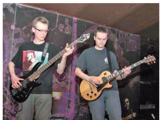
Zespół Statyści z Łodzi zagra w głowieńskim MOK 28 stycznia.

Szkoła Podstawowa w Koźlu – Tutejsza szkoła miała ustalić harmonogram feryjny po zamknięciu numeru „Wieści”. Napiszemy o nim w następnym wydaniu gazety. rpm, ewr, ijs