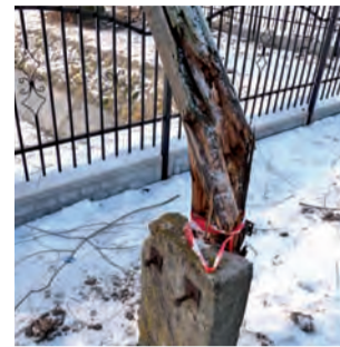
Nadłamanym słup w centrum Złakowa został wymieniony.

Około 2 miesiące czekali mieszkańcy Złakowa Kościelnego w gminie Zduny na wymianę nadłamanego słupa telefonicznego należącego do Telekomunikacji Polskiej, który znajdował się w centrum tej miejscowości, zaraz przy tutejszym kościele.