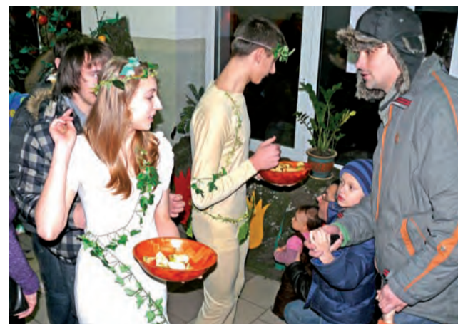
Już przy wejściu do szkolnej sali gimnastycznej można było oglądać pierwsze sceny jasełek