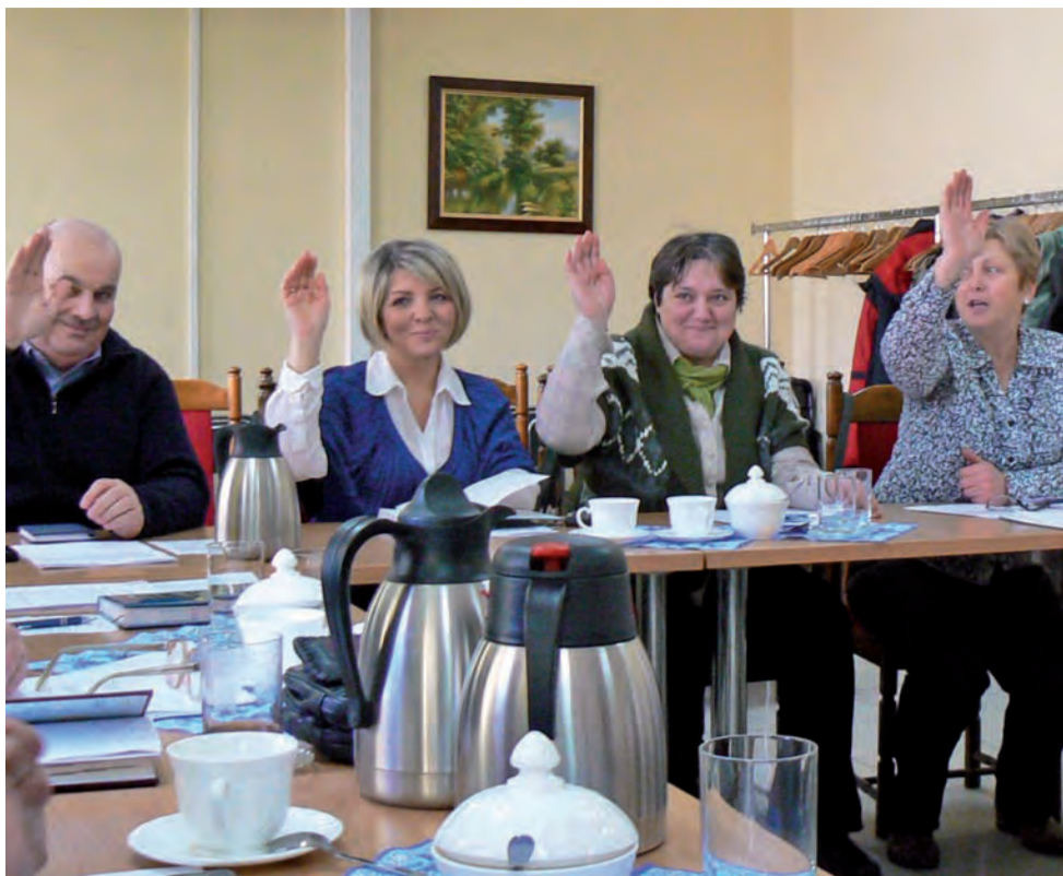
Połączone komisje prawie od razu przeszły do rzeczy. Wielkiej dyskusji nie było.