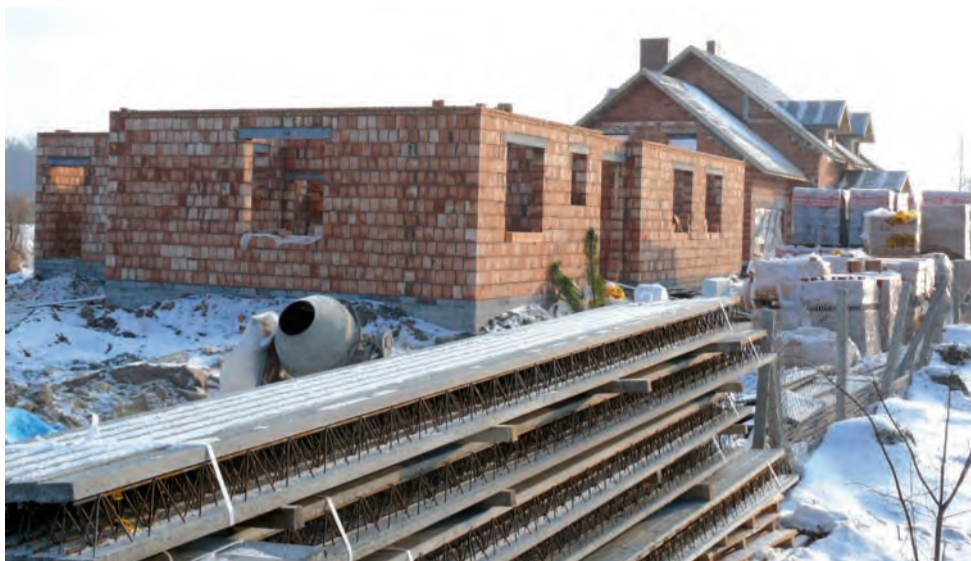
Mury biblioteki i świetlicy w Nieborowie już stoją, jeśli aura pozwoli to prace będą kontynuowane.