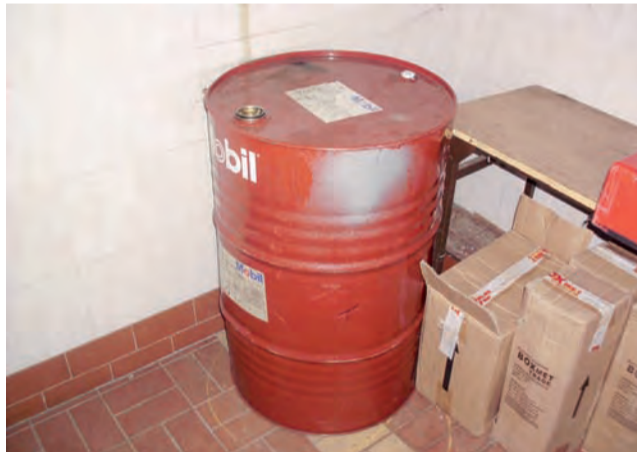
OSP w Łowiczu. Z tej beczki miało rzekomo zostać skradzione paliwo należące do Urzędu Miejskiego w Łowiczu.

Potem wychodzi z garażu, po chwili do niego wraca i otwiera bagażnik z tyłu samochodu. O 20.55:44 wyjmuje – prawdopodobnie z bagażnika samochodu – przedmiot przypominający wyglądem kanister. Stawia go na tyłach garażu. O godz. 20.57:35 wynosi z garażu beczkę. Można odnieść wrażenie, że jest ona ciężka. Wynosi trzymając ją oburącz przed sobą.