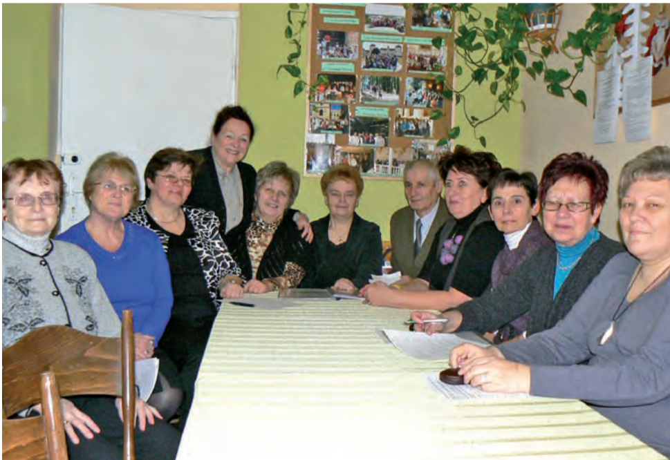
Na razie w „Seniorze” przeważają panie, ale panowie też są mile widziani. Na zdjęciu członkowie stowarzyszenia na chwilę przed pierwszym walnym, 11 stycznia.

Ponad 200 osób wzięło udział w zabawie karnawałowej zorganizowanej 9 stycznia w OSP w Kielminie. Dzieci i dorośli do wspólnej zabawy zaprosiło Stowarzyszenie Nadzieja przy Parafii św. Doroty w Dobrej. Nie tylko dzieci, ale również rodzice i dziadkowie poważnie potraktowali prośbę organizatorów o karnawałowe przebranie. Były królowy i królowie, wróżki, pszczołki, aniołki, kowboje i wiele innych niespotykanych na co dzień postaci. Na początku była bajka wystawiona przez aktorów Teatru Każdej Sztuki z Nowego Sącza. Następnie św. Mikołaj wręczył wszystkim dzieciakom prezenty, a później była już tylko dobra zabawa przy muzyce. Przeplatały ją konkursy dla dzieci i rodziców. Słodki poczęstunek przygotowali zarówno wolontariusze ze stowarzyszenia, jak i rodzice. Oprawę muzyczną zapewnili wspomniani aktorzy Teatru Każdej Sztuki. ljs