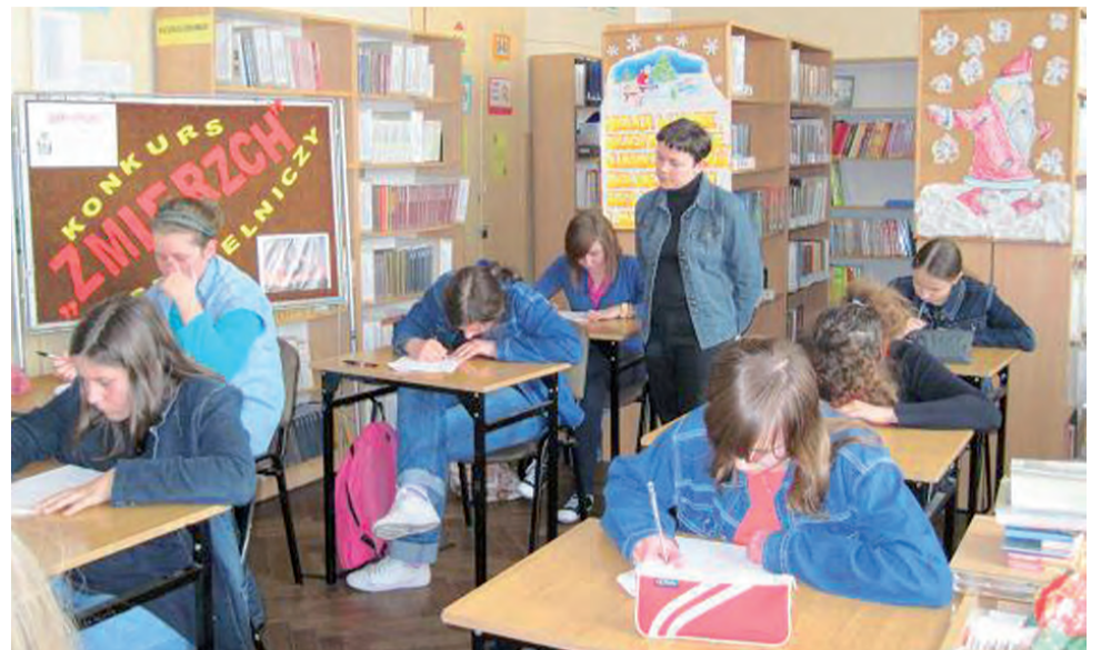
Uczennice „Dwójki” chętnie wzięły udział w konkursie. Odpowiadały na pytania związane z jedną ze swoich ulubionych książek.

Takich przykładów jest więcej. Rzecz w tym, byśmy do polskich (ale naprawdę dobrych) wyrobów nabierali coraz większego zaufania. Co na szczęście jest coraz częstsze. Piłka jest jednak zawsze po stronie producentów. A nam szczególnie powinno zależeć na tym, by w Polsce mówiono: „Dobre, bo łowickie!”