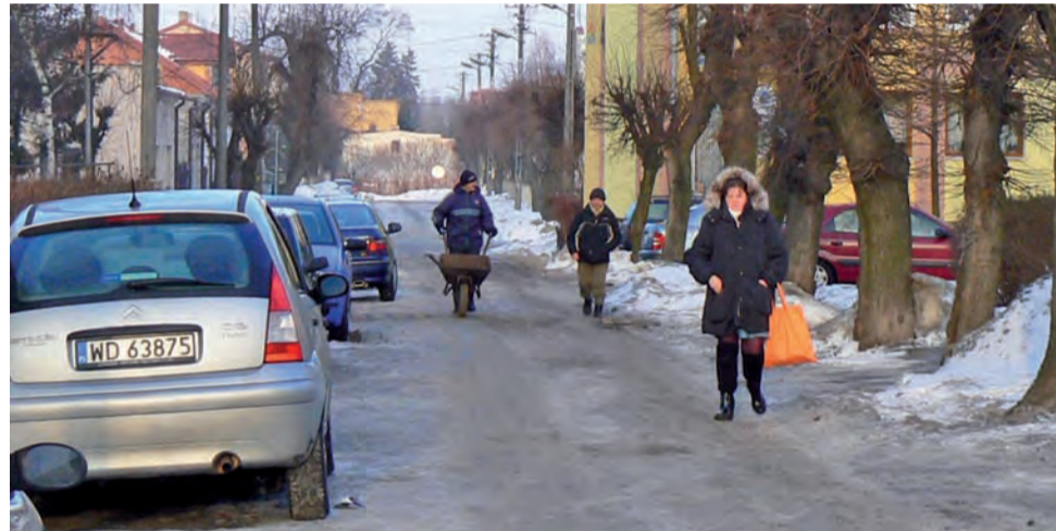
Jedynym sprzętem, jaki sprawdza się na osiedlowej ulicy są taczki i topata.