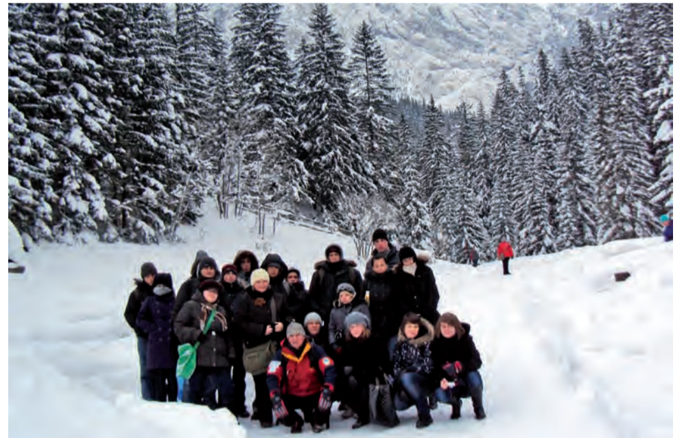
W zimowej scenerii u podnóża Giewontu. Uczniowie „Cebertowicza” w zaśnieżonej Dolinie Strążyskiej.

Koniec listopada 41 uczniów biorących udział w zajęciach z biologii i geografii spędziło w Tatrach. Celem tej wycieczki było skonfrontowanie z rzeczywistością wiedzy teoretycznej o regionie, poznanie przyrody Karpat i ich najwyższego pasma górskiego. Młodzież obserwowała warunki panujące w górach, szatę roślinną i świat zwierząt. Wyprawy górskie były też okazją do nauki zachowania właściwej postawy wobec środowiska. Oczywiście nie obyło się bez spotkania z folklorem góralskim i lokalną kuchnią, historią i specjalnymi kuchni podhalańskiej. Dolina Kościeliska, Brama Kantaka, Lodowe Źródło, Smreczyński Staw, Schronisko na hali Ornak, Muzeum Tatrzańskie im. Tytuśa Chałubińskiego czy Muzeum Przyrodnicze Tatrzańskie