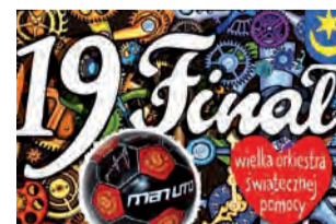
Na aukcjach w Strykowie piłka Manchesteru United osiągnęła wartość 200 zł.

Mając na uwadze ten szczytny cel wzięliśmy pod lupę aspekt sportowy, który niestety w tym roku wystąpił bardzo symbolicznie. Jedynym rekwizytem związanym ze sportem była oryginalna piłka jednego z najlepszych klubów świata Manchesteru United z podpisanymi piłkarzy. Futbolówka została wystawiona na aukcję na kwotę 50 zł. Szybko jednak jej cena rosła w górę i ostatecznie sprzedano ją za okragłe 200 zł. Szczęśliwym nabywcą piłki tego utytułowanego, angielskiego zespołu jest mieszkaniec Strykowa, który już ubiegłych latach wykazywał duże zainteresowanie takiego typu przedmiotami i zawsze chętnie je licytował. Niestety próżno szukać innych takich rekwizytów, bo po prostu ich nie było. Szkoda, bo w ubiegłych latach było o co walczyć. Do kupienia były m.in. koszulki