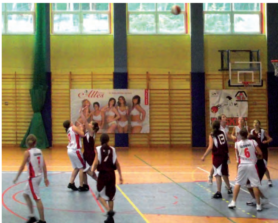
Młode koszykarki TK Alles Główno wykonały ogromną pracę i zrobili kolejny duży krok naprzód w swojej karierze sportowej.

W 9. kolejce TK Alles pokonał bez gry walkowerem Trójkę