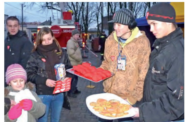
Stryków. Uczniowie Centrum Kształcenia i Wychowania w Dobieszkwowie przygotowali niespodzianki w postaci własnoręcznie wypieczonych i uszytych serduszek.