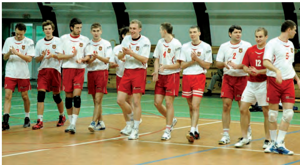
Siatkarze Volleyballa Głowno nie mogą zaliczyć pierwszej części sezonu do udanych, choć trzeba stwierdzić, że w porównaniu z poprzednimi rozgrywkami postawa siatkarzy z Głowna jest lepsza.