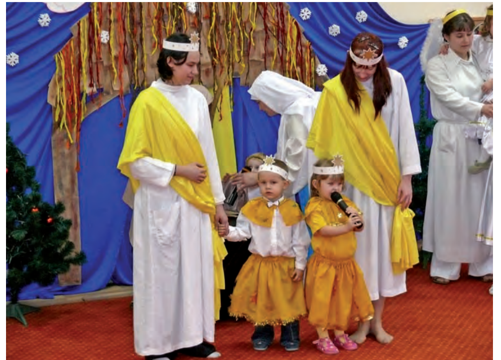
W przedszkolu diecezjalnym 3-letnie dzieci wystąpiły w Jasełkach wspólnie z rodzicami.

OFKiP to jeden z największych festiwali kołęd w Polsce. Początkowo była to impreza regionalna. Powstała z inicjatywy młodzieży zrzeszonej przy parafii św. Trójcy w Będzinie w 1994 r. Jednak zainteresowanie festiwalem wzrastało z roku na rok. Teraz, od kilku lat, same eliminacje odbywają się w 33 miastach Polski oraz w Równem na Ukrainie. jr