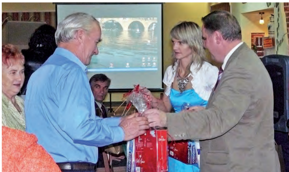
Uroczyste podsumowanie projektu odbyło się pod koniec ubiegłego roku.

PCPR zorganizowała turnus rehabilitacyjny dla niepełnosprawnych. Uczestniczyło w nim 25 osób. Były to osoby posiadające orzeczenie o stopniu niepełnosprawności. Turnus odbywał się w Łebie w ośrodku Mazowsze. Uczestnicy turnusu uczestniczyli w zajęciach z doradztwa zawodowego oraz mieli możliwość codziennego korzystania z trzech zabiegów. Dwa z nich były typowo lecznicze, jeden natomiast to zabieg usprawniający, np. muzykoterapia czy nordic walking. Uczestnicy kursu mieli