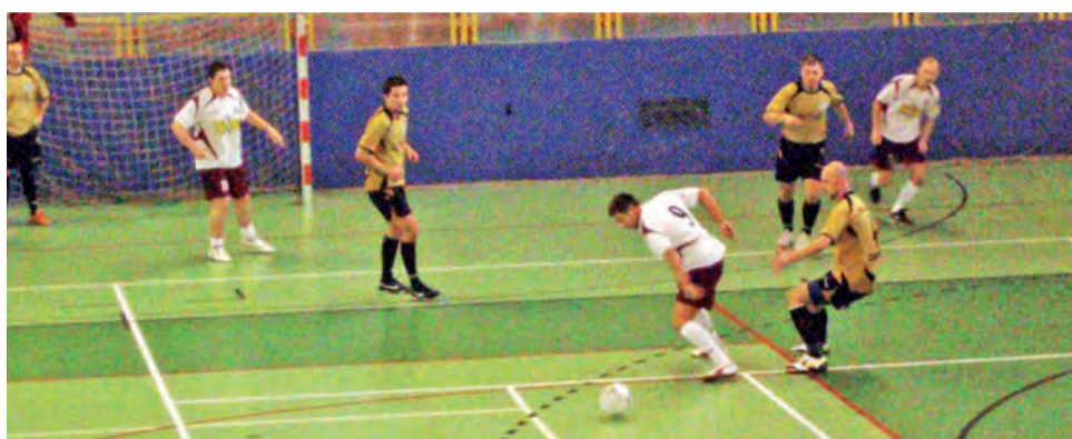
Drużyna rezerw Zjednoczonych Stryków, podobnie jak pierwsza, wystąpiła w turnieju halowym. Wypadło nieźle, ale oczekiwania były znacznie, znacznie większe.

Niestety kolejna faza turnieju nie była już tak szczęśliwa dla strykowskich zawodników. W walce o finał Zjednoczeni zmierzali się z AMII Nowosolna i