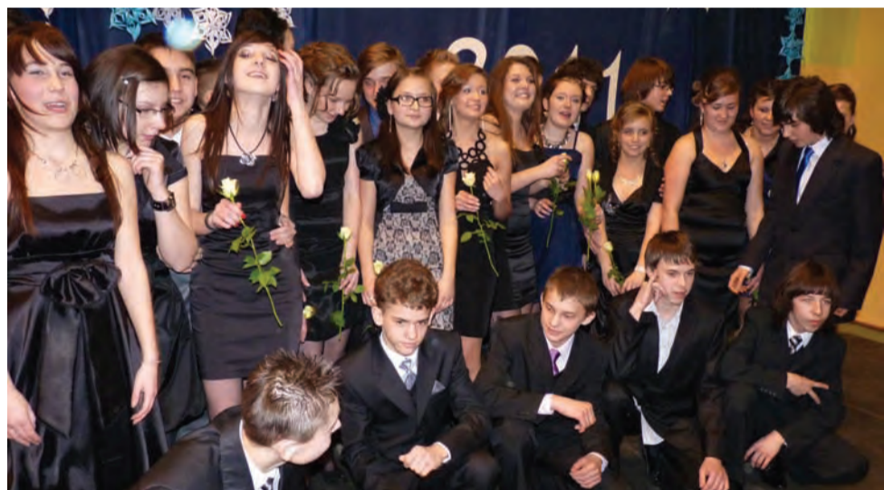
Gimnazjaliści z Dmosina. W wieczorowych strojach łatwo byłoby ich pomylić z maturzystami.

Głowieńskie koło Światowego Związku Żołnierzy Armii Krajowej oraz Komenda Hufca ZHP Głowno zapraszają do udziału w uroczystej mszy świętej z okazji 69. rocznicy powstania AK. Odbędzie się ona w najbliższą niedzielę, 13 lutego o godz. 10.30 w kościele św. Jakuba w Głownie. rpm