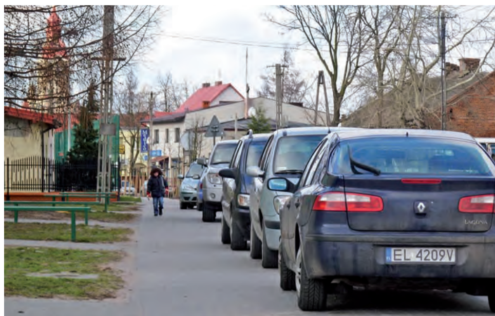
Czy samochody wzdłuż tego chodnika zastąpią kwiatowe gazony?

Jak dowiedzieliśmy się w wydziale inwestycji UM-G Stryków, jedyne co ze strony gminy można byłoby brać w chwili obecnej pod uwagę, to