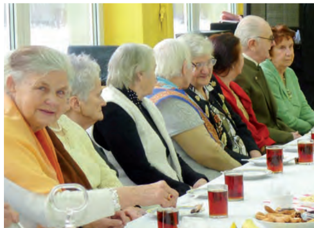
Spotkania w kozielskiej szkole słyną już z tego, że panuje na nich domowa atmosfera.

Kilkudziesięciu seniorów wzięło udział w dorocznym spotkaniu, jakie odbyło się w Szkole Podstawowej w Koźlu, 3 lutego. Już po raz czwarty z rzędu udało się je zorganizować dzięki wspólnemu wysiłkowi lokalnych organizacji społecznych, takich jak OSP, KGW, radzie sołectkiej, a także parafii.