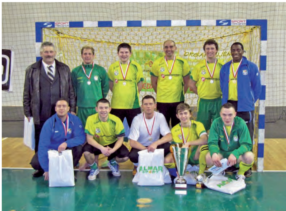
Piłkarze Ubojni Drobiu Piórkowscy Wola Cyrusowa odnieśli kolejny wielki sukces. Tym razem w halowych Mistrzostwach Polski Branży Spożywczej w piłce nożnej wywalczyli kolejny złoty medal.

Zmobilizowana drużyna z gminy Dmosin rozegrała swoje najlepsze spotkanie w całych mistrzostwach i pewnie pokonała ekipę z Lublina 3:0. W finale UD Piórkowscy zmierzyli się z Brodnickimi Zakładami Żelatyny. Wydawało się, że prowadzenie w meczu 1:0 i kontrolowanie wydarzeń na boisku przyniesie łatwe zwycięstwo drużynie Ubojni Drobiu. Niestety na trzy minuty przed zakończeniem spotkania po błędzie