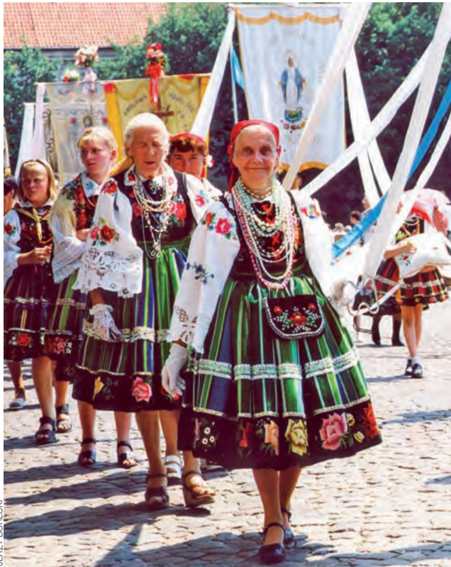
Tradycyjnie w stroju ludowym. Jedna z procesji Bożego Ciała.