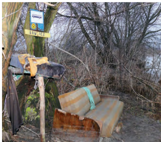
Wędkarze łowiący ryby w Bzurze, mają niecodzienne pomosty. Tuż pod Łowiczem jest miejsce, które wędkarz wyposażył w wersalkę, dodatkowo siedzisko na drzewie, a całość ostonił od wiatru belami sprasowanej słomy. Dodatkowo miejsce ozdobił tabliczką z nazwą Łowicz z przystanku PKS. Ciekawe czy nakład pracy włożony w to miejsce przełoży się na ilość złowionych w rzece ryb. tb