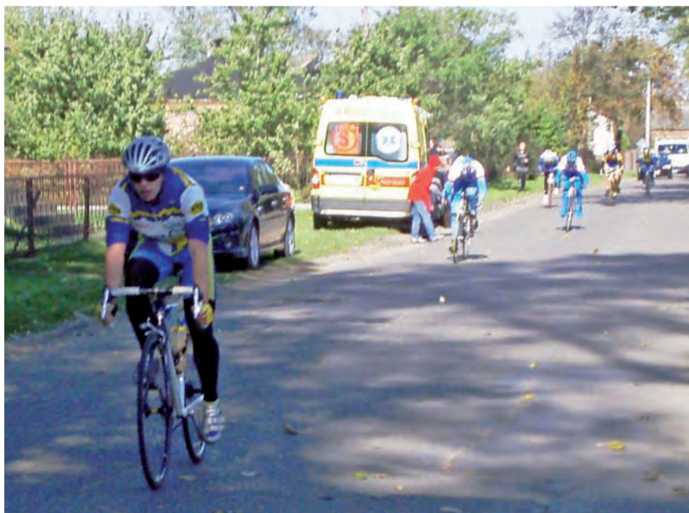
Kolarze LUKS „Dwójki” Stryków z pewnością dobrze przepracują okres przygotowawczy, by w wyścigach być na „kresce” znacznie szybszym od rywali. Kolejne wyścigi z udziałem strykowski kolarzy już niebawem.