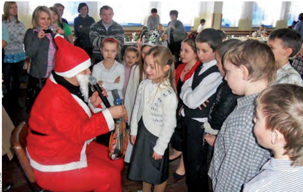
Karnawał w Popowie. Na szkolnej zabawie nie zabrakło Mikołaja.

Gospodarstwa domowe oraz firmy funkcjonujące na terenie miasta i gminy Stryków (te za odbiór śmieci płacą) w skali roku produkują od 3 do 4 tys. ton śmieci. Gminny plan gospodarki odpadami na lata 2008-2015 przewiduje się, że do 2015 roku ilość ta wzrośnie jeszcze o 10%. W tym roku strykowskie śmieci trafić będą nie na wysypiska, tylko do zakładu utylizacji odpadów i sortowni Wexpoolu. Z tego względu, firma ta mogła zaproponować Strykowowi cenę niższą od pozostałych 4 oferentów. tjs