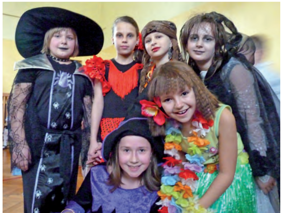
Barwne stroje uczennicy klasy IIIc rzuciły się w oczy na szkolnym parkiecie.