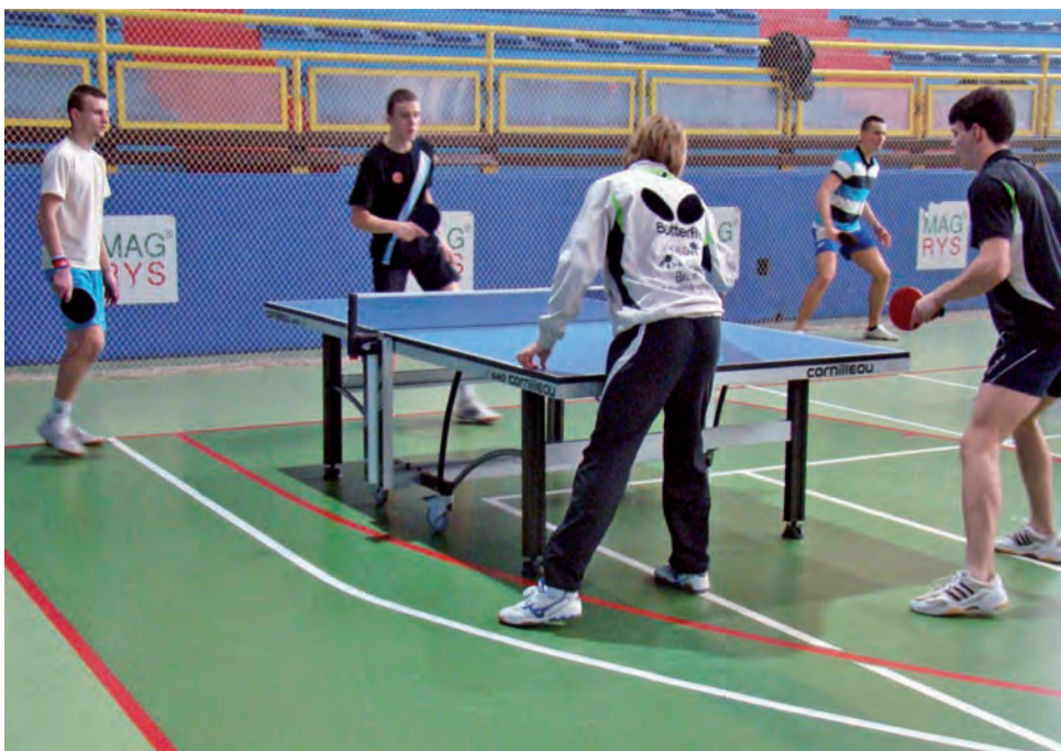
Tenisistom ZS nr 1 Bratoszewice nie udało się wywalczyć awansu do mistrzostw województwa łódzkiego w tenisie stołowym szkół ponadgimnazjalnych. Bratoszewiczanie zajęli w turnieju rejonowym trzecie miejsce, a na osłodę pozostał im fakt, że byli lepsi od mistrza powiatu zgierskiego.

Pabianiczanie okazali się lepsi od łęczyczan i pokonali rywali pewnie 3:1, zdobywając pierwsze miejsce. Oprócz zwycięstwa z ZS Łęczycy, ekipa z Pabianic pokonała także ZSO im. Staszica Zgierz 3:0 oraz w takich samych rozmiarach