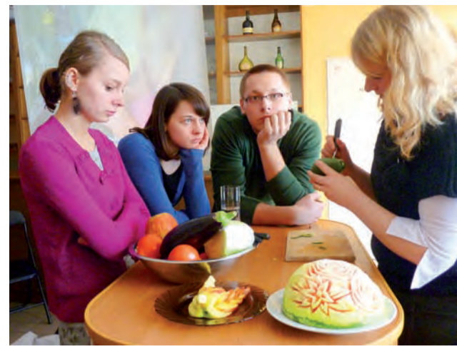
Pokaz carvingu wzbudził wśród uczniów ogromne zainteresowanie.

16 lutego o godz. 16.30 odbędzie się spektakl dla dzieci „Muzykanci z Bremy” w wykonaniu aktorów z Krakowa. tb