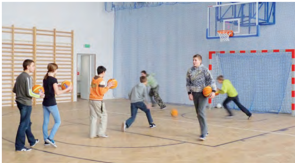
Pierwsze rzuty do nowych koszy w wykonaniu uczniów kl. I gimnazjum.