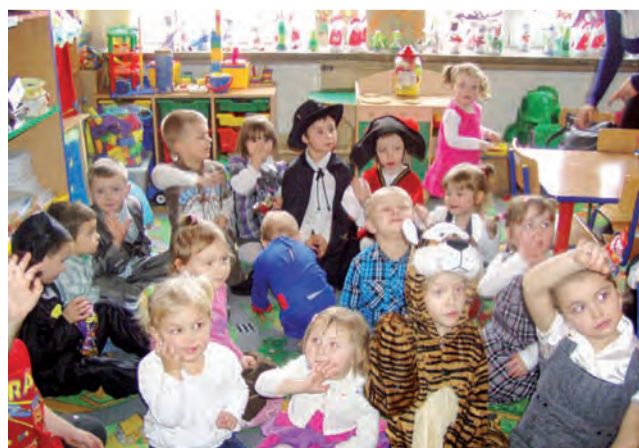
Zabawa karnawałowa przedszkolaków i dzieci z najmłodszych klas Szkoły Podstawowej w Domaniewicach zorganizowana 5 lutego okazała się wspaniałą atrakcją dla najmłodszych. W trakcie zabawy choinkowej na dzieci czekało mnóstwo niespodzianek. Zaskoczeniem dla wszystkich była wizyta Mikołaja, który rozdawał słodkie podarunki i chętnie fotografował się z dziećmi. am