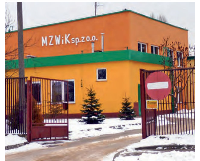
Siedziba spółki przy ul. Struga.