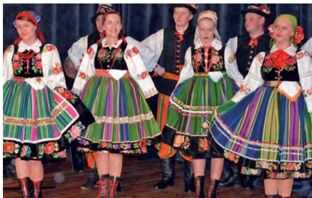
Mazovia wystąpiła w sobotę na scenie ŁOK. Cel był szczytny, a tak oto się prezentowała.