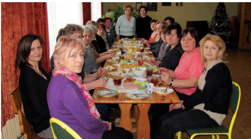
Po wspólnej pracy panie z KGW i panie z GOK spotkały się przy stole.