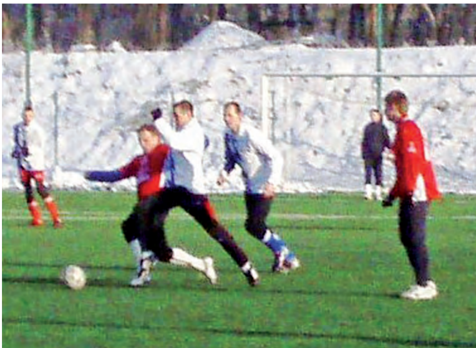
W drugim meczu sparingowym w tym roku, po wysokim zwycięstwie z KKS-em Kozłowski 6:0 Zjednoczeni Stryków zremisowali w Łodzi z drugą drużyną ŁKS-u 1:1. Jednak łodzianie byli znacznie bardziej wymagającymi rywalami niż drużyna z Kozłuszek.