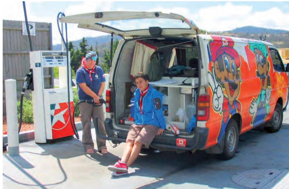
Po przejechaniu 450 km w drodze do góry Uluru głównianie dotarli nocą do stacji benzynowej, na której chcieli zatankować auto i wyruszyć dalej. Była jednak zamknięta i musieli spędzić noc w samochodzie.