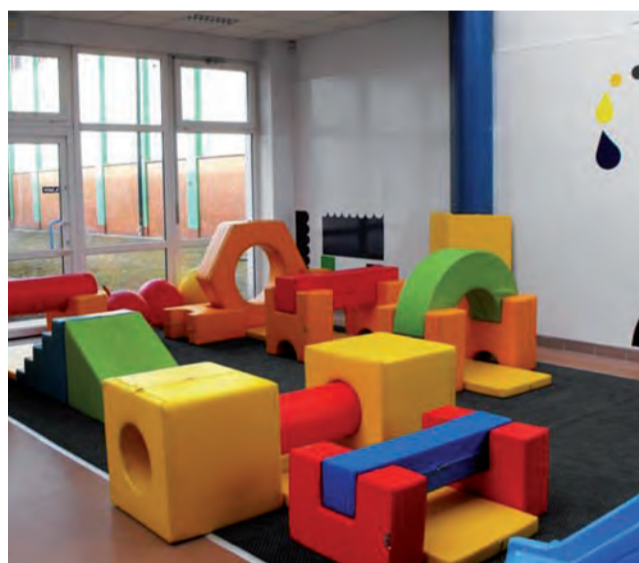
Tor przeszkód daje dzieciom możliwość pokonywania wysokości, utrudnień i co najważniejsze – jest bezpieczny.