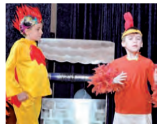
Kostiumy, scenografia, a przede wszystkim gra aktorska młodych strykowian ujęły komisję.