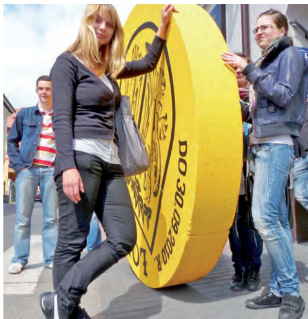
Tak inagurowano Książki. Spodobały się, ale na tym się skończyło

Właściciele punktów, którzy przystąpili do akcji potwierdzają, że ludzie kupowali książki przede wszystkim dla siebie