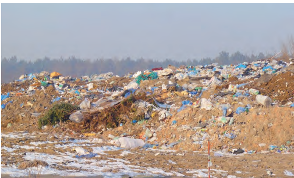
Składowisko odpadów pod Łowiczem. Jeśli miasto nie przeprowadzi kosztownych inwestycji może ono zostać zamknięte.

norm. Od roku 2005 do 2007 przeprowadzono tam szereg inwestycji, m.in. ogrodzono wysypisko, otoczono je wierzwą wiciową, która zatrzymuje folię oraz papiery, a do tego neutralizuje nieprzyjemny zapach, wjazd na wysypisko został utwardzony, postawiono budynek wagi, zamontowano wagę elektroniczną i wybudowano budynek socjalny. Do tego pobudowano rowy odciekowe odpowiedzialne za zbieranie wód spadowych, zapobiegające rozlewaniu się wody po terenie wysypiska. – Zainstalowaliśmy także 2 zbiorniki odprowadzające i zbierające wodę z tych rowów, 11 tzw. piezometrów do neutralizacji gazu składowiskowego i kilka takich urządzeń do obserwacji zanie-