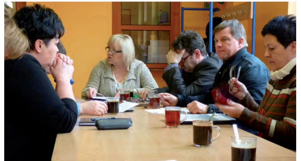
O trudnej sytuacji szkół członkowie miejskiej komisji oświatowej rozmawiali na posiedzeniu w SP nr 2.

Wszystkie trzy szkolenia odbywać będą się równocześnie. Ich początek zaplanowano na przełom kwietnia i maja. Trwają zapisy ich uczestników. Na liście widnieje już około 50 nazwisk. rpm