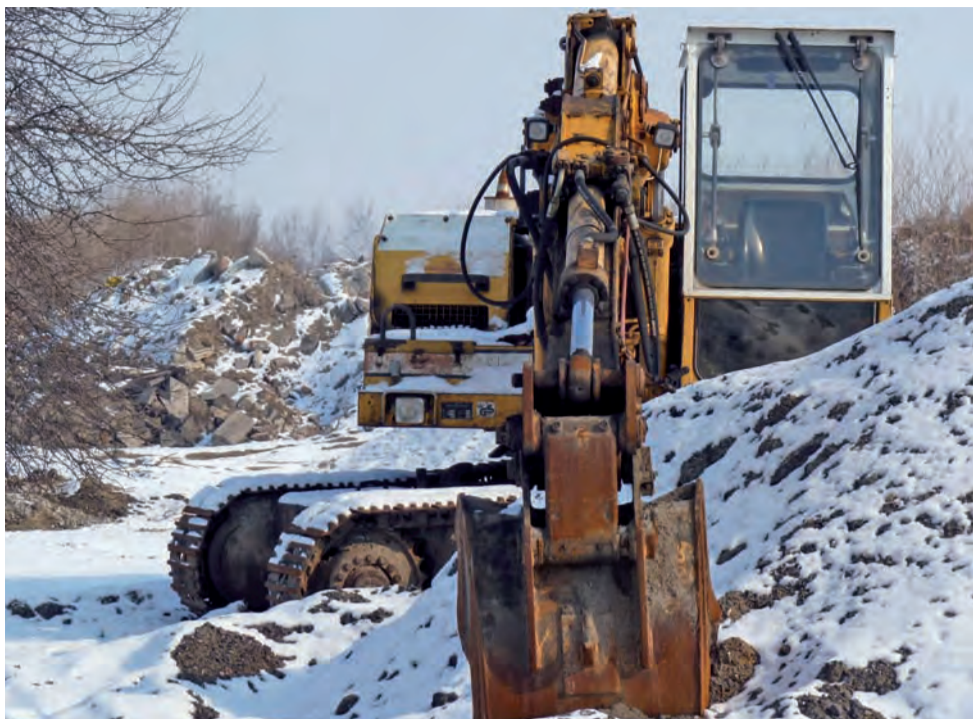
Na tyłach os. Kopernika na razie czeka ładowarka, niebawem ma się tu pojawić także kruszarka.

Stryków | Gruz zamiast kamienia z kopalni