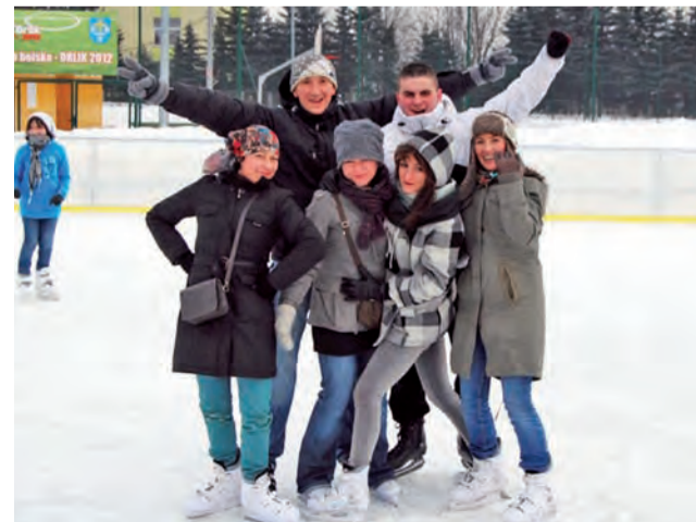
Czas wolny – to nie tylko wycieczki, ale także aktywny sport, tu na lodowisko w Skierniewicach.