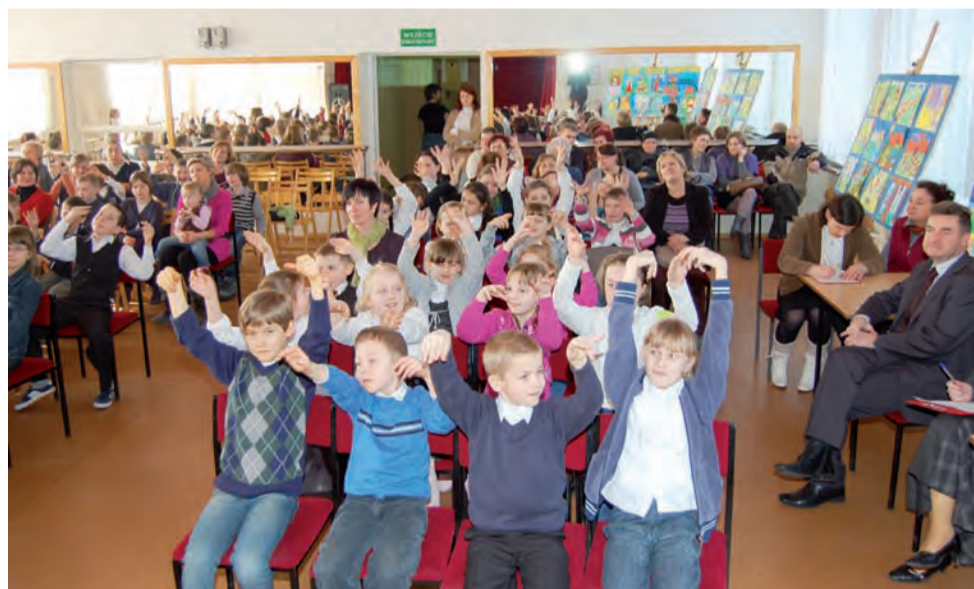
Podczas przesłuchań bawiła się cała publiczność.

Po naszej interwencji, tuż przed wydaniem gazety, 2 marca, oświadczenie majątkowe zostało opublikowane na stronie BIP Urzędu Gminy Bielawy. td