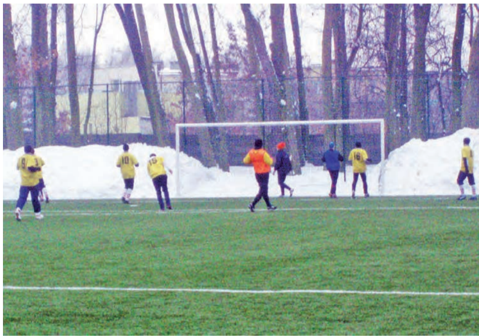
Tym razem piłkarze Zjednoczonych Stryków musieli uznać wyższość przeciwnika. Lepszym zespołem od strykowian okazała się Unia Skierniewice, która w meczu sparingowym strzeliła Zjednoczonym cztery gole.