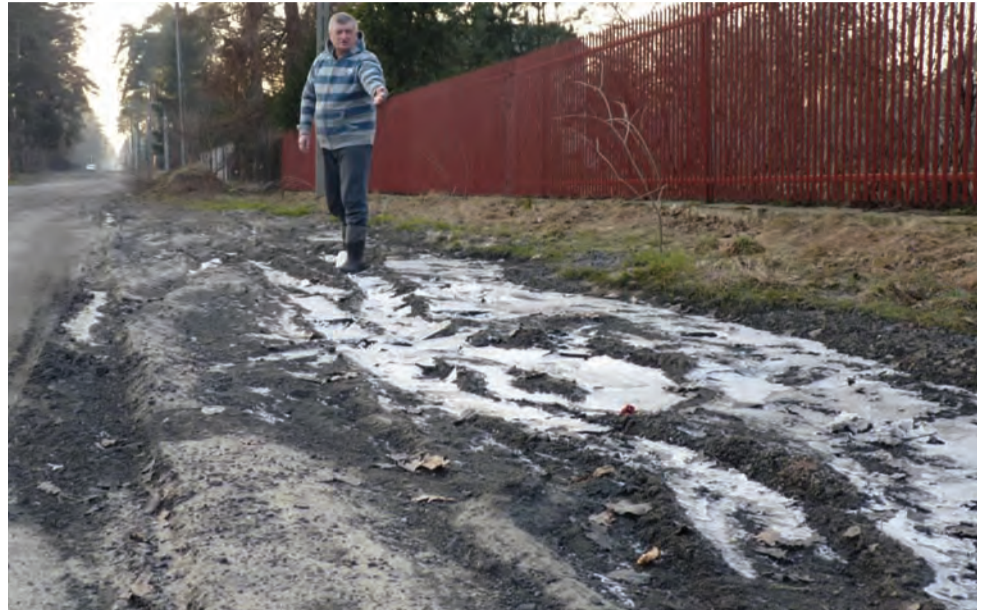
Zamarznięta glina, dziury, głębokie koleiny – tak nawierzchnia ul.18-go Stycznia wygląda w mroźne dni. W czasie roztopów, droga zmienia się w topiel.

– Raz, że tej szlaki było za mało, a druga sprawa to, że zrobili to po partacku – dodaje inny mieszkaniec, nie kryjąc zdenerwowania – Przywieźli to w piątek wieczorem, usypali z tego kopce na środku drogi, a niektórym sąsiadom we wjazdach do posesji, w za-