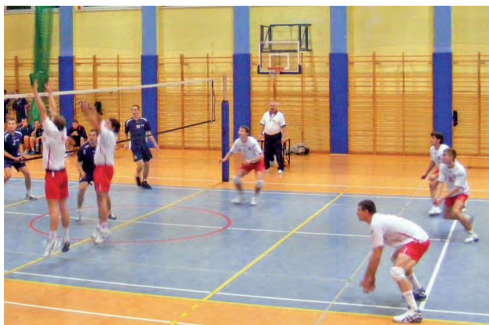
Siatkarze Volleyballa Głowno ponieśli kolejną porażkę i w minorowych nastrojach powoli kończą rozgrywki III ligi.

Lider z Łęczycy jednak utrzymał pierwsze miejsce w tabeli, ale jego przewaga nad drugą w klasyfikacji Wartą Działoszyn zmalała tylko do dwóch punktów. Działoszynianie mieli szansę zbliżyć się do MMKS-u nawet na dystans jednego „oczka”, jednak w Kuluszkach nie potrafili pokonać wyżej, niż tylko 3:2 tamtejszy OSiR.