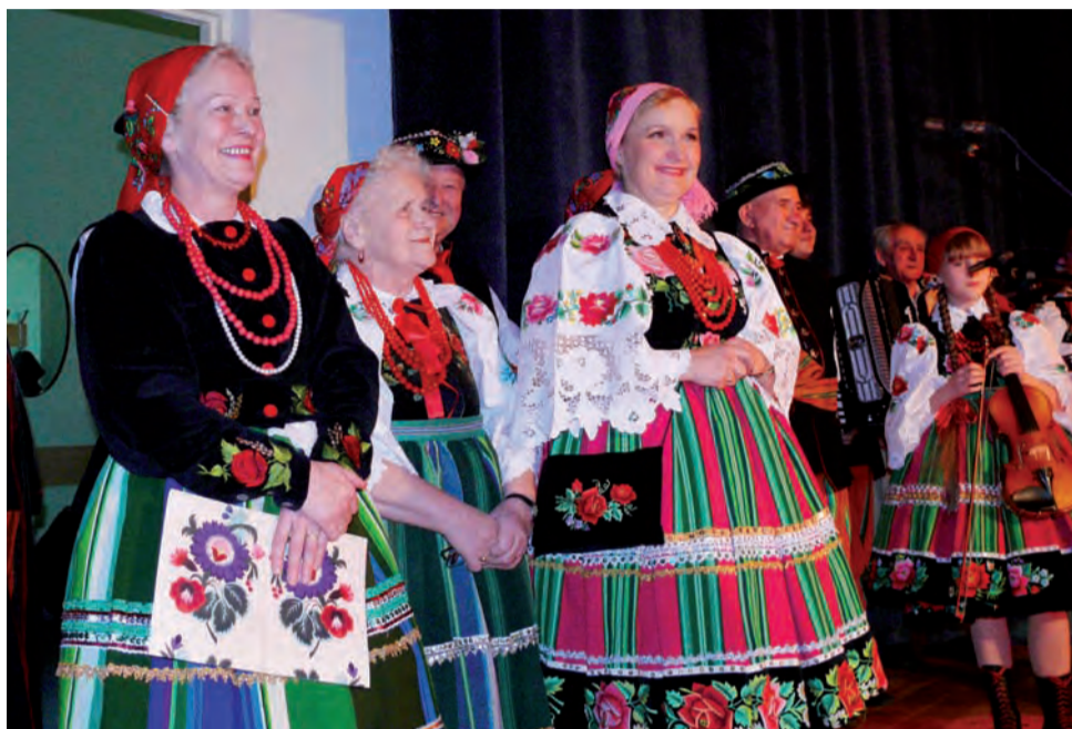
Część grupy śpiewaczej powstałej z inicjatywy Stowarzyszenia Twórców Ludowych wystąpiła w czasie nadania tytułu Łowiczanie Roku 2010 w Kinie Fenix.