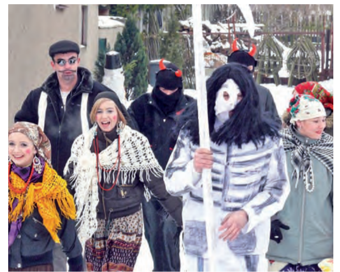
Tak chodzono z Misiem w 2009 roku, wśród osób idących w korowodzie przez Bobrowniki jest młodzież z zespołu ludowego Krzewina działającego w GOK.

„Chodzenie z misiem” lub inaczej „ostatki w Bobrownikach” odbywają się zawsze w ostatnią niedzielę karnawału, która w tym roku przypada 6 marca. W kolorowym korowodzie prowadzonym na słomianym powrośle idzie ubrany w plecione siano miś, śmierć