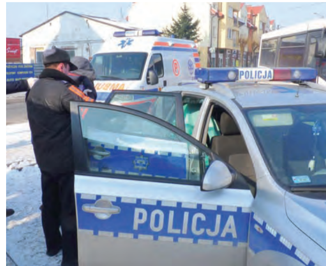
Po tym, jak pijany mężczyzna nie wyraził zgody na przebadanie go przez ratownika pogotowia, funkcjonariusze policji wprowadzili go do radiowozu i odwieźli do domu.

Przy tej okazji dowiedzieliśmy się, że upity do nieprzytomności 39-latek znany jest doskonale funkcjonariuszom głowieńskiej policji i nie dalej jak tydzień wcześniej był po podobnej interwencji odwożony przez pogotowie na oddział toksykologii, po zatruciu podejrzanym alkoholem. – Tylko dzięki