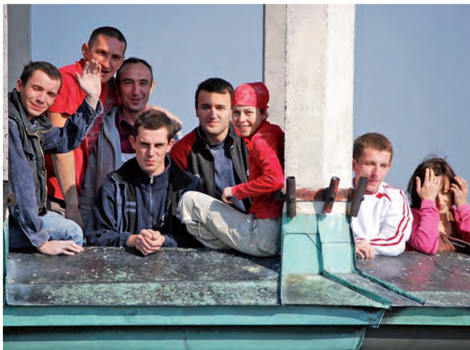
Katedra w Łowiczu. Pracownicy mieli także okazję zobaczyć widok rozpościerający się z wieży łowickiego kościoła.

W czasie wolnym, który przypada zawsze w sobotnie popołudnie i w niedziele, zwiedzają łowickie okolice. Byli już w Żelazowej Woli, w skansenie w Maurzycach, w Warszawie, w Walewiczach, w Skierniewicach oraz w Ło-