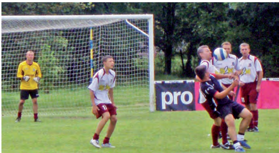
W meczu z liderem skierniewickiej A-klasy rezerwy Zjednoczonych Stryków pokazały, że są lepsi od przeciwników.