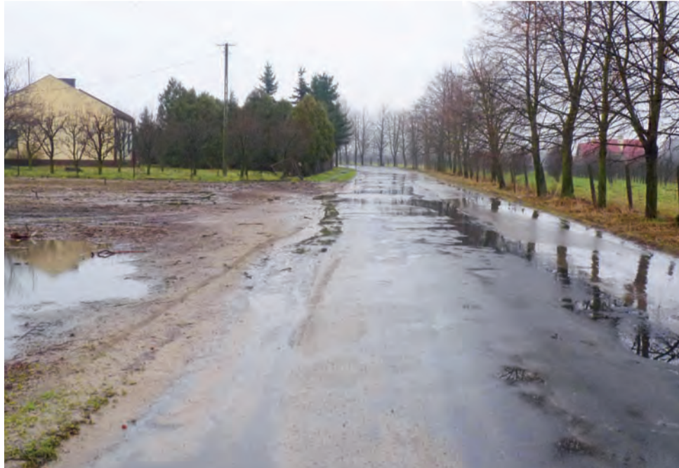
Powiatówka w Rudniczku. Tak droga wygląda w czasie roztopów lub po silnych deszczach.