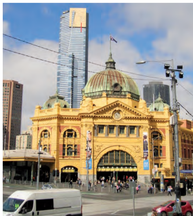
Kontrasty architektoniczne w Adelajdzie.