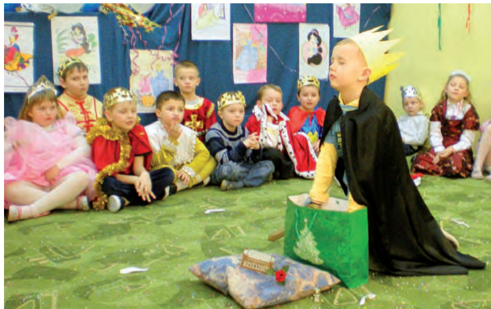
Największym powodzeniem cieszył się konkurs „Czary-mary, mały zgrzyt, z jakiej bajki ten rekwizyt?”

Gmina Dmosin | Zespół Szkół Samorządowych