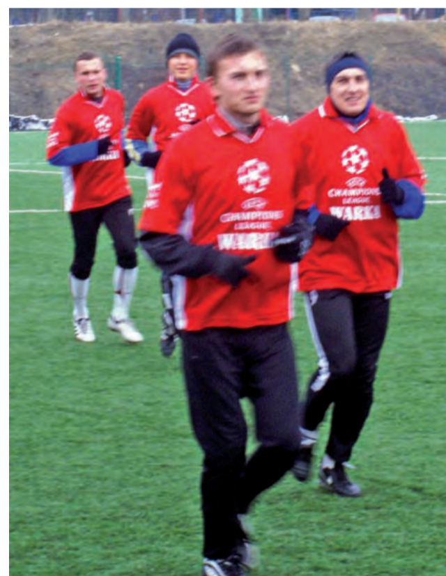
Piłkarze Zjednoczonych Stryków mają powody do uśmiechu. Po wysokim zwycięstwie nad Pogonią Rogów humor im dopisywał.