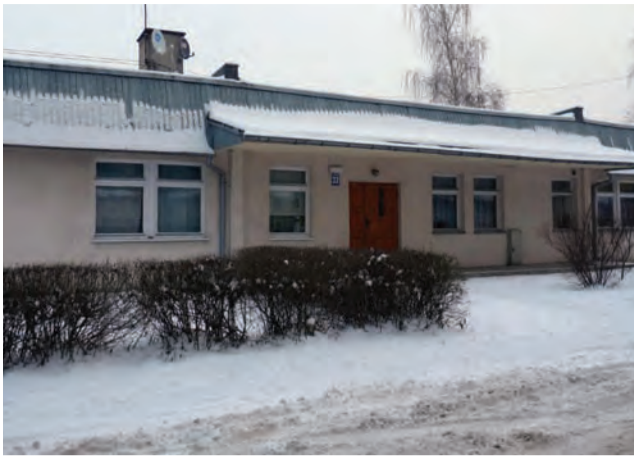
Ten budynek wybudowany został w 2004 r., dziś okazuje się, że miasto będzie musiało zwrócić dotację pozyskaną na budowę z BGK.