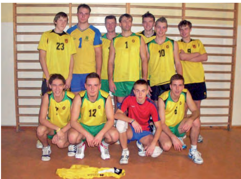
Siatkarze BS TKKF 45 Głowno zdołali w ostatniej chwili znaleźć się na podium Amatorskich Mistrzostw Łowicza.

Łowiczanie i skierniewiczanie grali już tylko o prestiż, bowiem wcześniej obie drużyny zapewniły sobie odpowiednio pierwsze i drugie miejsce. W grupie „B”, gdzie zespoły walczyły o miejsca od dziewiątego do szesnastego, pierwsze miejsce wywalczyli siatkarze Rawki Bolimów, którzy w ostatniej kolejce, w najciekawszym meczu