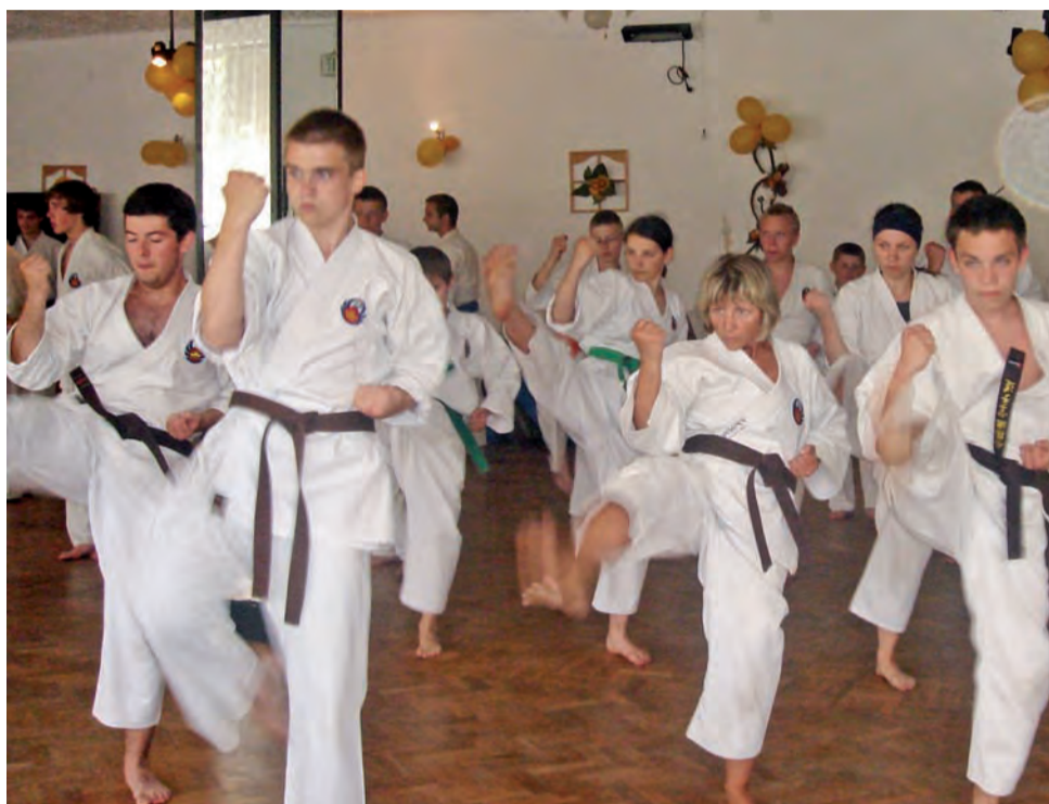
Coraz głośniejszy w sportowym świecie Shorin Ryu Karate jest o karatekach ze Strykowa.

Powinno się zaznaczyć, że karate to nie tylko same techniki, ale również kodeks Bushido, tradycja przekazywana poprzez stulecia. Karate to kult mistrza, który własną edukacją prezentuje następnym pokoleniom, pracując nad każdym szczegółem. Według Mistrza Anko Itosu z