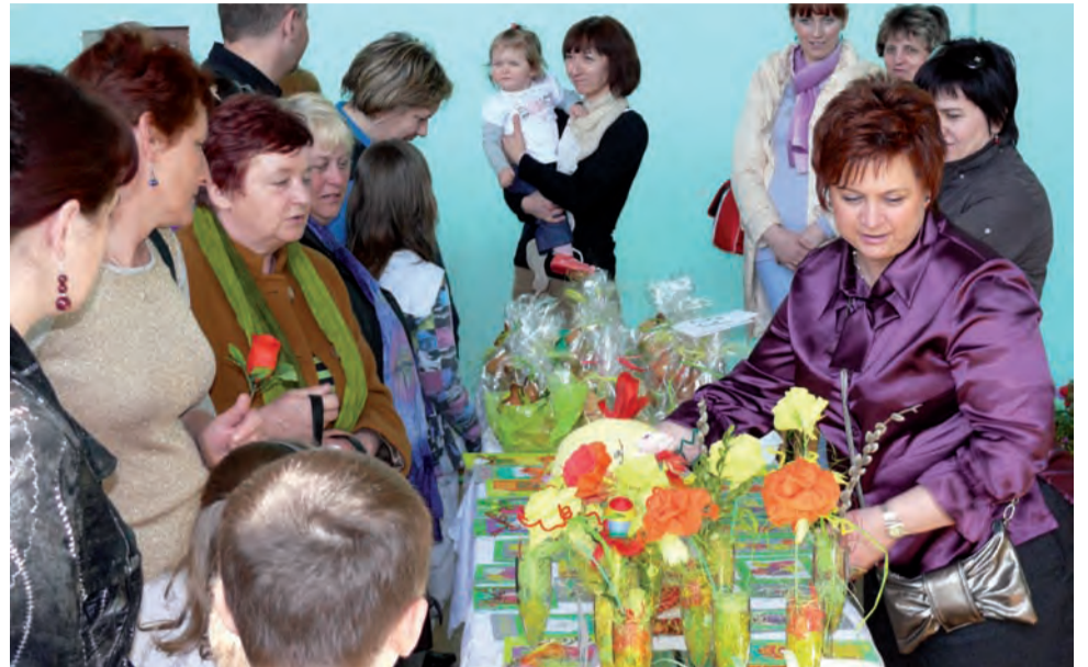
Kiermasz ozdób wielkanocnych w Bednarach spotkał się z dużym zainteresowaniem. Było zresztą w czym wybierać.

Osoby, które obkupiły się na kiermaszu wielkanocnym, mogły także wykupić los na loterii fantowej. Każdy z kosztujących 4 zł losów wygrał. Na szkolnym holu rodzice rozstawili też stoiska z ciastami świątecznymi, pachniał świeżo smażony, maślany pop-corn, można było skosztować żurku wielkanocnego, bigosu, pieczywa własnego wypieku itp. Był bufet z na-