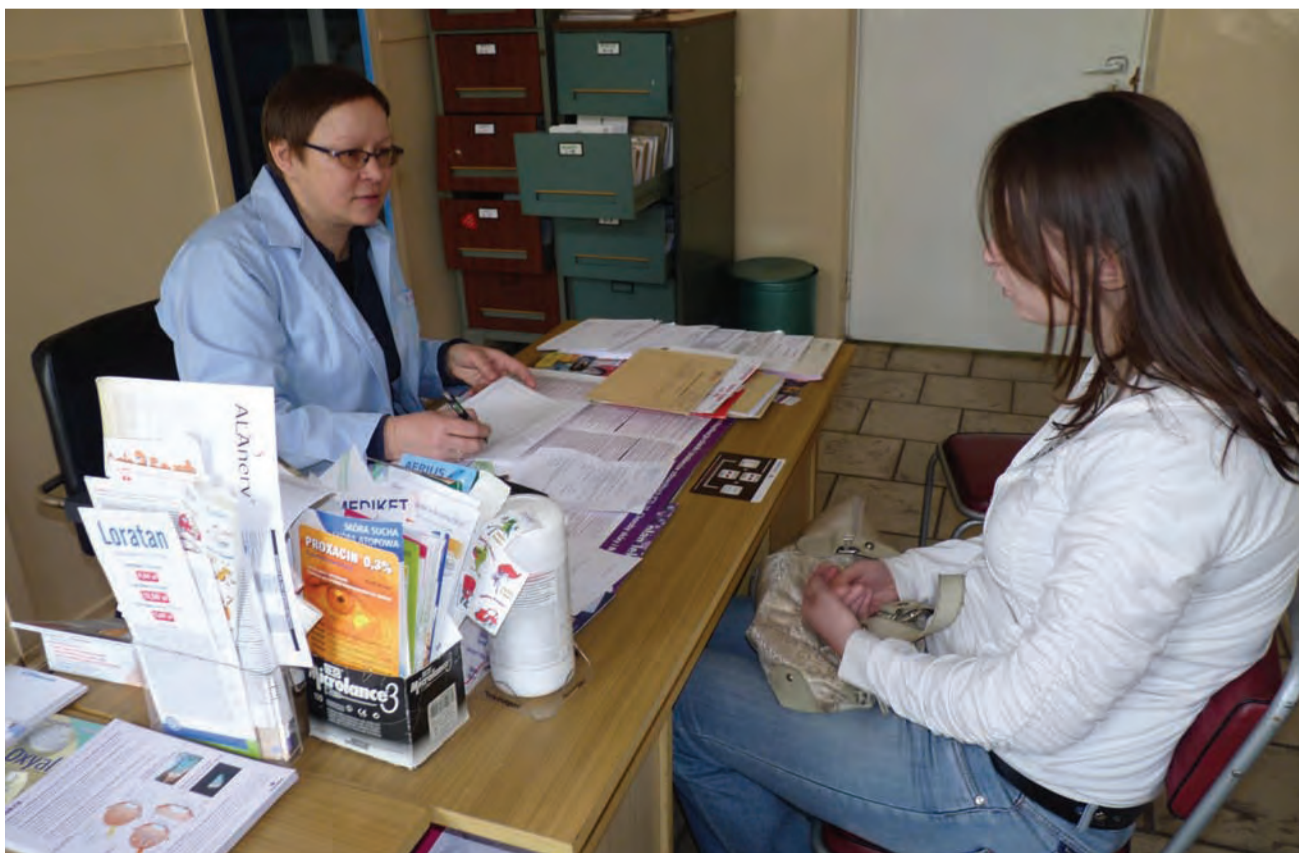
Gabinety nie zachwycają nowoczesnością, ale niedługo cały budynek strykowskijskiej przychodni ma przejść gruntowny remont.