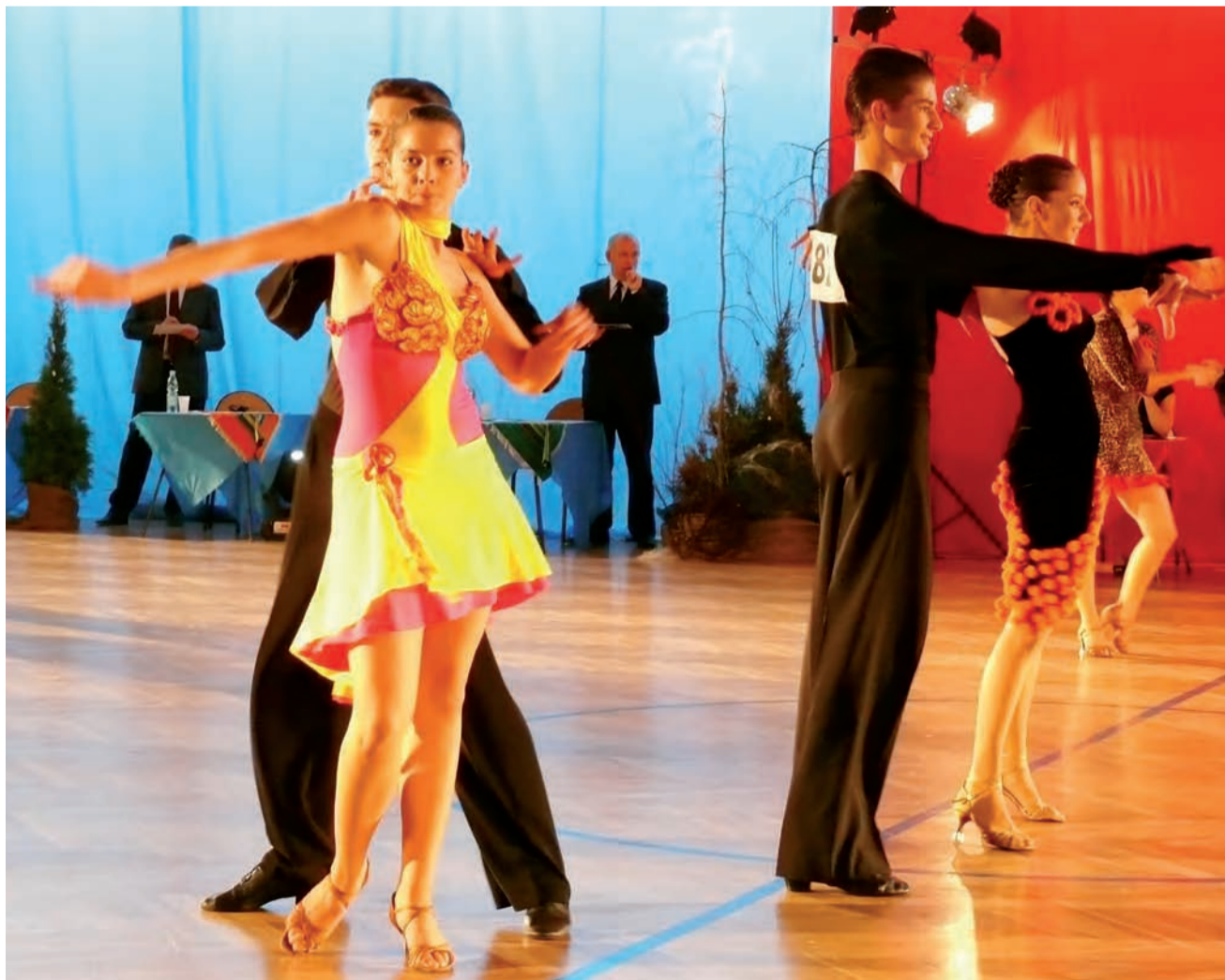
Kolorowe światła oraz zupełnie zmieniony na czas mistrzostw wystrój hali sportowej sprawiły, że pokazy taneczne były bardzo atrakcyjne wizualnie.

cy na turniej przyjechali z całej Polski. Niestety, nie było żadnej reprezentacji z Łowicza. W drugim bloku tanecznym wystąpiły pary taneczne w wieku 14-15 lat i powyżej 15 lat występujące w klasach tanecznych E i D. W trzecim bloku, który rozpoczął się dopiero o godzinie 18.00, wystąpiło około 30 par tanecznych w najwyższej klasie tanecznej na mistrzostwach – B. Trzeba przyznać, że pary te prezentowały bardzo wysoki poziom. – Jak w Tańcu z Gwiazdami. Mama, ja też tak chcę tańczyć – zachwycała się kilkuletnia mieszkanka Łowicza, która wraz z mamą przyszła oglądać tancerzy. Tancerze prezentowali tańce standardowe, czyli walc angielski, tango, walc wiedeński, foxtrot i quickstep oraz tańce latynoamerykańskie: sambę, cha-cha, rumbę, pasodoble, jive’a. Widzów było kilkudziesięciu. Jak oceniał organizatorzy, przez trybuny dla publiczności przewinęło się przez cały dzień ok. 300 osób – ale większość z nich to członkowie rodzin tańczących. Łowiczanie nie było wielu. mak