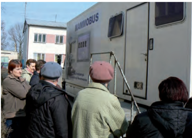
Mammobus w Bielawach. Mieszkaniczki chętnie korzystały z badania.

Podczas festynu zorganizowany został też mini konkurs „Wiem wszystko o Wielkanocy” i odbywały się zabawy dla dzieci na świeżym powietrzu. mak