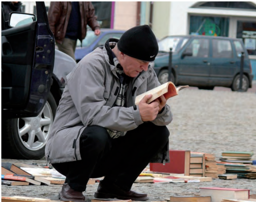
Podczas jarmarku dużym zainteresowaniem cieszyły się stoiska z książkami. W niedzielę używane książki miało kilku wystawców.