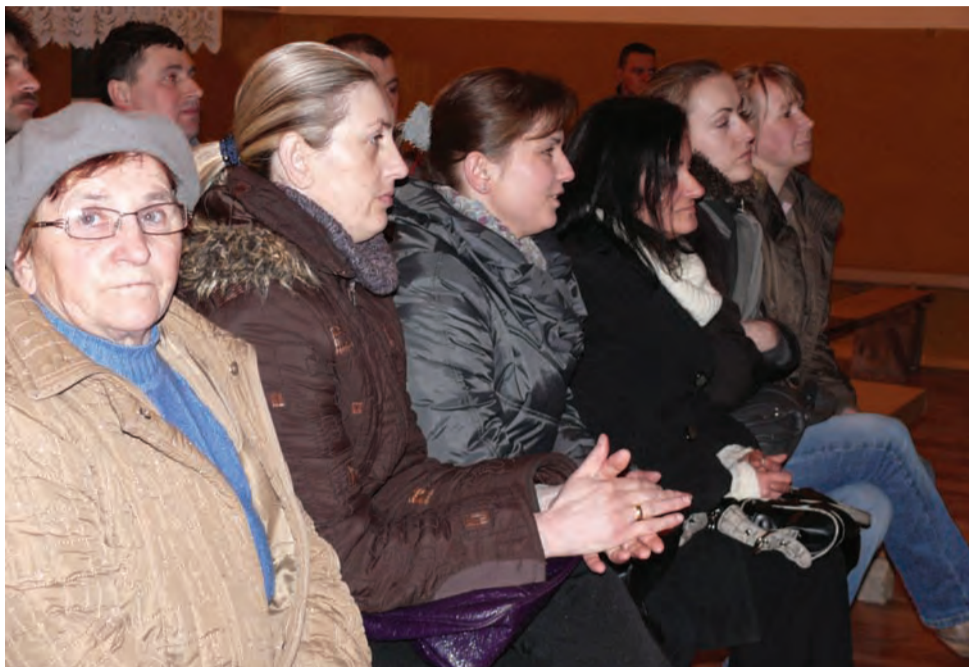
W spotkaniu poświęconemu zakładowi recyklingu wzięło udział 35 osób, inwestor jednak nie przekonał mieszkańców do swego pomysłu.

Zapewnienia o zatrudnieniu w zakładzie około 30 osób także nie przekonały mieszkań-