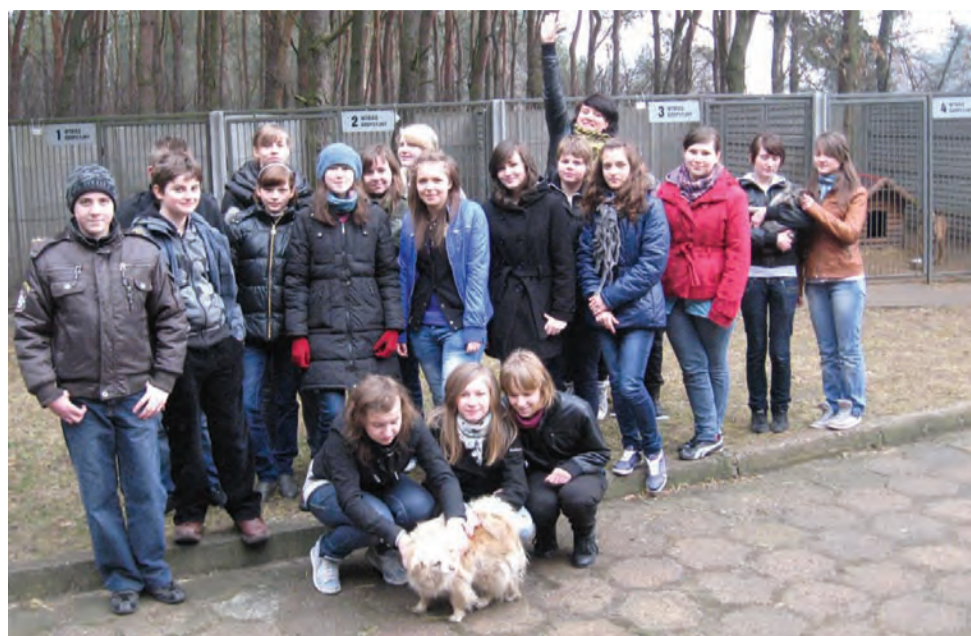
Ponad 100 kg pokarmu dla zwierząt dostarczyli 15 marca do łowickiego schroniska uczniowie z Gimnazjum Publicznego w Domaniewicach. Przez miesiąc zbierali oni karmę organizując w szkole akcję pod hasłem: „One także potrzebują twojej pomocy”. am

RZUT OKIEM | DOMANIEWICE POMAGAŁY ZWIERZĘTOM