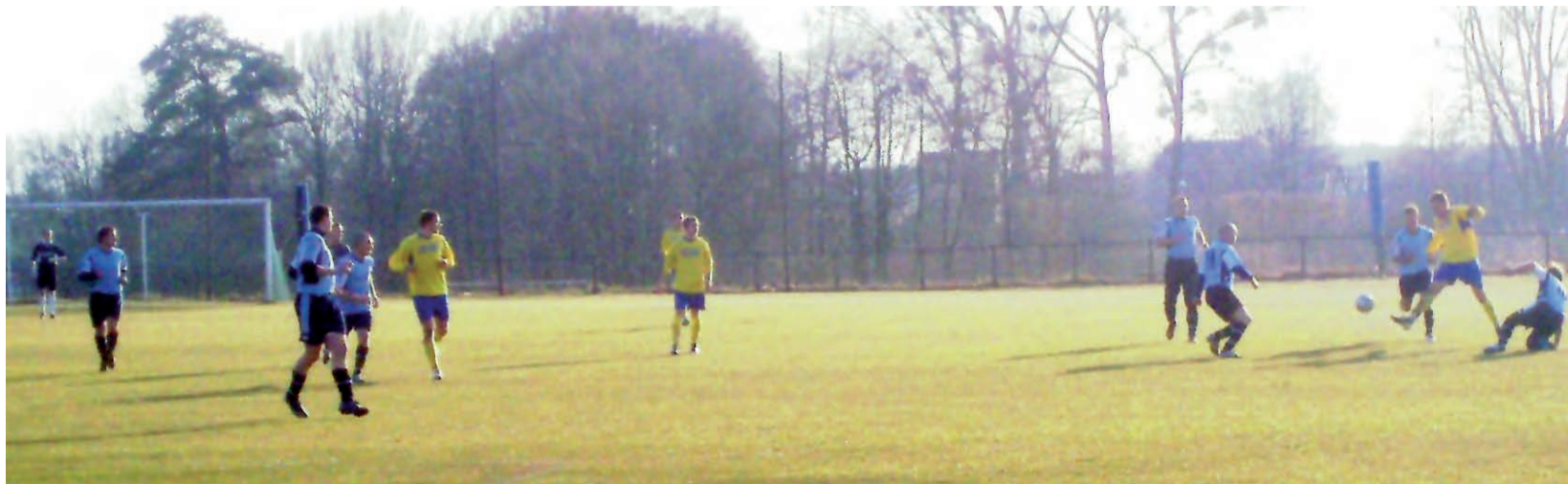
Cenne wyjazdowe zwycięstwo Stali Głowno nad Pogonią Roggów doda głównianom pewności siebie w kolejnych meczach o mistrzostwo V ligi.