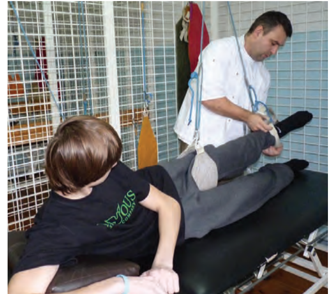
Temu młodemu pacjentowi rehabilitacja w strykowskijskiej przychodni pomaga dojść do siebie po poważnym urazie nogi.

Komisja zdrowia przyzwyczajona do tego, że każdego roku otrzymywała informacje dotyczące liczby pacjentów zapisanych do przychodni i poszczególnych ośrodków zdrowia, tym razem się rozczarowała. – Od momentu kiedy przekształciliśmy się w spółkę, informacje te podlegają tajemnicy handlowej, a dodając do tego drobną walkę z NZOZ Swoboda w Głownie, nie mogę takich danych ujawnić.