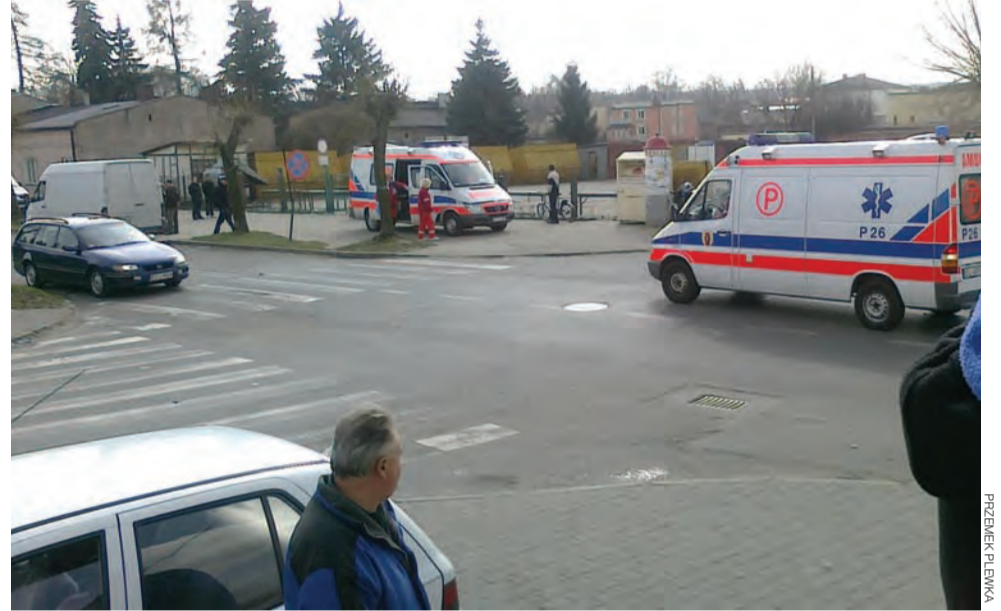
Na miejsce przyjechały dwie karetki, ale stan poszkodowanego wymagał natychmiastowego przetransportowania go śmigłowcem ratowniczym.