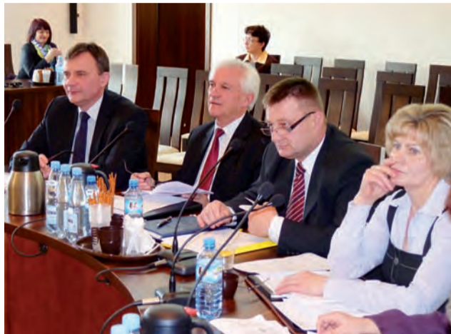
Tylko jedna zmiana w statucie nastąpiła na wniosek opozycji.

Skrócono z 7 do 5 dni termin dostarczenia radnym porządku obrad przed sesją. Wykreślono też punkt o przedłużeniu tego terminu do 14 dni w przypadku, gdy materiały dotyczą uchwalenia budżetu lub sprawozdania z jego wykonania. Zmianie uległ też zapis dotyczący zwoływania przez starostę posiedze-