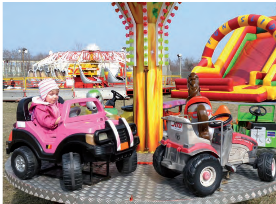
Wesołe miasteczko to gratka dla najmłodszych.