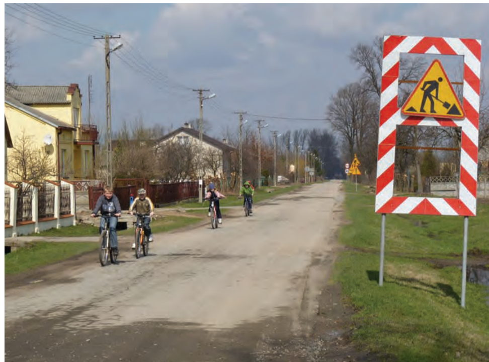
Droga Zakulin - Łagów przeznaczona jest dla pojazdów o dopuszczalnej masie całkowitej do 8 ton. Transport na budowę autostrady ma znacznie większy tonaż, stąd uszkodzenia nawierzchni.

Budowa autostrady A2 | Zniszczenia asfaltu na drogach dojazdowych