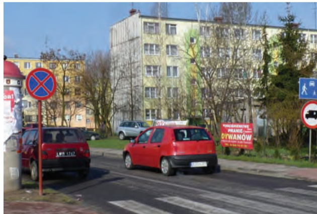
Nie wszyscy stosują się do wprowadzonego zakazu i nadal parkują wzdłuż osiedlowego wjazdu.

już nawet próby uszkodzenia tych znaków – dodaje. Nie zamierza jednak ulegać naciskom i zapowiada, że zakaz zostanie utrzymany. Bezpieczeństwo jest bowiem ważniejszą sprawą niż wygoda klientów sklepu. Ci będą musieli przyzwyczaić się do parkowania aut na tyłach Biedronki i jeżdżenia wózkami z zakupami kilkanaście metrów dalej niż dotychczas. rpm