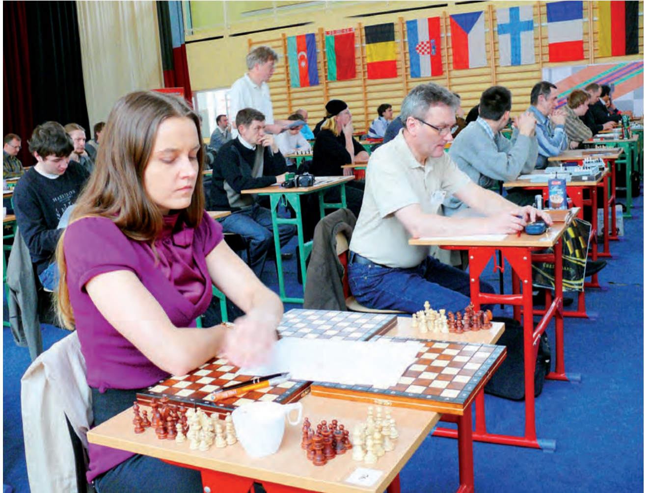
Rozwiązywanie zadań szachowych jest dyscypliną zdominowaną przez mężczyzn. Można się było o tym przekonać podczas mistrzostw Europy, w których wystartowała tylko 1 kobieta.

Jak wyglądały zawody? W sali gimnastycznej szkół pijarskich zebrało się blisko 100 szachistów. Każdy z nich losował inne zadania. Rozwiązywanie zadań szachowych – solving – jest to bowiem oddzielna dyscyplina szachów, polegająca na rozwiązywaniu kombinacji zawierających interesujący problem. Jednym z przykładów zadań szachowych jest na przykład samomat. Grający figurami czarnymi ma dać mat prze-