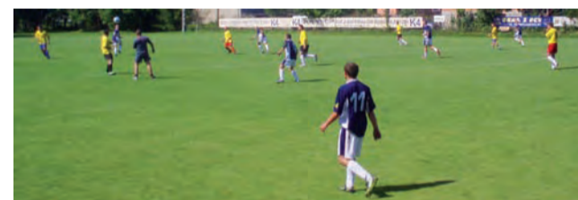
Pierwsze spotkanie w rundzie wiosennej piłkarze rezerwy Zjednoczonych Stryków mają już za sobą.

Dobra gra i zwycięstwo przyczyniły się do tego, że zespół prowadzony przez trenera Fortunę przesunął się w tabeli na trzecią pozycję i do liderującej Andre-spolii traci już tylko 5 pkt. W kolejnym spotkaniu rozgrywek A-klasy, gr. II strykowie zagrają 10 kwietnia z trudnym przeciwnikiem. Mecz z wiceliderem LKS Rosanów, na jego terenie będzie hitem 13. kolejki i szansą na przeskoczenie przeciwnika w tabeli. wp