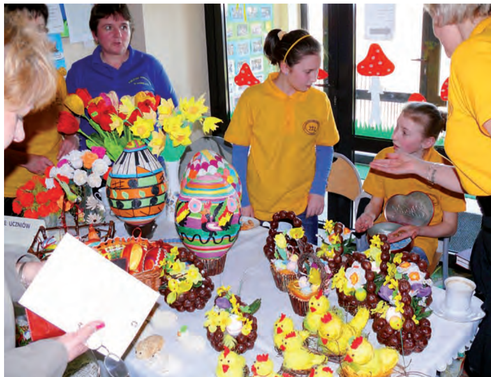
Pisanki różnej wielkości, papierowe kwiaty, wielkanocne koszyczki, kurczaczki i inne świąteczne gadzety można było kupić podczas kiermaszu towarzyszącego koncertowi w Sannikach.