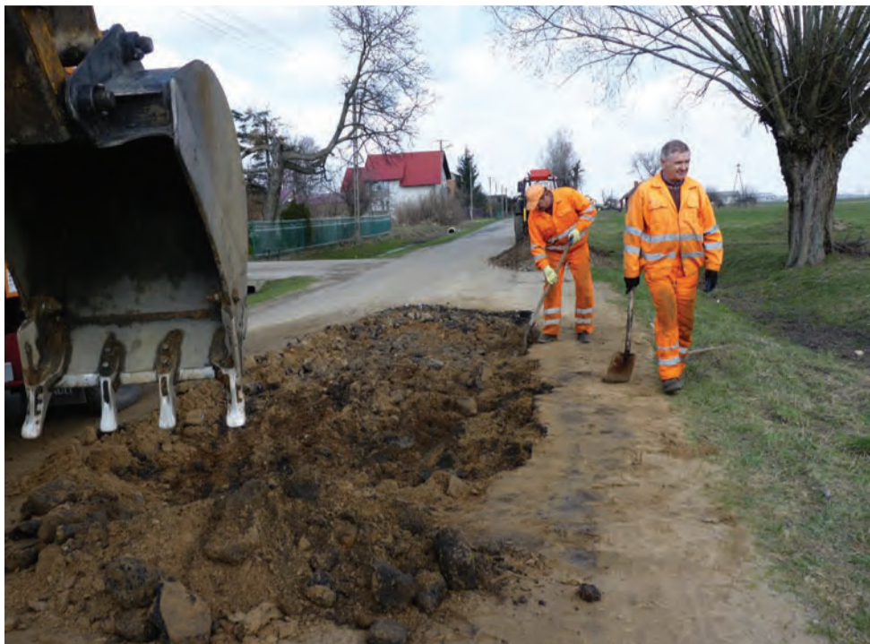
Ubytki w asfalcie są bardzo duże. Obecnie są one usuwane, uzupełniane nowym tłuczniem i utwardzane. Konieczne będzie położenie nowego asfaltu.