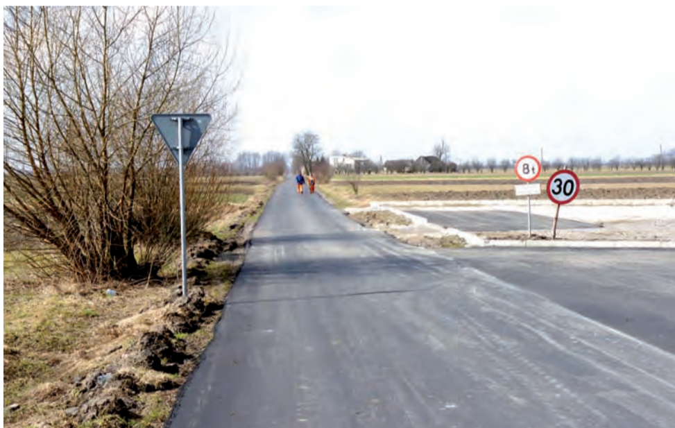
Po kilku miesiącach oczekiwania Drogbud dokończył nakładki na drogach. Tu droga Boczki – Sierzniki.

Gmina chce pozostawić radnym decyzję, które drogi będą naprawiane w pierwszej kolejności. To także wiąże się z wydatkami. Nie wiadomo, czy wystarczy pieniędzy zarezerwowanych w budżecie na bieżące utrzymanie dróg. tb