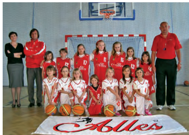
Drużyna TK Alles Główno, (sekcja w Lubiankowiu) liczy już ponad dwadzieścia zawodniczek.

Przyjazd na zawody do Lubiankowa zapowiedziały już