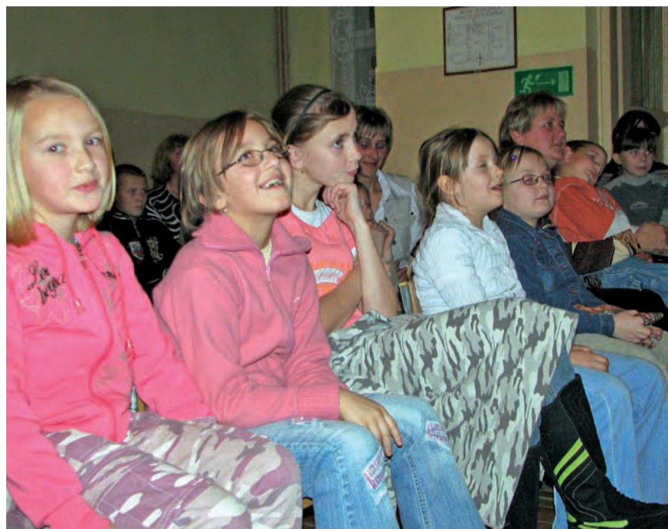
Tak wyglądała widownia w świetlicy w Barciku w czasie jednego z przedstawień, w grudniu w 2007 roku.