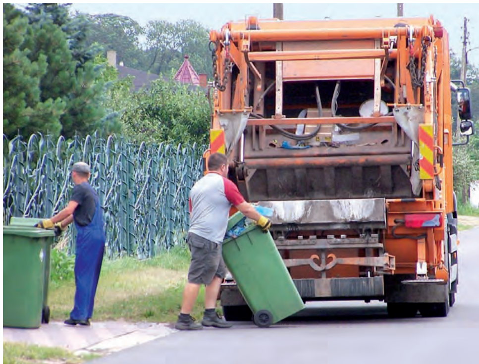
Czasy, kiedy mieszkańcy tylko wystawiali pojemniki za bramę, dobiegają końca. Teraz trzeba będzie płacić

O opinii w sprawie wprowadzenia od 1 sierpnia odpłatności za śmieci burmistrz Andrzej