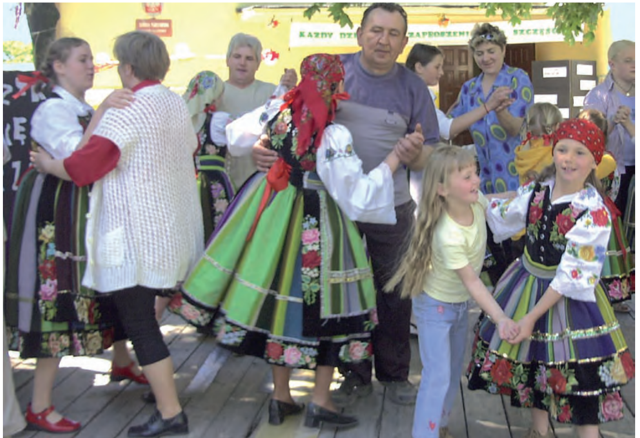
Tak było. Piknik rodzinny na terenie szkoły w 2004 roku. Deski ugięły się pod tańczącymi uczestnikami zabawy.

Wszyscy mają w pamięci choinki noworoczne, które odbywały się corocznie w naszych wiejskich domach ludowych. To naszym nauczycielom zawdzięczamy tyle emocji, radości i zachwyty, które towarzyszyły nam, gdy oglądaliśmy nasze pociechy w rolach księżniczek, Kopciuszków, gwiazd estrady. Wspaniale potrafili z tej niewielkiej liczby dzieci zrobić prawdziwych aktorów, konferansjerów, tancerzy czy piosenkarzy. Niejedną łza popłynęła naszym babciom i dziadkom zapraszanim corocznie w dniu ich święta. Z dumą