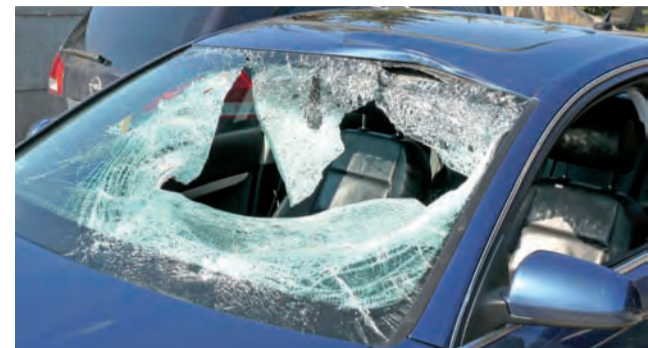
W audi zniszczona została szyba i wgnieciony dach. Zdjęcie sprzed roku.

Opinia biegłego z Gdańska nie usatysfakcjonowała prokuratora. Wniosła ona o dopuszczenie kolejnej opinii biegłego z zakresu ruchu drogowego, ponieważ zeznający biegły wykazali według niej zbyt dużą rozbieżność w ocenie prędkości, z którą poruszał się oskarżony. Wniosek został jednak przez sąd odda-