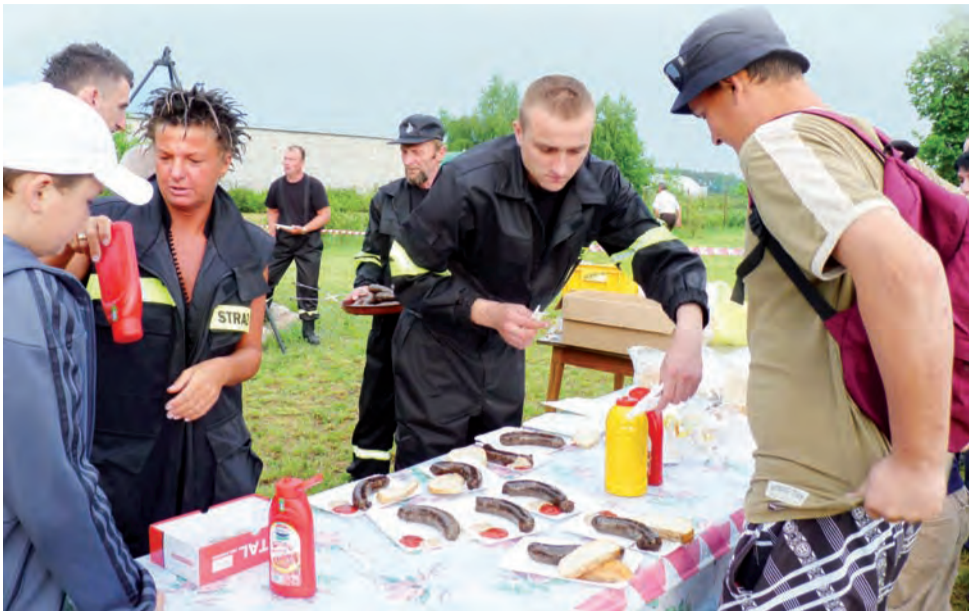
Strażackie przysmaki. OSP Bratoszewice serwowała kaszankę z ruszku.