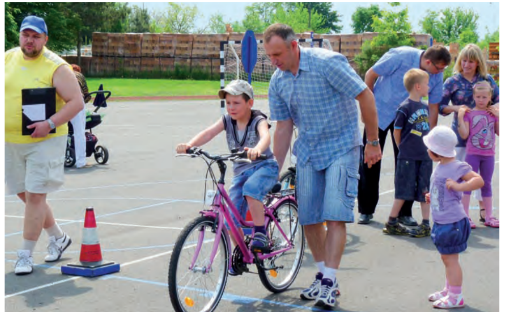
Rodzinne konkursy na szkolnym boisku zorganizowało Stowarzyszenie Przyjaciół Bratoszewic.