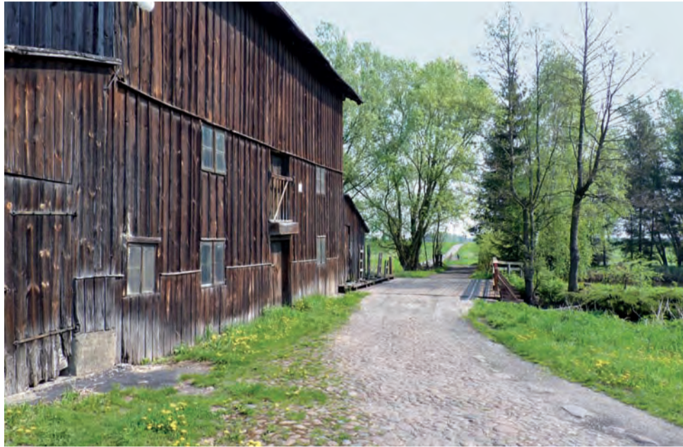
Dojazd do gminnego mostu przez działkę Zygmunta Marksa.

Ustalono, że gmina wydzierżawi od Zygmunta Marksa dojazd do mostu na Mrodze, czyli działkę o pow. ok 6 arów za 3.200 zł brutto na rok. O konfliktowej sytuacji pisaliśmy w nr 19 Wieści. Przypominamy, że pierwsza propozycja ze strony właściciela opiewała na 1.000 zł na miesiąc, a wójt proponował 1.000 zł na rok, przy czym najbardziej zależało mu na wyku-