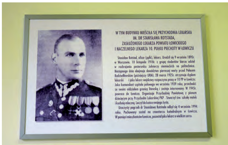
W Centrum Promocji przychodnia im. Stanisława Rotstada została upamiętniona tablicą wykonaną z PCV. Jest ona umieszczona w holu, tuż przy głównym wejściu do budynku.

Ponieważ jednak elewacja tego budynku ma być remontowana, to montaż tablicy odłożony zostanie do czasu tego remontu. – Chodzi o to, aby jej