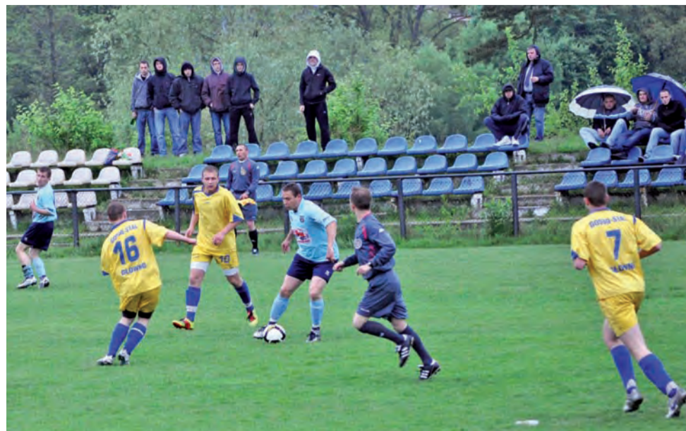
Stal znów zagrała bardzo dobry mecz, ale podobnie jak w spotkaniu z Włóknierzem Pabianice nie zdobyła nawet punktu.