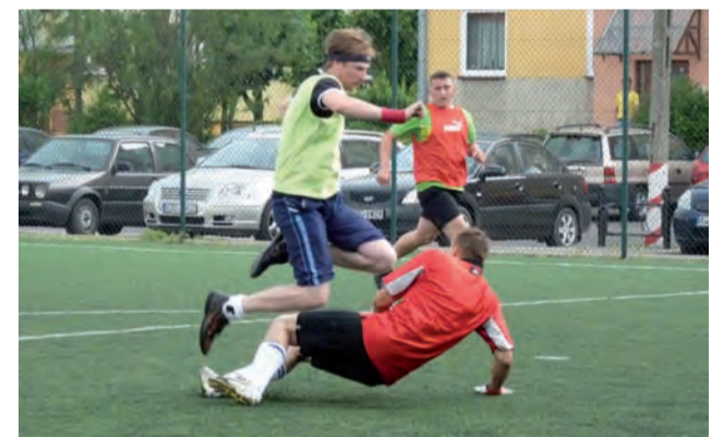
W amatorskim turnieju piłki nożnej 6-osobowej zwyciężyła drużyna Perfectu