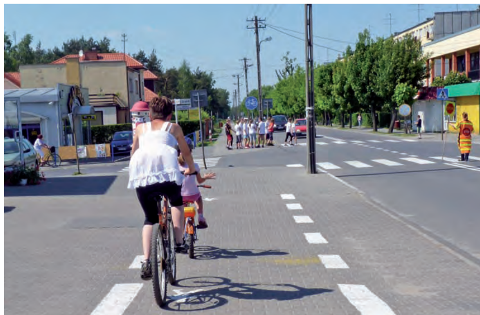
Na ul. Sikorskiego, Szkolnej, Piątkowskiej i Kopernika, w sąsiedztwie sklepów, pojawiły się linie oddzielające pas chodnika od parkingów.

nego mechanicznie – tj. przy użyciu specjalistycznej maszyny – miasto zapłaci zgierskiej firmie 11,68 zł brutto. Ponadto firma ta zajmie się także uzupełnianiem i wymianą zniszczonego oznakowania pionowego na głowieńskich ulicach. rpm