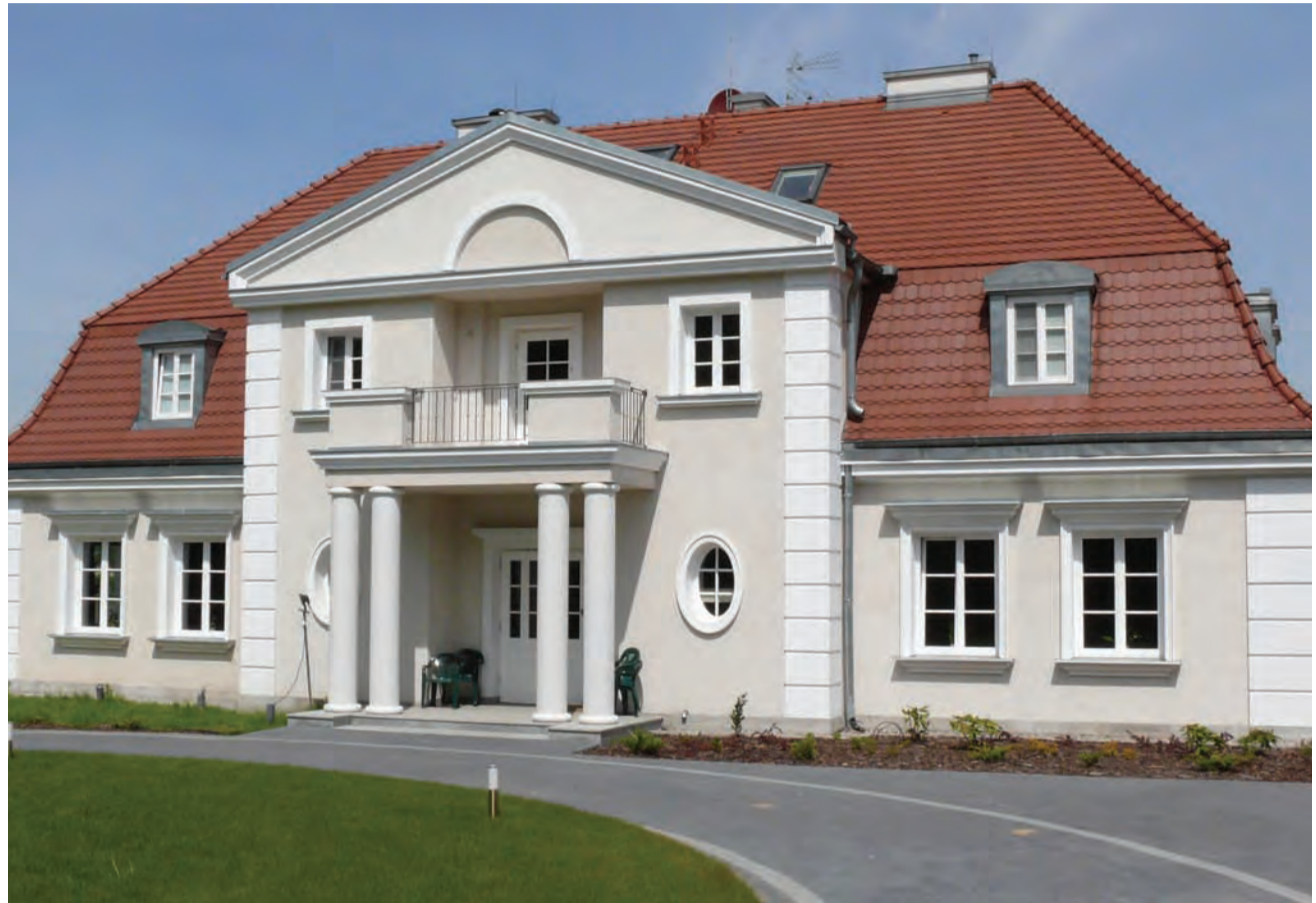
Widok na front budynku Hotelu Eco w Piaskach pod Nieborowem od strony zwartej kompleksu leśnego.

Główny budynek przypomina staropolski dwór, z wysokim użytkowym poddaszem i charakterystycznym dachem, a budynek obok wyglądem nawiązuje do spichlerza. Właściciel hotelu, Janusz Mostowski,