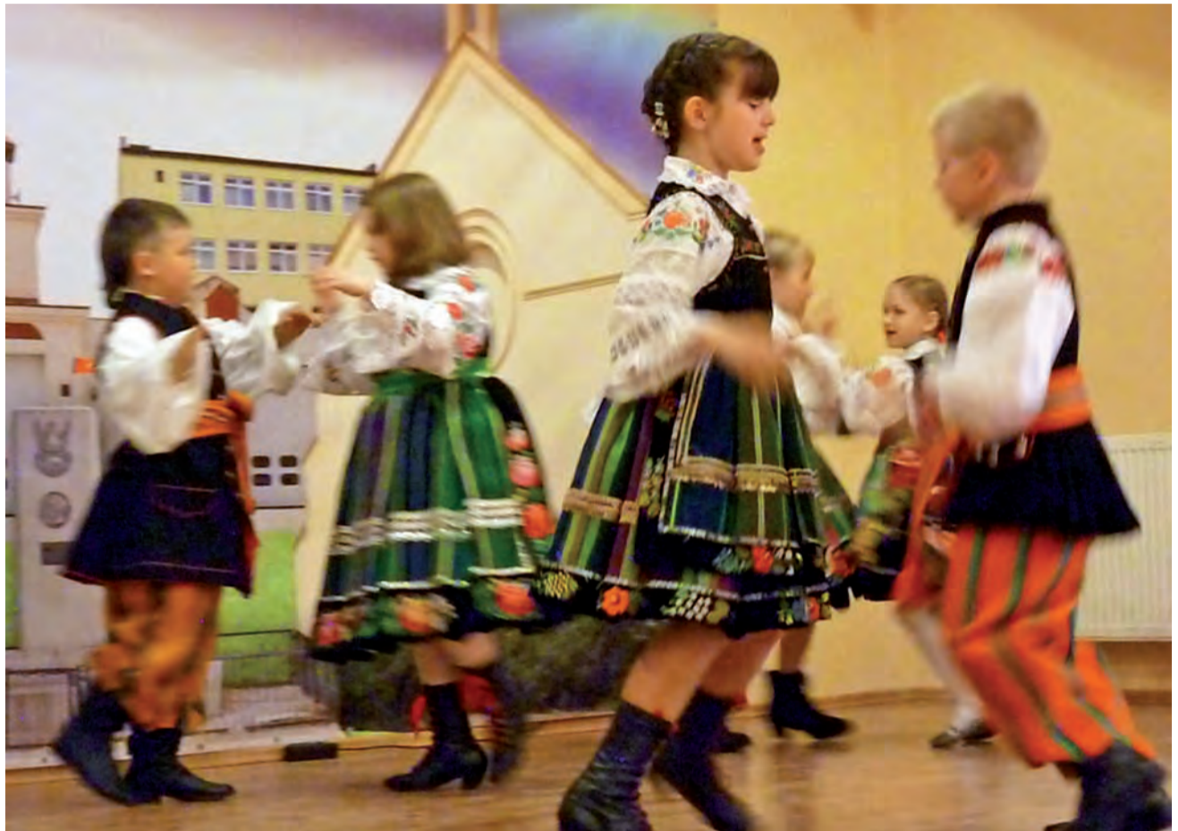
Na ludową nutę. Występ zespołu Księżaki.

Po 1975 r. dokonano zmiany nazwy Kasy na Bank Spółdzielczy w Łyszkowicach. W 1999 r., mając na względzie możliwość jak najlepszego zaspokajania potrzeb klientów, działacze samorządów ówczes-