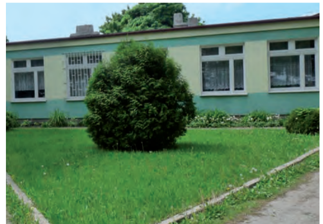
Tak jest. Budynek zostanie, ale Szkoła Podstawowa w Gaju Wojewodzy przestanie niebawem istnieć.

wicemistrzostwo województwa w unihokeju w 2005 roku. Tych sukcesów, nie sposób wszystkich wymienić. Było ich tak wiele, a wszystko to świadczy o wspaniałej pracy i zaangażowaniu nauczycieli naszej szkoły. Traktując uczniów indywidualnie, wyszukiwali w nich ukryte talenty i dopomagali je rozwijać.