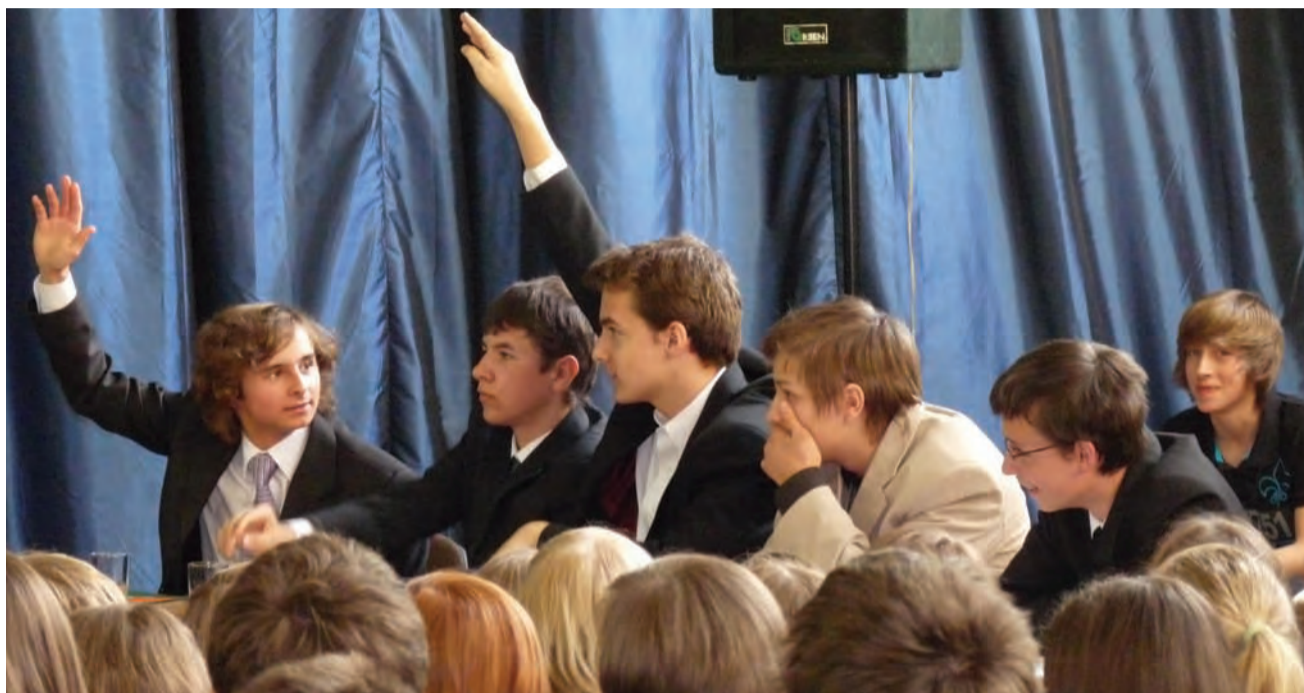
Debata oksfordzka. Większość słuchaczy poparła argumenty opozycji.