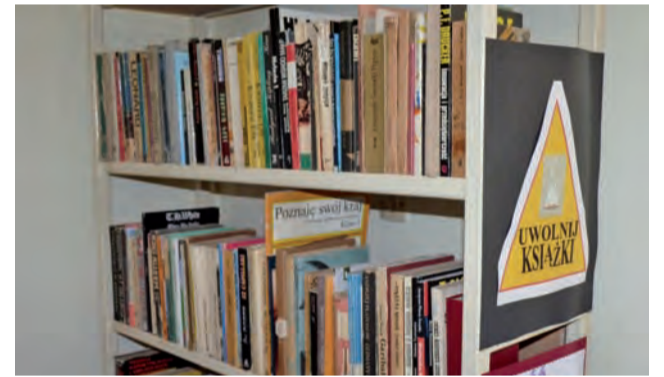
Na regał, znajdujący się w holu, można przynieść niepotrzebne woluminy.