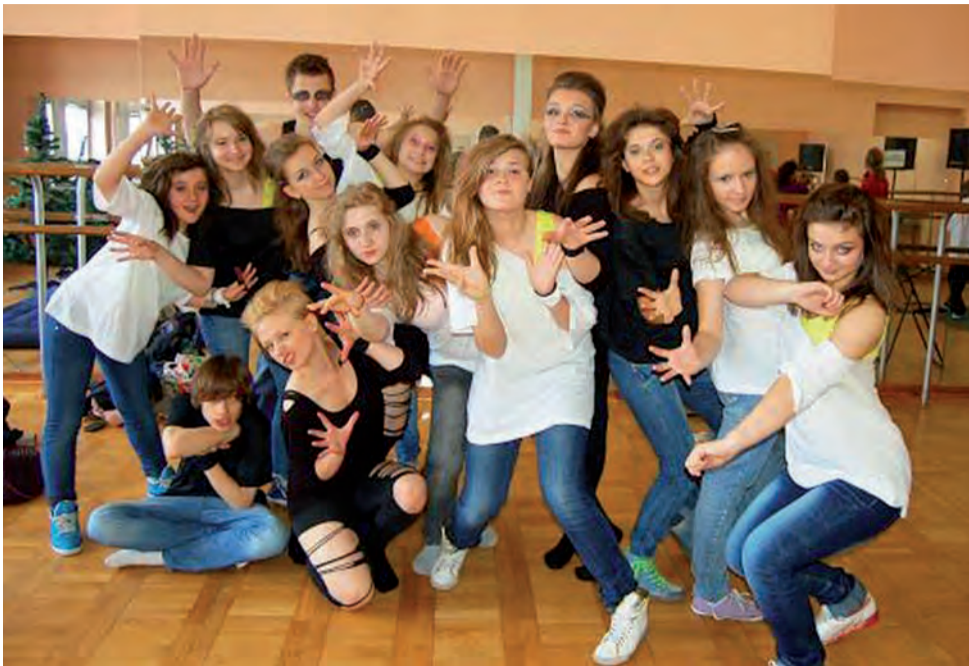
Tak prezentuje się grupa taneczna Europa XXI z Gimnazjum nr 2