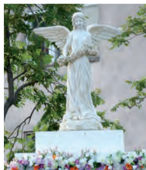
Pod aniołem. Przydrożną kapliczkę wieńczy subtelną figurką anioła z naręczem róż.