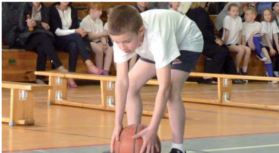
W zawodach liczyła się szybkość i poprawność wykonywania ćwiczeń. Jednym z zadań był rzut piłką.

publicznej. Dyrektor szpitala ma nadzieję, że nastąpi to jeszcze w tym roku. mwk