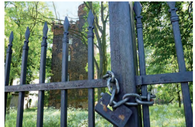
Basztę Klickiego przez dłuższy czas można było podziwiać jedynie przez zamkniętą bramę. Miasto liczy, że teraz obiekt ożyje.