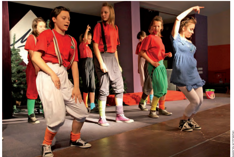
Trzy po trzy podczas skierniewickich konfrontacji ują jurorów pomysłem na połączenie teatru z tańcem..

Łowicz/Skierniewice | II Międzyszkolne Konfrontacje Taneczne