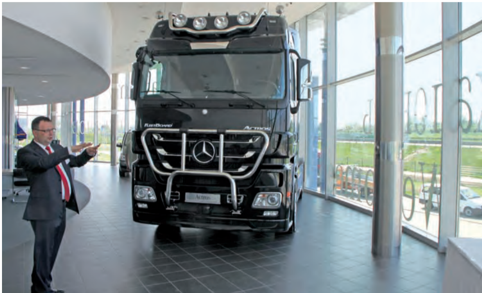
Wiceprezes Diesel-Truck Mariusz Mozol oraz pokazowy egzemplarz Actrosa wystawiony w salonie na I piętrze.

Obecnie pracuje tu 61 osób, z których 50 to zupełnie nowi pracownicy, a pozostali to doświadczona kadra z centrali w Oltarzewie. Docelowo załoga samego serwisu ma liczyć 125 osób. – Mówiąc szczerze, liczyliśmy na większą podaż pracowników w tym regionie.