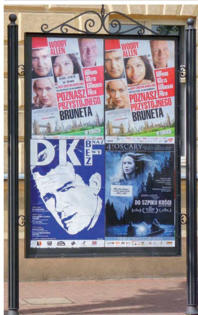
Nowa tablica informacyjna od 2 tygodni stoi przed Łowickim Ośrodkiem Kultury przy ul. Podrzecznej. Mieszczą się w niej 4 duże filmowe plakaty, o wiele lepiej teraz widoczne niż wtedy, kiedy mieściły się na mniejszej tablicy zawieszanej na ścianie budynku. Nowy zakup kosztował ŁOK 1.600 zł. jr