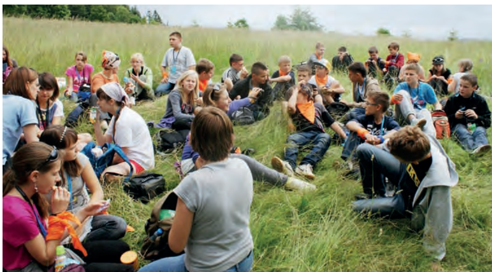
Jedna z nielicznych chwil spędzonych na świeżym powietrzu. Choć po deszczowych chmurach na niebie można wnioskować, że nie trwała ona zbyt długo.