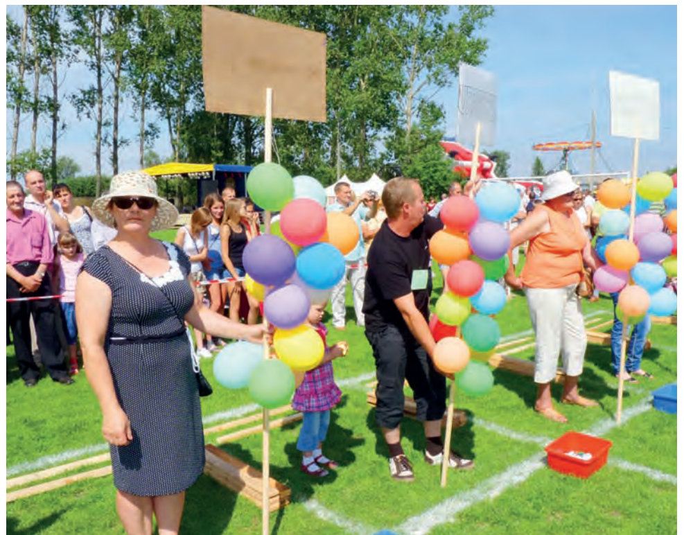
Te kolorowe baloniki dzieci biorące udział w rywalizacji wiosek musiały przebić, aby wrócić na linię startu z nakrętkami.