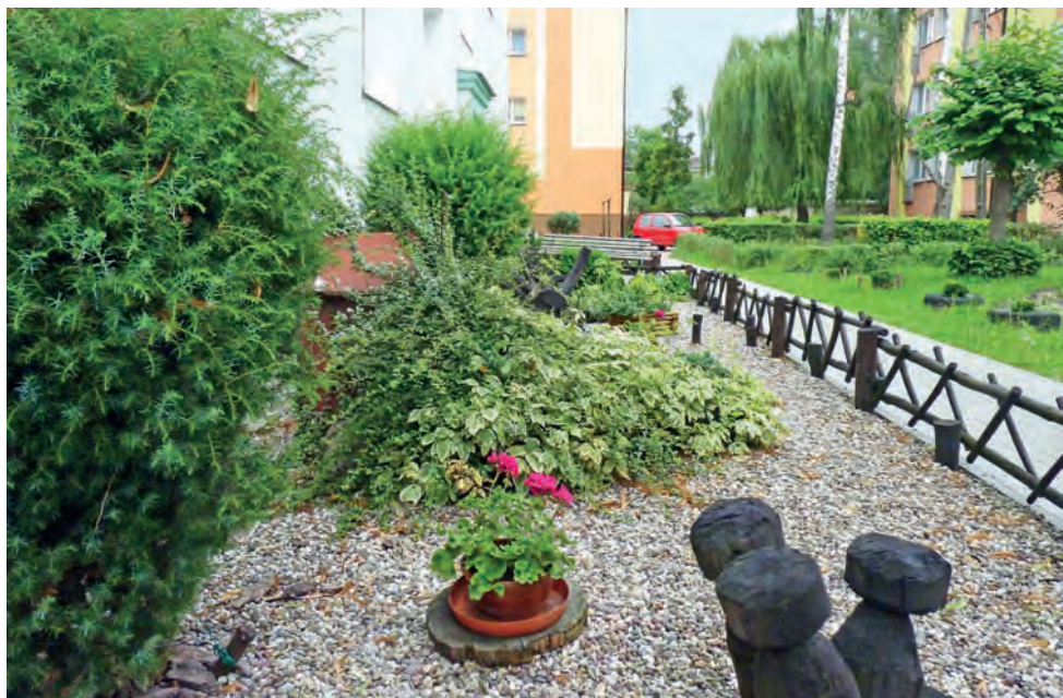
Ogród przed blokiem na ul. Kostka jest cały zagospodarowany. Mieszkańcy sadzą teraz rośliny od strony ulicy.