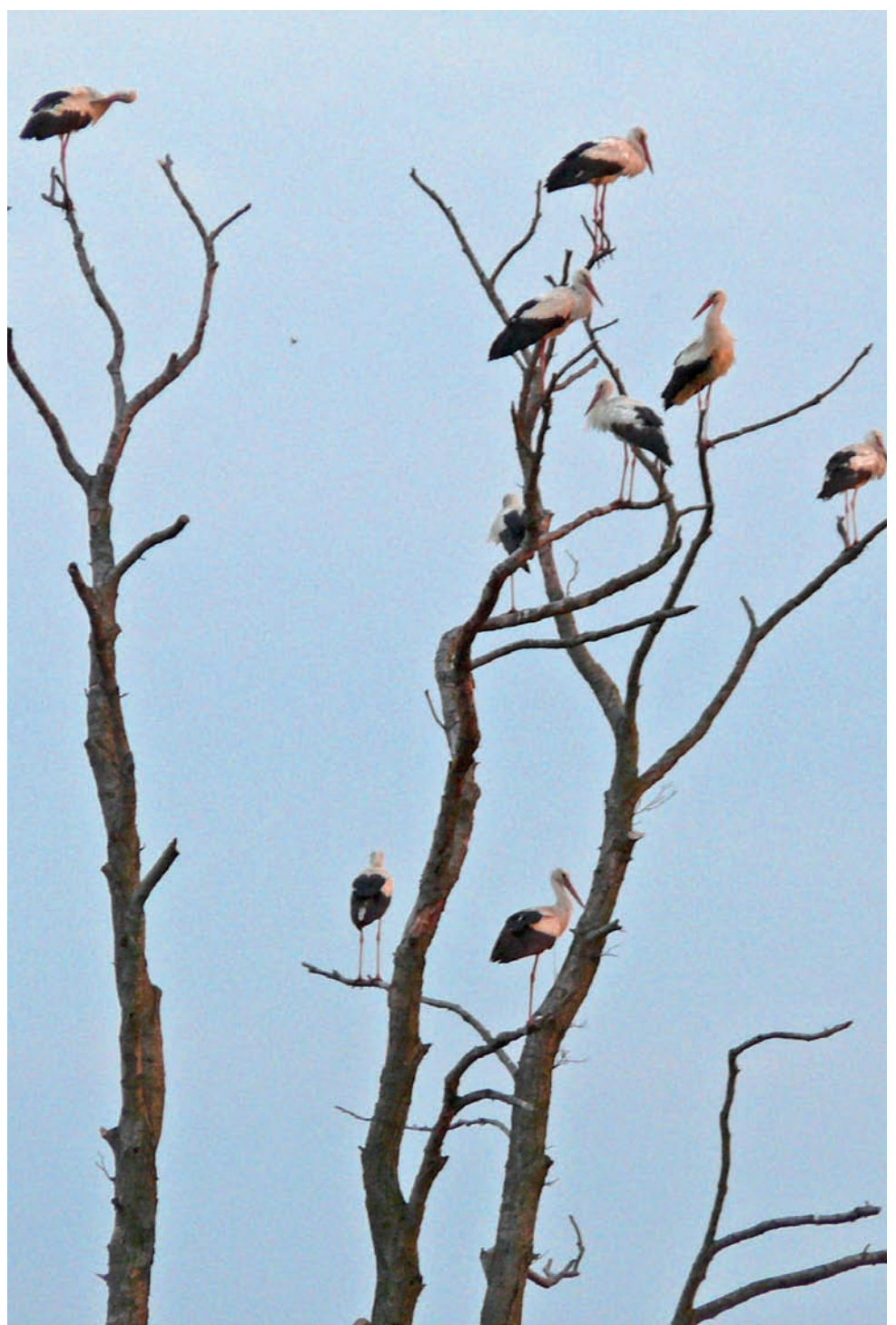
Jest lipiec. Okres lęgowy ptaków, w tym bocianów, dobiega końca, a na ławkach nad Bzurą w okolicy Bednar tuż przed zachodem słońca grupa ponad 20 bocianów zlatuje się na uschnięte olchy. Ptaki wcześniej żerują na świeżo skoszonych ławkach, zjadają się owadami i gryzoniami. Czasem szukają zdobyczy, nie przejmując się w ogóle towarzystwem pracujących w pocie czoła rolników. tb