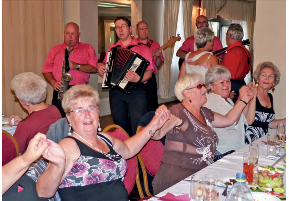
Seniorzy bawili się w Nieborowie i na parkiecie, i przy stołach. Grał dla nich zespół Progress.

Biesiada, do której grał łowicko-belchowski zespół Progress, trwała od godz. 15 do 23. mwk