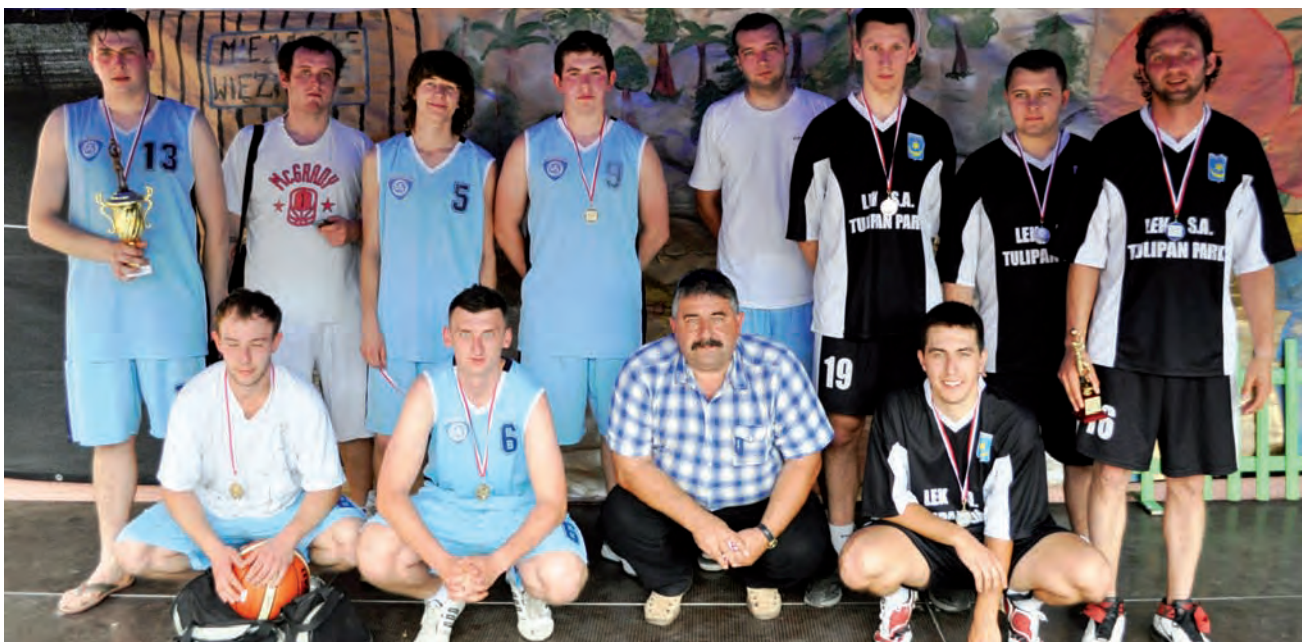
Koszykarze Bratoszewickiego Klubu Sportowego, którzy wcześniej rozgrywali swoje mecze, jako Lalalilo Bratoszewice, od kilku lat osiągają sukcesy w Amatorskiej Lidze Koszykówki w Głownie. Być może już niedługo oficjalnie dołączy do nich strykowski LUKS „Dwójka” (czarne stroje).

Swojego czasu LUKS toczył z BKS równorzędną walkę, więc jeśliby wziąć się za treningi na trochę bardziej poważnie, to sam Stryków także mógłby mieć klub, który odnosi sukcesy w tej dziedzinie sportu. Trenować jest gdzie, bo w lecie można przecież grać na Orliku, a zimą korzystać z hali Zespołu Szkół nr 1 w Strykowie. Pomysł jest dobry, warunki aby go spełnić w zasadzie prawie spełnione. Prawie, bo obok miejsca i odpowiedniego zaplecza i finansowego i sportowego potrzebni są przecież zawodnicy. Wiadomo już, że kilku chętnych jest gotowych do gry, ale żeby móc rywalizować z najlepszymi to oprócz szóstki na