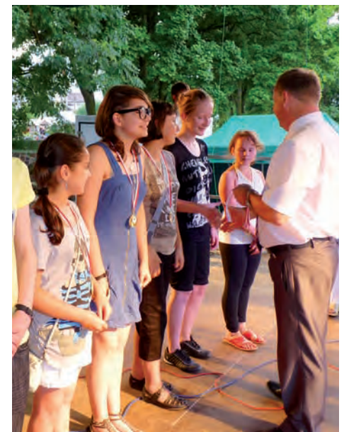
Drużyna dziewcząt, która wygrała konkurs przeciągania liny wśród młodzieży młodszej.