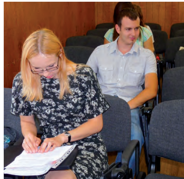
Jeszcze tylko ostatnie przejrzenie notatek przed egzaminem z wiedzy o kulturze Wielkiej Brytanii i za chwilę rozpocznie się test.

Co było najtrudniejsze dla pierwszoroczników? O dziwo, nie pisemny egzamin z gramatyki opisowej trwający ponad godzinę czy egzamin z pisania i praktyki języka, które trwały po 1,5 godziny, ale ustny egzamin z historii Wielkiej Brytanii. Wykłady w języku angielskim, a potem nauka z notatek i anglojęzycznych podręczników, sprawiła najwięcej trudności młodym studentom. jr