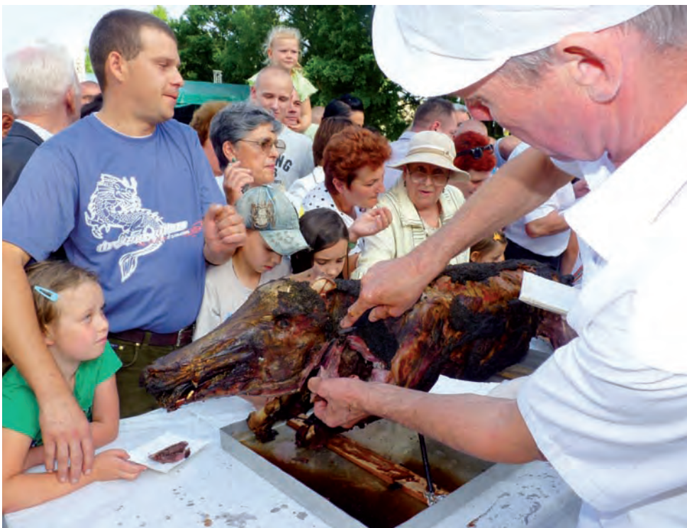
Pieczone dziki dzielono na porcje ok. godz. 18.30. Kolejka ustawiła się już pół godziny wcześniej.