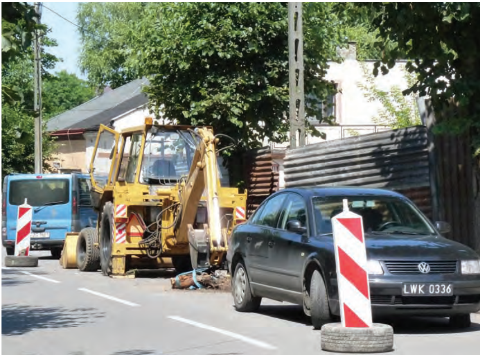
Utrudnienia na Bielawskiej. W związku z pracami budowlanymi prowadzonymi na prywatnej już działce po byłym komisariacie, miejscowo zajęty był jeden pas ruchu.