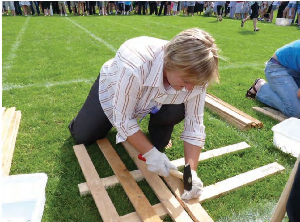
Panie w turnieju wsi przybijały drewniane sztachety do płotu. Zadanie trzeba było wykonywać w ochronnych rękawiczkach.