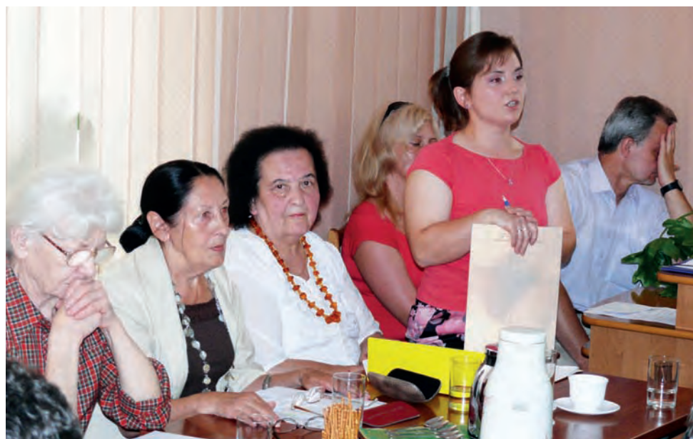
Mieszkańcy gminy Sanniki, którzy nie godzą się na instalację pirolizy w Szkaradzie, mówią: – Nie chcemy, by na nas eksperymentowano.

Zwrócono też uwagę, że często to, co jest na papierze – bo z dokumentacji wynika, że instalacja będzie bezpieczna – daleko odbiega od praktyki. W dokumentacji instalacji jest mowa