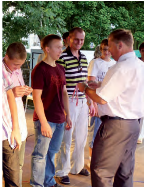
Młodzież starsza, która zajęła I miejsce w konkursie przeciągania liny.