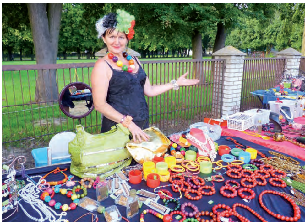
Odpustowe stoiska rozstawione przy osiedlu Walewskiej. U tej skierniewiczanki panie chętnie kupowały drewniane ozdoby - bransoletki, korale itp.