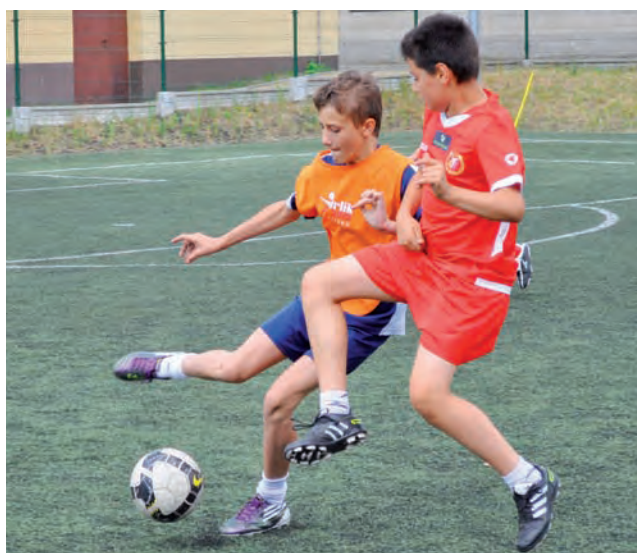
To był trudny sezon dla Zjednoczonych Stryków w Łódzkiej Klasie Deyna, ale podopieczni trenera Fortuny w każdym meczu dawali z siebie wszystko.

W całym sezonie gracze Strykowa zdobyli 20 punktów. To z pewnością nie jest wynik za-