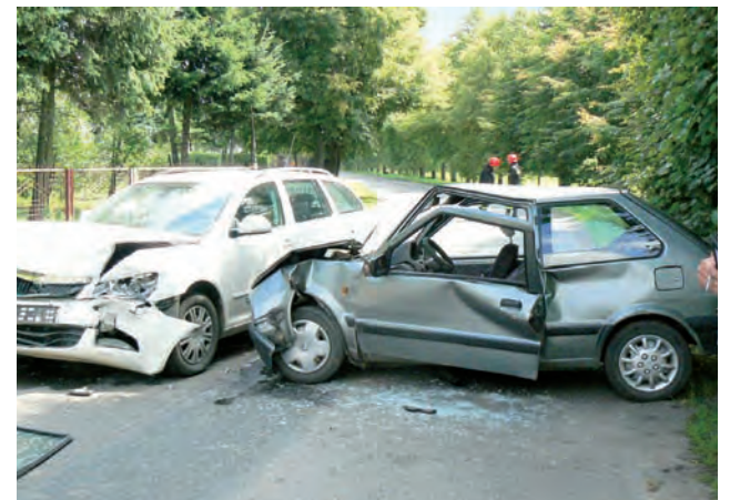
Łuk drogi powiatowej w Rudniczku przy obecnym natężeniu ruchu należy do jednych z bardziej niebezpiecznych. Tym razem przyczyną wypadku była jednak nie prędkość, a nieuwaga kierowcy.

W wyniku wypadku do szpitali w Brzezinach i Zgierzu ze złamaniami kończyn oraz ogólnymi potłuczeniami trafiły cztery osoby z Nissana. Z powodu wypadku droga w Rudniczku przez jakiś czas była zablokowana. Na miejscu, oprócz karettek i policji, pojawiła się również straż pożarna, która usuwała skutki zdarzenia. ljs