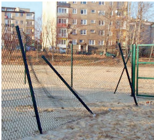
Zniszczone ogrodzenie przy zalewie w Głownie.

Osoby, które widziały ewentualnych sprawców, proszone są o kontakt z Urzędem Miejskim w Głownie pod numerem tele-