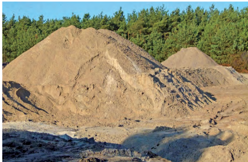
W pobliżu skansenu powstaje staw. Właściciel terenu przy okazji chce zarobić na pozyskiwanym tu piasku.