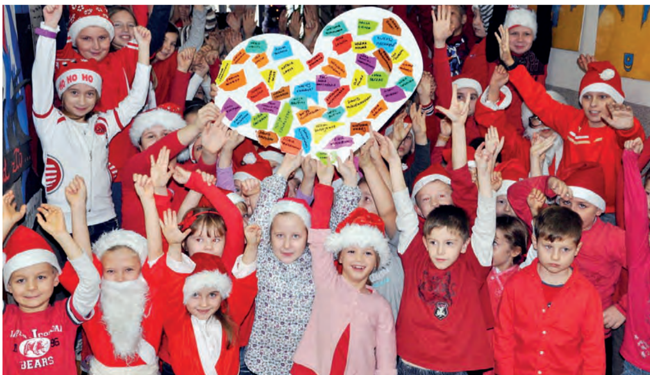
Czy ktoś widział na raz tylu Mikołajów?