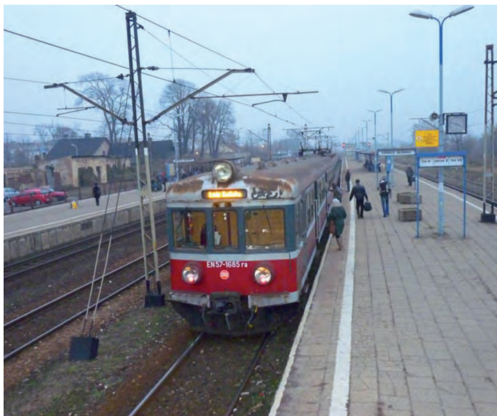
Pociągów z Łowicza Głównego do Łodzi nadal odjeżdża tylko 6 w ciągu doby.

Przed zmianą rozkładu jazdy do Skierniewic było 14 po-