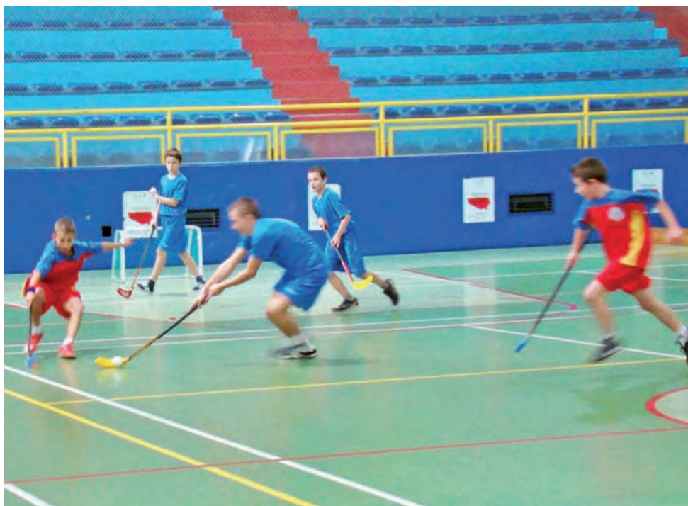
Rywalizacja podczas mistrzostw powiatu zgierskiego tradycyjnie była zacięta i widowiskowa.

Zawodnicy, reprezentujący strykowską „jedenkę” turniej rozpoczęli niezwykle optymistycznie. Strykowiakom udało się bowiem, jak się potem okazało, mistrzów powiatu zgierską „Jedenastkę” 1:0! W drugim swoim występie strykowscy uczniowie zremisowali 2:2 z SP Chociszew, by w trzecim meczu bezbramkowo także zremisować z Bełdowem. Niestety mecz z repre-