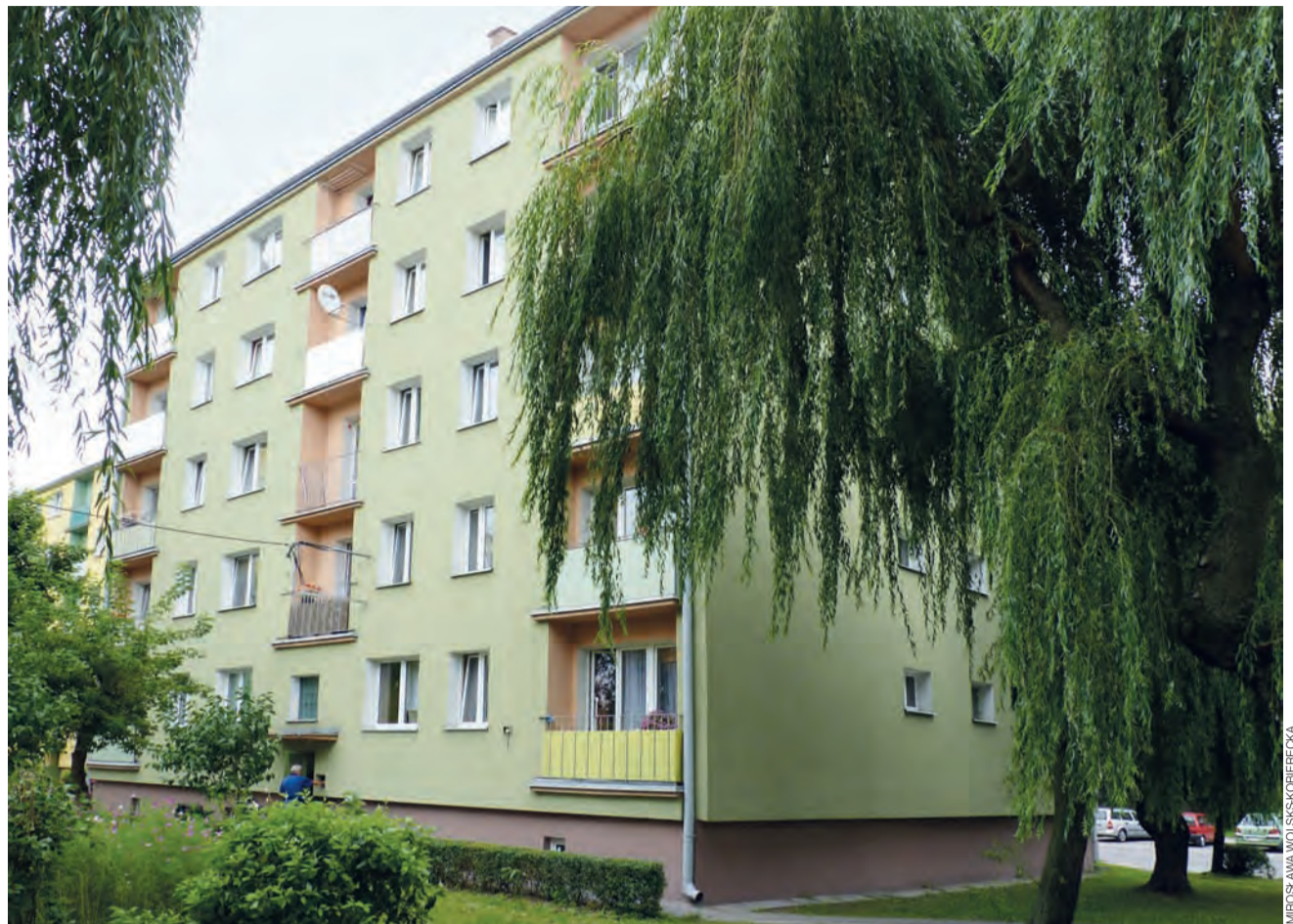
Decydując się na zakup mieszkania, warto wziąć pod uwagę nie tylko wygląd zewnętrzny bloku i osiedla, piętro, ilość pokoi i cenę, ale też czynsz. Jak się okazuje, różnice w opłatach w Łowiczu są bardzo wysokie. A to stałe obciążenie każdego domowego budżetu.

jaką temperaturę chcą mieć w mieszkaniu, ale też od kiedy chcą mieć ciepłe kaloryfery. Centralne ogrzewanie można włączyć w dowolnym miesiącu.