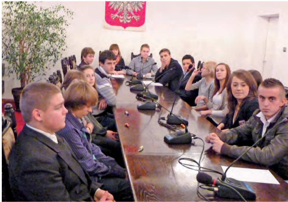
Członkowie Młodzieżowej Rady Miejskiej w Głownie w trakcie jej II sesji.

Następnym punktem obrad był wybór członków do 3 ko-