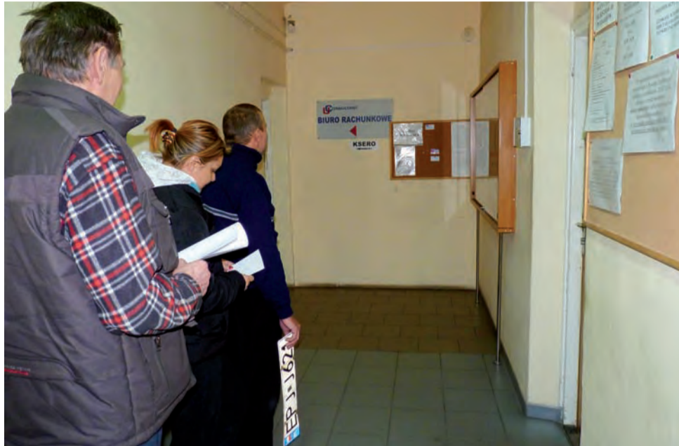
Władze Głowna chciałyby, aby klienci wydziału komunikacji obsługiwani byli znów przy ul. Sikorskiego. Dziś muszą jeździć do Zgierza.

Władze Głowna mówią tej propozycji – tak. – W zarysie wiemy już, jak miałyby to wy-