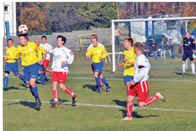
Stal Głowno pokazała, że potrafi grać jak równy z równym nawet z zespołem III ligi. Liczymy na podobną postawę głównian w rundzie wiosennej V ligi.

Przejdźmy jednak do samego meczu. Trener Stali mógł być dumny ze swoich piłkarzy, którzy na boisku dali sobie wszystko i wnieśli się na