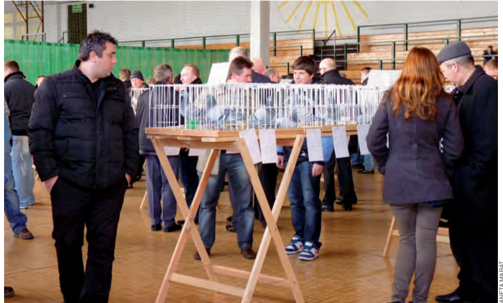
W niedzielę wystawę gołębi obejrzało bardzo wiele osób. Wśród nich byli młodzi i starzy. Pojawili się również kilka kobiet które podziwiali gołębie.

Wszystkie ptaki uszeregowane są w klasach, w zależności od lotów, jakie wykonują. I tak mamy loty krótkodystansowe, a więc od 100 do 400 km, śred-