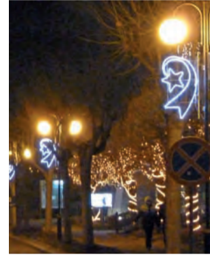
Oświetlenie na ul. Młynarskiej w Głownie jest takie samo jak przed rokiem.

Na pytanie, ile kosztuje oświetlenie miasta na święta, ani w Urzędzie Miejskim w Głownie, ani w Urzędzie Miasta-Gminy Stryków nie otrzymaliśmy jednoznacznej odpowiedzi. Urzędnicy tłumaczą, że nie da się tego tak łatwo wyodrębnić z całości kosztów ponoszonych na oświetlenie uliczne. – Mogę natomiast zapewnić, że oświetlenie ledowe jest o tyle lepsze od tradycyjnego, że zużywa 5 razy mniej energii, a co więcej nie emituje do środowiska tyle