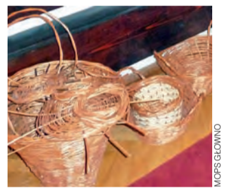
Podczas zajęć niepełnosprawni uczyli się m.in. wyplatać koszyki z wikliny.

wiskowym Domu Samopomocy. W pełni sprawni bezrobotni uczestniczyli natomiast wcześniej w kursach przysposabiających do pracy w charakterze pracownika biurowego oraz magazyniera z uprawnieniami na wózki widłowe. Mieli ponadto spotkania z doradcami zawodowymi oraz zajęcia warsztatowe, na których trenowali elementy rozmowy kwalifikacyjnej, nabierali pewności siebie i uczyli się autoprezentacji. Ostatni, trwający 5 dni po 6 godzin trening kompetencji i umiejętności społecznych odbył się pod koniec listopada w sali Zespołu Szkół nr 1 w Głownie.