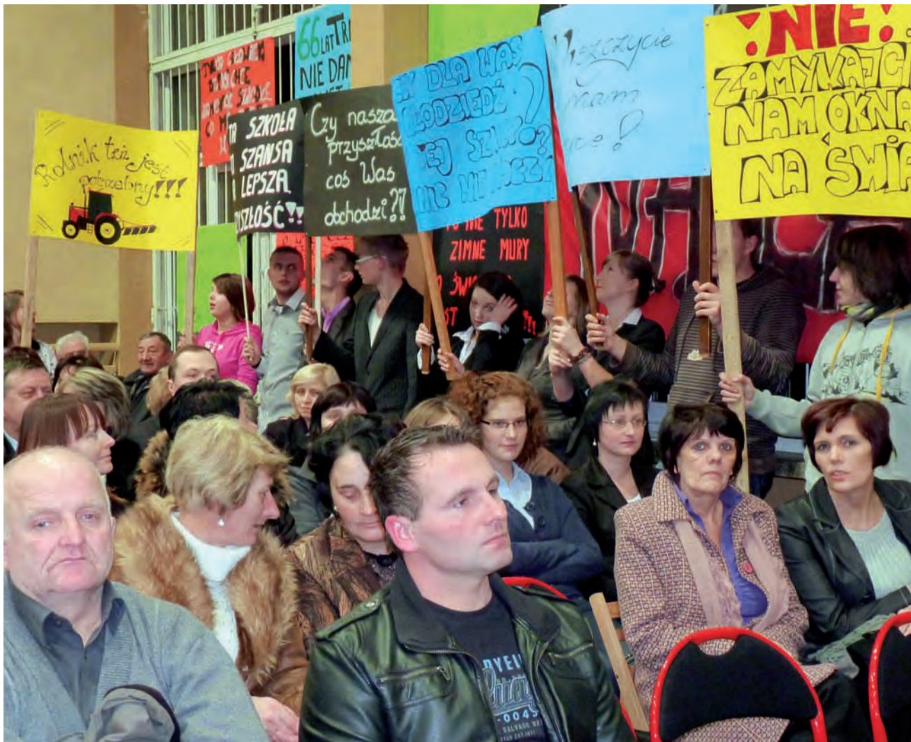
Uczniowie przygotowali transparenty, rodzice – pytania. Na sali panowała pełna mobilizacja sit.