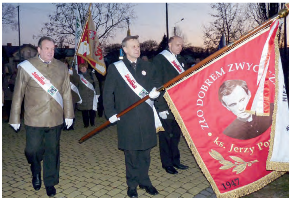
Na skwerze Solidarność w Łowiczu pojawili się m.in. przedstawiciele Solidarności z Łodzi wraz z pocztym sztandarowym.

13 grudnia kardynał Glemp wybierał się na spotkanie z młodzieżą na Jasnej Górze. O godz. 5.30 przybyło do niego trzech mężczyzn od generała Jaruzelskiego. Oznajmili mu, że za pół godziny będą wyłączone wszystkie telefony, rozgłośnie i że generał ogłosił stan wojenny. Z taką wiadomością wyjechał na Jasną Górę. – Jechałem w silny mróz, na ulicach stały czołgi, uzbrojeni żołnierze, ale nikt mnie nie kontrolował – wspominał. Dopiero w Częstochowie odczuł wrażliwość ludzką. – Ile nerwów, ile