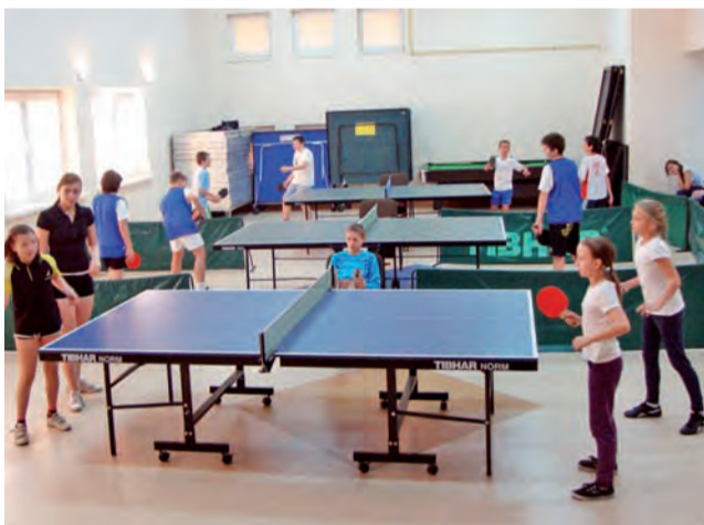
W sali Domu Kultury w Niesułkowie odbyły się mistrzostwa Gminy Stryków w tenisie stołowym.

W kategorii dziewcząt najlepszą drużyną okazały się tenisistki Szkoły Podstawowej z Koźla. Mistrzynie gminy Stryków najpierw bez trudu pokonały zespoły z Dobrej i Niesułkowa, wygrywając 3:0, by w meczu ze Szkołą Podstawową nr 2 ze Strykowa wygrać 3:1. Druga lokata przypadła uczennicom Szkoły Podstawowej z Niesułkowa, któ-