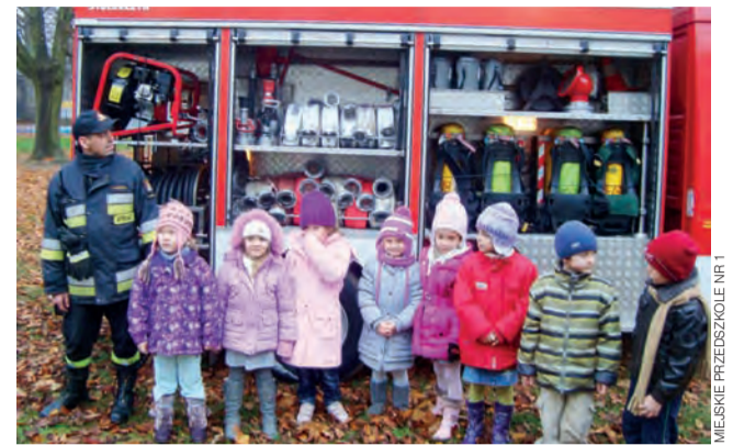
Wóz strażacki zafascynował dzieci swoim wyposażeniem.

W celu uniknięcia lub przynajmniej ograniczenia pomówień w stosunku do urzędników, burmistrz Janeczek zapowiada, że jeśli będzie taka potrzeba w urzędzie wprowadzony zostanie też system nagrywania rozmów telefonicznych. kl