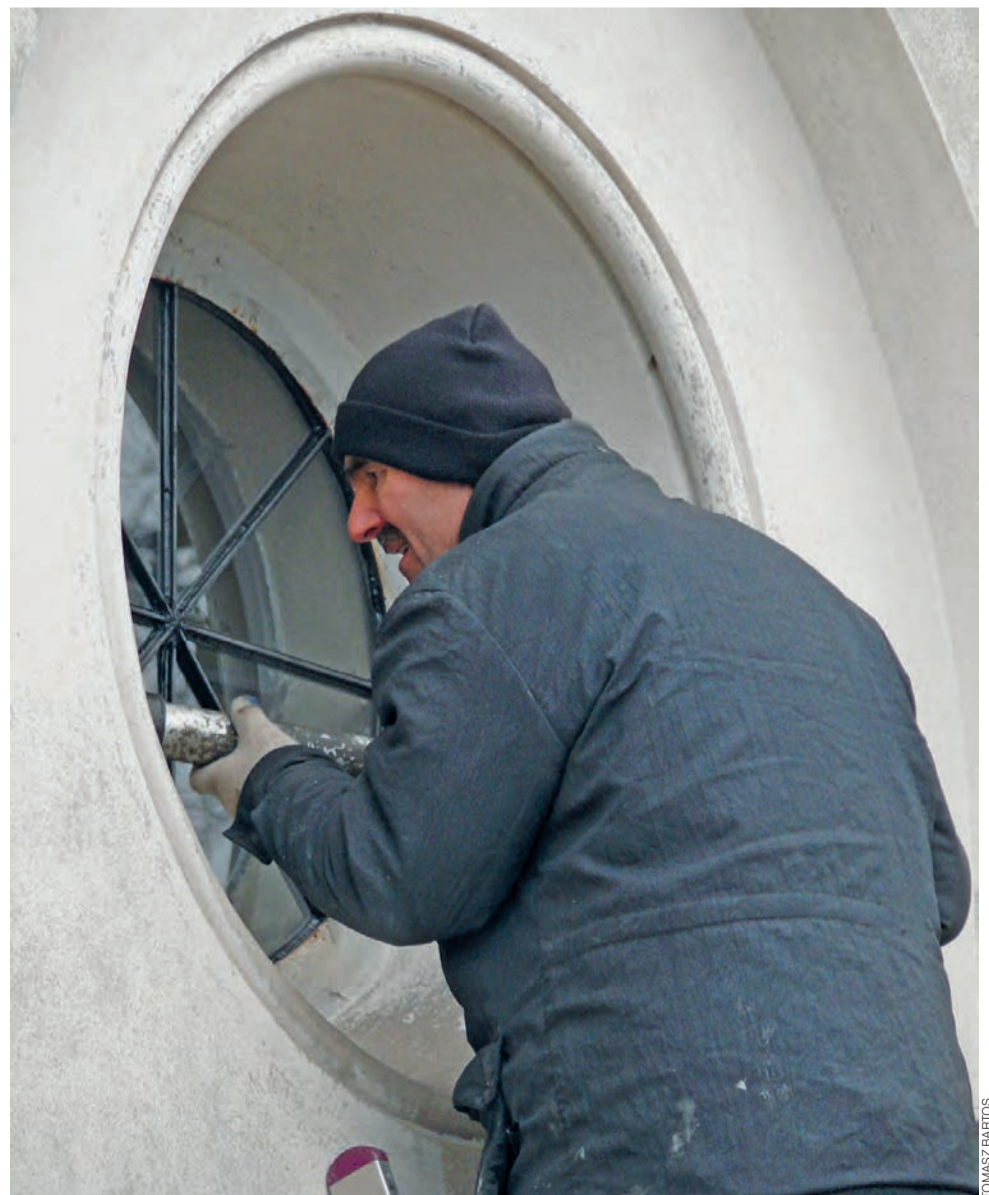
Nowe szyby zostały przymocowane do stalowych ram za pomocą silikonu, który zastąpił stary kit.

Podczas ponownego mocowania szyb do ram używany jest nie tradycyjny kit, ale silikon, elastyczny i odporny na czynniki zewnętrzne, zmiany temperatury, nasłanianie promieniami