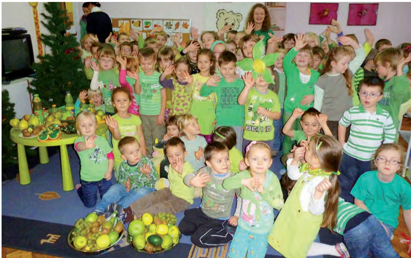
Z okazji uczestnictwa w programie Kubusiowi Przyjaciele Natury 5 grudnia w MP 1 w Głownie obchodzono Zielony Dzień. Większość dzieci ubrała się w tym dniu w zielone stroje. Rozmawiano z dziećmi na temat dbania o środowisko. Miłym akcentem była także możliwość spróbowania zielonych owoców i warzyw. Podczas Zielonego Dnia dzieci ubierały także choinkę, którą dekorowały ozdobami z materiałów ekologicznych. opr. kl