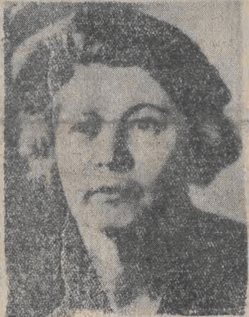
Min. Anna Pauker

Węgierskiej Molnara, ministra spraw zagranicznych Federacyjnej Republiki Jugosławii Simica, ministra spraw zagranicznych Republiki Czechosłowackiej Clementisa, ministra spraw zagranicznych Ludowej Republiki Ru-