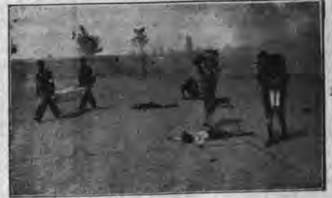
Dzieci szkolne na N. Rokiciu w akcji ratowniczej.