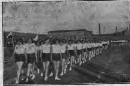
Defilada hufców żeńskich,