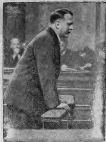
Terorysta Sylwester Matuszka, sprawca strasznych katastrof kolejowych, wygłasza przed sądem wiedeńskim swe „ostatnie słowo“. Matuszka został skazany na 6 lat więzienia.