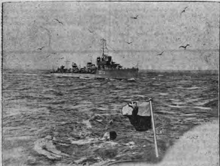
Do portu wojennego zawinęła eskadra wojenna floty angielskiej, złożona z 4 kontrtorpedowców. Dowódcą eskadry angielskiej kom. Boyd złożył wizytę dowódcy floty wojennej R.P. kom. Unrugowi, poczem kom. Unrug rewizytował go na kontrtorpedowcu „Wiwian”. Na zdjęciu widzimy kontrtorpedowca „Wiwian”.