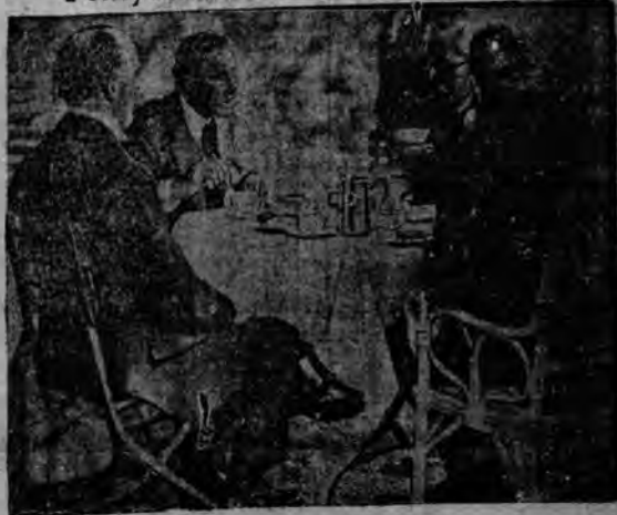
Kancelarz Rzeszy Pappen (drugi z lewej strony), angielski szef ministrów Macdonald (z prawa obok niego) minister spraw zewnętrznych Neurath i angielski minister handlu Runciman (na lewo).