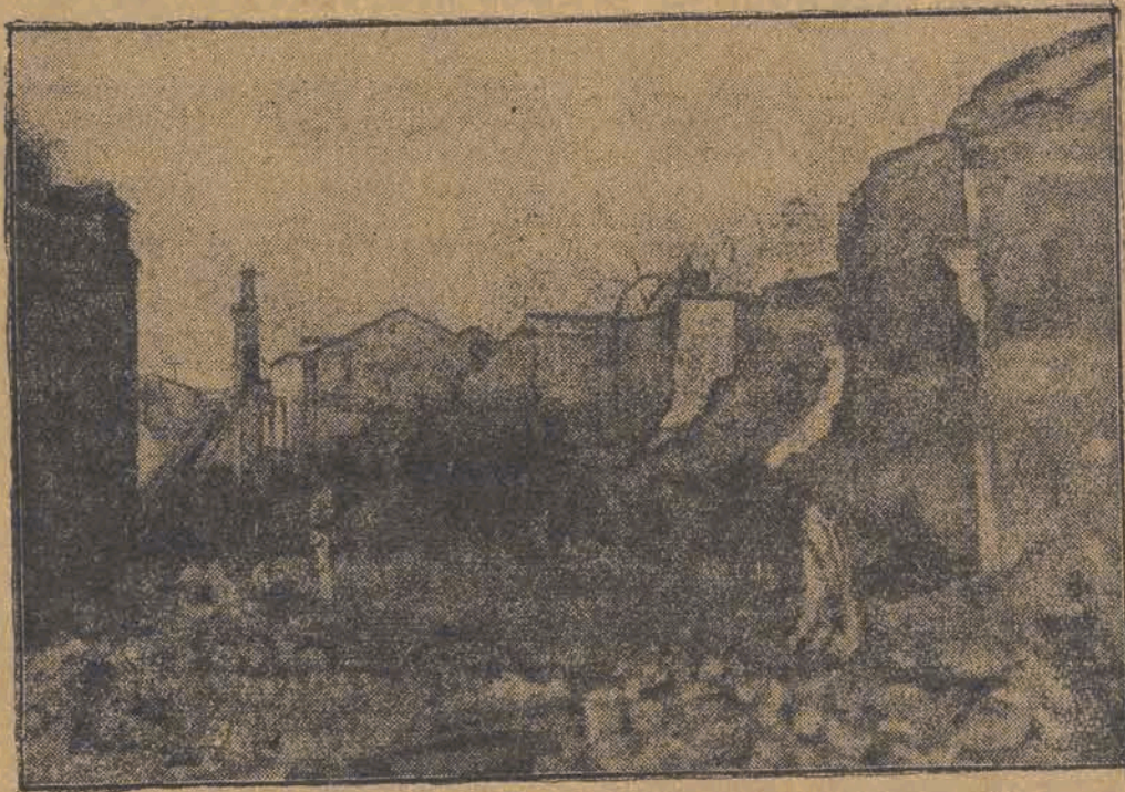
Skutki wojny domowej: zniszczone domostwa, trupy, nędza i nieszczęście.