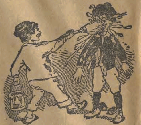
Do nabycia we wszystkich składach farb.

odznaczonych 4 nagrodami państwowymi, 22 medalami, a to: Lakierów emaljowych, lśniących, lakierów podłogowych o pięknym połysku i niebywalej trwałości.