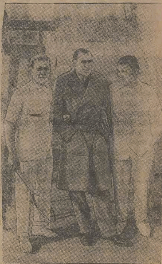
Trzej mistrzowie świata w tenisie: Koreluch, Filden i Najuch.