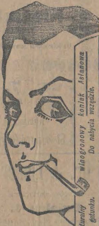
Absolutnie naturalny winogronowy koniak Astanowa Do nabycia wszędzie. Najlepiej pod względem gatunku.

w dwóch wydaniach: rannem i wieczornem, razem dziennie objętość 10 stron i więcej wielkiego formatu. „Przegląd Codzienny” będzie organem liberalnym, bezpartyjnym, stojącym na gruncie równouprawnienia żydów. „Przegląd Codzienny” szeroko uwzględni ruch umysłowy i artystyczny w kraju, Cesarstwie i zagranicą. „Przegląd Codzienny” dbać będzie o starannie opracowany dział przemysłowo-handlowy. „Przegląd Codzienny” będzie pierwszorzędnym wydawnictwem informacyjnym. Prospekt oraz № okazowy wysyła się na żądanie bezpłatnie. Prenumerata wynosi: — w Warszawie: rocznie 10 20, półrocznie 5 10, kwartał 2 55, miesięcznie 85 k. z odnośnikiem do domu. Na prowincji: rocznie r 12 —, półrocznie r. 6. — kwart. r. 3. — miesięcznie r. 1. —; zagranicą miesięcznie rb. 2. — Adres: Redakcji — ulica Frajezd 8. Administracji — ulica Nowolipie 7. Poczty: „Przegląd Codzienny” Warszawa. Skrzynka poczt. № 820. r267—3—1