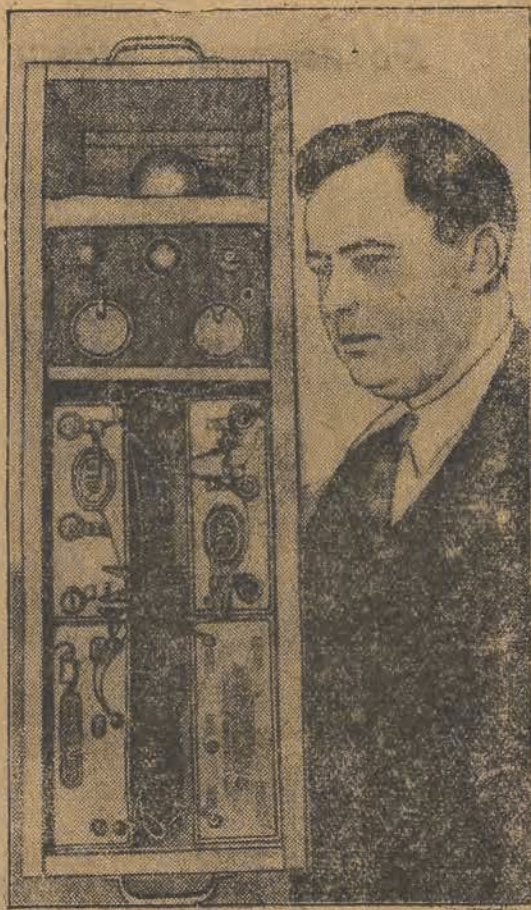
Amerikanin J. B. Smith skonstruował aparat, który dzwoni na alarm pod wpływem najbliższej choćby zmiany w natężeniu światła, więc, na przykład, gdy padnie nań cień, lub przesłoni dym z papierosa.

wreszcie wymienionemu wyżej detektywowi udało się odkryć jej tajemnicę. Stało się to w chwili, kiedy „hrabina” postanowiła przejść od grabieży do mordu.