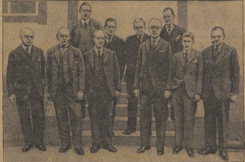
Ilustracja nasza przedstawia członków związku przemysłowców angielskich wydelegowanych przez tenże związek do Berlina, celem dalszego prowadzenia układów z przemysłowcami niemieckimi.