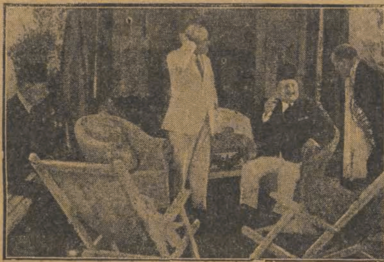
Król Egiptu Fuad, po odwiedzinach w Anglii, na wywczasach na Lido koło Wenecji.