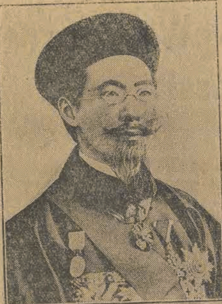
Lu Tscheng-Tschiang, b. prezydent ministrów w Chinach, wycofał się ze świata politycznego i, przyjąwszy chrzest, wstąpił do zakonu O. O. Benedyktynów w Brukseli.

Jak wiadomo zarząd Kasy Chorych postanowił odroczyć do stycznia sprawę podwyższenia poborów lekarzy kasowych. Lekarze natomiast zwrócili się ponownie do Kasy w sprawie podwyżki, wobec czego zarząd Kasy powtórnie rozpatrywać będzie tę sprawę. (b)