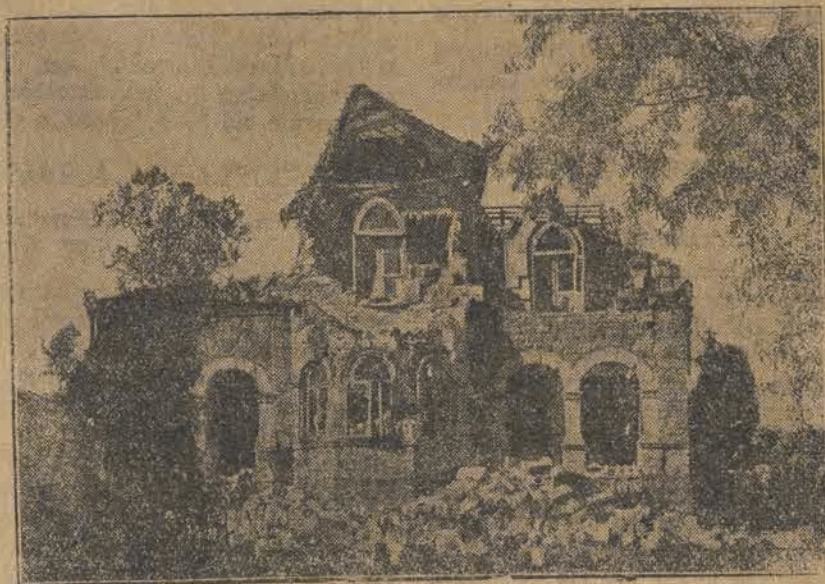
Na zdjęciu naszym widzimy jeden z domów w Bałakławie, miejscowości dotkniętej niedawno trzęsieniem ziemi.