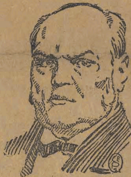
DR. ANTONI SZWEHLA, premier czeskosłowacki, wygłosił w tych dniach ciekawe exposé w sejmowej komisji budżetowej.

W dzisiejszych uroczystościach wzięły udział ogromne tłumy publiczności, które żywo manifestowały swe uczucia patriotyczne.