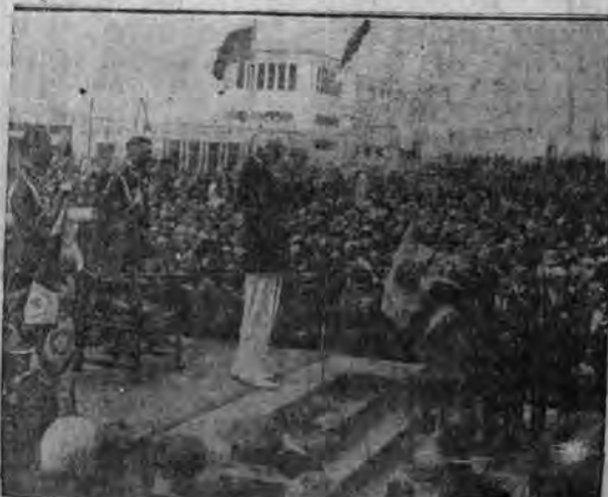
Pan Prezydent Rzeczypospolitej na podium ustawionem na Molo Rybackiem, po uroczystej Mszy św.