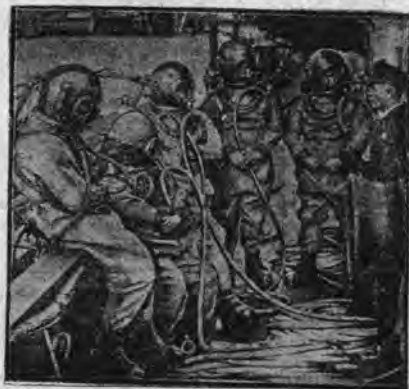
W Anglii odbywają się obecnie doroczne wielkie ćwiczenia nurków. Na zdjęciu powyższem widzimy oddział nurków, oczekujących momentu opuszczenia się w głębinę morską.