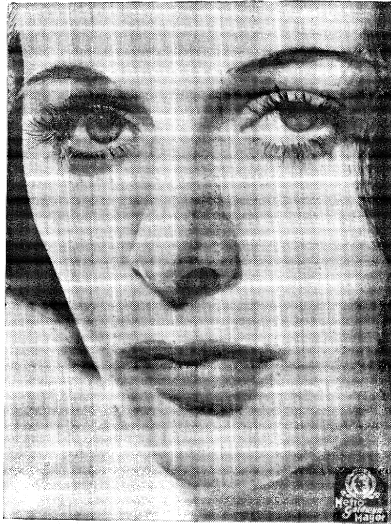
„Glamorous” (fascynująca) Hedy Lamarr.