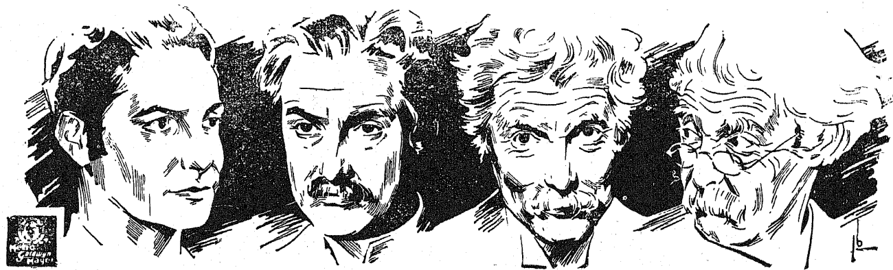
Robert Donat jako Mr. Chips w różnych fazach jego życia.