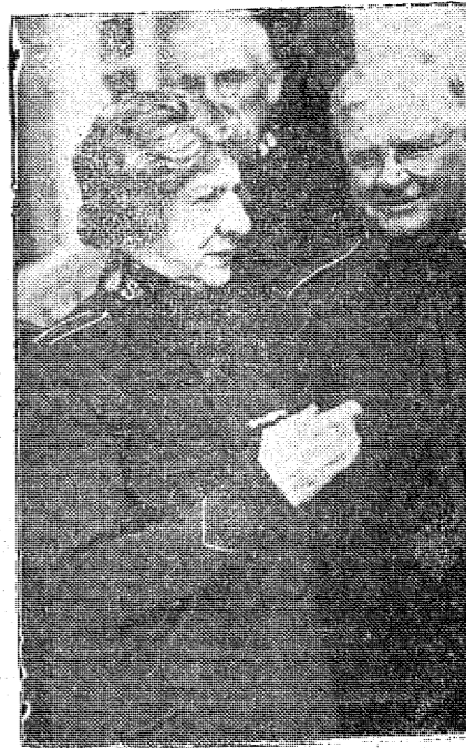
Dotychczasowy szef „Armii Zbawienia” Ewangelina Booth, używająca tytułu „generała” ma wkrótce złożyć piastowany urząd. Na zdjęciu widzimy ją w czasie konferencji, na której omawia sprawę związaną z wyborem jej następczyni.