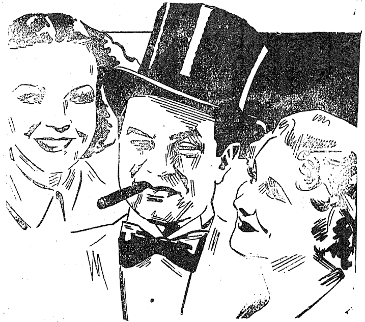
Znakomity aktor charakterystyczny Edward G. Robinson, w otoczeniu 2 uroczych girls z Hollywood.