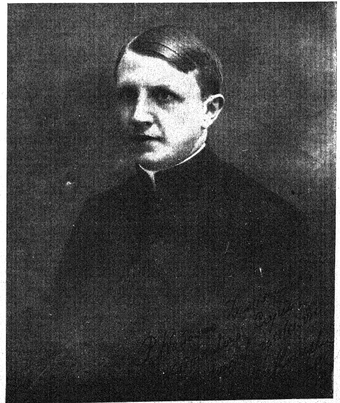
Ś. P. KS. IGNACY SKORUPKA.