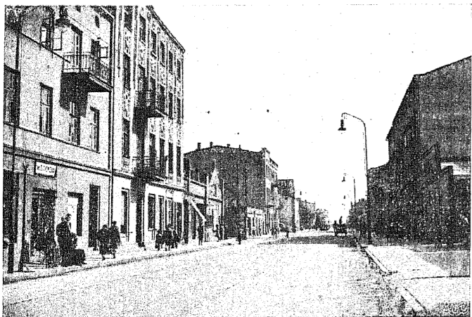
Łódź stale zmienia na korzyść swój wygląd i stan ulic. Na zdjęciu ulica Rzgowska, która otrzymała gładką nawierzchnię kostkową, nowe chodniki i nową instalację oświetleniową.