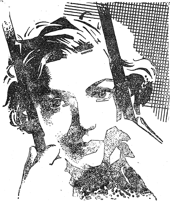
Corinne Luchaire, niezapomniana bohaterka filmów: „Wieżenie bez krat” i „Konflikt”