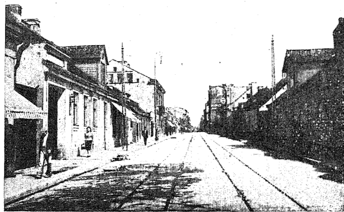
Ul. Główna, jedna z najruchliwszych arterij Łodzi, otrzymała gładką nawierzchnię z kostki bazaltowej. Normalny ruch uliczny, przerwany na okres przebudowy, wznowiony został przed kilku dniami.