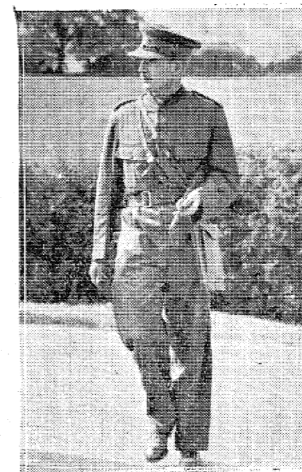
Sir Anthony Eden odbywa obecnie ćwiczenie wojskowe w randze majora. Widzimy go na zdjęciu w mundurze polowym.