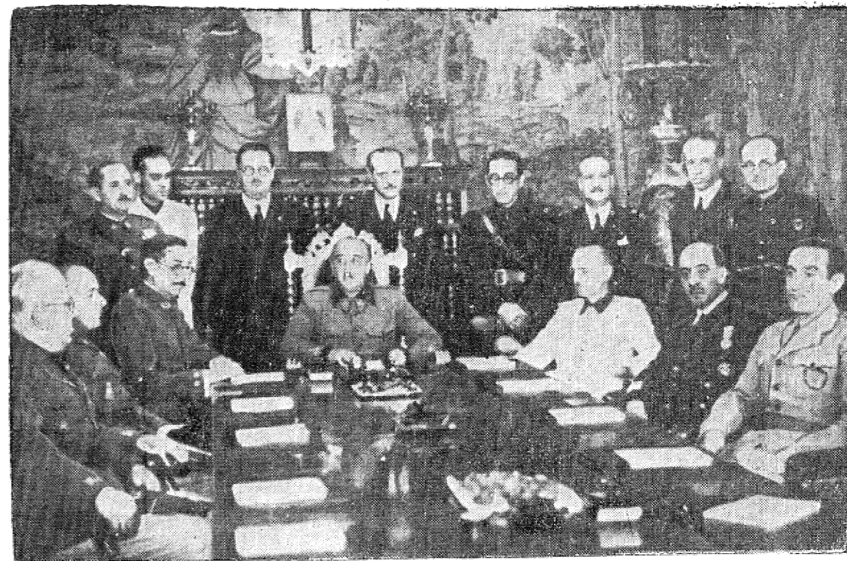
Nowy rząd Hiszpanii już funkcjonuje. Oto zdjęcie z jego pierwszego plenarnego posiedzenia. W środku siedzi gen. Franco; na lewo od niego przy stole— minister spraw zagranicznych Juan Beigbeder, minister wojny Valera i min. lotnictwa Yague. Z prawej strony — minister spraw wewnętrznych Serrano Suner i min. marynarki Merano Fernandez.