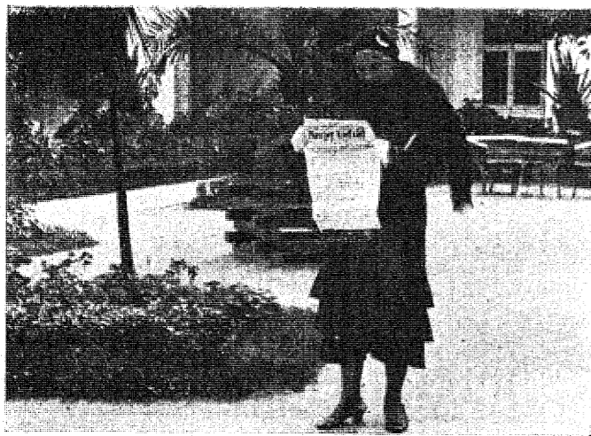
„Kurjer Łódzki“ cieszy się wielką poczytnością we wszystkich uzdrowiskach i miejscach kuracyjnych. Na zdjęciu— jedna z kuracjuszek w Truskawcu, czytająca „Kurjer Łódzki“.