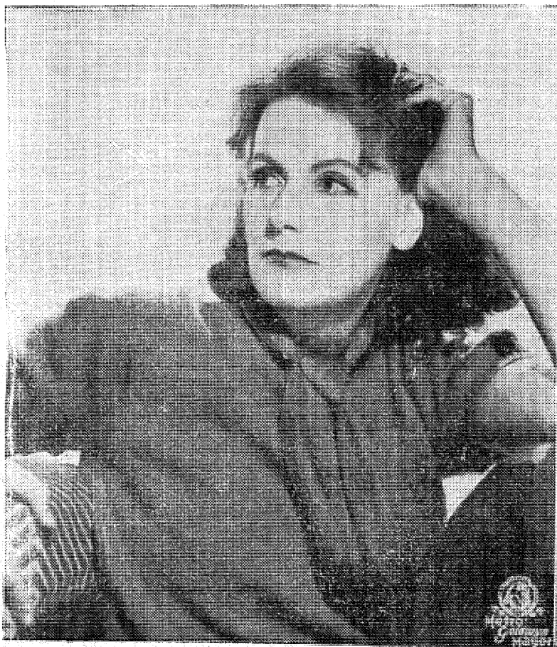
Zdjęcie Greta Garbo z filmu „Ninoczka”, który obecnie znajduje się w stadium realizacji. Fotografia powyższa przybyła samolotem Yankee Clipper z Ameryki. Jest to pierwsza fotografia, która drogą normalnej komunikacji lotniczej Ameryka—Europa dostała się na nasz kontynent.