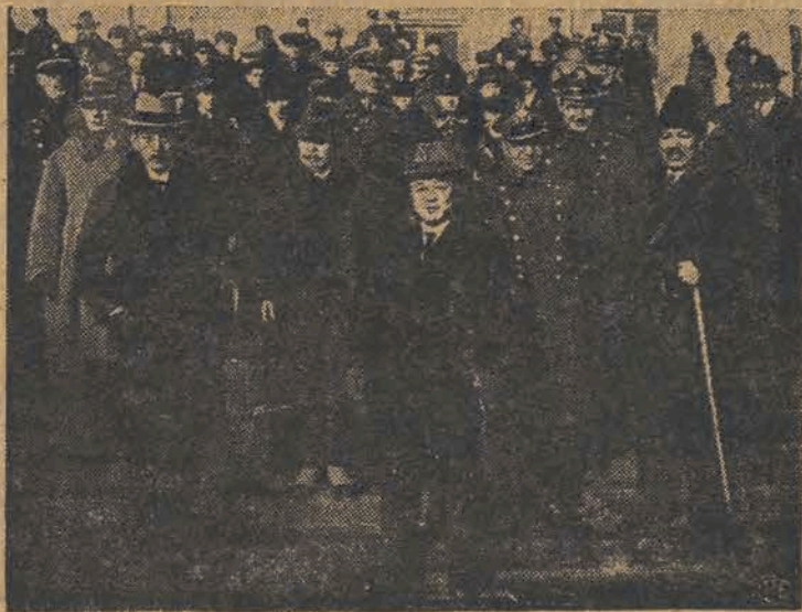
W dniu 28 ub. m. bawił w Łodzi syn cesarza koreańskiego, książę Ri. Na zdjęciu widzimy świętę księcia w towarzystwie przedstawicieli władz polskich na dworcu Łódź - Kaliska.