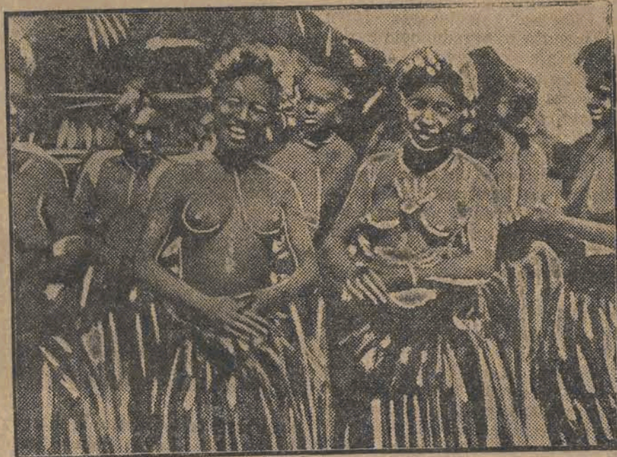
Czarne gracje ze środkowej Afryki, biorące udział w pierwszym egzotycznym filmie polskim.