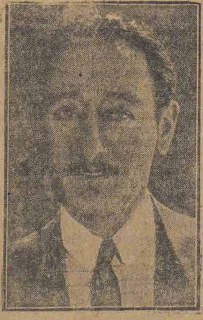
Adolf Menjou, najelegantszy artysta filmowy Stanów Zjednoczonych.

ry nie zdołali uzyskać jeszcze t. zw. legal state, pozwalającego im pozostać na stałe w Stanach. I w innych środowiskach kinowych, poza Mekką ekranu, jak nazywane jest Hollywood, rozpoczyna się ostrą walkę z cudzoziemcami.