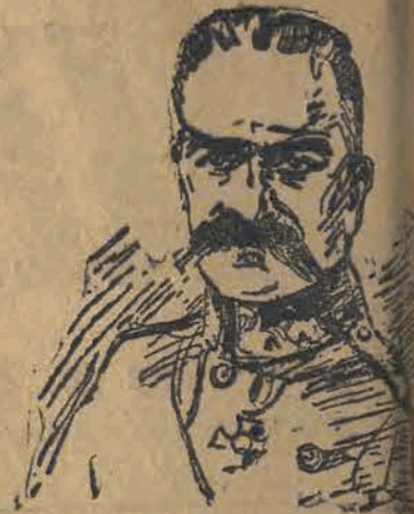
Dziś marszałek Piłsudski obchodzi rocznicę urodzin.