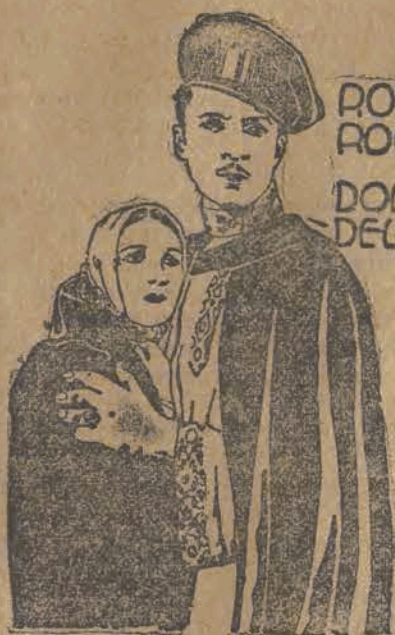
ROD LA ROCQUE & DOLORES DEL RIO