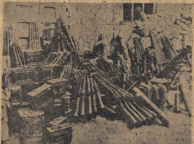
Po lewej stronie — nowoczesna broń amerykańską, подарowana Czang-Kai-Szekowi, całymi masami przechodzi w ręce chińskich wojsk ludowych. Po prawej stronie — rozbrojone „doborowe” dywizje Czang-Kai-Szeka idą długimi kolumnami przez ulice Charchina — do niewoli. Setki tysięcy tych żołnierzy wstąpiło natychmiast do szeregów chińskiej armii demokratycznej — by walczyć przeciw zniem-