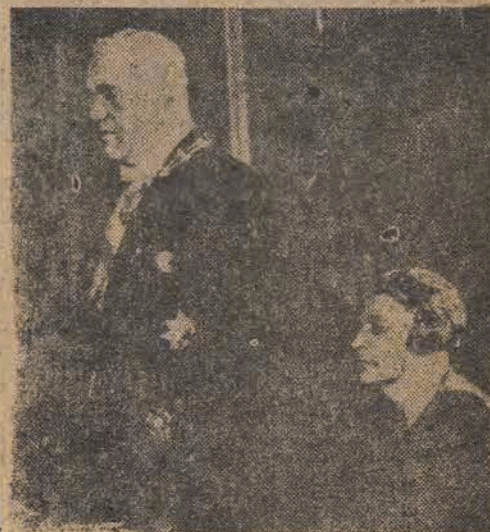
Premier Groza i minister spraw zagranicznych Rumunii Anna Pauker.

„Rumuńska demokracja ludowa — podkreślił premier Groza, — jest zdecydowana oddać wszystkie swoje siły sprawie utrwalenia pokoju dla dobra miłujących wolność i pokój narodów”.